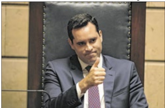
Cavaliere disse que tanques estão sendo retirados