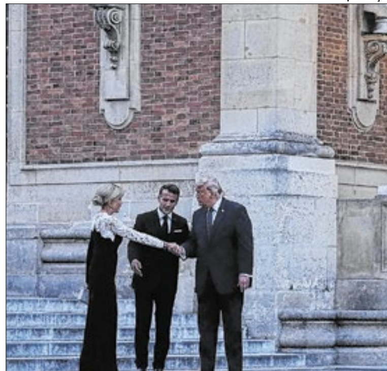
Donald Trump sendo recebido pelo presidente da França

Os líderes europeus disseram estar prontos para contribuir para a implementação do acordo, com uma coalizão liderada por Reino Unido e França, preparada para garantir a segurança da navegação no Estreito do Hormuz, assim que for reaberto, e buscar formas de diversificar as rotas de fornecimento de energia.