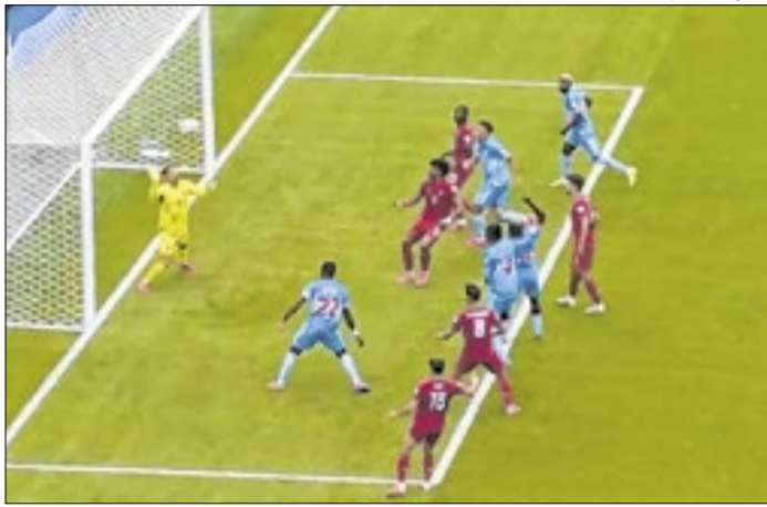
Gol de Wissa contra Portugal