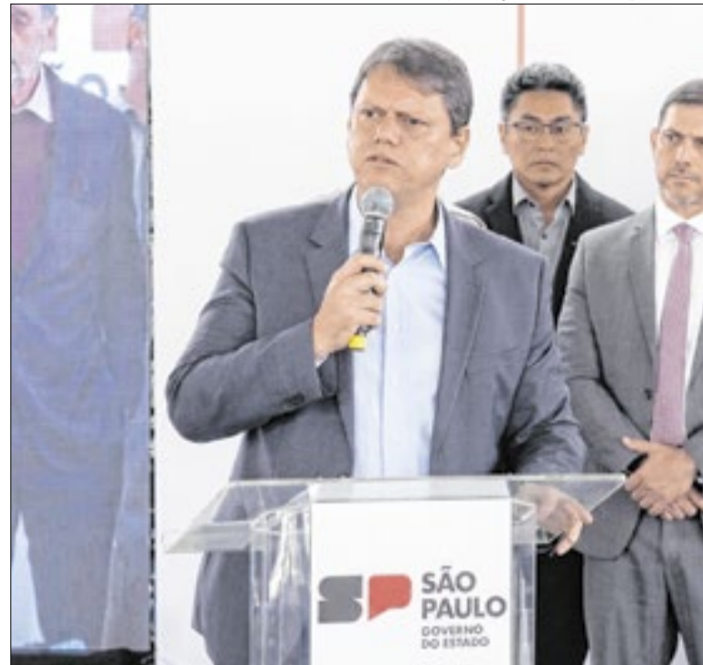
Governador participou de entrega de viaturas e armas

O deputado federal Delegado Palumbo (Pode-SP) apresentou o PL 3172/2026, que propõe aumentar a pena para homicídio culposo de 5 a 10 anos de reclusão. Segundo o parlamentar, a medida busca reforçar a proteção à vida e reduzir a sensação de impunidade em casos de morte causados por imprudência ou negligência.