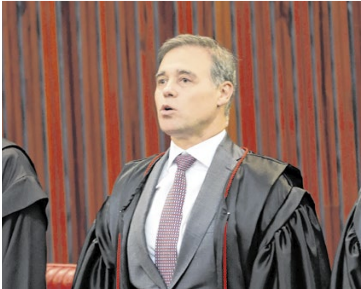
André Mendonça liberou acesso a nova leva de documentos

Em representação encaminhada ao STF, a Polícia Federal sustenta que a proximidade entre os dois ultrapassava a esfera pessoal e se transformou em uma relação baseada na troca de interesses. Os investigadores afirmam que havia uma atuação parlamentar alinhada a interesses do empresário acompanhada do recebimento de vantagens indevidas.