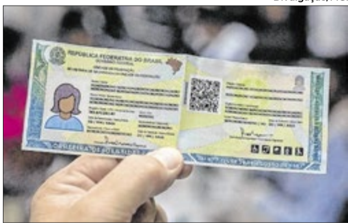
Carteira de Identidade Nacional (CIN) substitui o antigo RG