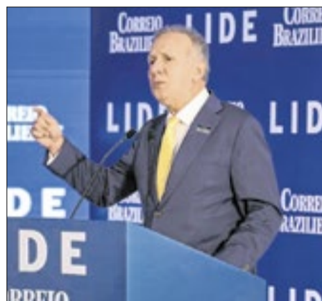
O deputado federal Aguinaldo Ribeiro relacionou avanço da tecnologia à necessidade de reformar a máquina pública diante dos desafios fiscais e demográficos do país