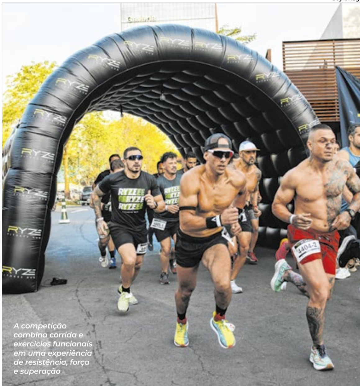
A competição combina corrida e exercícios funcionais em uma experiência de resistência, força e superação

A Ryze Run foi pensada para receber desde iniciantes até atletas de alta performance. A prova conta com categorias individuais e em