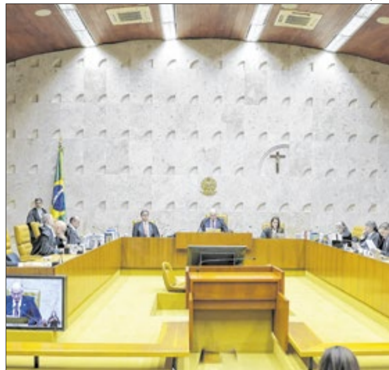
Ministros definiram como big techs serão responsabilizadas

Na avaliação de integrantes do PT, as confusões de Trump, que chegou a citar um inexistente “Bolsonaro Junior”, tiraram força das declarações. Também avaliaram como positiva a resposta de Lula, que disse para o colega dos EUA não se meter nas eleições brasileiras. Acham que isso reforça o discurso de soberania.