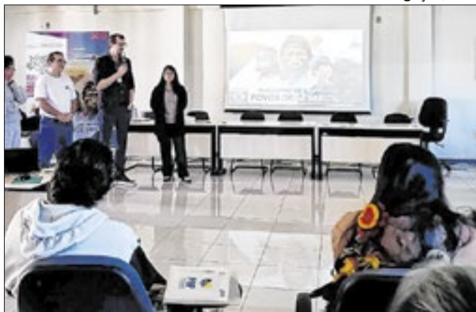
INSS busca formar divulgadores comunitários de direitos