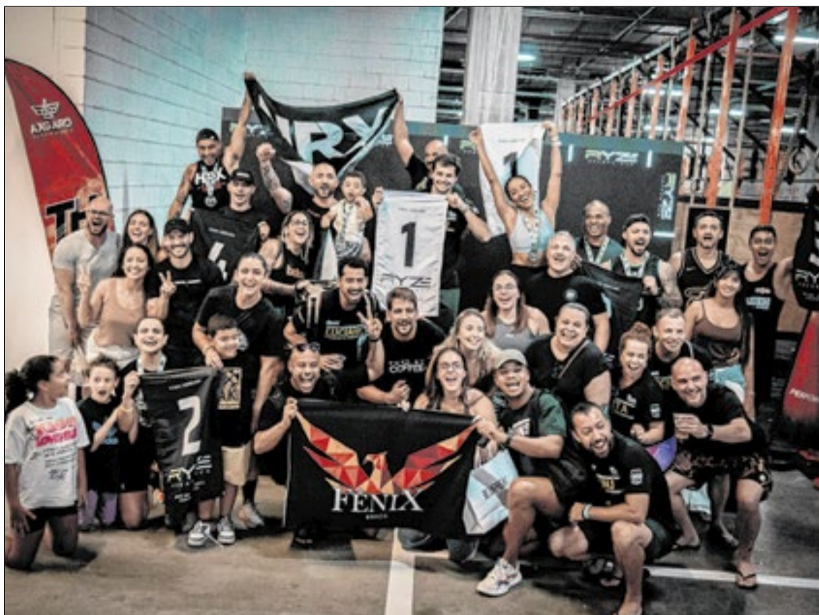
Mais do que competição, a Ryze Run celebra a união e a superação

Evento híbrido inspirado em competições internacionais será realizado neste sábado