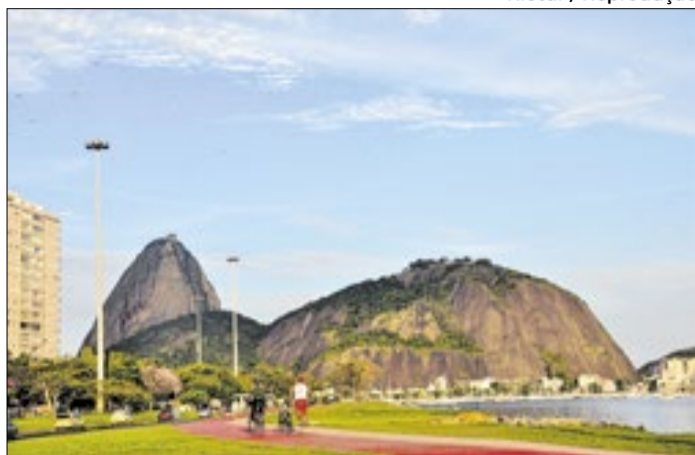
Aterro do Flamengo, onde fica a área do antigo posto