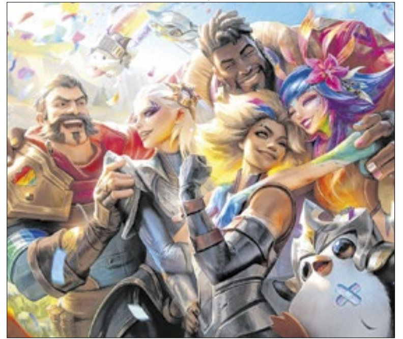
Mecanismo do jogo LOL foi tido como similar aos jogos de azar

Os R$ 15 milhões serão destinados ao Fundo dos Direitos da Criança e do Adolescente do DF (FDCA-DF). Após o trânsito em julgado, a empresa terá 90 dias para adotar diversas medidas, entre elas, a verificação de idade.