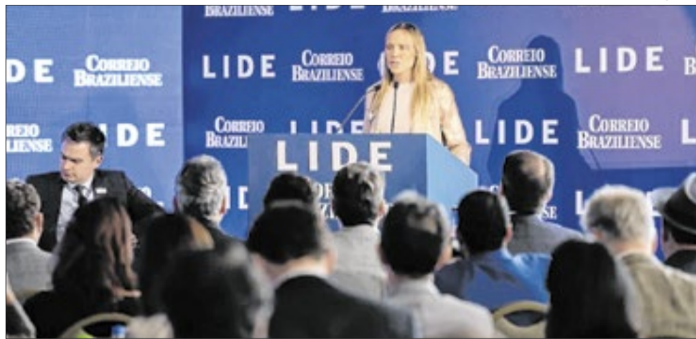
Governadora do Distrito Federal, Celina Leão durante a abertura do 7º Brasília Summit