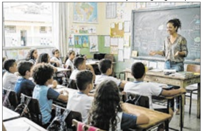
Remuneração é de R$ 5.565,00, podendo ser proporcional