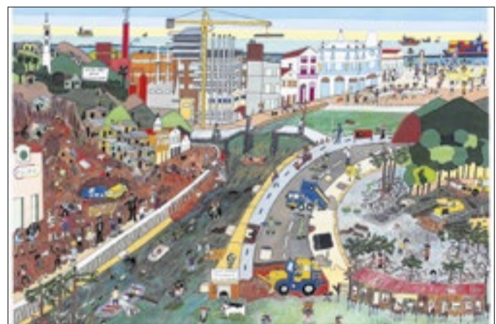
Obra "Será Progresso ou Regresso?", acrílica sobre papel

A pasta informou que o mandado se refere a servidor vinculado à gestão anterior e que aguarda mais detalhes para adotar providências administrativas. O nome da operação faz referência à compra de roupas de alto padrão pagas em espécie, um dos elementos que motivaram o aprofundamento das investigações, que seguem sob sigilo judicial.