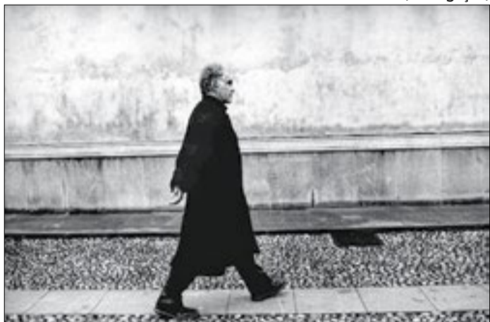
Carlo Ginzburg é um ícone da historiografia italiana