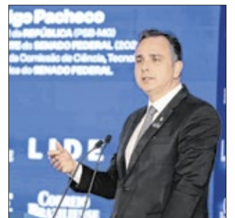
Durante sua participação no evento, o senador Rodrigo Pacheco criticou o uso do STF como alvo de discursos políticos em meio ao ambiente pré-eleitoral de 2026