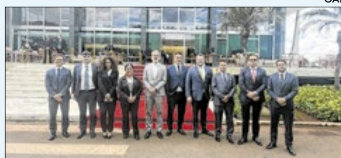
Grupo com 17 presidentes de comissões de precatórios estaduais da OAB, em agenda no STF

Após a entrega do ofício ao Supremo, representantes da OAB também se reuniram no Conselho Nacional de Justiça (CNJ) para expor preocupações sobre as novas regras. Entre os pontos levantados, destacaram decisões judiciais que vêm aplicando os limites previstos na emenda como um “teto intransponível”. Os advogados ainda apresentaram propostas para fixar critérios e prazos e dar mais transparência à gestão dos recursos.