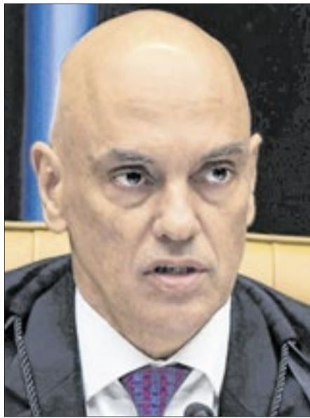
Eduardo Bolsonaro diz que denunciará atos do STF nos EUA

“Vale lembrar, a suspensão da Lei Magnitsky foi uma decisão política do presidente Trump. Todos os relatórios, todos os argumentos estão devidamente registrados, arquivados nas instituições norte-americanas. Se o Trump amanhã quiser retornar com a Lei Magnitsky, é só