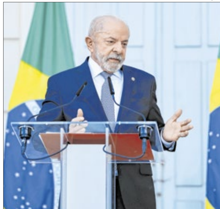
Lula e Trump trocaram farpas na reunião do G7, na França