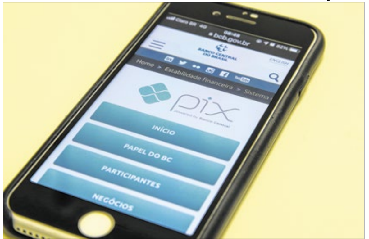
O relatório A Jornada dos Golpes foi divulgado nesta quarta-feira (17).