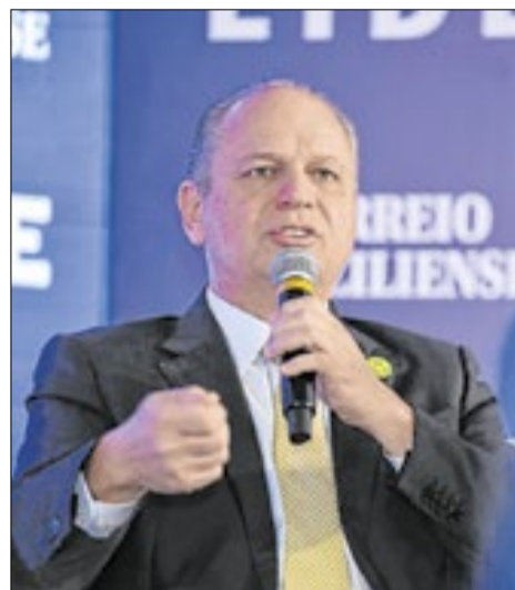
O deputado federal Ricardo Barros também esteve presente em mais uma edição do evento do Lide em Brasília