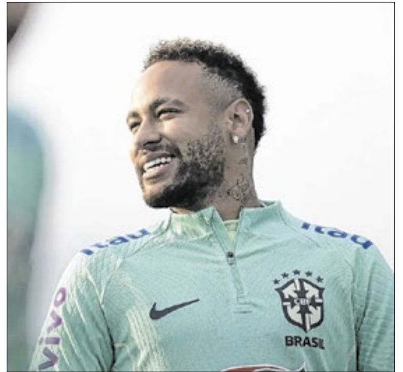
Neymar fez atividades com o grupo em Nova Jersey

A Copa rola, mas o mercado da bola não para. Astro do Manchester City, Bernardo Silva está de malas prontas para outra liga. O português jogará, nas duas próximas temporadas, na Espanha, defendendo o Real Madrid. Os valores da transação não foram divulgados. Bernado foi um pedido do novo técnico merengue, José Mourinho.