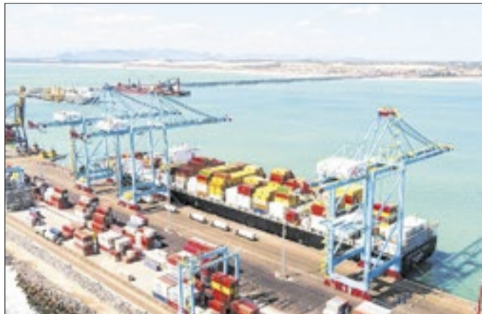
Movimentação portuária reflete o avanço das exportações