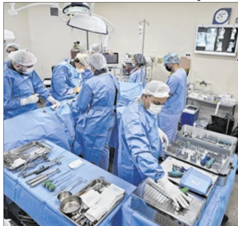
Programa tem auxiliado na redução das filas de espera

A Cathedral afirma que o trabalho integra um pacote de ações iniciado no ano passado, que inclui modernização de escadas rolantes e elevadores, reforço da zeladoria, criação de sala multissensorial e sala de amamentação, além de melhorias na segurança e no atendimento aos usuários. Pesquisa realizada em 2026 apontou avaliação positiva de 84% entre os frequentadores do terminal.