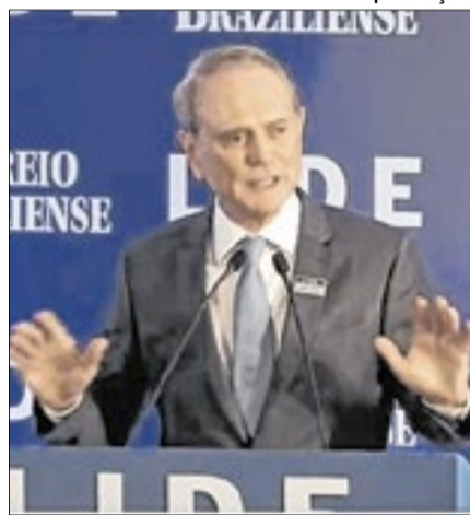
Presidente do Lide Brasília, o empresário Paulo Octavio, no discurso de abertura, enalteceu o trabalho de Celina Leão para salvar o Banco de Brasília da crise provocada pelo Master

Com a presença da governadora do DF, Celina Leão, autoridades, políticos, especialistas e empresários colocaram em pauta as análises e perspectivas para a economia do país em mais uma edição do Brasília Summit, do Lide. O evento, realizado no Hotel Brasília Palace, na manhã desta quarta-feira, 17 de junho, teve como objetivo ampliar o debate sobre o desenvolvimento nacional, com foco na inteligência artificial.