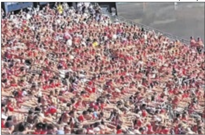
Torcedores da Noruega imitam barco viking