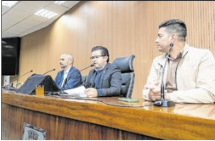
Projeto prevê 20% da frota do transporte público coletivo