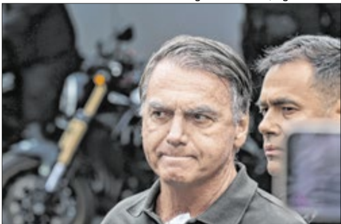
Ex-presidente com sargento que transportava sua arma