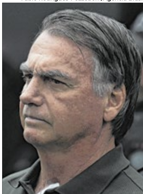
Bolsonaro não recebeu advogado por “estado de sonolência”

O texto integra prestação de informações encaminhada pela corporação ao ministro Alexandre de Moraes sobre a rotina do ex-presidente entre os dias 4 e 10 de junho de 2026.