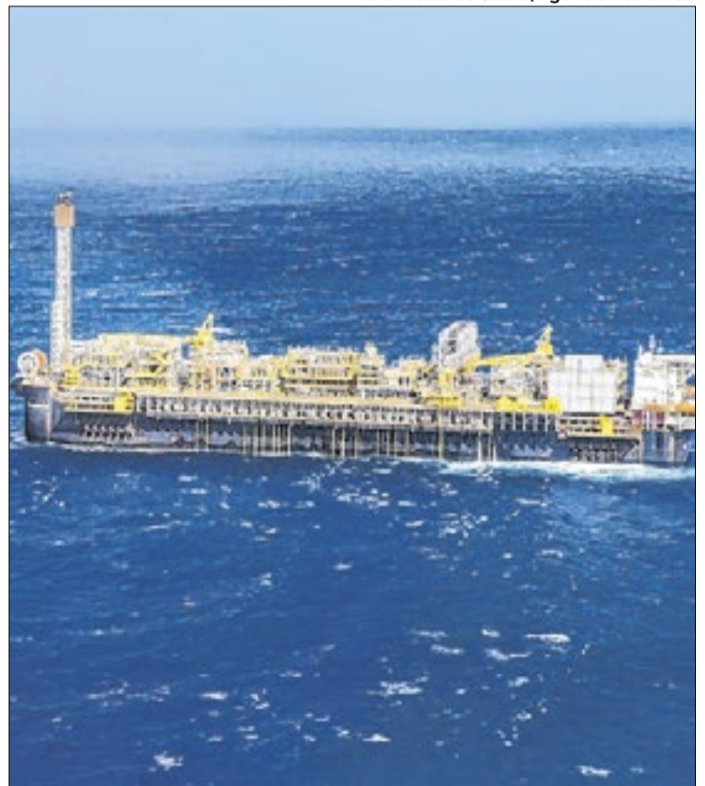
Plataforma de Petróleo da Petrobras no litoral brasileiro

O Correio da Manhã entrou em contato com a Petrobras e aguarda posicionamento.