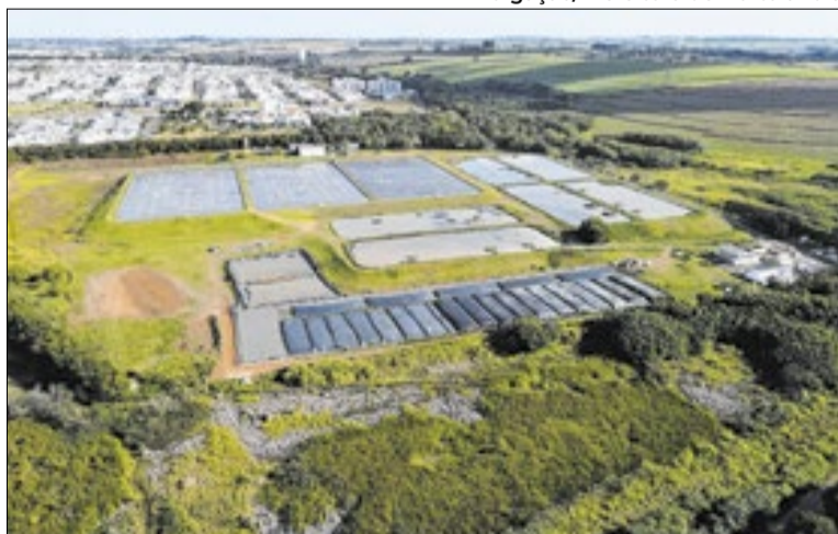
Reformulação atende exigência do Marco Legal do setor

A reformulação ocorrerá de maneira ampla, buscando alinhar o projeto à atual realidade local. Conforme dados levantados pelo Departamento de Licenciamento Ambiental e Gestão de Resíduos, o município apresenta hoje 100% de cobertura na coleta de resíduos, além