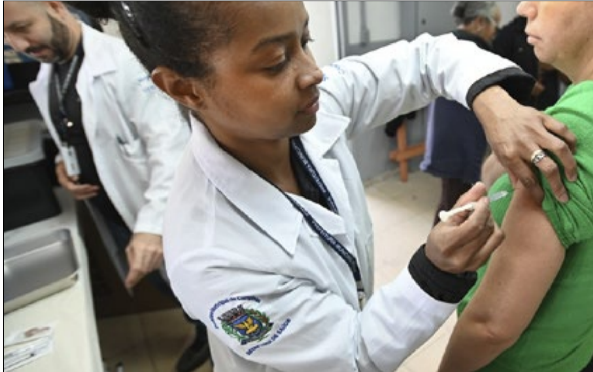
Vacina contra gripe está liberada a pessoas com mais de 6 meses de idade desde 1º de junho

As vítimas são: sexo masculino, 47 anos, com comorbidade, sem vacina, data da morte: 29/05/2026; sexo masculino, 73 anos, com comorbidade, sem vacina, data da morte: 02/06/2026; sexo feminino, 69 anos, com comorbidade, sem vacina; data da morte: 02/06/2026.