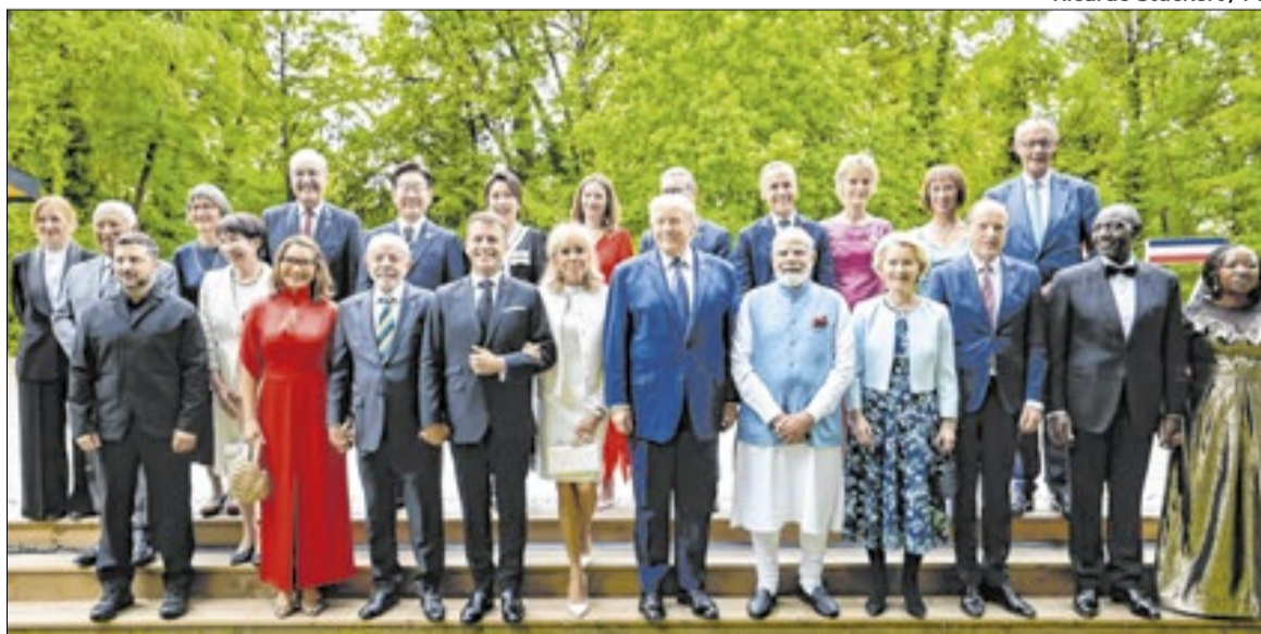
Ricardo Stuckert / PR

“Ficamos aprisionados em dogmas que defendem desregulamentação de mercados, Estado mínimo e austeridade fiscal como fins em si mesmos. O neoliberalismo agravou a desigualdade econômica e a crise política que hoje assolam as de-