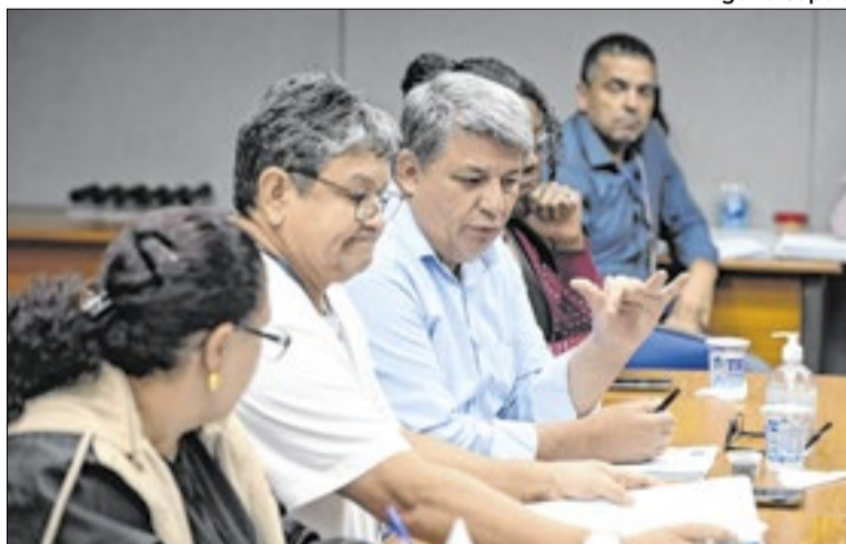
Propostas têm como base estudo técnico realizado pela Fipe

Segundo a Secretaria de Gestão e Desenvolvimento de Pessoas, o objetivo é modernizar regras de remuneração e progressão funcional. Entre os principais pontos estão a mudança no fator divisor, a criação de um plano de carreira para agentes comunitários de saúde e a evolução horizontal de alinhamento, considerada uma das novidades mais relevantes do texto.