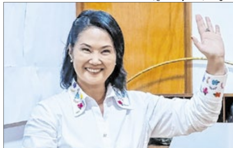
Família Fujimori pode voltar ao poder no país

Durante a visita, o chefe das Nações Unidas deve se reunir com o primeiro-ministro do Haiti, Alix Didier Fils-Aimé, para restaurar a estabilidade e a paz no país. Desde o início de janeiro, a violência de gangues na nação caribenha resultou em, pelo menos, 2,3 mil mortes, 1,1 mil feridos e 99 sequestros.