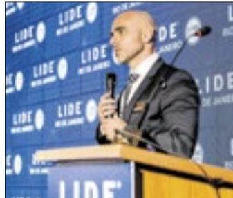
O evento contou com apresentação técnica do secretário de Estado de Fazenda, Guilherme Mercês, que detalhou o panorama econômico, as perspectivas fiscais e os projetos estratégicos em andamento