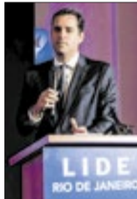
O prefeito do Rio, Eduardo Cavaliere, falou sobre a importância da estabilidade das instituições fluminenses