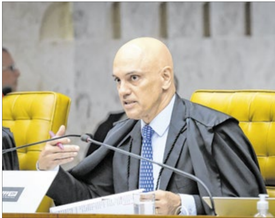
Moraes negou pedido de diligências feito por advogados de Flávio

representação da Polícia Federal acolhida pela Procuradoria-Geral da República (PGR). Segundo os autos, a apuração envolve suposta prática do crime de calúnia contra o presidente da República, com agravantes previstos no Código Penal.