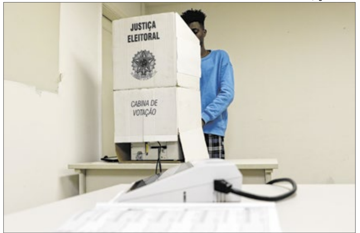
Pesquisa Vox Brasil projeta cenário eleitoral de 2026 em Campinas

Período de coleta: 10 e 11 de junho de 2026; Data de divulgação: 15 de junho de 2026; Amostra: 1.100 eleitores de Campinas (com 16 anos ou mais), abordados de forma presencial em domicílios; Margem de erro: 3 pontos percentuais para mais ou para menos; Nível de confiança: 95%.