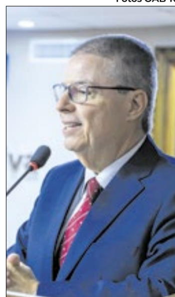
Ministro do Tribunal de Contas da União, Antonio Anastasia