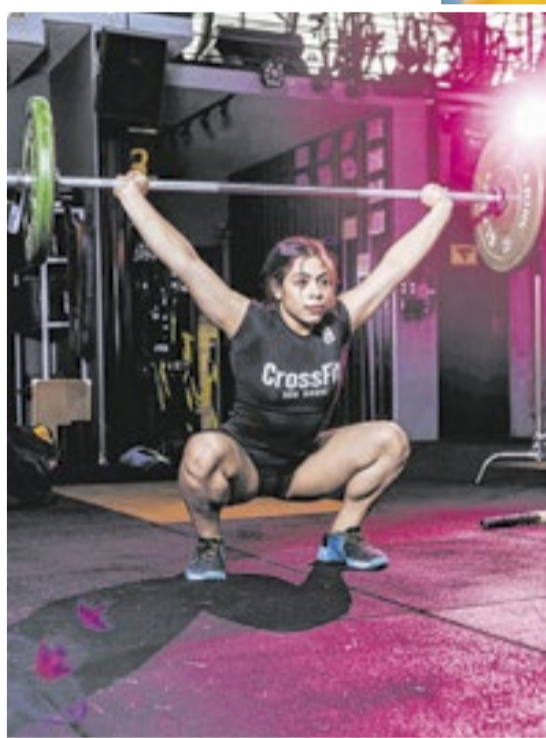
A adolescente divide sua rotina de estudos com treinos intensos em São Roque, no interior de São Paulo

Jovem atleta paulista supera desafios, conquista vaga entre as melhores do planeta