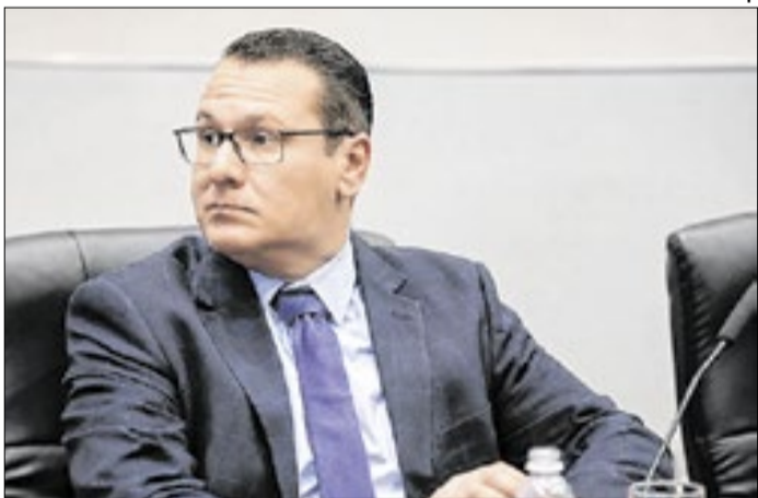
Palestra do deputado será na quinta-feira (18)