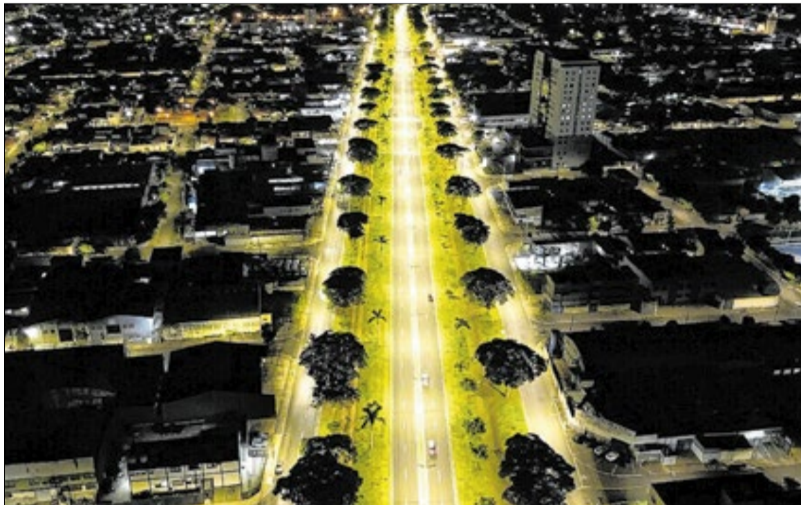
Recebimento dos envelopes com propostas comerciais está agendado para o dia 30 de junho

Além das intervenções físicas na rede, o acordo prevê a operação e o suporte técnico de um sistema de telegestão. Essa tecnologia viabiliza a supervisão a distância dos pontos de luz, conferindo uma capacidade expandida de controle sobre toda a malha municipal de iluminação.