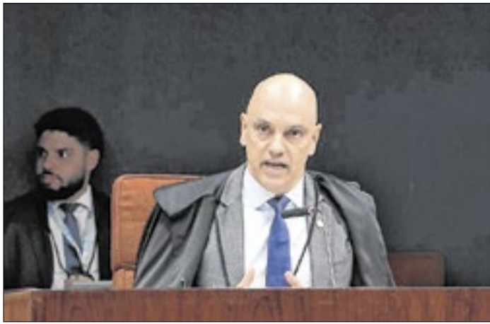
Ministro do STF vai decidir sobre prisão domiciliar