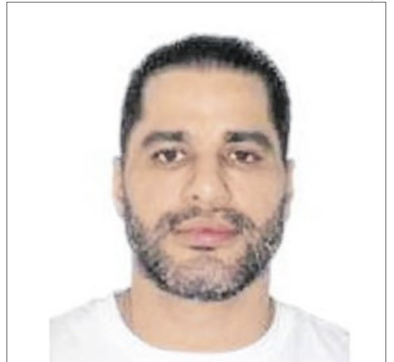
Morto na prisão, Sicário volta a ameaçar os Vorcaro

O favoritismo do único candidato de esquerda citado na pesquisa contrasta com outro dado da pesquisa: entre os entrevistados, 34,8% se disseram de direita ou de centro-direita; contra 25,1% dos que se colocaram do lado oposto. A informação reforça que a definição ideológica é importante, mas não tão decisiva.