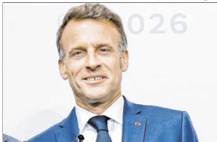
Presidente da França, Emmanuel Macron