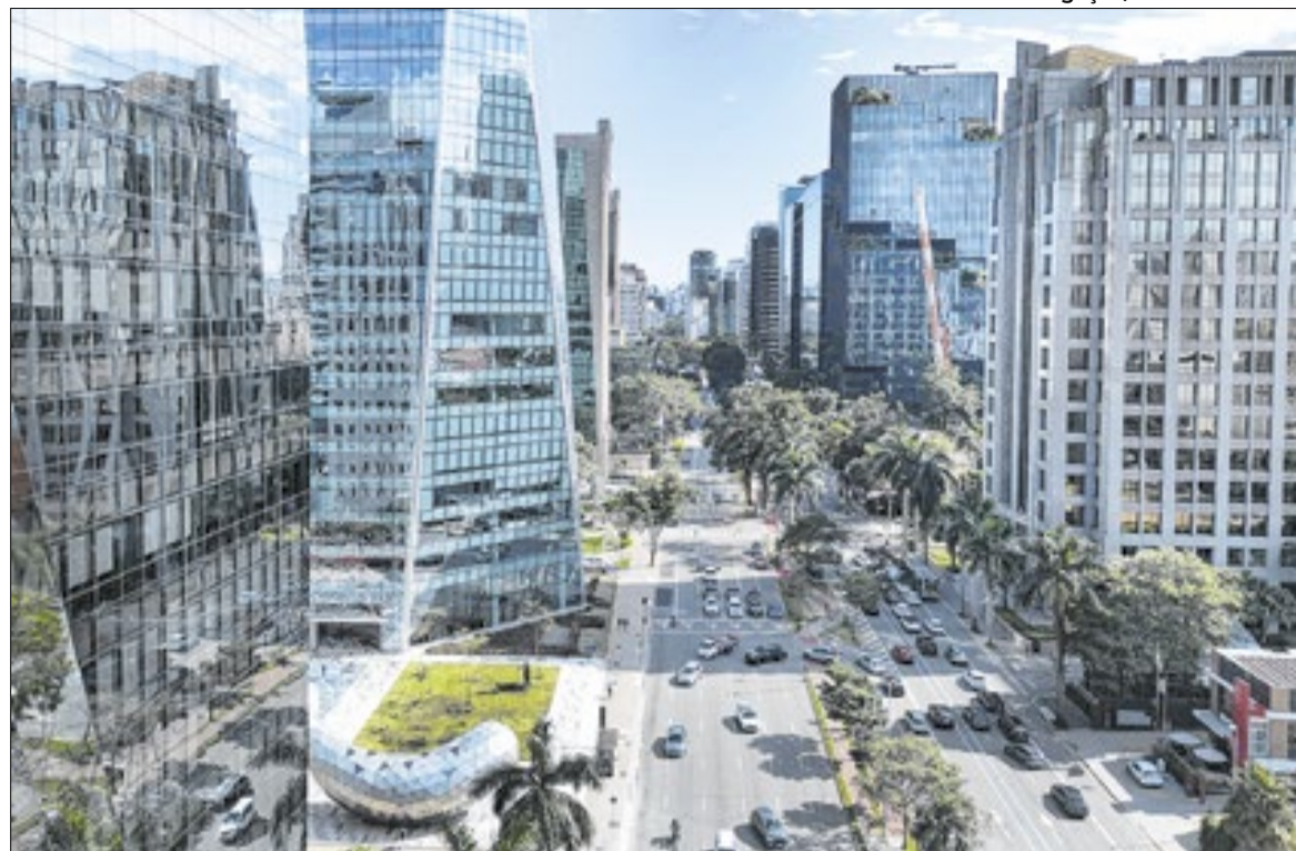
Levantamento considera indicadores como atividade econômica, startups e infraestrutura

O desempenho da capital paulista reflete a relevância econômica do município no cenário nacional. Maior centro financeiro do país, São Paulo abriga sedes de empresas na-