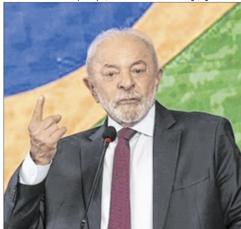
Lula disse que é melhor devolver celular roubado nos Correios

A Assembleia Legislativa de São Paulo concedeu, postumamente, o Colar de Honra ao Mérito Legislativo a Sócrates, maior honraria da Casa. A cerimônia reuniu familiares e contou com a presença de seu irmão, Raí. A homenagem destacou sua trajetória no futebol, na Democracia Corinthians e nas Diretas Já.