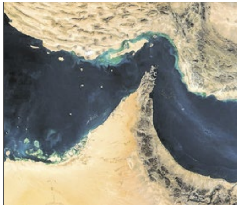
Irã fala em cobrança de taxas; Trump afirma que não terá

Fora da linha de sucessão oficial e sem emprego formal, ele negou veementemente ter abusado de mulheres inconscientes. Seus advogados pleiteavam só 18 meses de pena. Hoje, o réu não compareceu presencialmente ao tribunal, optando por acompanhar o desfecho de seu julgamento via internet.