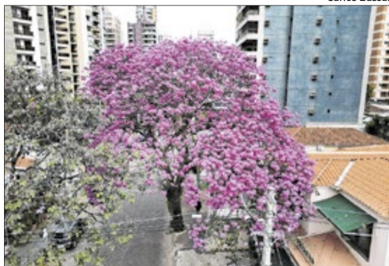
Ipês, roxos e rosas começaram a florescer e colorir a cidade

Entre os locais em que já é possível apreciar a beleza das árvores estão a Rua Coronel Quirino, no Cambuí, e os arredores do cemitério de Sousas. Nessas áreas, os ipês ajudam a compor