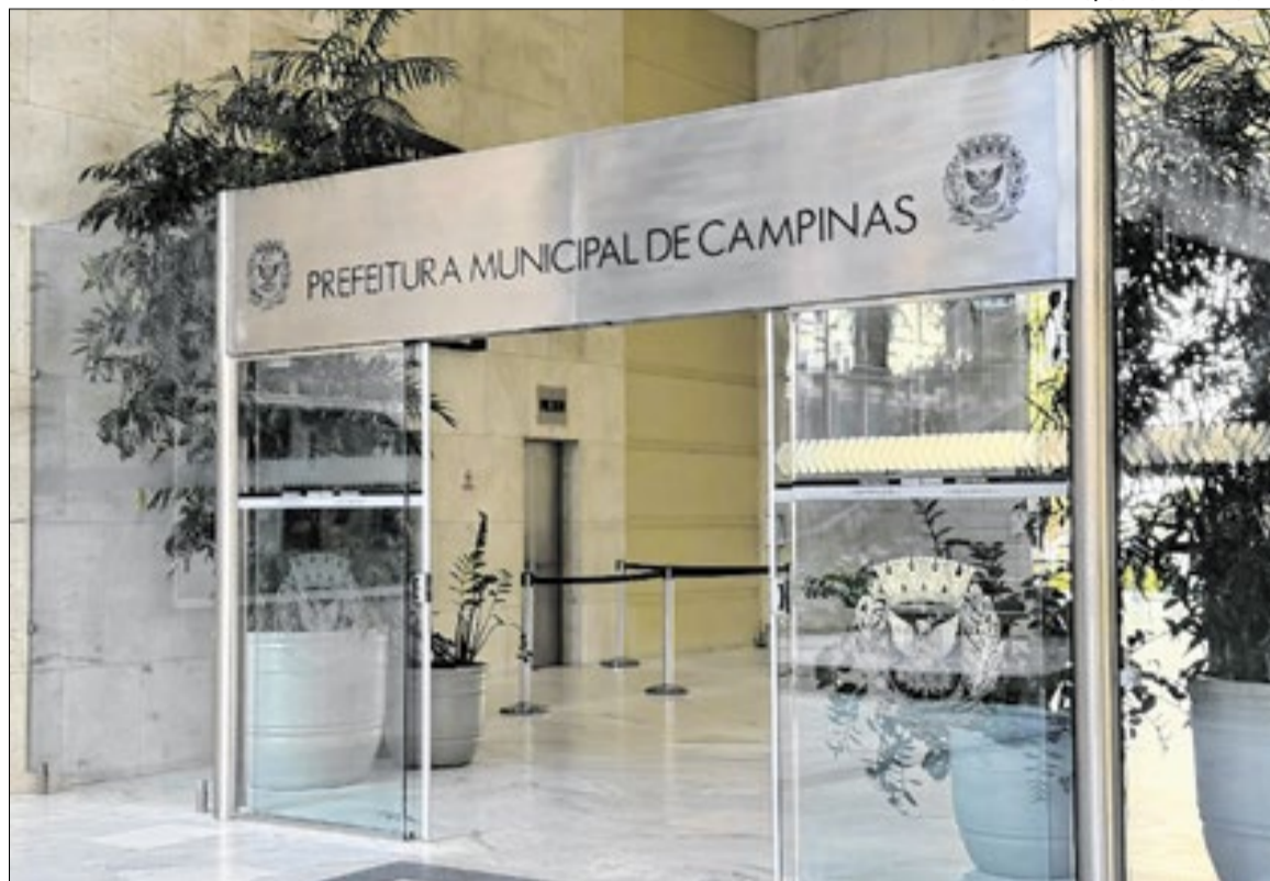
Prefeitura de Campinas

A flexibilização do cronograma foi concedida por Fachin no âmbito da Suspensão de Liminar (SL) 1913, movida pelo município. Apesar de ter obtido o prazo adicional para se adequar às exigências constitucionais, a Prefeitura de Campinas informou oficialmente que não pretende apenas realizar a transição, mas sim tentar reverter o entendimento judicial. Em nota, o Executivo municipal declarou que irá interpor um recurso extraordinário junto ao próprio STF com o objetivo de defender a aplicabilidade e a constitucionalidade das leis municipais que criaram as vagas questionadas.