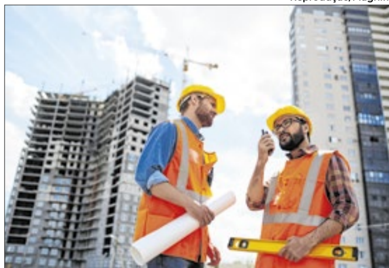
Para aprovação, projetos precisam seguir regras urbanísticas

A Prefeitura afirma que a integração dos serviços em uma única plataforma deve facilitar a rotina