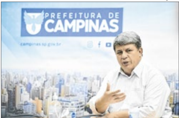
Wandão teria feito promessa aos GMs há 3 anos