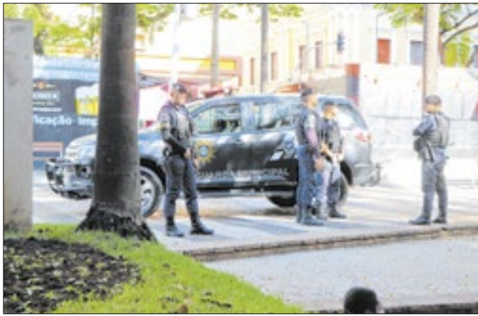
Guardas Municipais durante "Operação Centro"