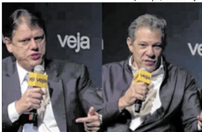
Tarcísio e Haddad participaram de evento da revista Veja