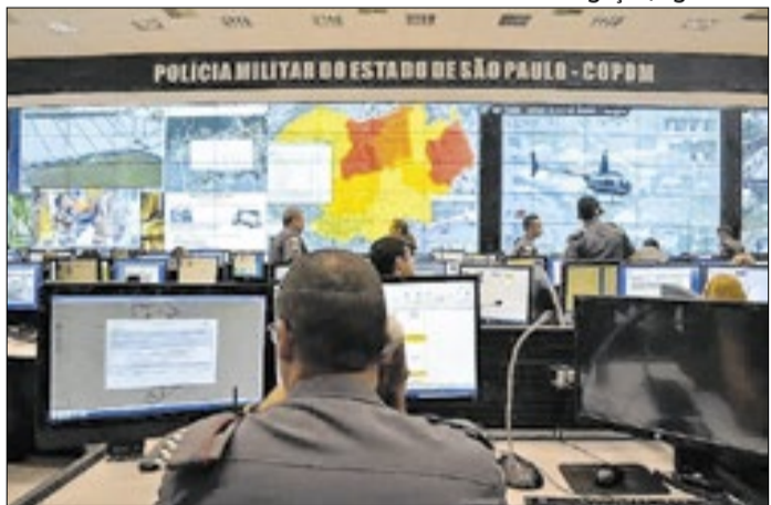
Investigação ainda depende de assinaturas na Alesp