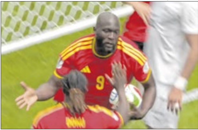
Lukaku participou da jogada do gol da Bélgica