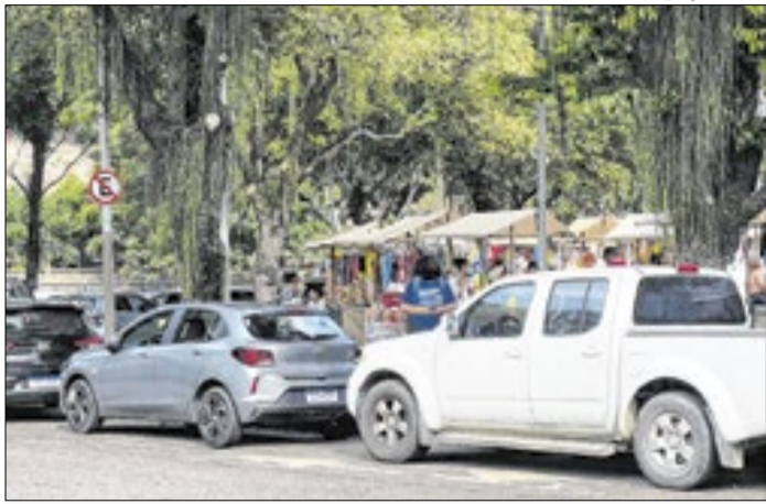
GM-Rio conduz quatro flanelinhas para delegacia no Catete