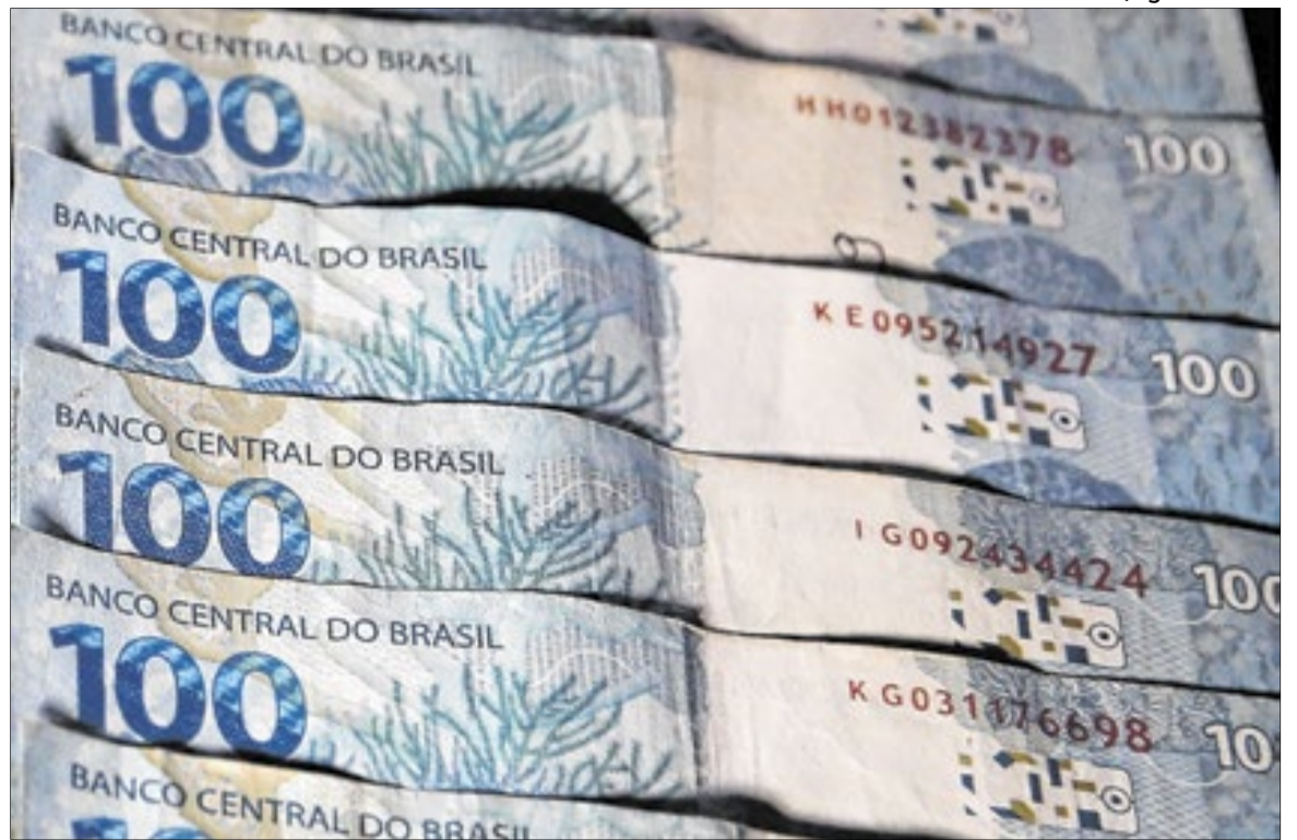
Desde 2016, a União pagou R$ 88,73 bilhões em dívidas garantidas

Após o Congresso derrubar os vetos ao Propag, no fim de novembro, 22 estados aderiram ao programa. Das unidades da Federação, só o Distrito Federal, o Mato Grosso, Pará, Paraná e Santa Catarina não ingressaram na renegociação especial.