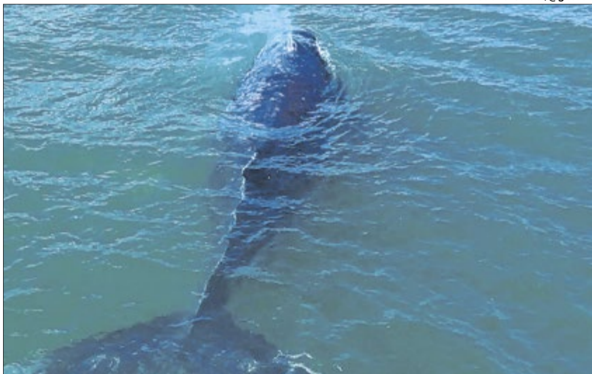
Em Saquarema, as baleias tendem a passar mais afastadas da praia

A partir deste mês de junho, os olhos de moradores e turistas de Saquarema estarão voltados para o mar. Além da tradicional temporada de surfe, começa oficialmente o período de migração das baleias-jubarte e franca pela costa do município. No período, tanto a população local quanto os visitantes devem seguir regras de distanciamento para garantir uma boa convivência e a preservação das espécies. Até o mês de setembro, esses gigantes maríneos cruzam o litoral saquaremense em uma jornada que vai das águas gélidas das Ilhas Geórgias do Sul, na Antártida, até o Banco de Abrolhos, na Bahia, em busca de um ambiente mais quente e calmo para se reproduzirem, darem à luz e amamentarem seus filhotes.