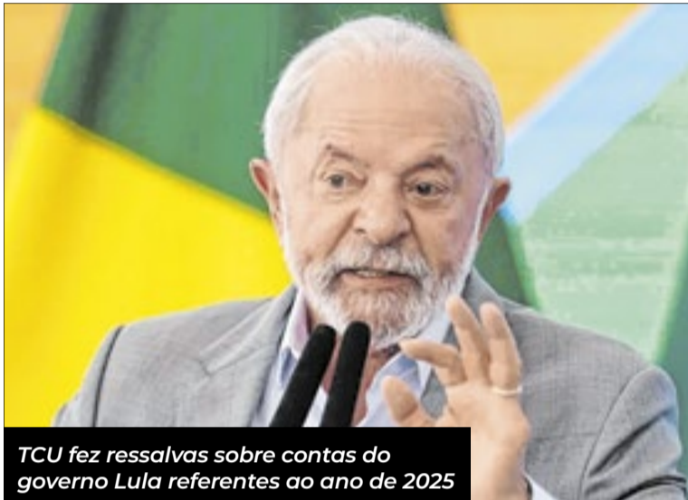
TCU fez ressalvas sobre contas do governo Lula referentes ao ano de 2025

“Ausência de mecanismos de transparência e de rastreabilidade para a identificação e a execução de emendas parlamentares consignadas como programa-