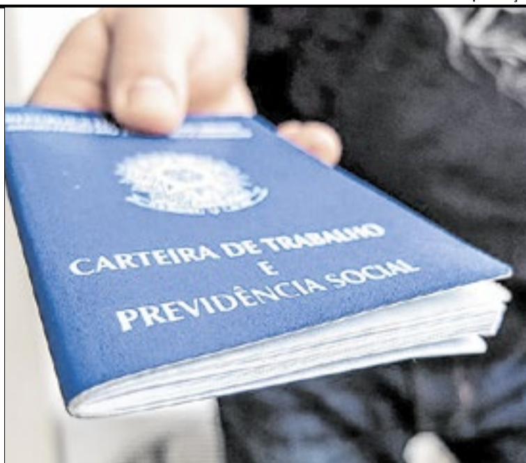
Resende registrou crescimento nos principais indicadores

Por intermédio dos serviços oferecidos através do Sine Resende, trabalhadores têm acesso a serviços como cadastro de currículos, encaminhamento para vagas de emprego, orientação profissional e apoio durante os processos seletivos. Ao mesmo tempo, as empresas contam com suporte especializado para recrutamento e seleção de