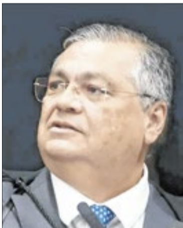
Flávio Dino faz alerta sobre PCC

“O PCC aparece na investigação como beneficiário