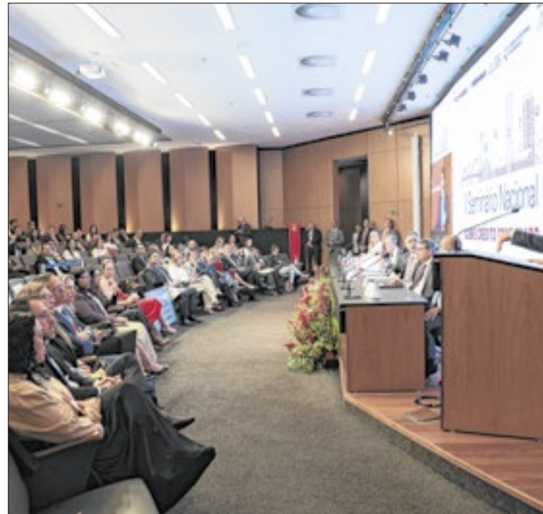
A informação está no boletim Focus desta segunda-feira (16)

Em maio, a corte suspendeu a contratação das obras do trecho até a apresentação de estudos que indiquem a viabilidade do empreendimento. O pedaço da malha ferroviária foi retomado como obra pública depois de ter sido devolvido pela Transnordestina Logística S.A. (TLSA), em 2022.