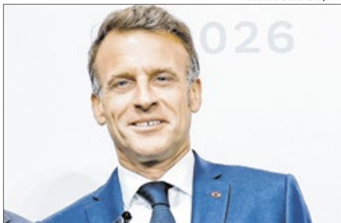
Presidente da França, Emmanuel Macron