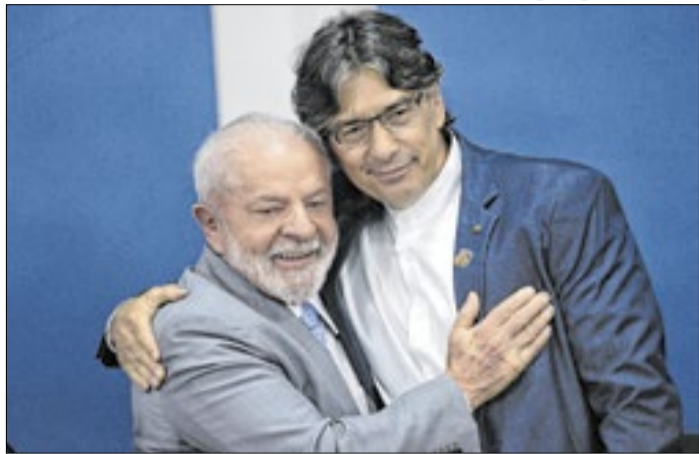
Lula e o presidente do IBGE, Marcio Pochmann