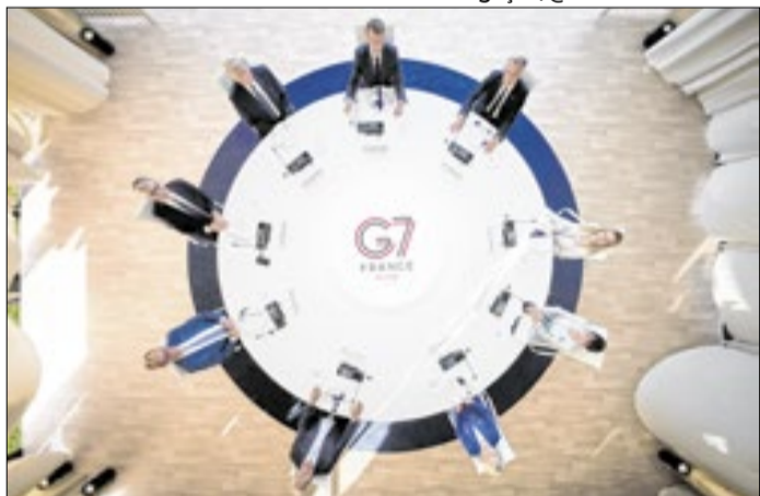
Líderes reunidos na Cúpula do G7