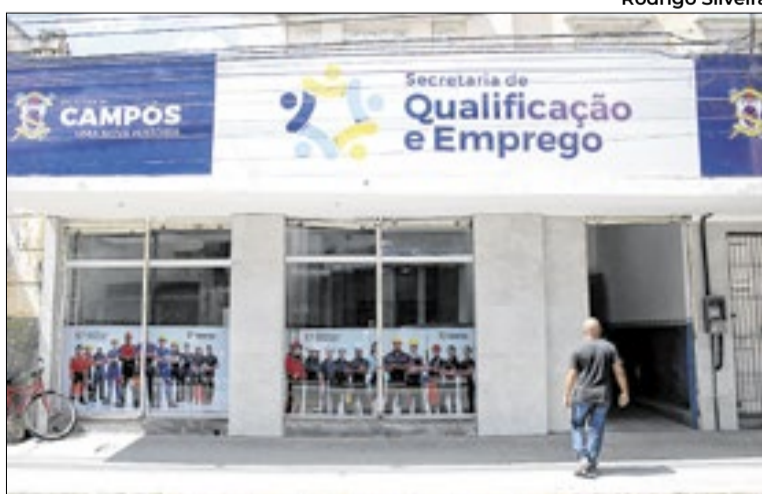
Vagas podem ser vistas no Espaço da Oportunidade

Entre as vagas disponíveis, destaque para as funções de auxiliar de serviços gerais (27); vendedor/vendedora (18); agente de saneamento (10); operador de empilhadeira (10); auxiliar de técnico (6); atendente de padaria (6) e subgerente farmacêutico (5), além de muitos outros postos em áreas como comércio, serviços, logística e alimentação, entre outras funções. Para PCD, são 39 vagas em áreas como mo-