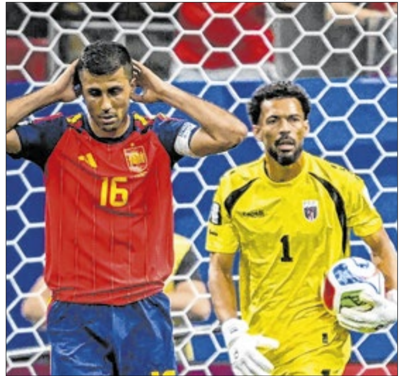
Vozinha deixou os jogadores espanhóis incrédulos

Autor do gol de Marrocos contra o Brasil, Ismael Saibari estaria na mira do Bayern de Munique, segundo o The Athletic, plataforma de jornalismo esportivo do The New York Times. Ele jogou a última temporada pelo PSV, da Holanda, que foi campeão nacional pela 27ª vez. Fez 15 gols e deu 8 assistências em 27 jogos.