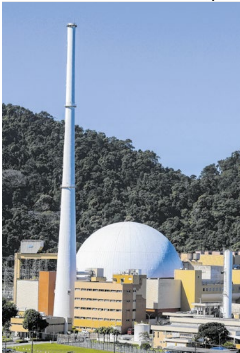
Eletronuclear opera usinas nucleares do país Angra 1 e Angra 2, na região da Costa Verde, no Rio

-Constatou-se, também, que o orçamento apresenta defi-