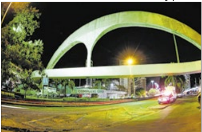
RioLuz iluminou diversos cartões-postais da cidade