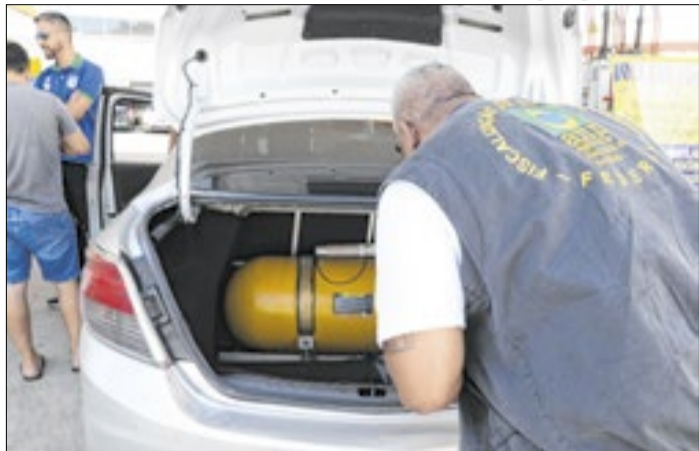
Reguladora projeta aumentar fiscalização em 40%