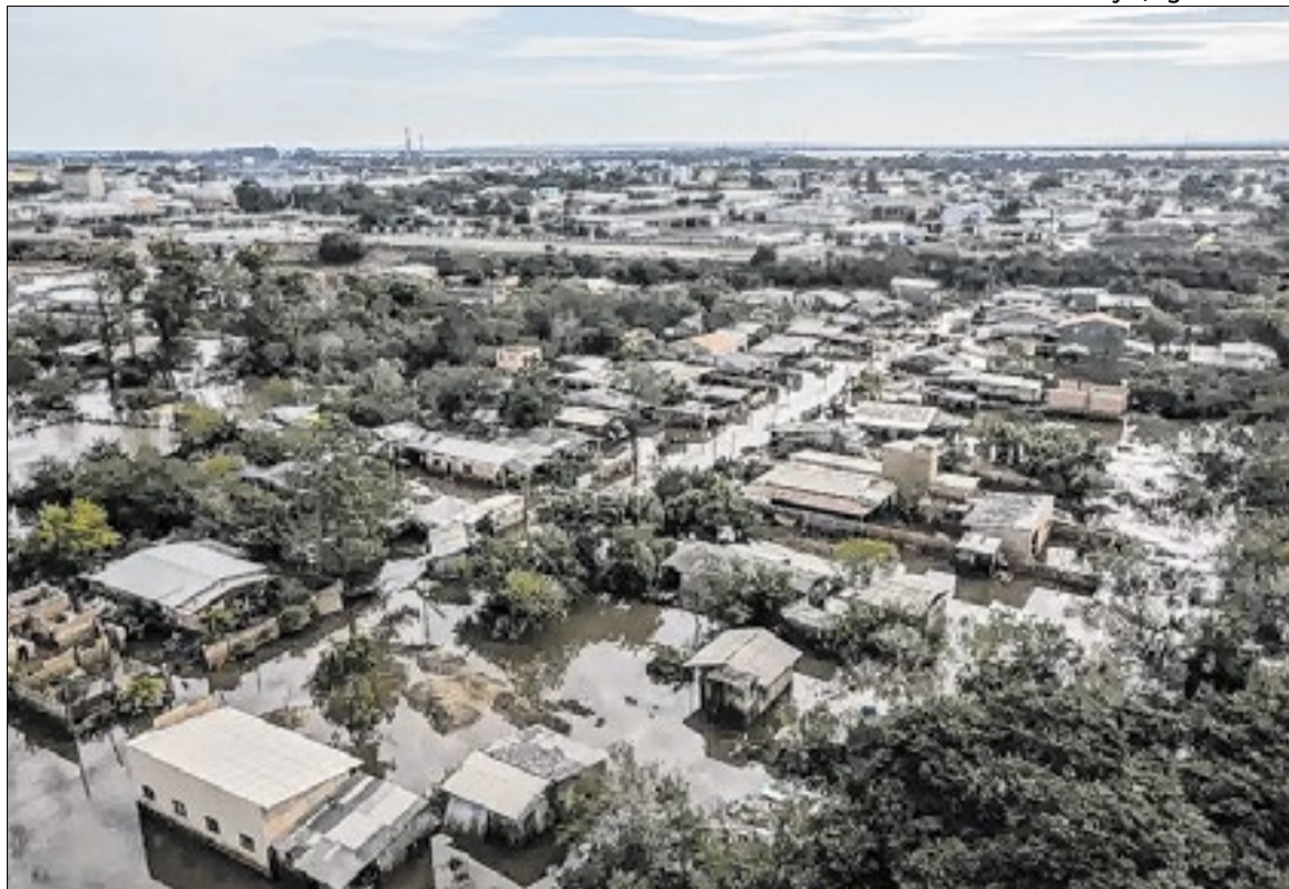
Último El Niño produziu enchentes no Sul e seca no Norte

A Administração Nacional Oceânica e Atmosférica dos Estados Unidos (NOAA) confirmou que o fenômeno já se estabeleceu oficialmente e deve atingir uma intensidade superior à observada em 2023 e 2024, reforçando os temores da formação de um El Niño forte, que ocorre quando a anomalia de