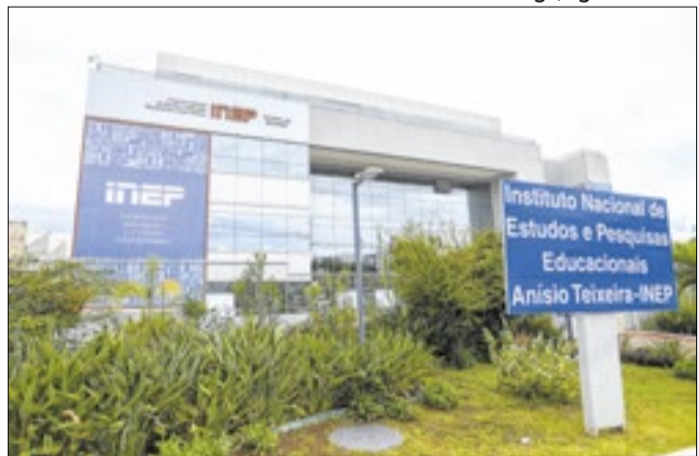
Inep: avaliação pode ser utilizada por estados e municípios