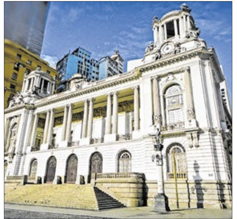
Caso seja aprovada, a proposta segue para a sanção do prefeito

Um homem foi preso em flagrante, nesta segunda (15), por manter a mãe, uma idosa parálitica, em condições insalubres em Olaria. A prisão aconteceu durante uma ação fiscalizatória na casa da vítima. Na abordagem, as equipes relataram que o local possuía condições precárias de higiene e ausência total de alimentos.