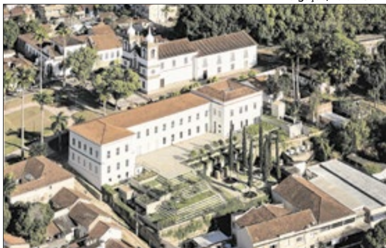
Vassouras sedia simpósio regional sobre segurança

O simpósio reuniu autoridades, especialistas e representantes de diversos municípios do estado para debater soluções, desafios e boas práticas na área da segurança pública. A participação de Resende reforçou o reconhecimento do trabalho desenvolvido pela cidade e a importância da troca de experiências entre os municípios fluminenses.