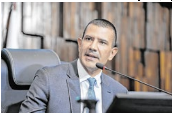
Deputado do PL preside a Assembleia Legislativa