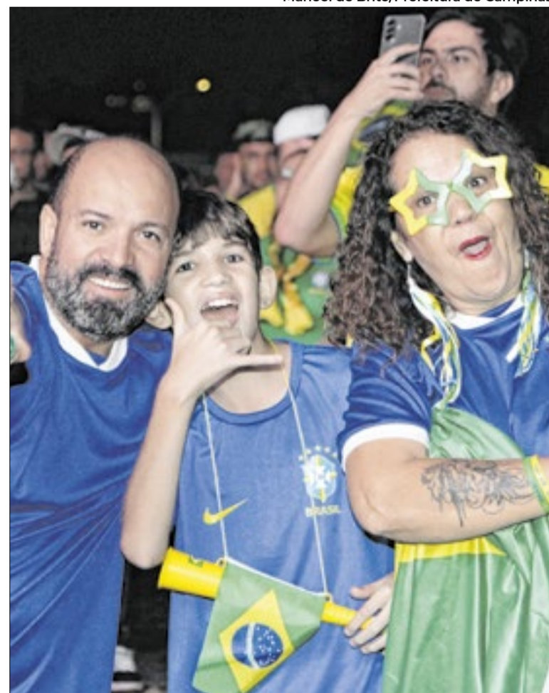
Torcedores na Arena durante a estreia do Brasil na Copa

A Arena do Torcedor, localizada na Praça Arautos da Paz, no bairro Taquaral, terá uma programação cultural com exibição de filmes e gastronomia durante a semana. Na próxima sexta-feira, 19 de junho, o espaço deve receber novamente um grande público quando a Seleção Brasileira enfrentará o Haiti, às 21h30 pela segunda rodada da fase de grupos da Copa.