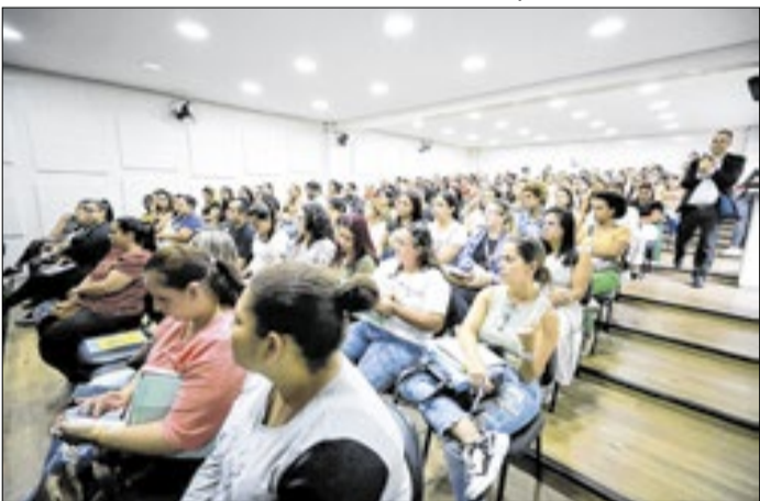
Interessados tem até 17 de junho para se inscreverem