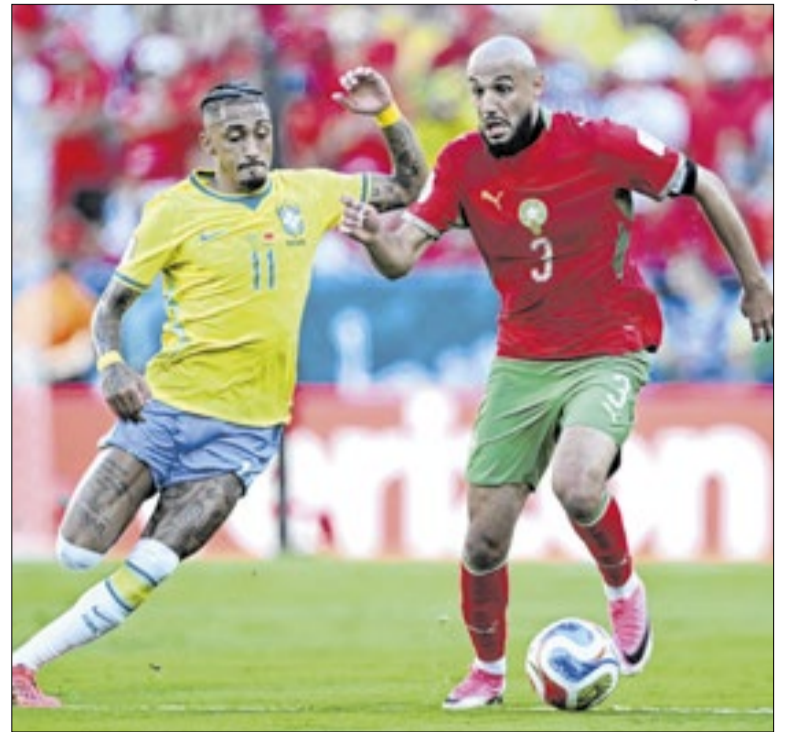
Brasil e Marrocos empataram em 1 a 1 na estreia

Existem indicadores que podem sinalizar uma sobrecarga emocional durante eventos esportivos. Eles são: irritabilidade antes, durante ou após os jogos; alterações no sono; ansiedade intensa em dias antes das partidas; taquicardia, sudorese excessiva e sensação de falta de ar; e dificuldade de concentração em atividades rotineiras.