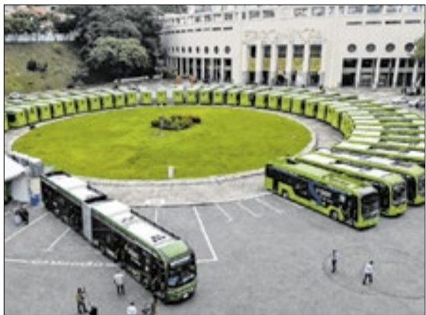
Articulados BC22 em cerimônia de entrega em SP