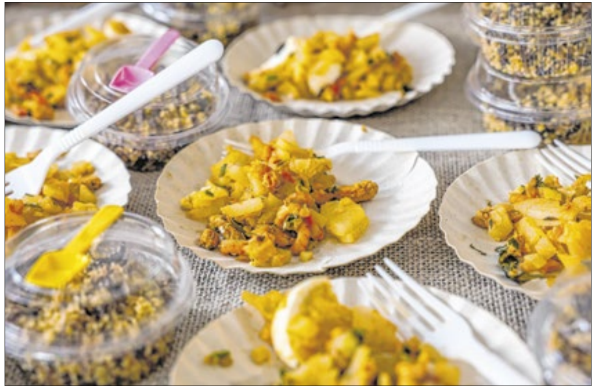
Os dados foram divulgados nesta sexta-feira (12) pelo IBGE

O IPCA de maio veio acima da estimativa do mercado. O Boletim Focus da última segunda-feira (8), sondagem do Banco Central (BC) com agentes do mercado financeiro, projeta que a inflação de maio ficaria em 0,48%. Para o fim de 2026, o mercado projeta 5,11%.