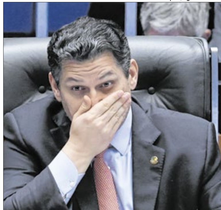
Situação aumenta tensão com Alcolumbre

O empresariado fechou questão contra a adoção da escala de cinco por dois. Mas alguns setores da economia admitem a dificuldade de contratar mão de obra — diante das propostas oferecidas, muitos jovens preferem criar as próprias alternativas. Donos de supermercados falam que há 350 mil vagas em aberto.