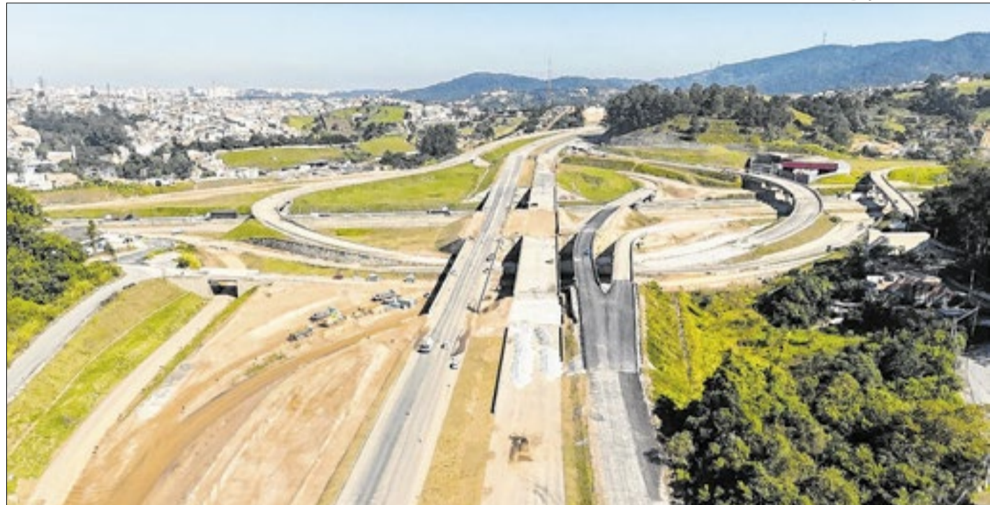
Rodoanel Norte é uma das obras do programa viário SP pra Toda Obra, lançado em 2025

Os dados mostram uma diferença entre os investimentos previstos e os efetivamente realizados pelas concessionárias. Enquanto os contratos estabelecem R$ 23,17 bilhões em investimentos, o valor realizado alcança R$ 16,75 bilhões. A diferença entre os dois montantes é de R$ 6,42 bilhões. O painel também acompanha os pagamentos de outorgas. No caso do ônus fixo, o valor previsto soma R$ 13,45 bilhões, dos quais R$ 12,17 bilhões já fo-