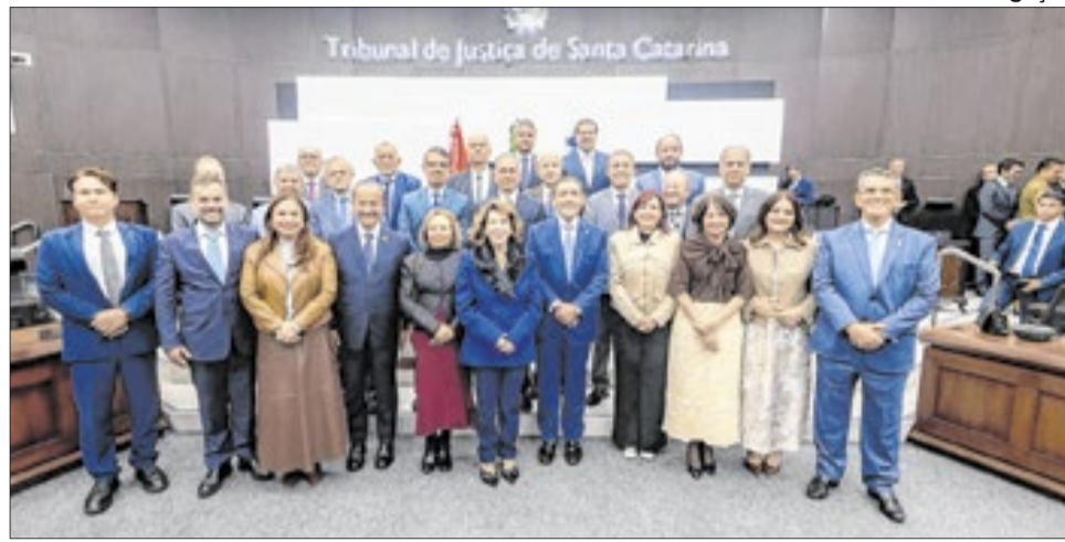
Dirigentes reunidos no Coptrel, em Florianópolis (SC), ao lado do presidente do TSE, ministro Kássio Nunes Marques