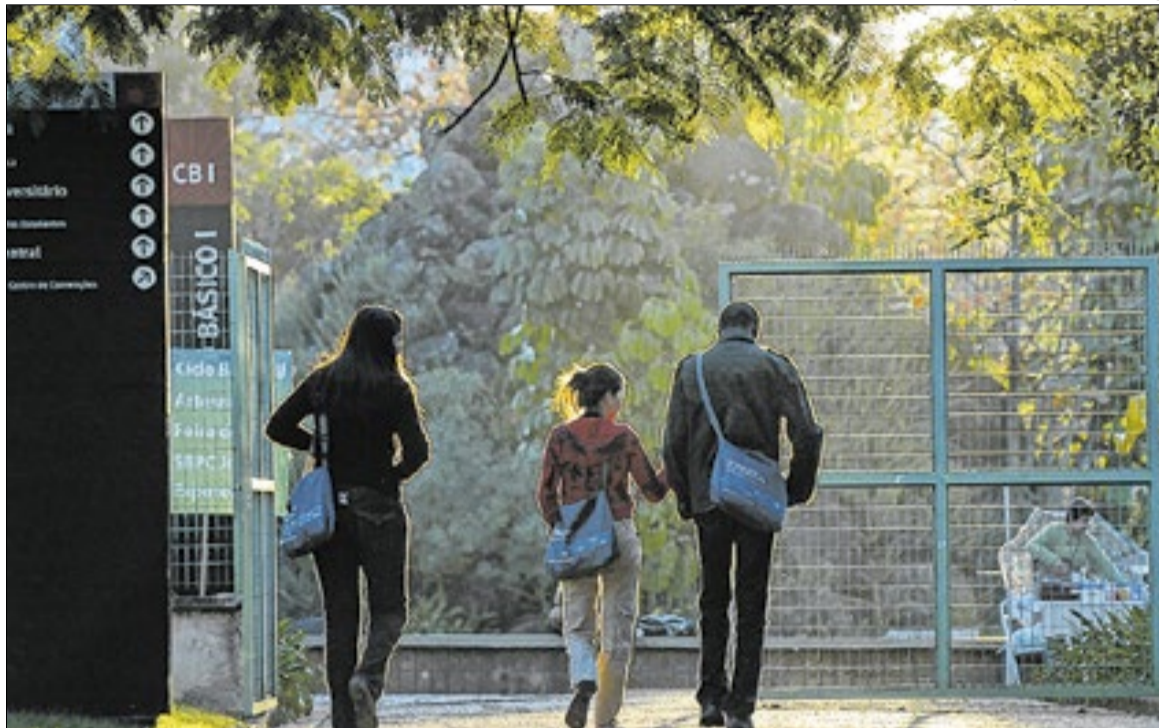
Unicamp amplia compromissos e busca fim de paralisação

Garantia de moradia estudantil para o campus de Limeira e transporte intercamp para Piracicaba; expansão dos serviços de acolhimento à violência sexual, combate ao racismo e atendimento psicológico e psiquiátrico; abertura do restaurante universitário