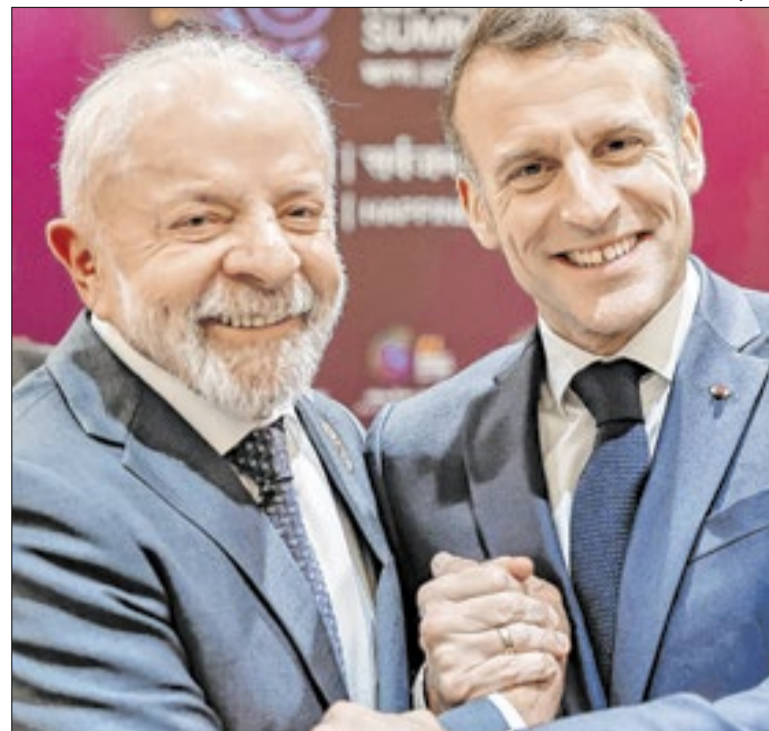
Lula terá encontro com Emmanuel Macron

Por isso, Isaac Jordão desconfia que o escanteio de Valdemar talvez não seja assim um desprestígio. Mas o deslocamento para cuidar do que realmente gosta e o interessa. O fundo partidário distribuirá R$ 4,9 bilhões. O PL é quem recebe mais. Valdemar tem 881 milhões de razões para focar na eleição proporcional.