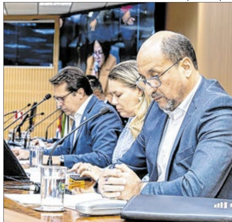
Projeto da LDO de 2027 foi debatido na Casa no último dia 10

O acesso rápido aos dados fomenta inclusive a participação da sociedade na fiscalização dos investimentos locais, evocando um modelo de gestão que presta contas e permite que o cidadão atue de forma direta na vigilância dos recursos que são aplicados no município.