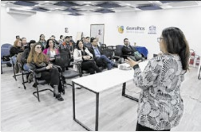
O Plano reúne dados sobre habitação do município.