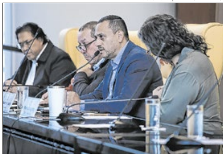
Após votação, os trabalhos da Comissão serão encerrados

As enchentes no Jardim Pantanal são consideradas um problema histórico da cidade de São Paulo. A área está localizada em uma grande região de várzea próxima ao Rio Tietê e concentra milhares de moradores que convivem periodicamen-