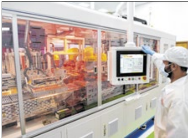
Fábrica em Campinas também fabrica painéis