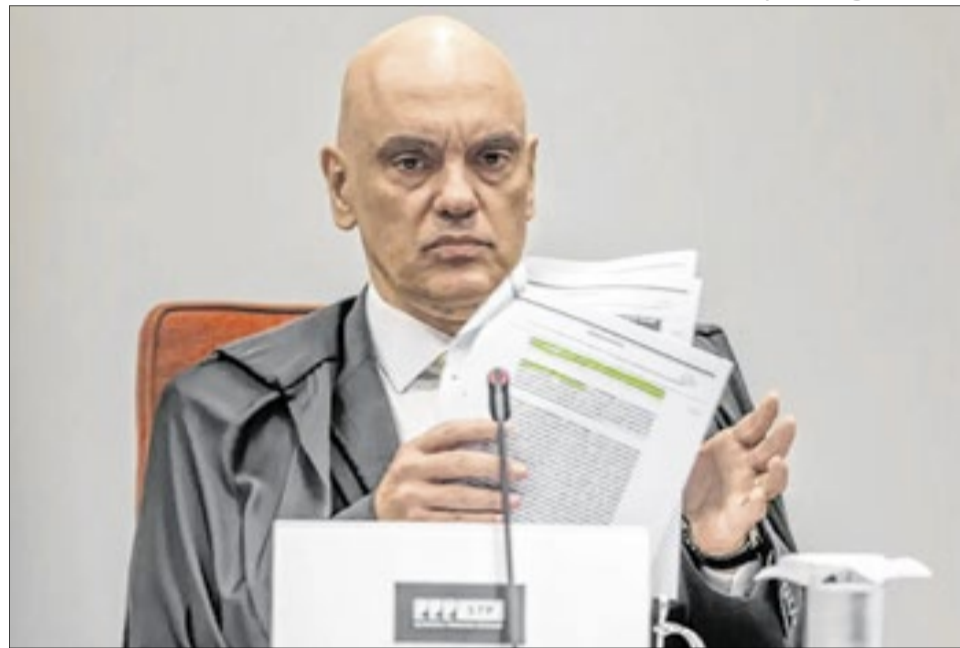
Magistrados italianos concluíram que havia indícios de comprometimento

Segundo o relato registrado pela Corte, o material apontaria ausência de vínculos entre Zambelli e o acusador identificado pelas iniciais “W.D.N.”. As iniciais coincidem com as de Wal-