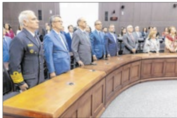
O encontro ocorreu desde quarta (10) até a última sexta-feira (12), no Tribunal Regional Eleitoral de Santa Catarina (TRE-SC)