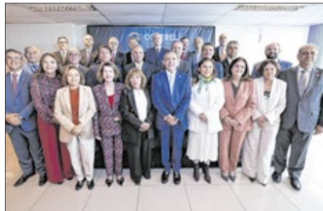
O evento reuniu o presidente do Tribunal Superior Eleitoral (TSE), ministro Kássio Nunes Marques, e dirigentes da Justiça Eleitoral de todo o país