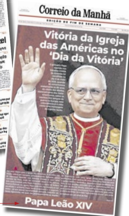
9 de maio de 2025, cardeal Robert Prevost é anunciado como o novo papa da Igreja Católica: Leão XIV

Correio da Manhã se mantém como um dos principais veículos do país com atuação no Rio, São Paulo e Brasília