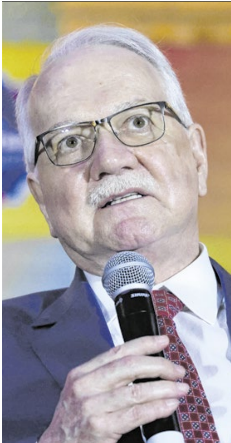
Fachin: mudanças para modernizar Judiciário

Nos últimos anos, o STF ampliou seu protagonismo em temas políticos, eleitorais e institucionais, passando a ocupar posição central em debates que antes eram predominantemente travados no Congresso Nacional. O resultado foi um