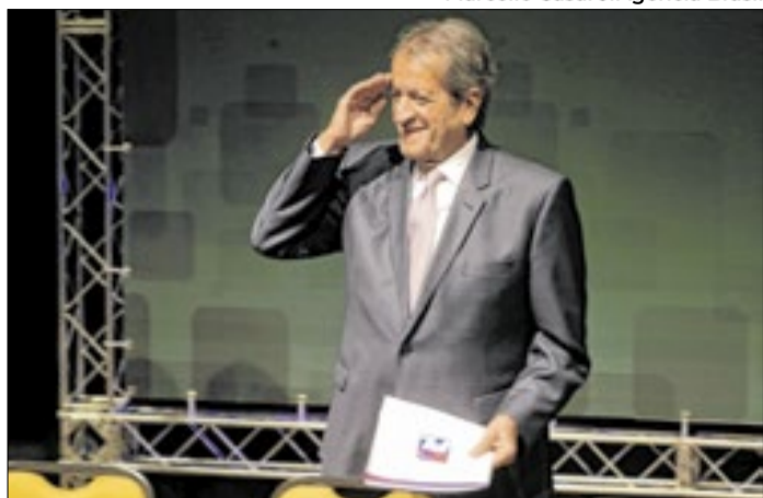
Valdemar: escanteado ou deslocado para onde prefere?