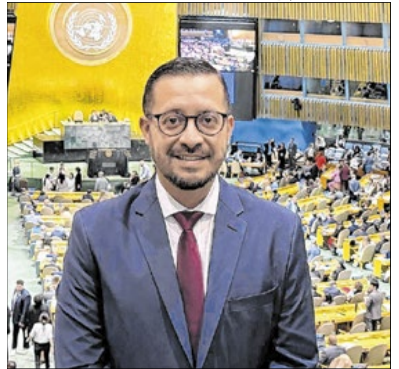
A cidade foi representada pelo Secretário de Educação