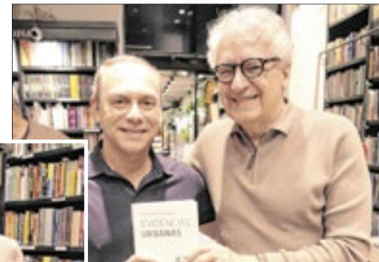
Prefeito de Nova Iguaçu, Duda Reina prestigiou o grande cidadão iguaçuano