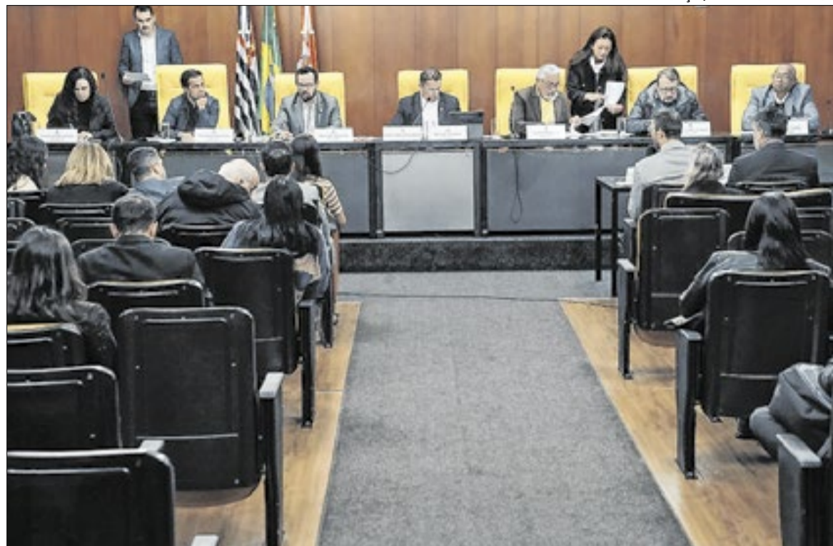
Os vereadores avaliaram que algumas das respostas não contemplaram os questionamentos

Instalada em maio deste ano, a CPI dos Devedores foi criada para examinar a situação fiscal de empresas com grandes passivos tributários perante a administração municipal. Os trabalhos devem prosseguir nos próximos meses com novas oitavas, análise de documentos e elaboração de relatórios que poderão resultar em recomendações para a recuperação de créditos considerados de interesse público.