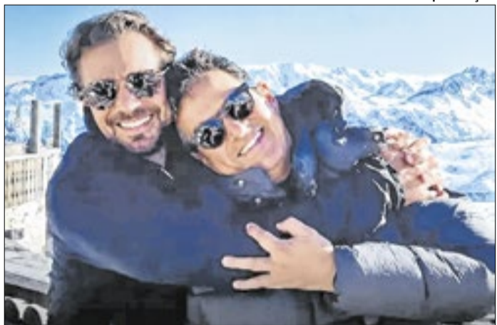
Vorcaro e Ciro: relação desgastou presidente do PP