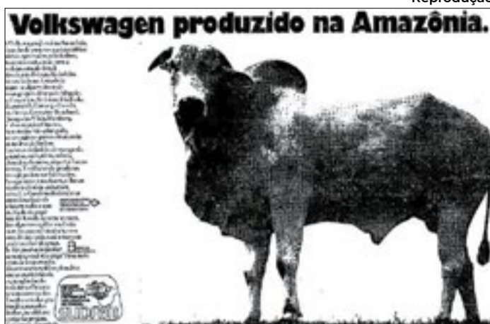
Anúncio veiculado pela ditadura sobre o gado da VW