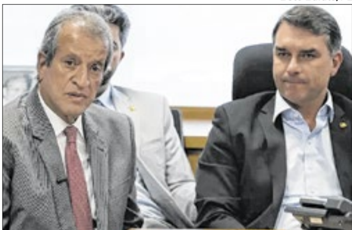
Valdemar afastado da campanha de Flávio