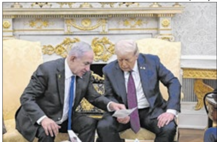
Trump admitiu ter chamado Netanyahu de maluco