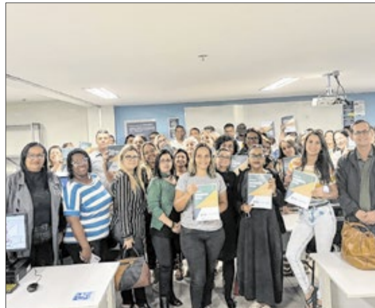
Curso é para secretários, auxiliares e agentes administrativos

Policiais civis da 58ª DP prenderam um homem por um homicídio. O crime ocorreu em 2004, no estado de São Paulo. O bandido foi localizado e capturado em Nova Iguaçu. A prisão ocorreu a partir do trabalho investigativo da unidade, com base no cruzamento de dados e análise de informações do Setor de Inteligência.