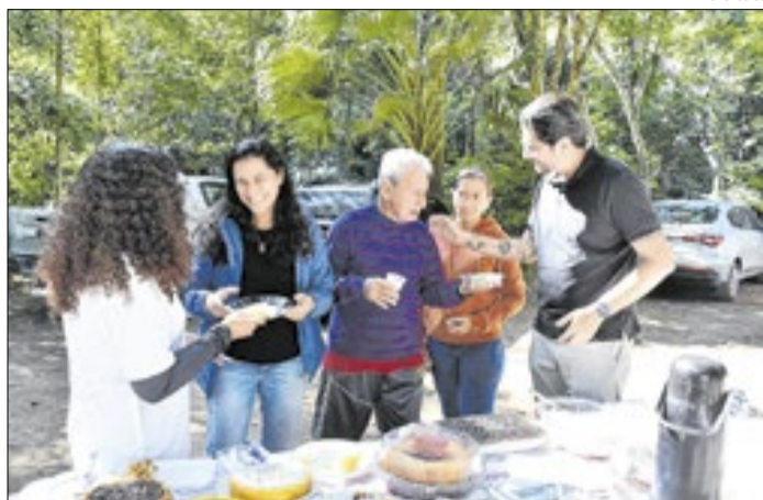
Parque funciona de terça-feira a domingo, das 8h às 16h