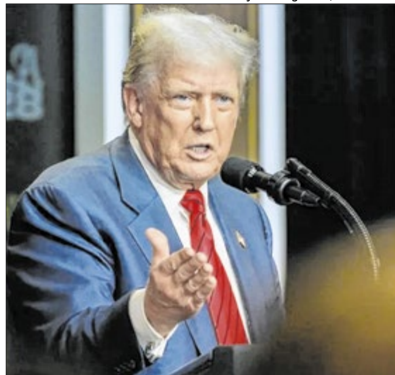
Trump diz que Washington e Teerã estavam perto de acordo