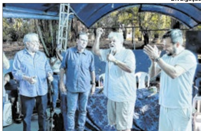
Diretório de Barra Mansa vai caminhar de forma unificada