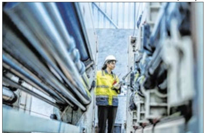
Faturamento subiu 0,5% em relação a março