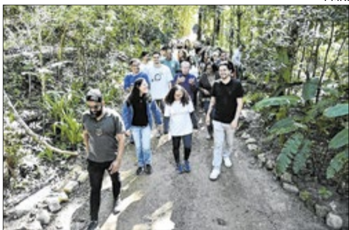
Parque Natural Municipal de Nova Iguaçu faz 28 anos