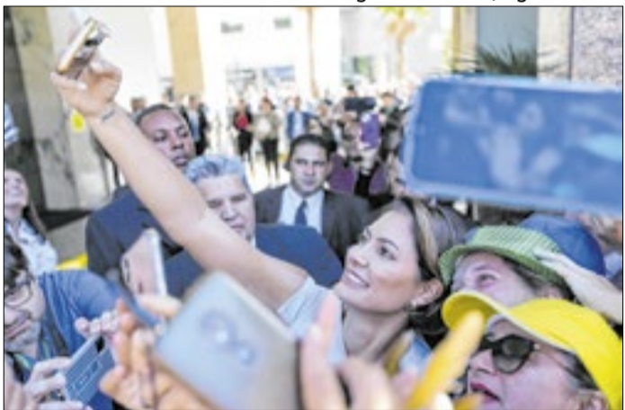
Entrada mais incisiva de Michelle é esperada