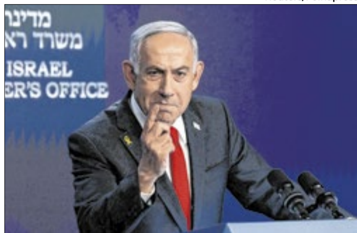
Partido afirma que Netanyahu concorrerá à reeleição