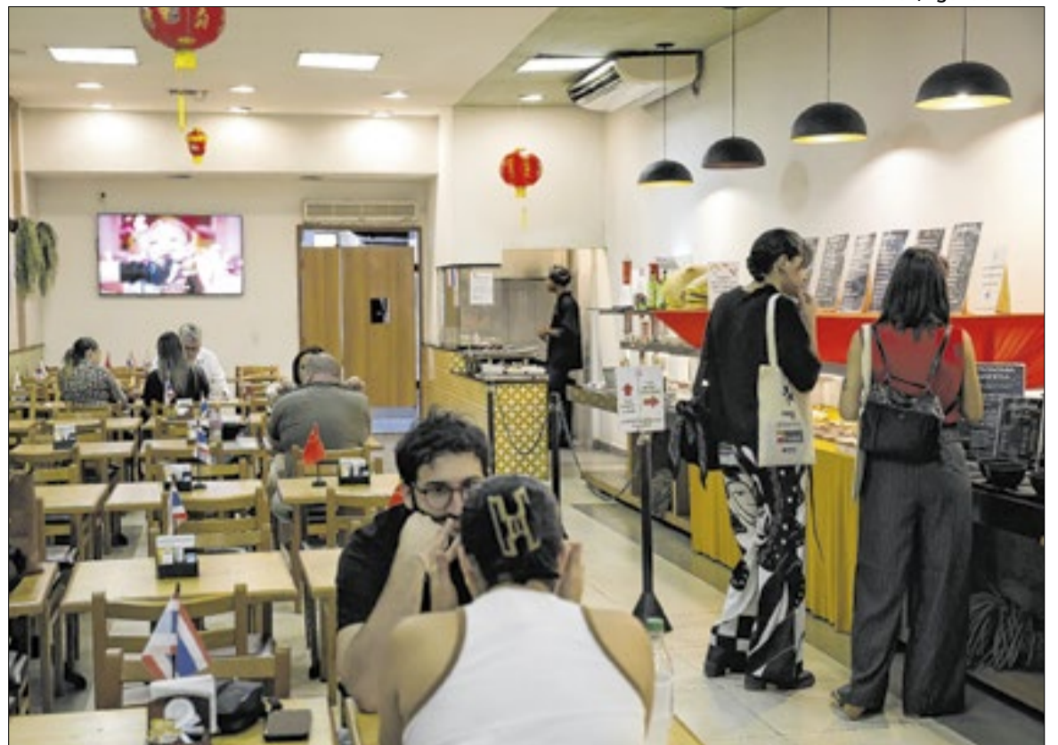
Os dados fazem parte da Pesquisa Mensal de Serviços, divulgada na quinta-feira (11)

“O setor de serviços se mantém operando em patamar elevado, apenas 0,3% abaixo do topo da série, alcançado em outubro de 2025, mas sem uma trajetória muito bem definida, seja ascendente ou descendente.”