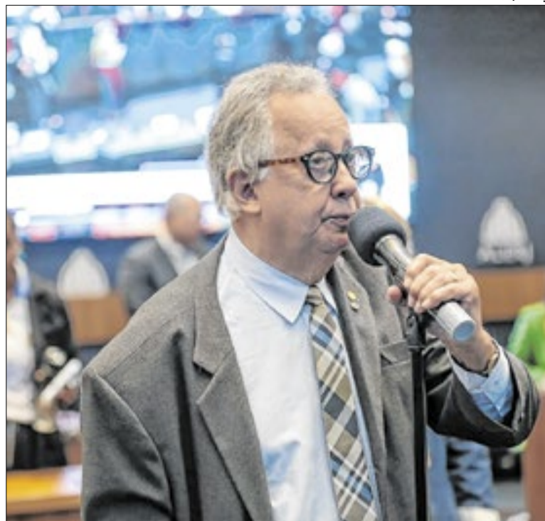
Alerj aprovou mudanças na formação de condutores