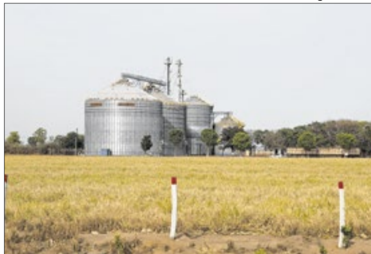
Caso os números sejam confirmados, resultado será recorde

A colheita da primeira safra abrange 87,7% da área, deven-