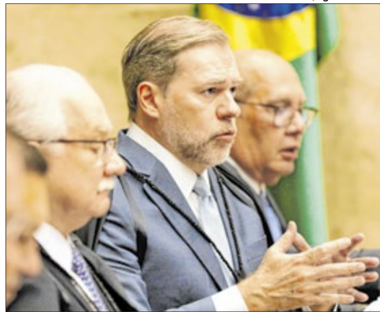
Toffoli resolverá divergências na quarta

A juíza ressalta que os compromissos gerados por contratos de publicidade que envolvem metas de audiência e busca constante de exposição precisam ser olhados com atenção. Para ela, essas expectativas, responsabilidades e cobranças não fazem parte da leveza que uma criança precisa ter.