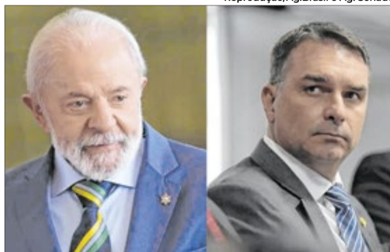
Flávio acusa Lula após discurso do presidente em evento

A defesa argumenta que o discurso não pode ser tratado como mera “retórica política” ou “metáfora histórica”, sustentando que houve um “encadeamento lógico” para estimular violência contra o parlamentar. A peça afirma que Lula construiu a seguinte associação: “traidores deveriam ser enforcados”, Flávio Bolsonaro seria um “traidor” e, portanto, “deveria ser enforcado”.