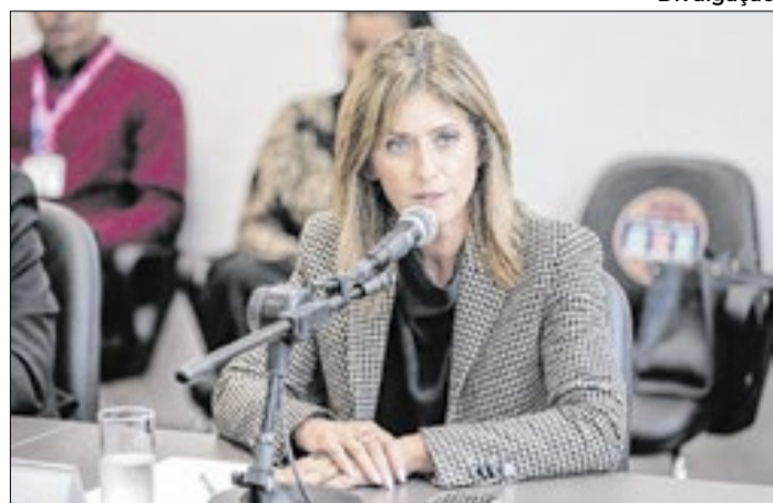
Deputada destacou situação em sessão ordinária da Alerj