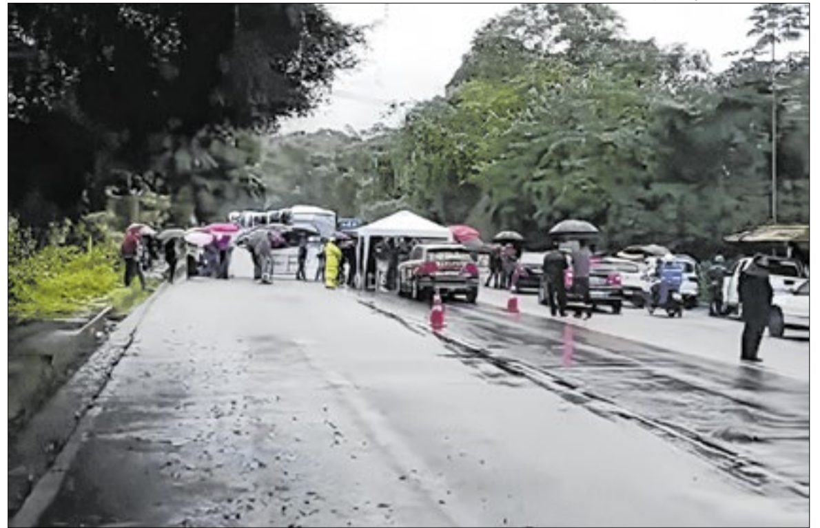
Moradores, entidades e autoridades políticas bloquearam a Rio-Santos (BR-101) para ato

A Feam, entidade privada independente que é responsável pela administração do hospital na Costa Verde, publicou uma nota nesta quarta-feira (10) para apontar que desde terça-feira (09), passou a operar em regime de Emergência Referenciada. Na modalidade, o serviço permanece em fechamento mas destinado ao atendimento exclusivo de pacientes em estado grave ou encaminhados por Uni-