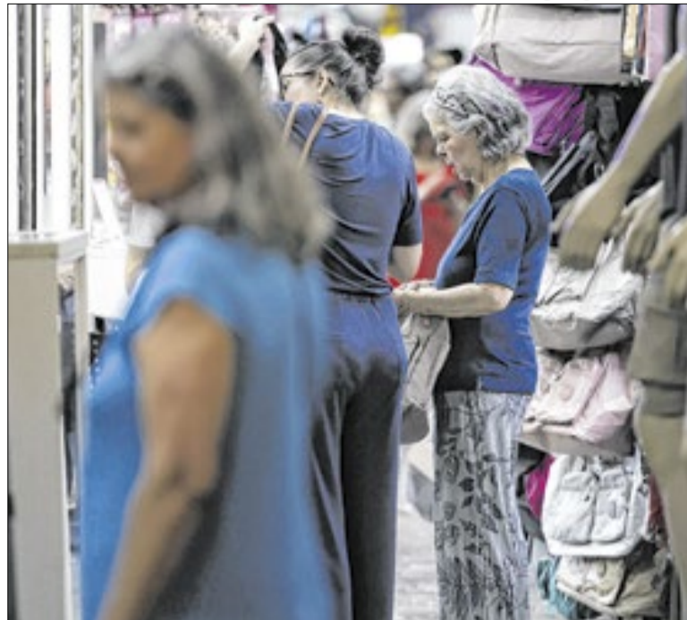
Emprego para idosos cresce mais rápido do que o envelhecimento

O debate, promovido pela Associação Brasileira de Internet (Abranet), no 6º Congresso Brasileiro de Internet, que reuniu representantes do setor público, da academia e do mercado para discutir os efeitos da transformação digital sobre a concorrência, a inovação e o desenvolvimento econômico.