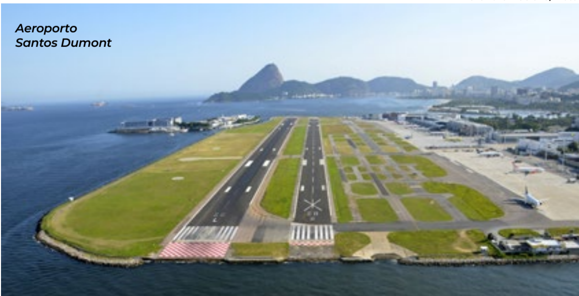
Aeroporto Santos Dumont