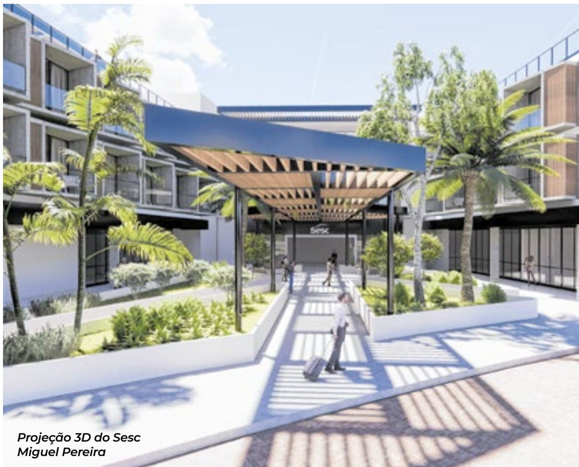
Projeção 3D do Sesc Miguel Pereira

Novas unidades, hotéis, centros culturais e espaços de qualificação profissional reforçam a presença das instituições e contribuem para o desenvolvimento social e econômico dos municípios fluminenses