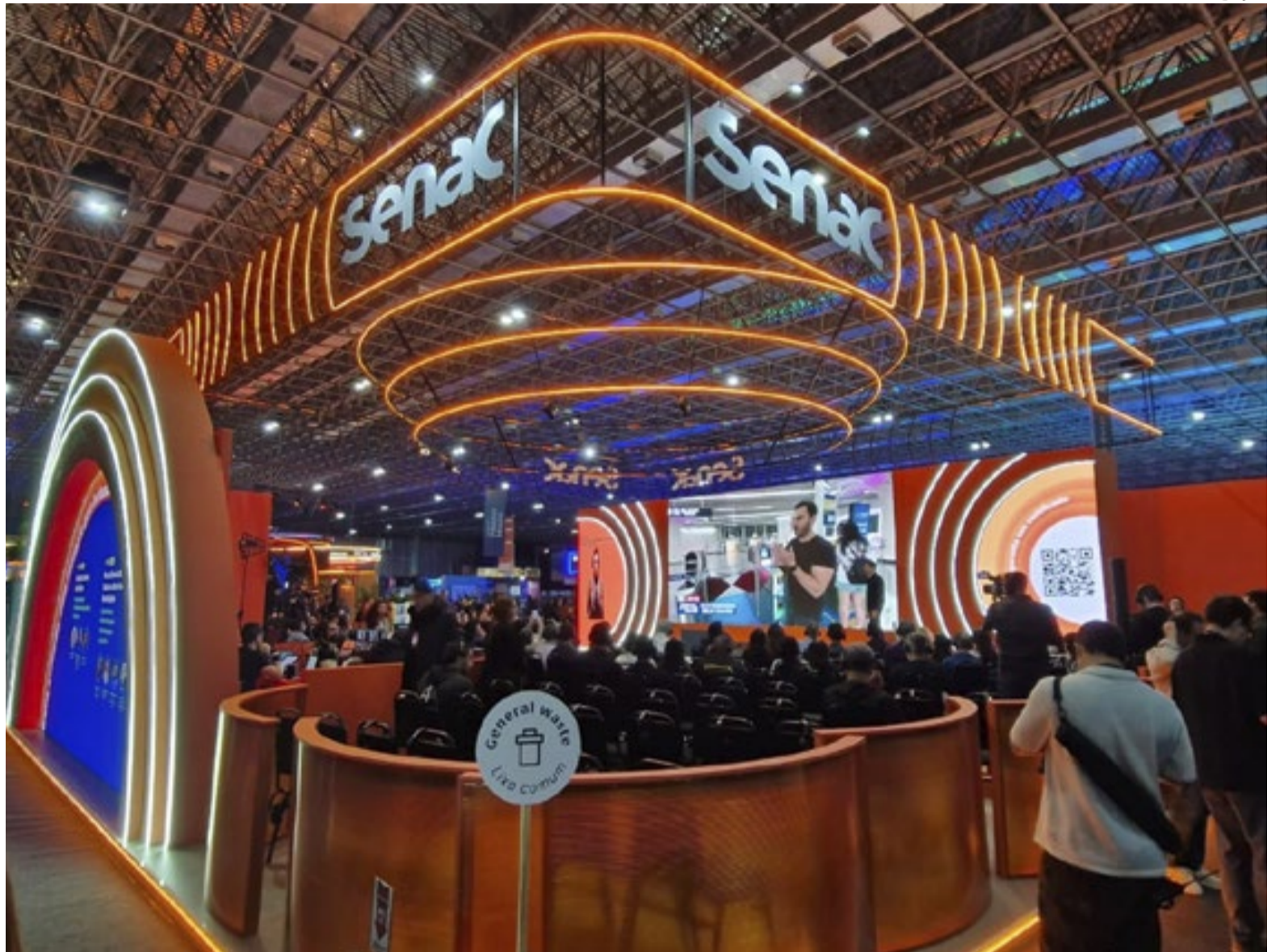
Stand Senac Web Summit 2026