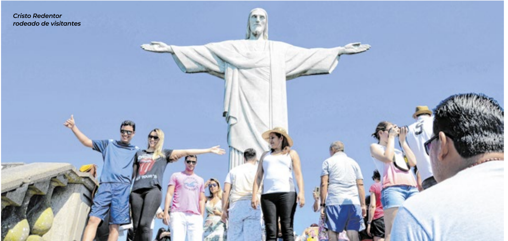
Cristo Redentor rodeado de visitantes