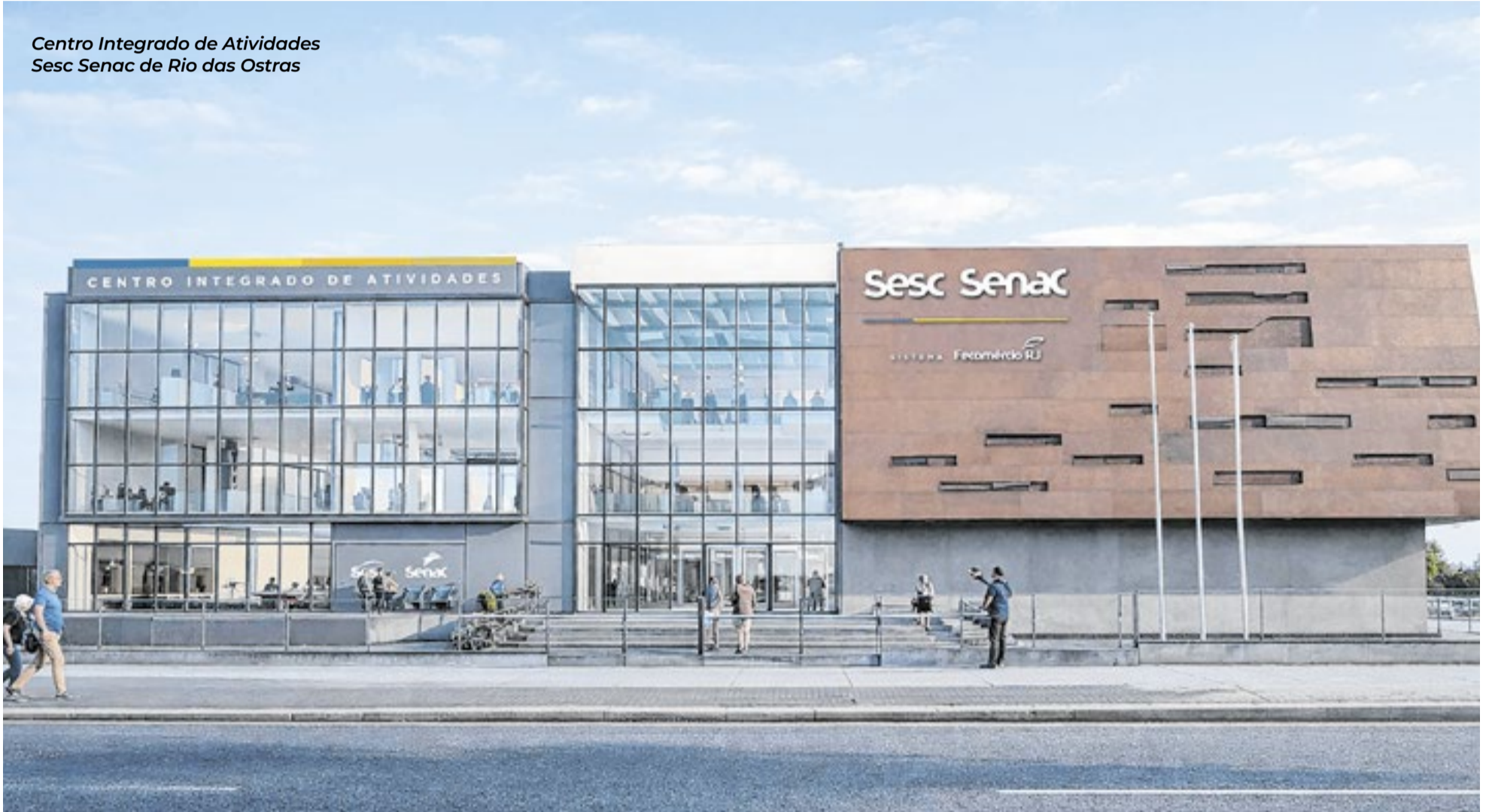
Centro Integrado de Atividades Sesc Senac de Rio das Ostras

O Sesc RJ e o Senac RJ vivem um dos maiores processos de expansão de sua história. Com novos equipamentos em implantação, unidades em construção, hotéis recém-incorporados à rede e a ampliação da atuação cultural em diversas cidades, as instituições avançam em uma estratégia que busca estar cada vez mais próximas da população fluminense, levando oportunidades de educação profissional, cultura, esporte, lazer, turismo, saúde e desenvolvimento social para todas as regiões do estado.