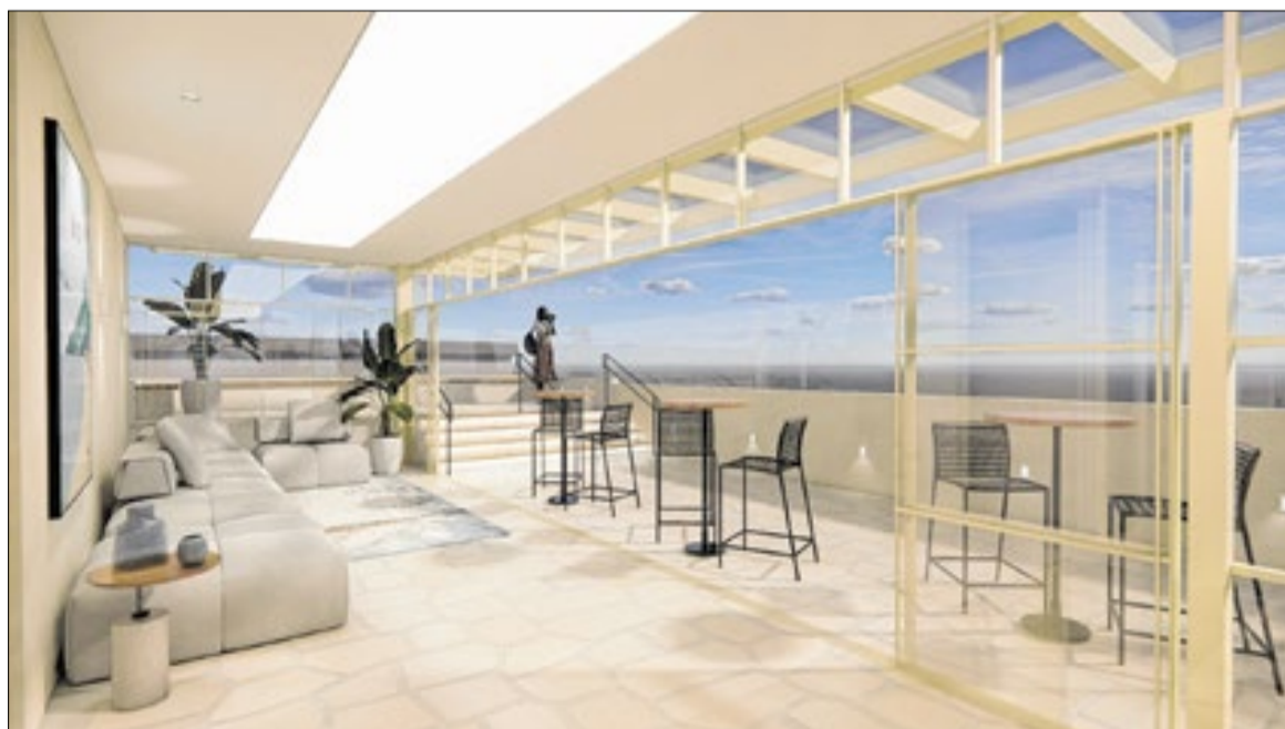
Rooftop do Hotel Escola Senac

Para o Sistema Fecomércio RJ, investir em educação profissional é uma forma de transformar o potencial turístico em desenvolvimento econômico e inclusão social. Além de atender às necessidades das empresas, a formação qualificada amplia oportunidades de emprego e renda para milhares de trabalhadores. O futuro Hotel-