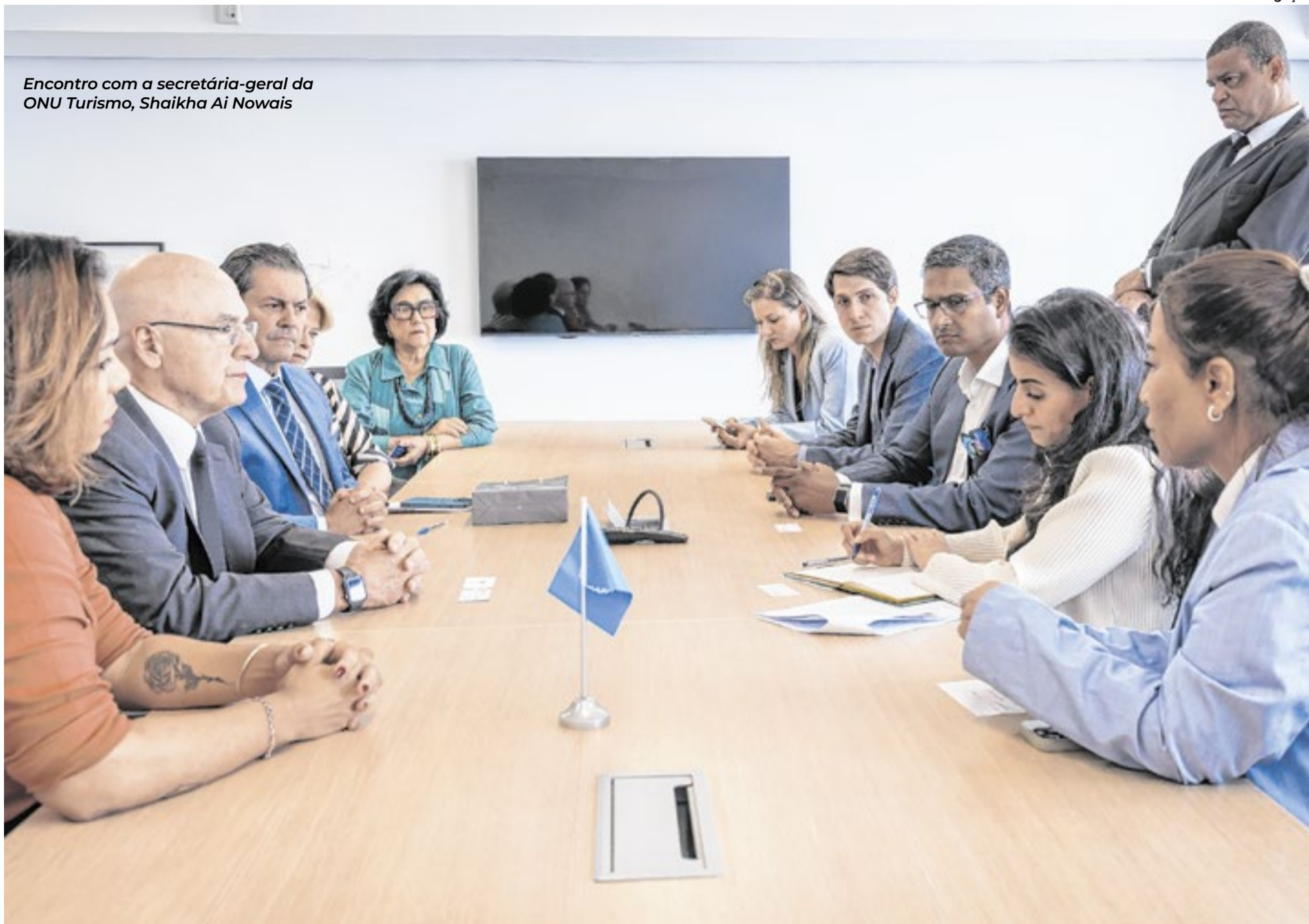
Encontro com a secretária-geral da ONU Turismo, Shaikha Ai Nowais