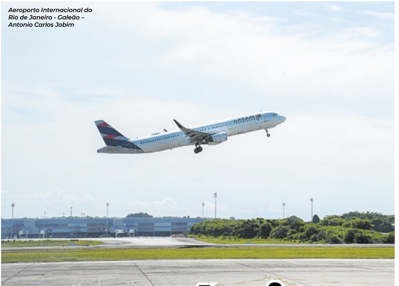
Aeroporto Internacional do Rio de Janeiro - Galeão - Antonio Carlos Jobim

Em fevereiro de 2025, a Fecomércio RJ apoiou a decisão do Governo Federal de revogar a flexibilização dos limites de passageiros no Santos Dumont,