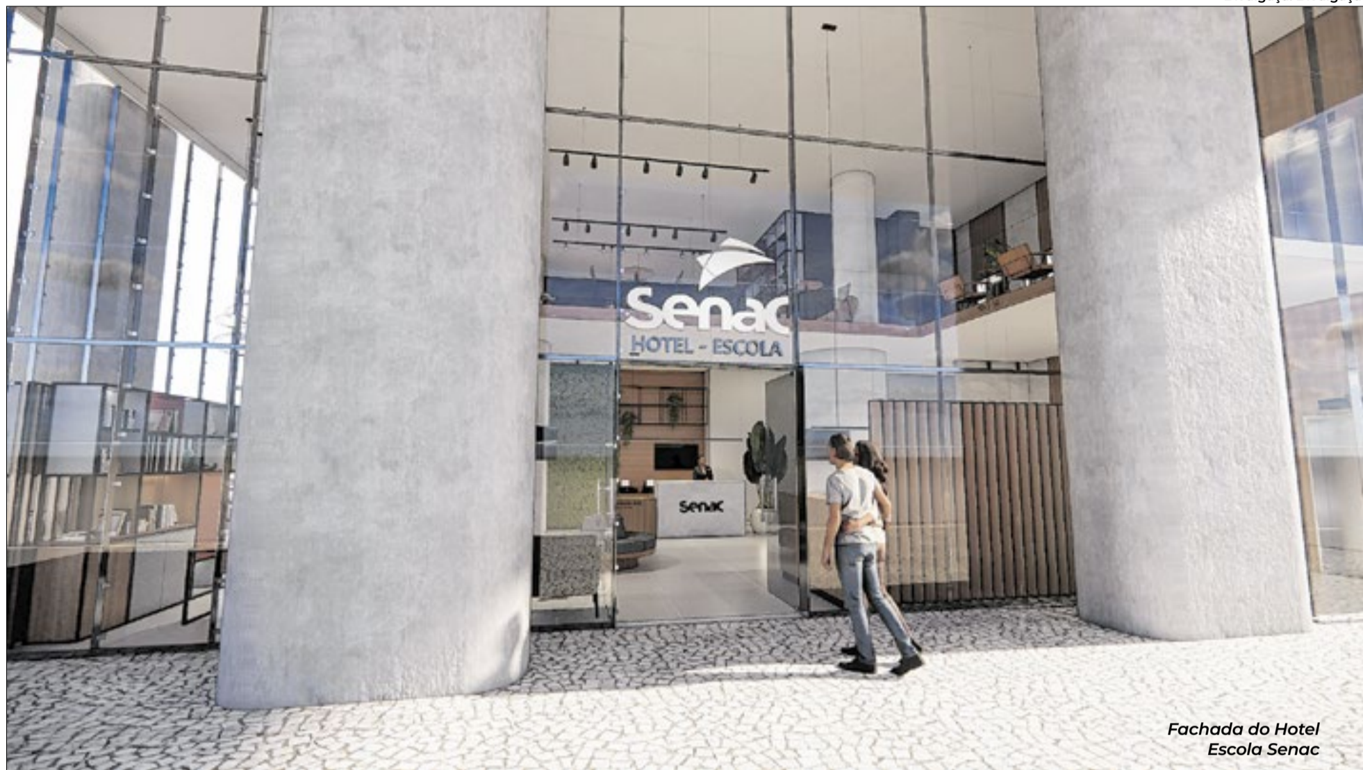
Fachada do Hotel Escola Senac