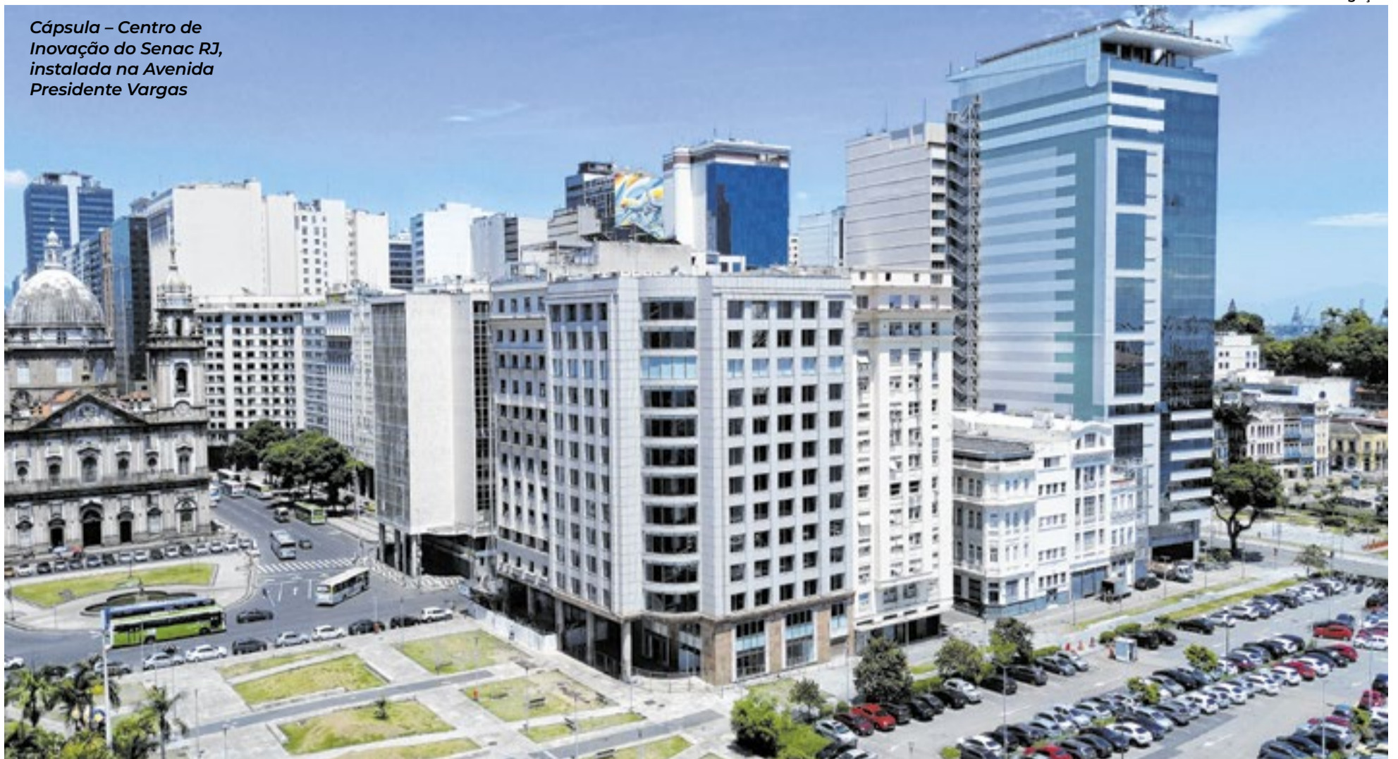
Cápsula – Centro de Inovação do Senac RJ, instalada na Avenida Presidente Vargas