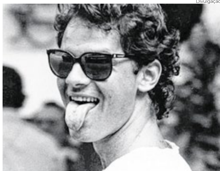
Cazuzza tem sua obra celebrada na premiação desta quarta