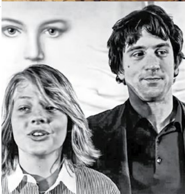
A jovem Jodie Foster, aos 13 anos, e Robert De Niro durante a retribunata passagem de 'Taxi Driver' pelo Festival de Cannes há 50 anos. Por falar francês, a adolescente concedia entrevistas em nome da equipe

Ao enquadrar Travis Bickle como um vigilante, à luz da metáfora cristã do Cordeiro de Deus, Scorsese arrancou de Robert De Niro uma atuação icônica em 'Taxi Driver'