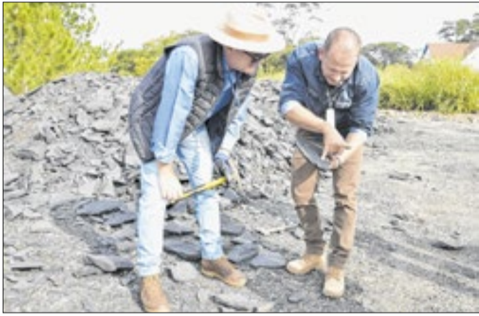
Vestígios arqueológicos encontrados durante escavações