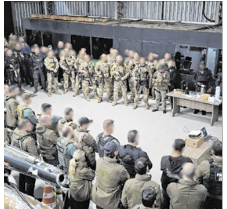
Ministério Público de SC atuou junto ao Ministério Público do RS

A prefeitura de Santa Maria (RS) realizará um Turno Alternativo de saúde neste sábado (13), das 15h às 17h, na Escola Municipal de Educação Infantil Eufrazia Pengo Lorensi. A medida busca ampliar o acesso ao atendimento para moradores que não conseguem comparecer nos horários habituais.