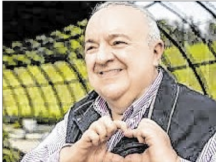
Raciocínio parecido envolve Rafael Greca no Paraná