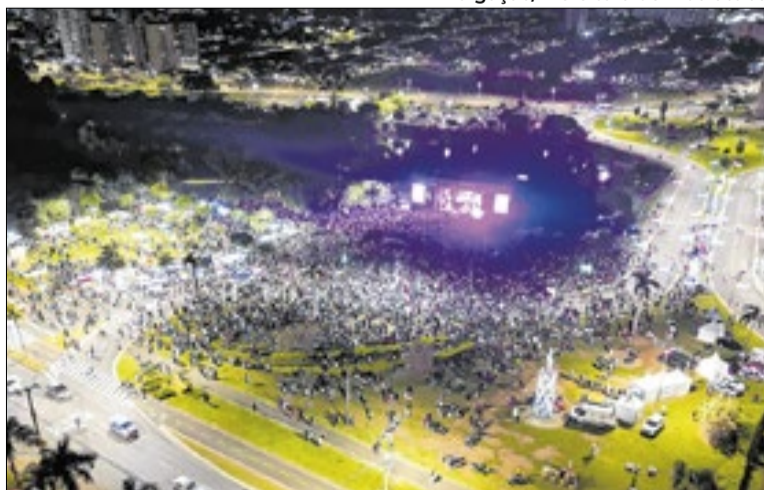
Descentralização de atividades ampliou acesso da população

Uma das principais novidades deste ano foi a descentralização das atividades por meio da criação de novos palcos em variadas regiões do município. Essa iniciativa aproximou as manifestações artísticas dos moradores e ampliou o acesso da população. Entre os novos locais utilizados, a Concha Acústica abrigou o Palco Água, enquanto o Jardim Paulista recebeu o Palco Luz.