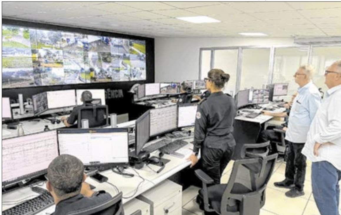
A Muralha Digital de Americana terá monitoramento 24h e reconhecimento facial nas vias

crimes patrimoniais já havia sido observada no ano anterior. Em 2025, Americana atingiu o menor índice de roubos e furtos de veículos desde o começo da série histórica da SSP-SP, iniciada em 2001. Durante os doze meses de 2025, a cidade registrou 45 roubos de veículos e 564 furtos de veículos, estabelecendo os menores patamares quantitativos dos últimos 24 anos.