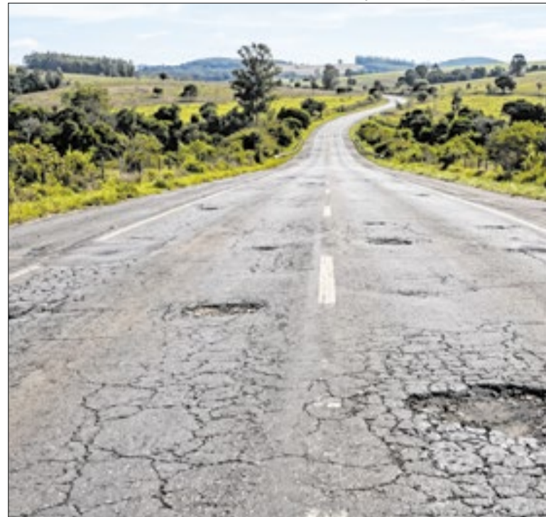
Laudo técnico aponta buracos, fissuras e trincas no pavimento

A explosão aconteceu durante uma intervenção em tubulações na região e provocou mortes, feridos e danos a dezenas de imóveis. Como parte da investigação, o Ministério Público solicitou informações e relatórios técnicos de concessionárias, órgãos reguladores, Defesa Civil e demais instituições envolvidas.