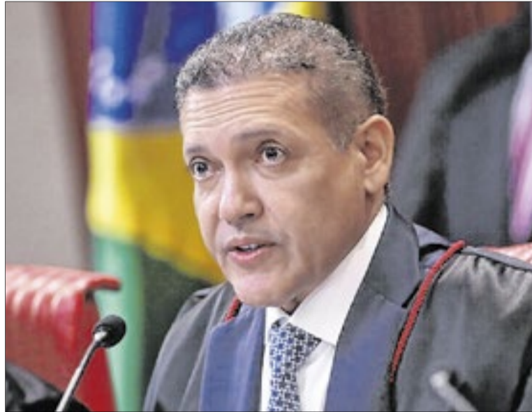
Ministro Nunes Marques apontou perda do prazo processual

Os senadores sustentaram que a suspeição ganhou “nova e definitiva dimensão jurídica” após decisão do ministro André Mendonça que autorizou medidas cautelares contra Ciro Nogueira e empresas ligadas ao parlamentar. Segundo os autores, o núcleo investigado pela Polícia Federal (PF) coincidiria com os