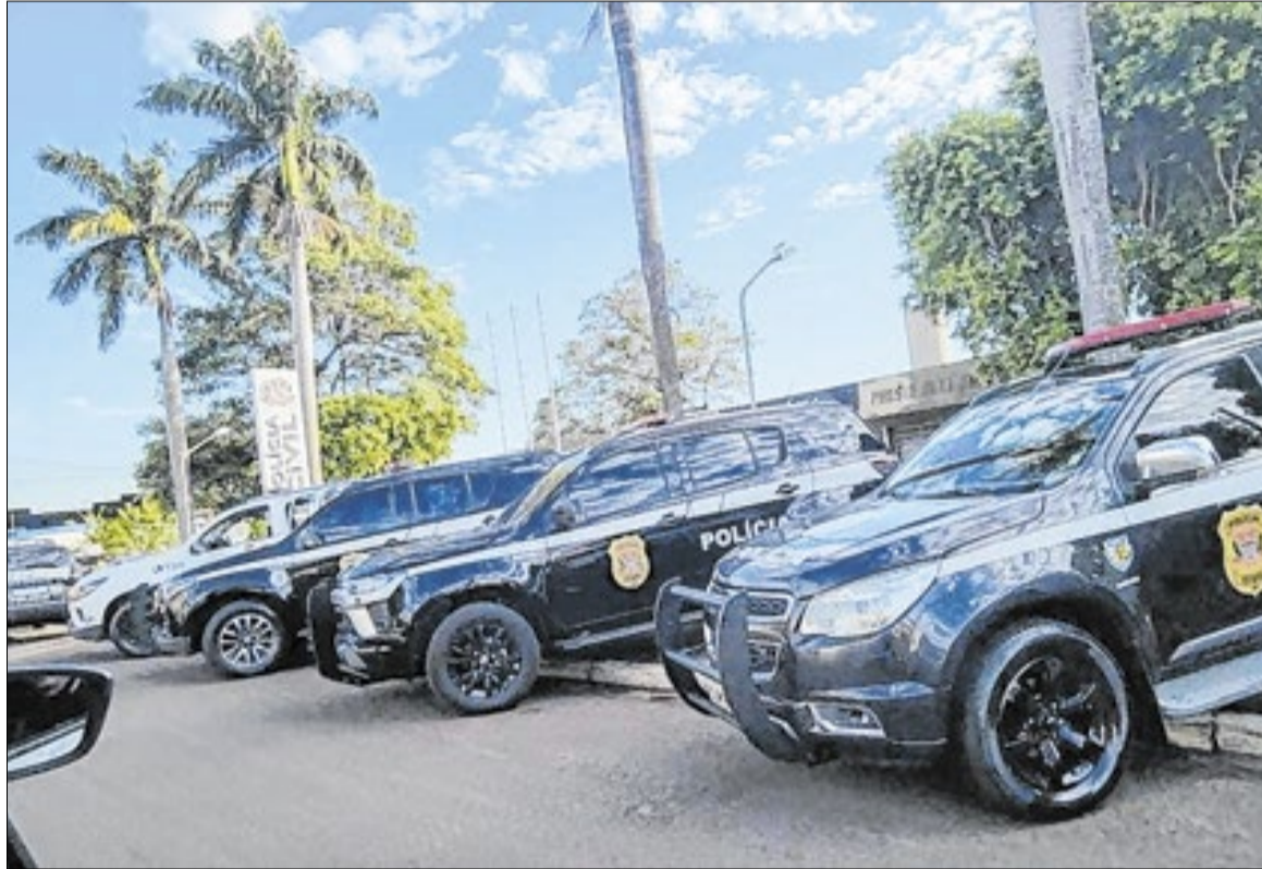
Operação é desdobramento de ação de 2025

tro preso de Campinas. Hoje é bacharel em direito e na época dos crimes investigados, atuava como estagiário em uma promotoria criminal do Ministério Público em Campinas. Utilizando os bancos de dados e sistemas de pesquisa e contando com o auxílio de outros agentes públicos, o estagiário teria conseguido identificar criminosos de alto poder econômico e, então, direcionado esforços para extorquir dinheiro em troca de suposta proteção nas investigações.