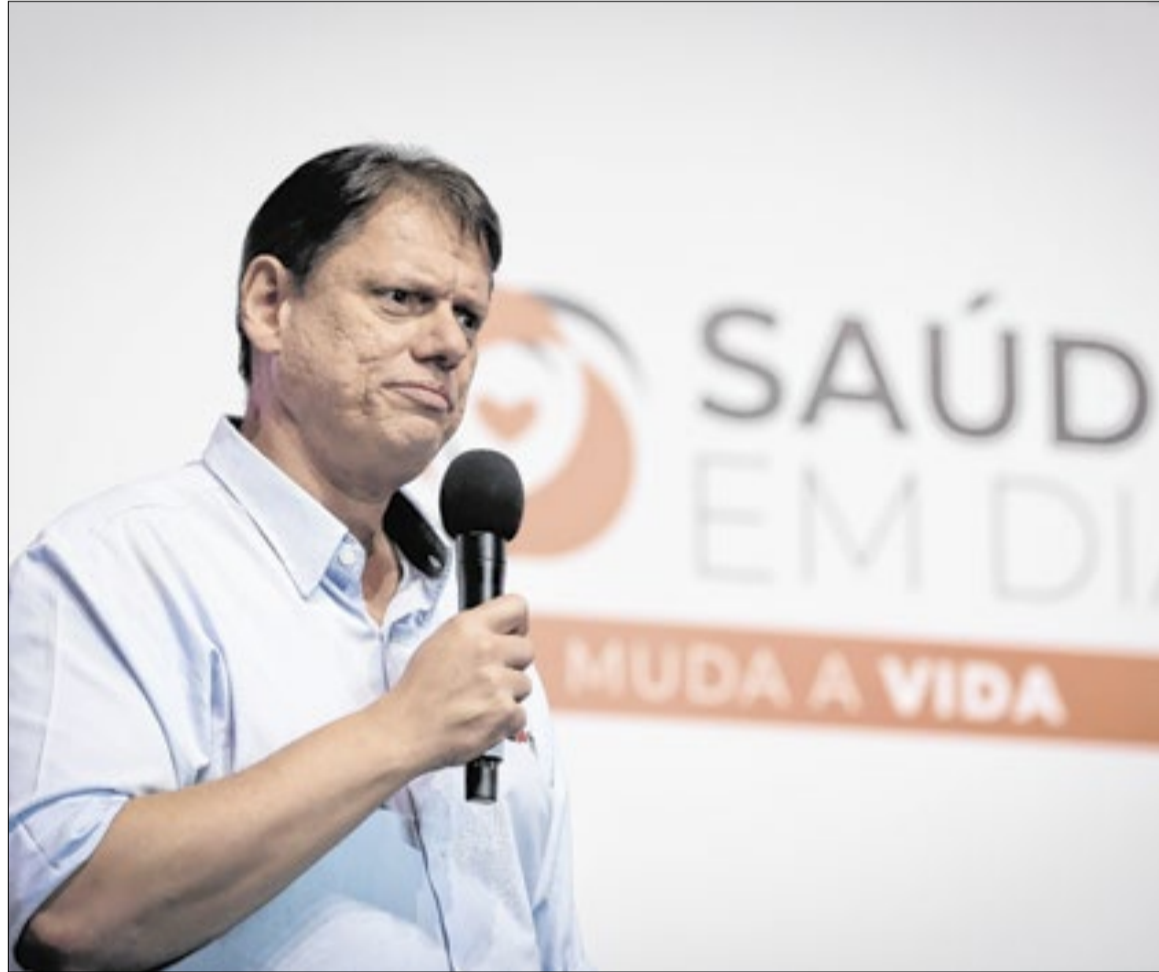
Aporte corresponde à nova parcela do IGM SUS Paulista e de transferências voluntárias

Os recursos do IGM SUS Paulista serão direcionados a ações consideradas estratégicas para a atenção primária. Entre as prioridades estão