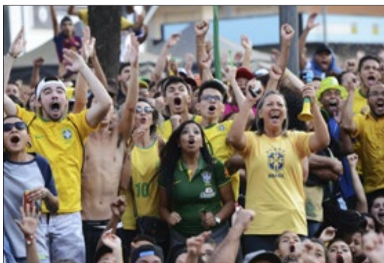
Carlos Bassan/Prefeitura de Campinas

A proposta é oferecer um ambiente preparado para que moradores da cidade e da região possam acompanhar os jogos da Seleção Brasileira com conforto, segurança e atrações para toda a família.