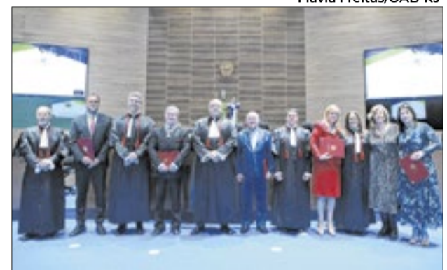
Solenidade foi realizada nesta segunda-feira, 8 de junho