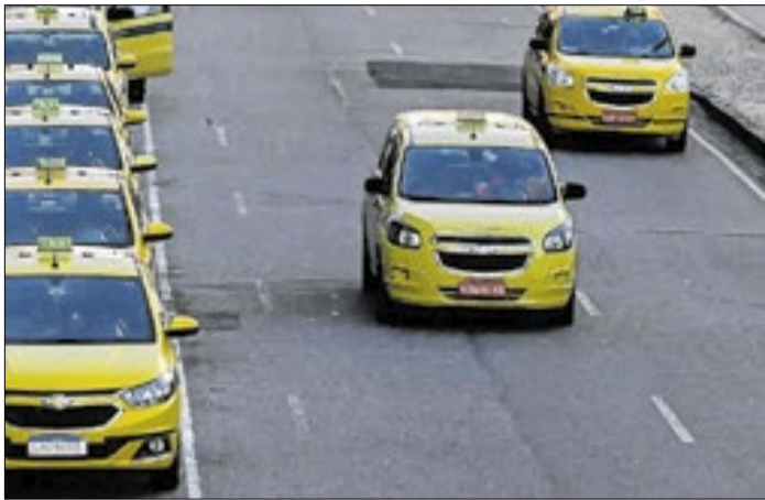
Ação do MPT apontava suposta fraude em contratos