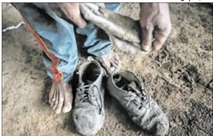
Três trabalhadores foram resgatados em fazenda no Pará