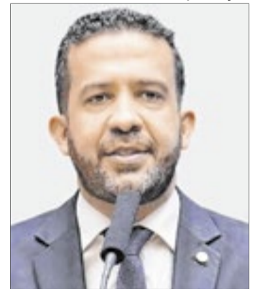
Processo envolve publicações feitas por André Janones