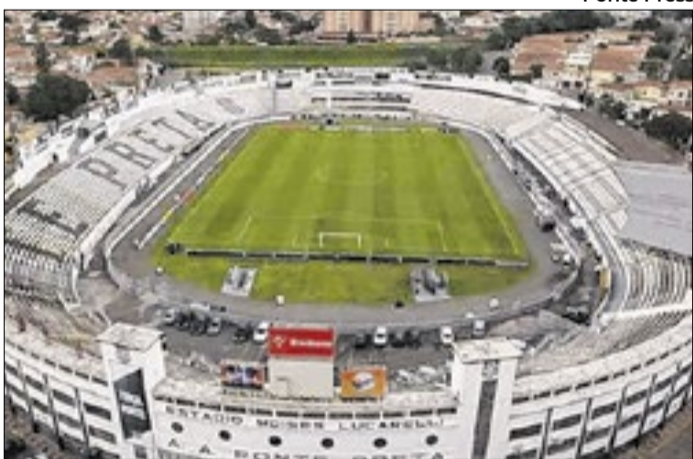
O estádio Moisés Lucarelli, casa da Ponte Preta