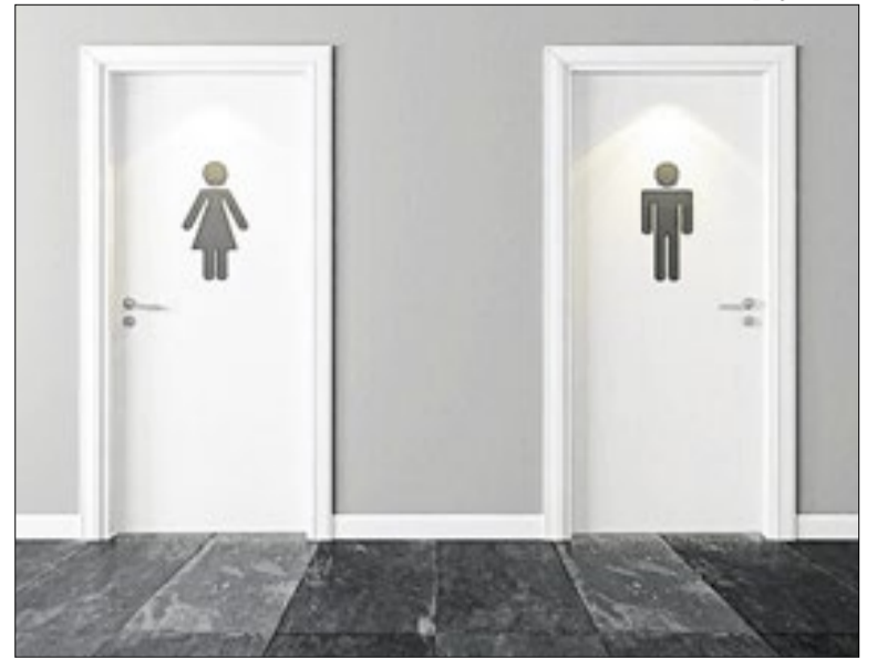
Uso do banheiro no expediente será tema de Audiência

A investigação ocorre devido a uma nota da Procuradoria Federal dos Direitos do Cidadão, que trata do assédio judicial contra jornalistas e comunicadores. Prática caracterizada pelo uso do sistema de Justiça para intimidar ou dificultar a atuação da imprensa, principalmente em temas de interesse público.