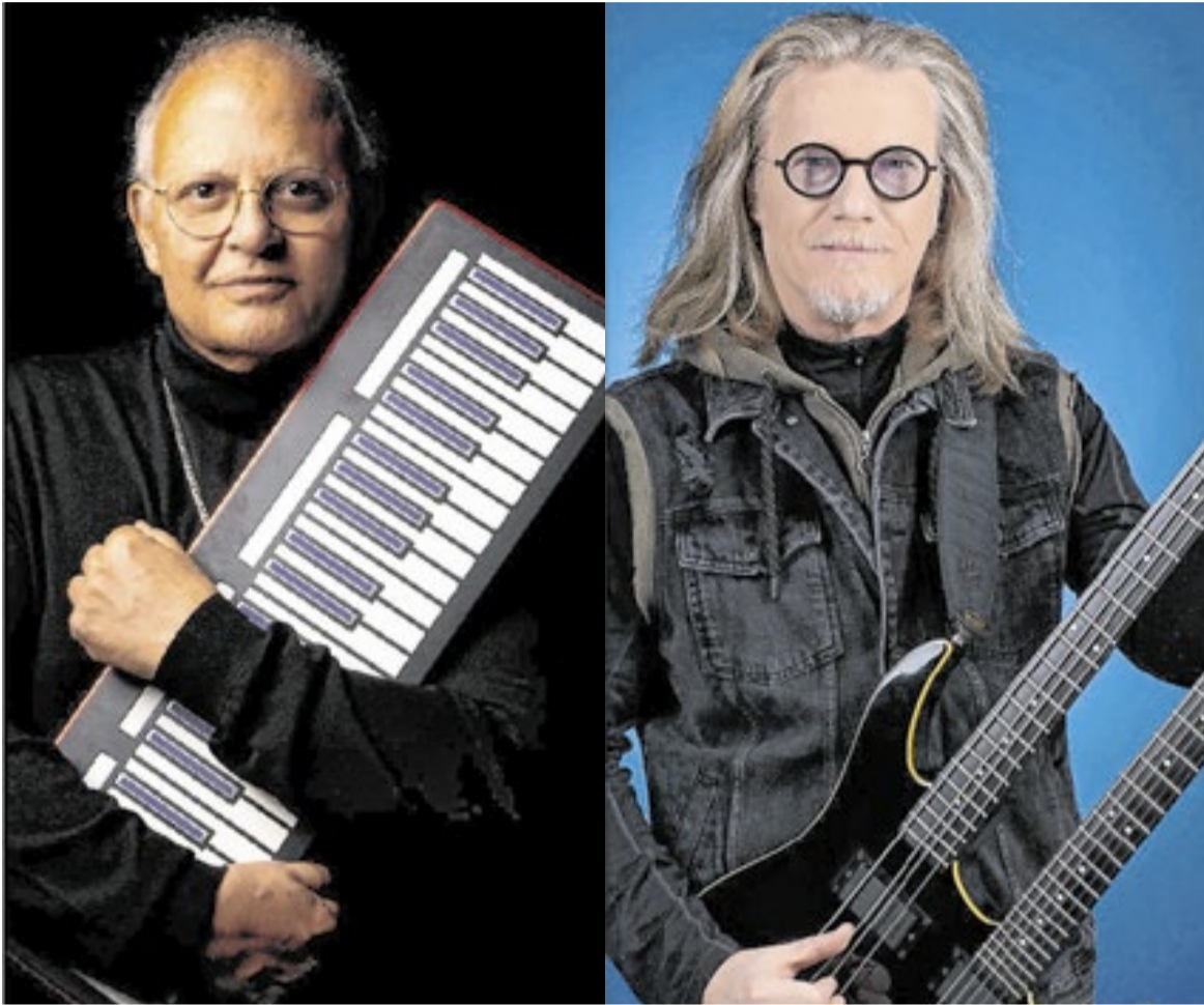
Guilherme Arantes se apresenta em Campinas e Humberto Gessinger em Jundiá

Reconhecido como um dos principais hitmakers da MPB e do pop nacional, Guilherme Arantes construiu ao longo de cinco décadas uma trajetória marcada por canções que atravessaram gerações. No show comemorativo “50 Anos – Luz”, o artista revisita momentos marcantes de sua carreira, reunindo músicas que se tornaram trilha sonora da vida de milhões de brasileiros. Arantes é um dos poucos pianistas brasileiros a integrar o hall da fama da secular fabricante teuto-americana de pianos Steinway & Sons, estando em companhia de nomes como Guiomar Novas, Franz Liszt, George Gershwin e Duke Ellington.