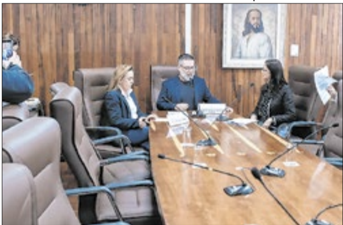
Ao todo, 14 categorias serão premiadas pela Comissão