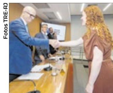
O corregedor regional eleitoral e vice-presidente, desembargador Fernando Cerqueira Chagas, cumprimentou todos os empossados