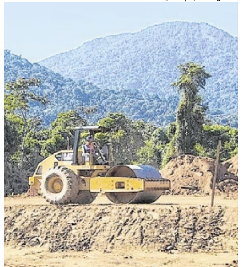
Aumento da população flutuante pressiona sistema local

Segundo cronograma, a primeira etapa da estrutura deverá ser concluída até o fim de 2027. A conclusão total está prevista para 2029, quando a usina deverá entrar em operação plena e passar a integrar de forma permanente o sistema de abastecimento de Ilhabela, ampliando a capacidade de atendimento.