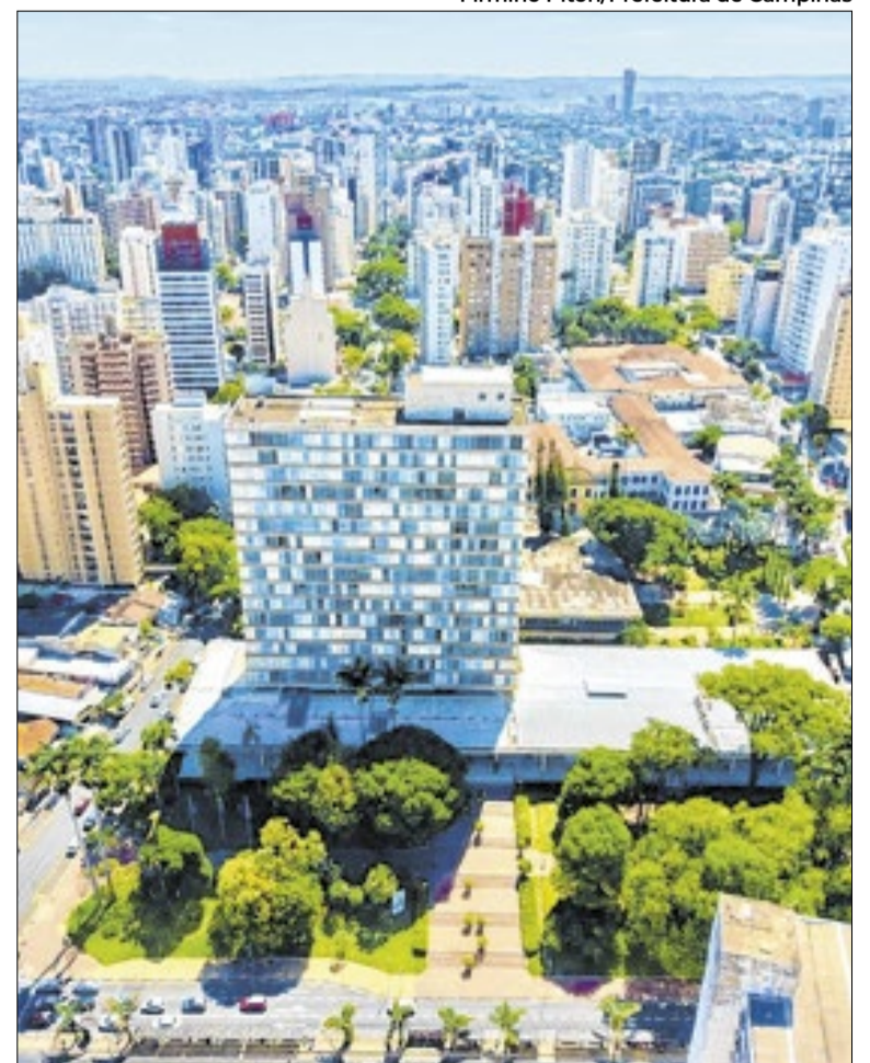
Refis contempla atividades de prestação de serviços do ISSQN

Além do hotsite do programa ( campinas.sp.gov.br/refis ), os contribuintes que tiverem dúvida podem entrar em contato com a Prefeitura pelos canais de atendimento da Secretaria de Finanças. Chat via WhatsApp: (19) 98437-4700. Disponível 24h por dia, todos os dias (atendimento automatizado); e, das 8h às 16h (atendimento humano), em dias úteis. Atendimento telefônico: 19 3755-6000. Disponível das 8h às 18h, em dias úteis.