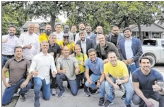
Encontro no Texas reuniu três deputados paulistas