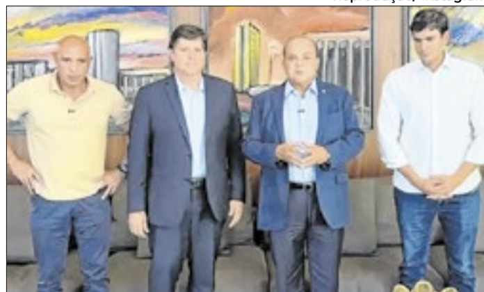
Ibaneis anunciou rompimento com Celina Leão