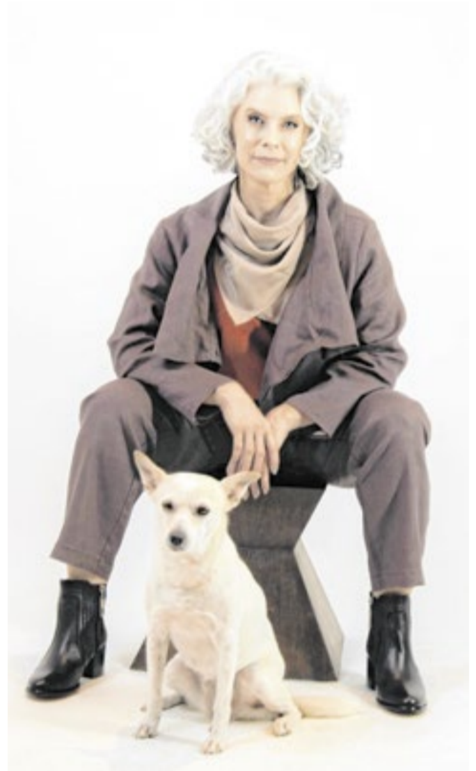
Look da Eme Elle, uma das marcas participantes

Já em Jundiá, o cantor e compositor Humberto Gessinger leva o show de encerramento da turnê “Acústicos Engenheiros do Hawaii”, nesta sexta-feira (12), às 22h, no Clube Jundiáense, com a realização da Oceania Eventos. A noite marca a despedida definitiva do projeto que revisita dois álbuns fundamentais na trajetória do artista: “Acústico Engenheiros do Hawaii” e “Acústico Novos Horizontes”. O espetáculo integra a reta final da turnê e coloca Jundiá entre as cidades escolhidas para receber esse momento especial da carreira do cantor. No palco, o formato acústico aproxima o artista do público e valoriza versões intimistas de canções que atravessaram diferentes fases dos Engenheiros do Hawaii e da trajetória solo do músico.