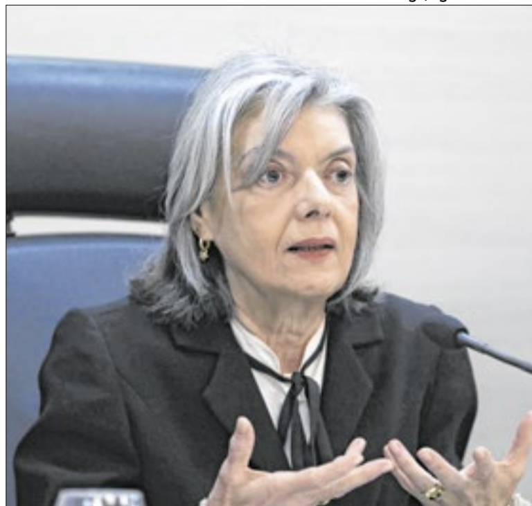
Cármén Lúcia: “tragados pela tecnologia”