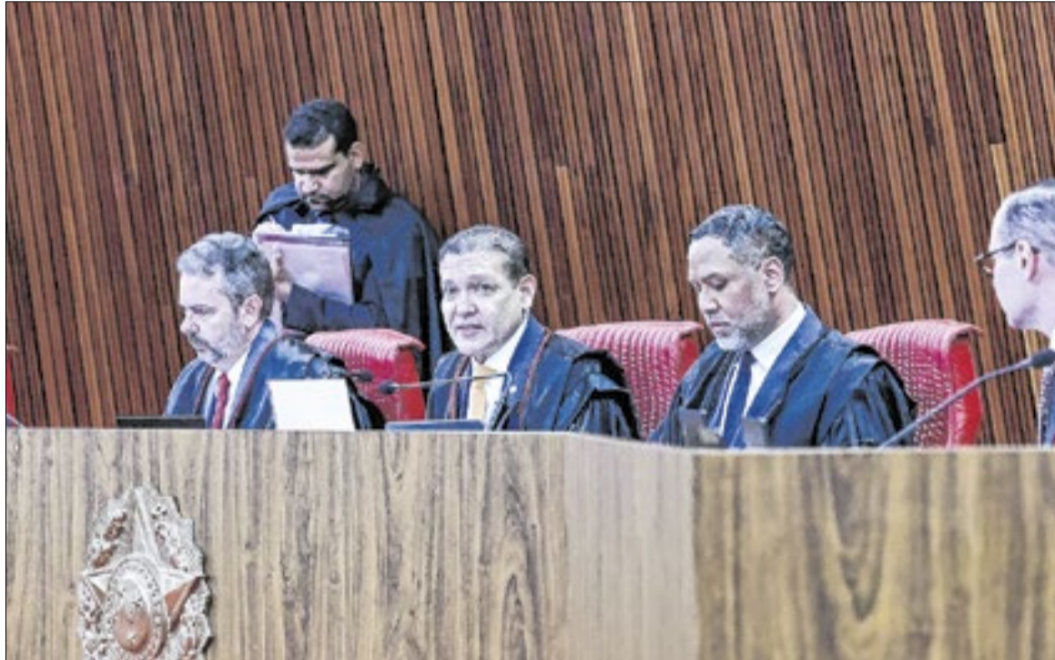
Nunes Marques quer estabelecer padrão para as pesquisas

A intenção do presidente do TSE é utilizar o julgamento para balizar futuras pesquisas, estabelecendo o que a Corte Eleitoral aceitará ou não. “Aprofundaremos nossos estudos para que eles possam colaborar para que se tenha um padrão [sobre as pesquisas]”, disse Kassio.