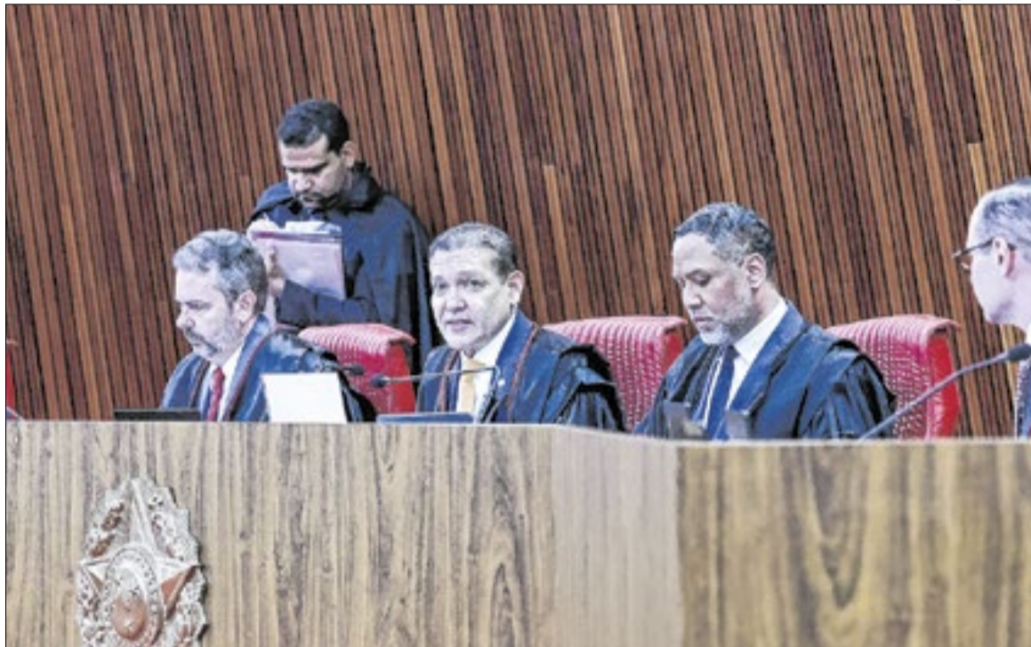
Nunes Marques quer estabelecer padrão para as pesquisas

A intenção do presidente do TSE é utilizar o julgamento para balizar futuras pesquisas, estabelecendo o que a Corte Eleitoral aceitará ou não. “Aprofundaremos nossos estudos para que eles possam colaborar para que se tenha um padrão [sobre as pesquisas]”, disse Kassio.