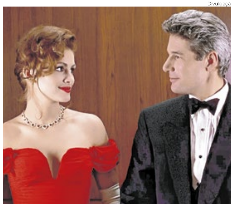
Olhe para seu benquerer como Julia Roberts e Richard Gere se miravam em ‘Uma Linda Mulher’, esta noite no Estação Gávea

gunda edição que abre telas nesta terça-feira, num “esquenta” para o 12 de junho. Abre com “Conto de Verão” (1986), de Éric Rohmer (1920-2010), no Estação Rio, e com o oscarizado “Aconteceu Naquela Noite” (1934), de Frank Capra (1897-1991), no Estação Gávea, ambos às 14h.