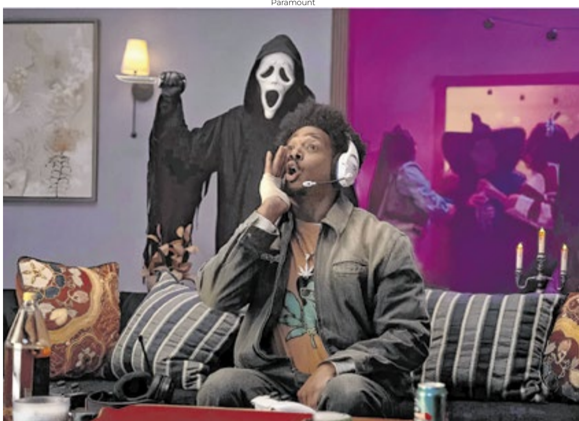
Os Wayans mandam o f... para correção política festejando o êxito da mais nova versão de ‘Todo Mundo Em Pânico’

Novo ‘Todo Mundo Em Pânico’, comemorativo dos 26 anos da franquia dos irmãos Wayans, ganha de lavada do longa do He-Man, apostando no escracho contra a ‘correção política’