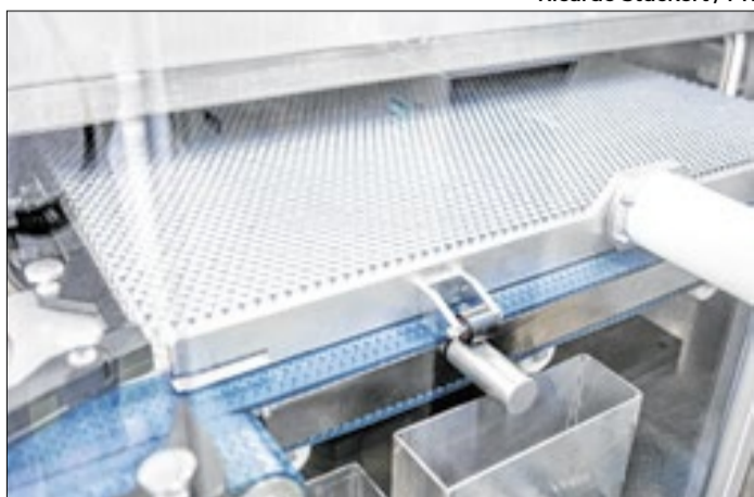
Foram registrados dois óbitos