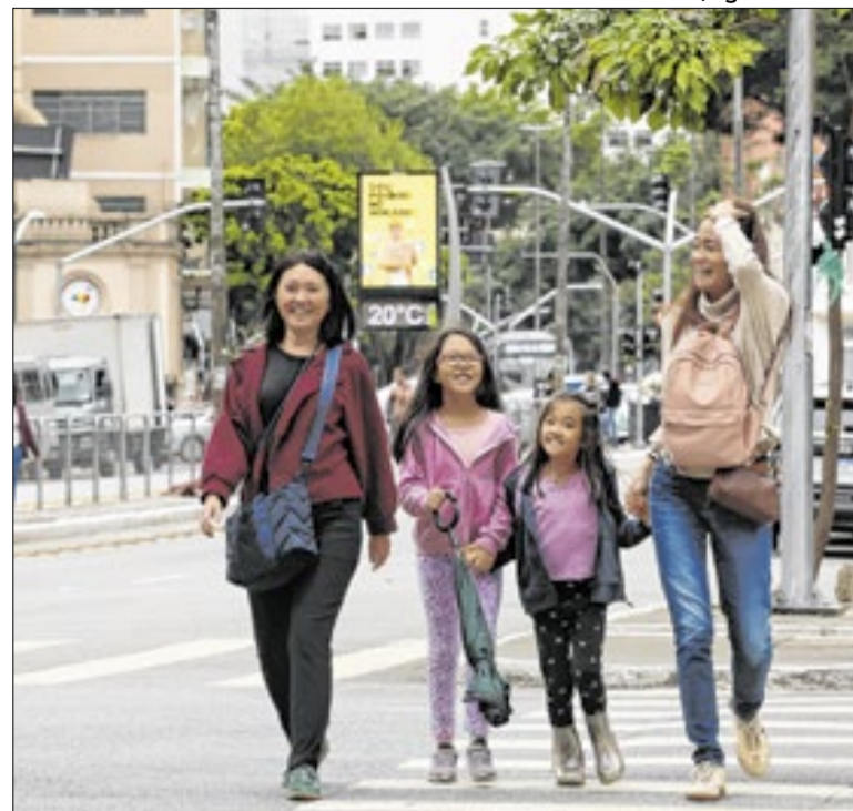
Médicos explicam como atravessar a estação com saúde

A plataforma on-line é gratuita e acessível em dois formatos – site ou aplicativo. É possível avaliar o grau de conhecimento; montar trilha de aprendizagem (aula e reforço); testar conhecimento a cada módulo; tirar dúvidas e treinar a conversação. Os alunos também podem participar de comunidades.