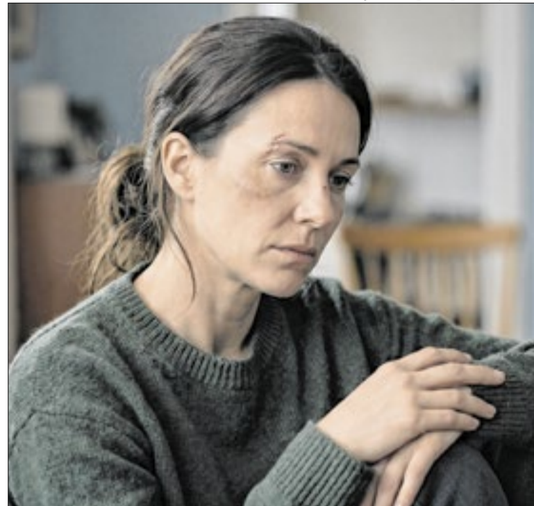
351 mil mulheres pediram medida protetiva em 2026

Com a decisão, profissionais que atuam em atividades de risco, como trabalhadores de minas subterrâneas e mergulhadores de plataformas de petróleo, poderão se aposentar após cumprir o tempo mínimo de contribuição exigido para cada atividade. O entendimento vencedor foi apresentado pelo ministro André Mendonça.