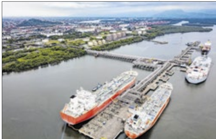
Alemoa será focado em cargas de granéis líquidos e sólidos