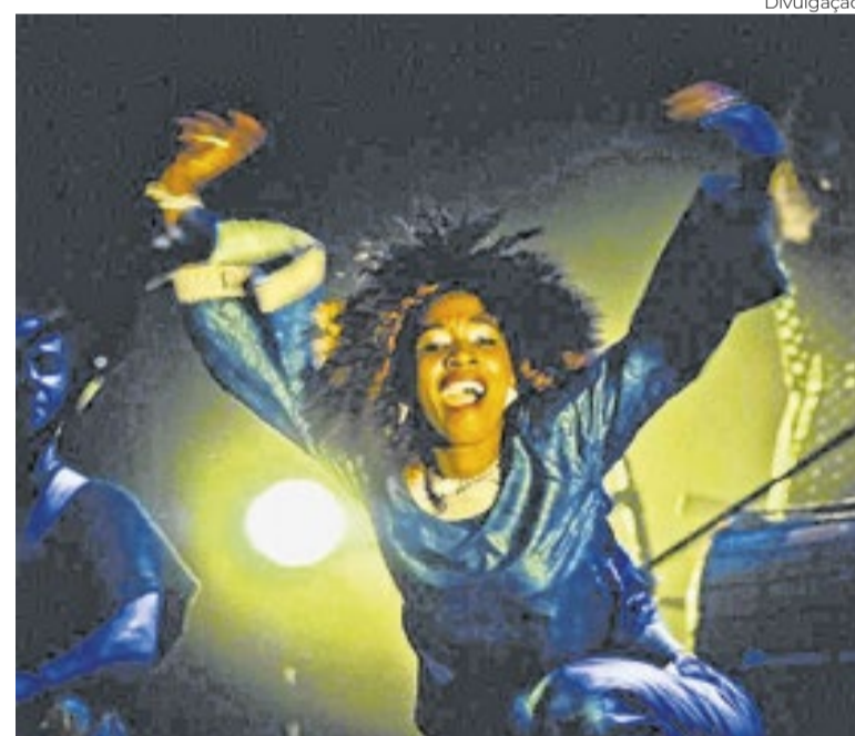
Mostra Cultura Candanga reúne tradições

✱Após temporada de sucesso em Taguatinga e no Plano Pilo-