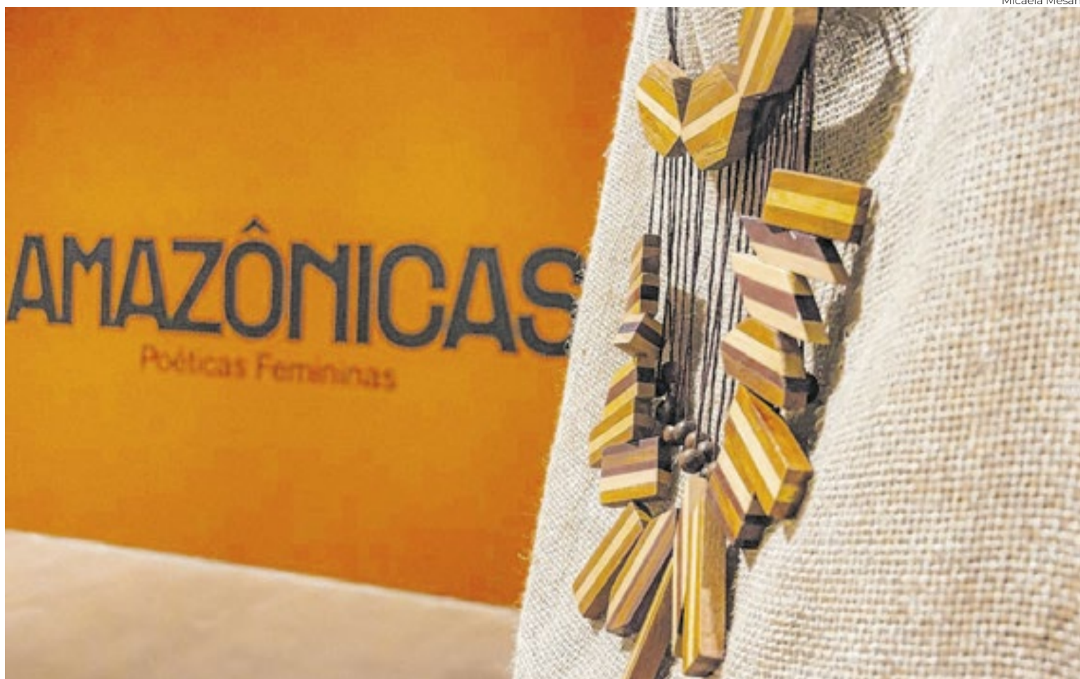
Arte e tecnologia proporcionam experiência visual e imersiva para quem assistir à exposição