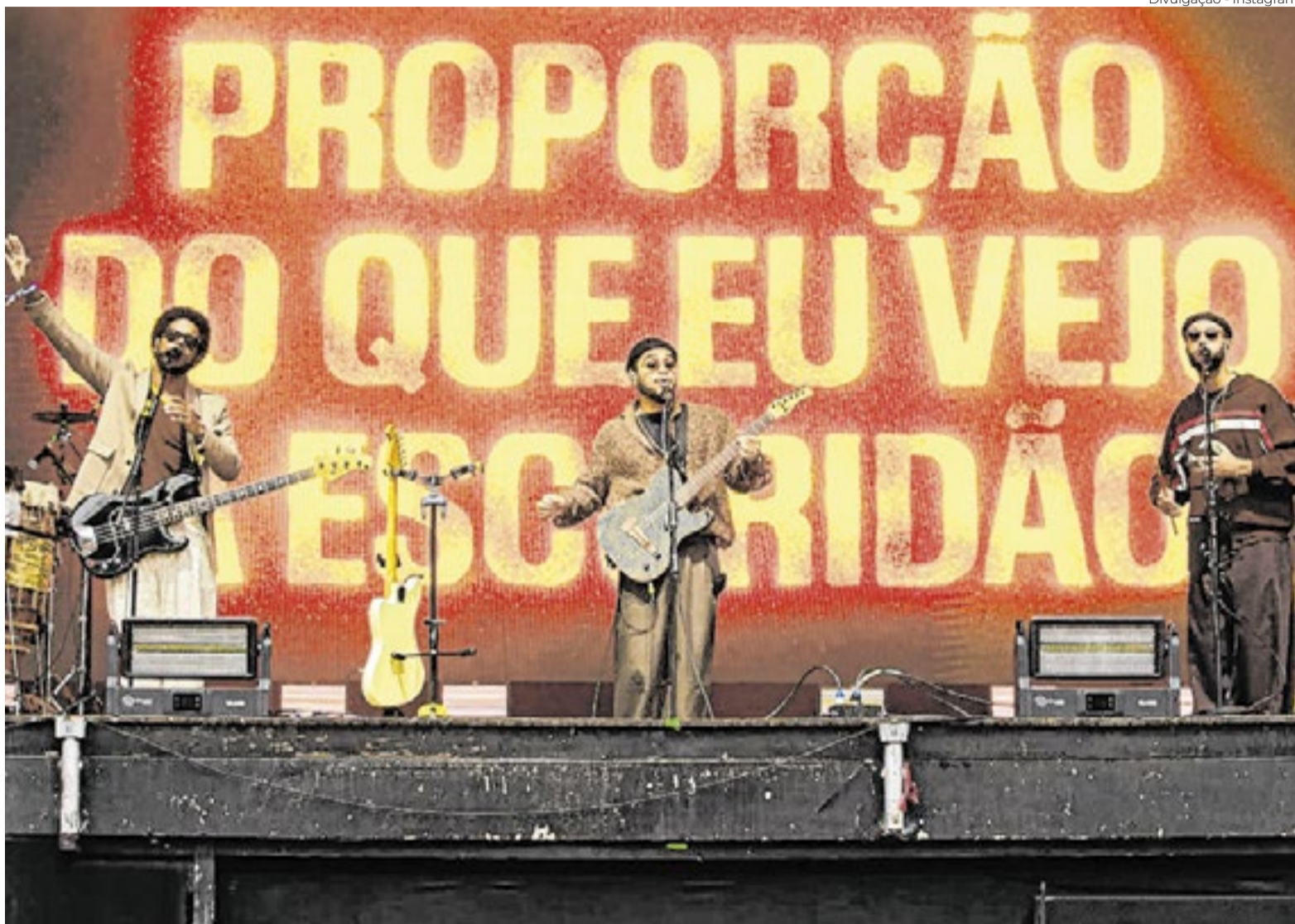
Show traz músicas do novo álbum em homenagem a Preta Gil

✱O Pavilhão de Exposições do Parque da Cidade recebe a 33ª edição da ExpoTchê, evento que celebra as tradições da cultura gaúcha. O festival contará com uma programação para toda a família, com shows da banda