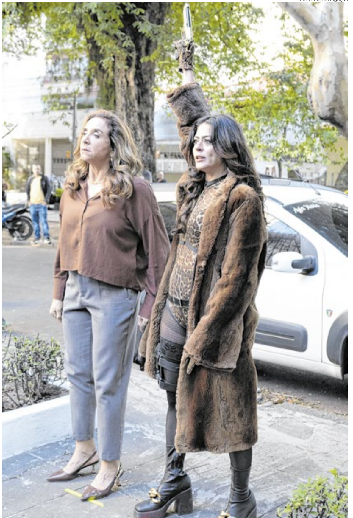
A escritora Viviane conta com o auxílio de sua femme fatale, a Agente Sedução (Carol Castro), para enfrentar o Mal