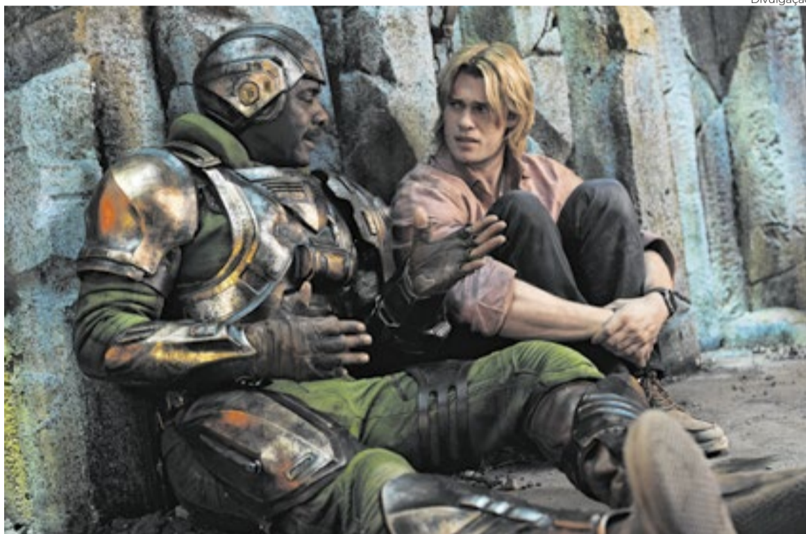
Duncan (Idris Elba) dá ao Príncipe Adam (Nicholas Galitzine) instruções de combate no divertido (mas esquizofrênico) ‘Mestres do Universo’

dução, orçada em cerca de US$ 170 milhões) é uma linha de bonecos, que a Mattel pôs à venda em 1982, a explorar os signos da ficção capa &