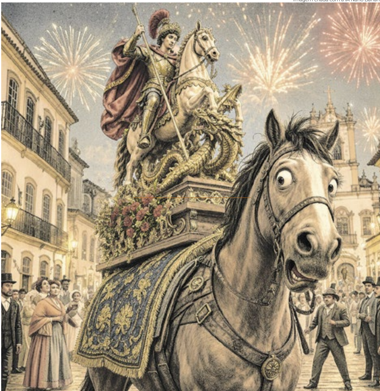
Imagem criada com a IA Nano Banana

H á uma injustiça histórica que precisa ser reparada. No Rio de Janeiro dos séculos XVIII e XIX, quando Corpus Christi era a maior festa pública da cidade e a procissão do Corpo de Deus transformava as ruas do Centro num grande teatro a céu aberto, havia um personagem indispensável que acabou esquecido pelos livros: o cavalo de São Jorge. O santo ganhou igrejas, velas, feriado, samba, devoção popular e milhões de fiéis. O cavalo ganhou o silêncio dos arquivos. O que é curioso. Porque, se formos rigorosos, era ele quem corria os maiores riscos.