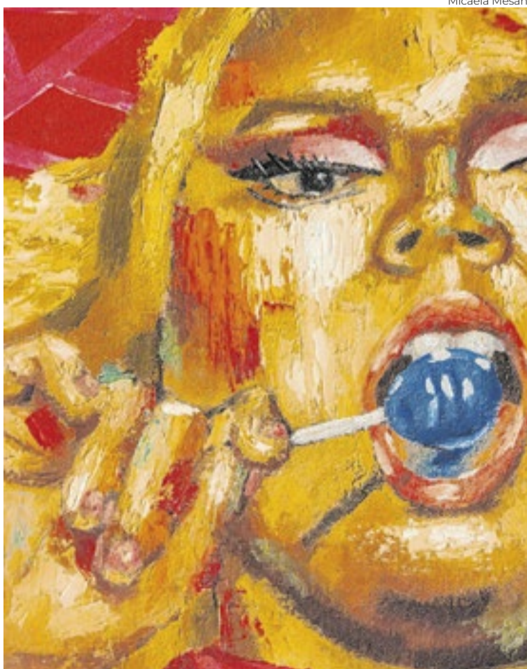
21 artistas fazem parte da mostra no CCBB

No texto curatorial, Sissa Aneleh destaca que o título da exposição contém a palavra “AMA”, presente no início do nome Amazônicas. Segundo a curadora, o termo funciona como um conceito orientador da mostra, relacionando a produção artística feminina à reflexão sobre pertencimento, território e preservação ambiental.