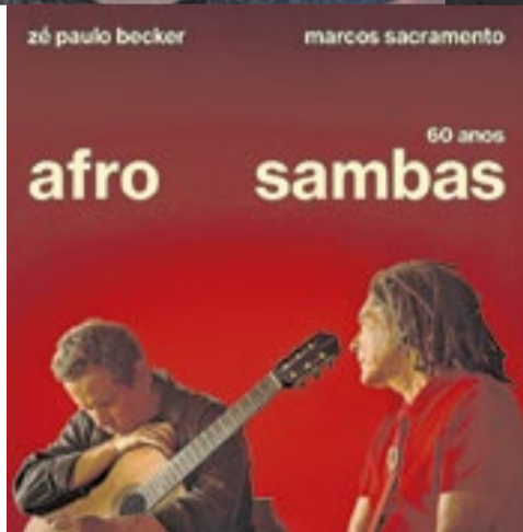
Capa de os Afro-Sambas 60 Anos e a capa do álbum original, de 1966, lançado pela gravadora Forma

Sacramento e Becker partem da formação essencial que estrutura o original — a força bruta da voz e do violão. O novo álbum revisita as oito canções do disco de 1966 (“Canto de Ossanha”, “Berimbau”, “Tristeza e Solidão”, “Bocoché” e outras) e incorpora quatro compo-