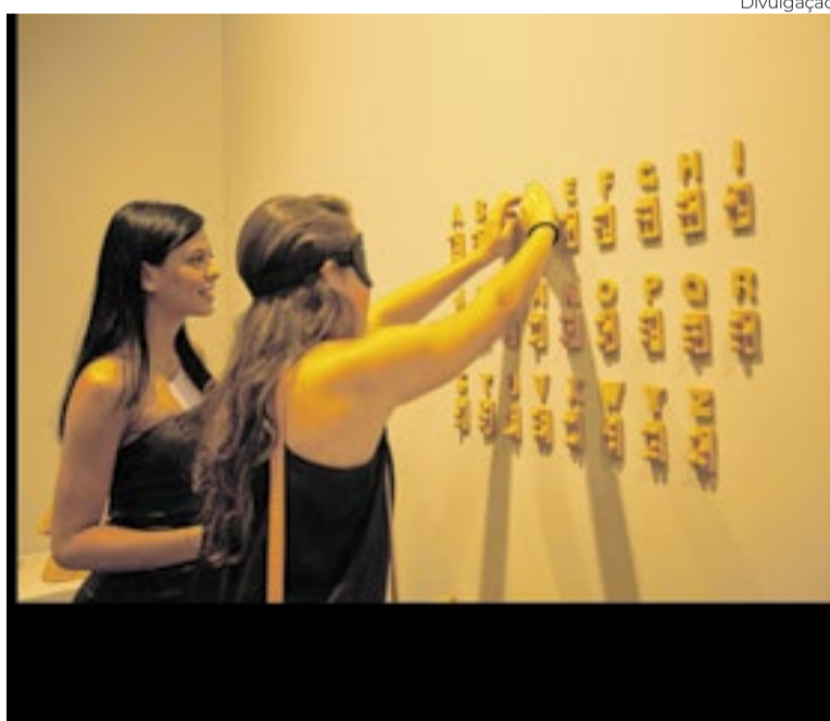
4º Festival de Cultura Inclusiva

Nenhum de Nós, do cantor Vitor Kley e da Família Ortaça, além de feiras gastronômicas e de empreendedorismo. O evento ocorre de 4 a 14 de junho. Os ingressos são nos valores de R$ 30 e R$ 15 (meia).