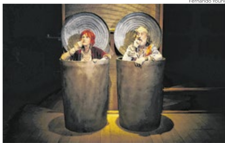
“Fim de partida” é um dos maiores clássicos de Beckett

“O Beckett sempre foi um dos meus autores favoritos, foi um dos primeiros grandes autores que eu conheci na minha ju-