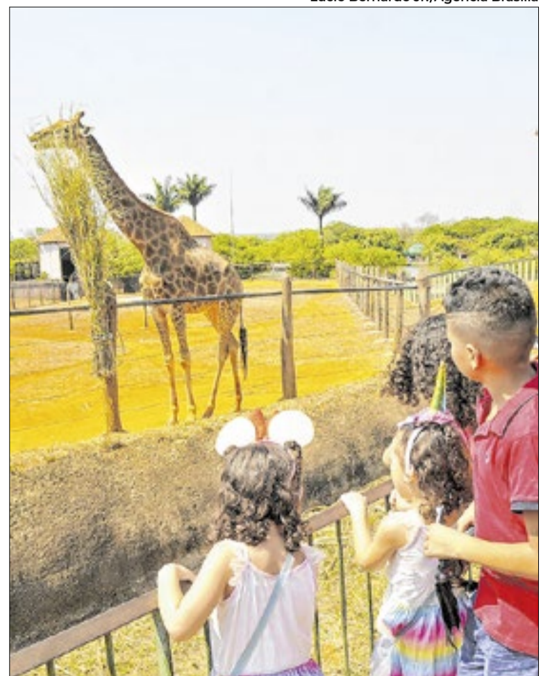
Horários diferentes para serviços públicos, culturais e de lazer

Já o Museu Nacional da República, o Museu de Arte de Brasília, o Museu Vivo da Memória Candanga, a Biblioteca Nacional de Brasília e outros equipamentos administrados pela Secretaria de Cultura e Economia Criativa ficarão fechados no período.