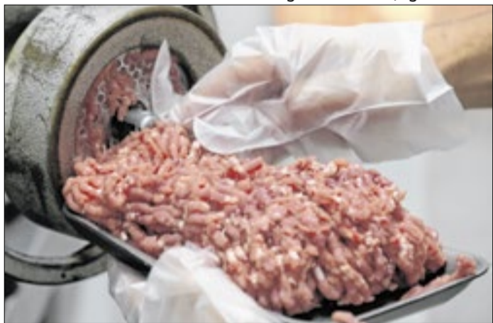
China classificou Brasil como livre de aftosa