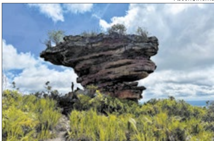
Feira de Santana receberá o encontro dos agentes