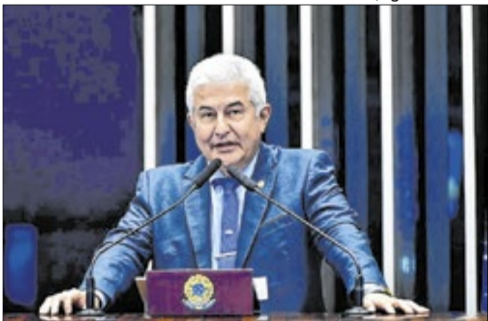
Senador Astronauta Marcos Pontes (PL-SP) assinou PEC