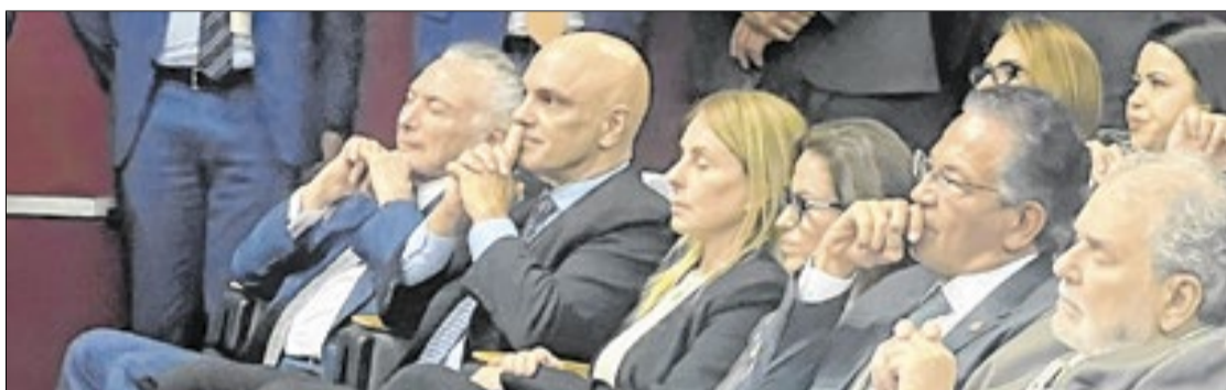
O ministro Alexandre de Moraes e o ex-presidente Michel Temer entre os presentes no painel de encerramento