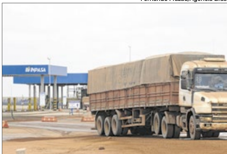
Para Unica e Bioenergia, tarifas seguem regras do Mercosul

A justificativa para aplicar a medida é uma investigação, aberta em julho de 2025, pelo Escritório do Representante Comer-