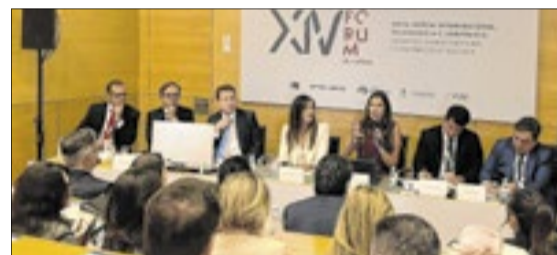
No terceiro dia, um dos painéis discutiu a inovação e aplicação de novas tecnologias na Saúde