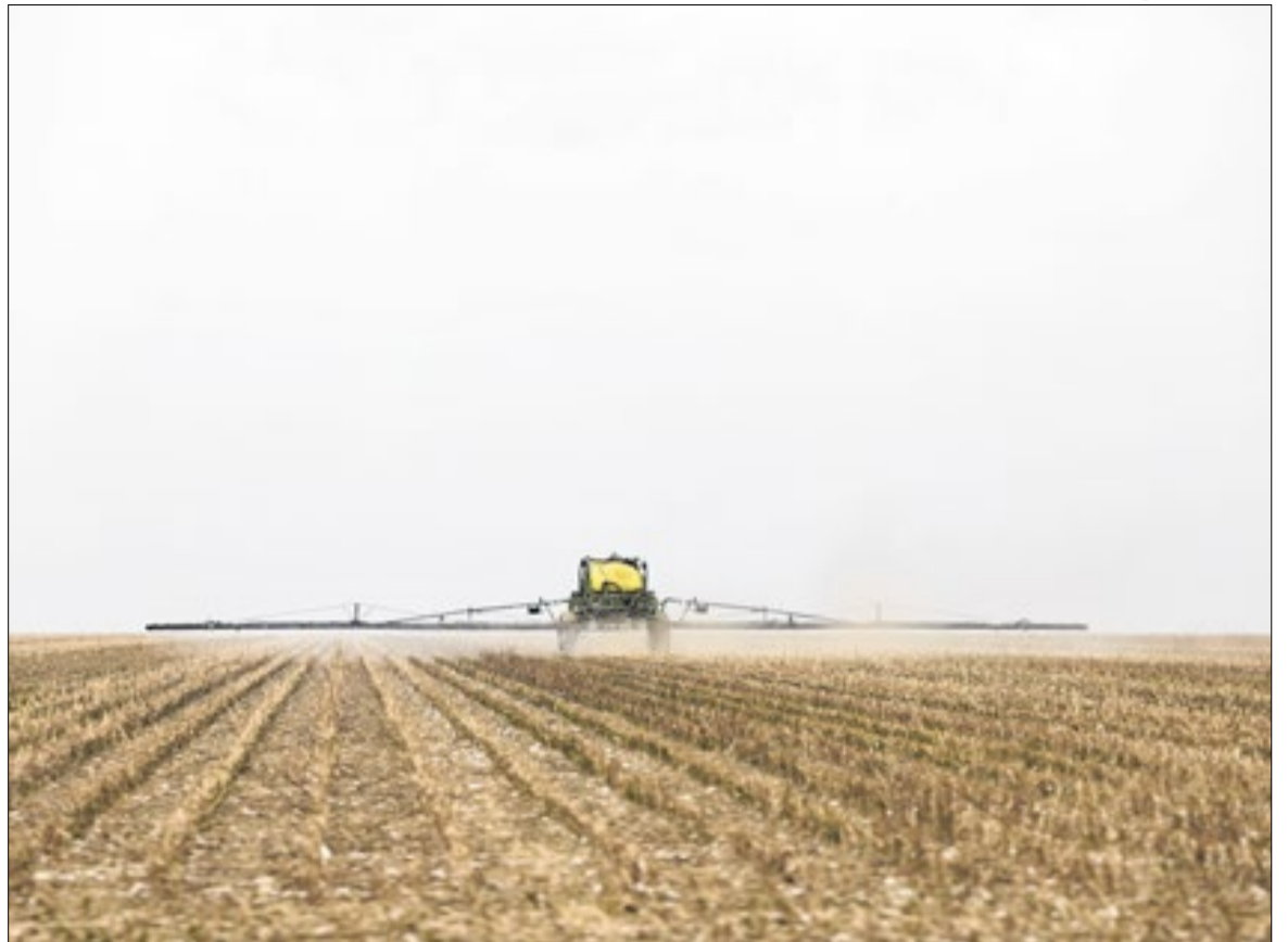
Exportações superaram as importações em US$ 7,823 bilhões

bilhões, alta de 3,2% na mesma comparação.