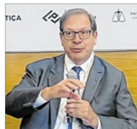
Ministro Luiz Felipe Salomão

■ O ministro Gilmar Mendes anunciou formalmente na cerimônia de encerramento, que o evento em 2027 ocorrerá de 5 a 7 de julho de 2027. Neste período, o ministro Salomão estará na presidência do STJ.