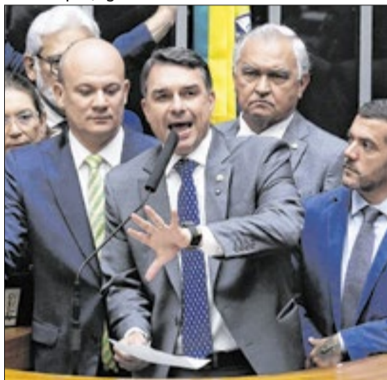
Lula na reunião ministerial: “Brasil não é republiqueta”