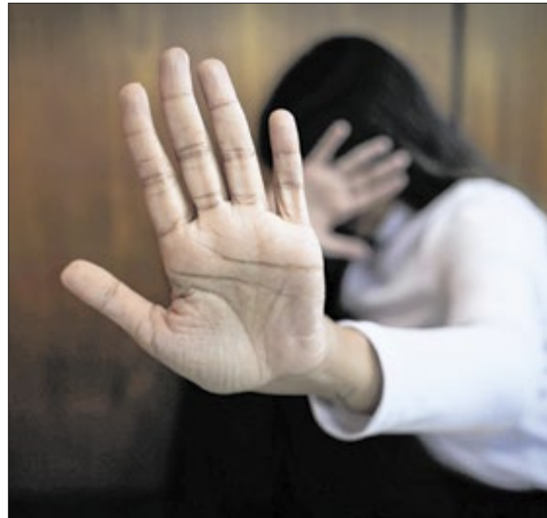
Ferramenta agiliza as ocorrências de violência contra mulher

A 33ª Expotchê abre nesta quinta-feira (4), no Pavilhão de Exposições do Parque da Cidade, com uma edição dedicada aos 400 anos das Missões Jesuíticas Guaranis, marco histórico e cultural do Sul da América Latina. Realizado pela Rome Eventos, o encontro segue até 14 de junho e reúne música, dança, gastronomia, cinema, artes cênicas e experiências que destacam o legado missionário e a presença da cultura gaúcha no Distrito Federal. A programação inclui shows da banda Nenhum de Nós, do cantor Vitor Kley, da Família Ortaça e de artistas regionais, além de apresentações de grupos de dança tradicional e números circenses voltados ao público infantil. A ambientação terá a reprodução das ruínas da Igreja de São Miguel Arcanjo, em estande da Secretaria de Turismo do Rio Grande do Sul, que também divulgará roteiros turísticos ligados às Missões, promoverá rodas de chimarrão e apresentará destinos de inverno e de enoturismo da Serra Gaúcha. O evento contará ainda com uma mostra audiovisual.