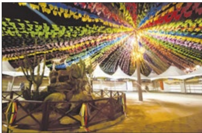
A festa tem o apoio e a participação do governo