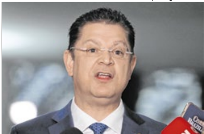
Para Sóstenes, candidato do PL é a solução