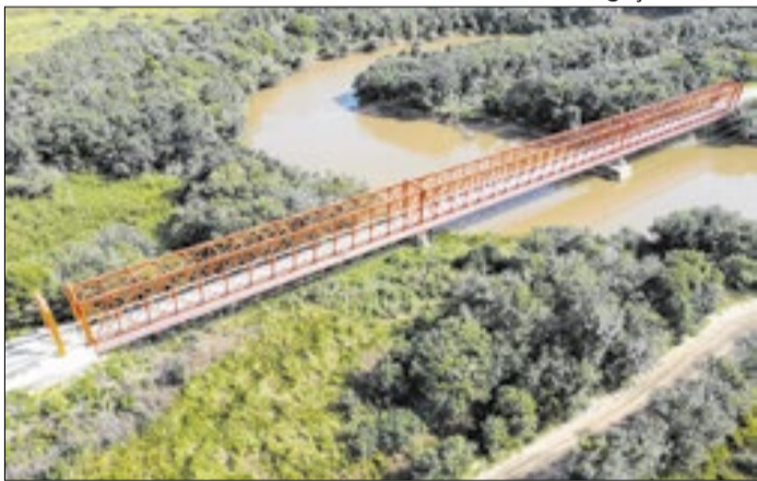
DER fará intervenção em obra neste fim de semana