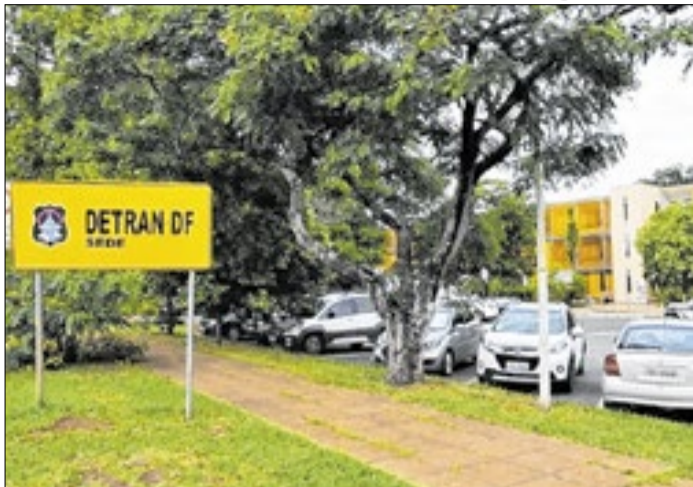
Antiga sede do Detran-DF, próxima ao Palácio do Buriti