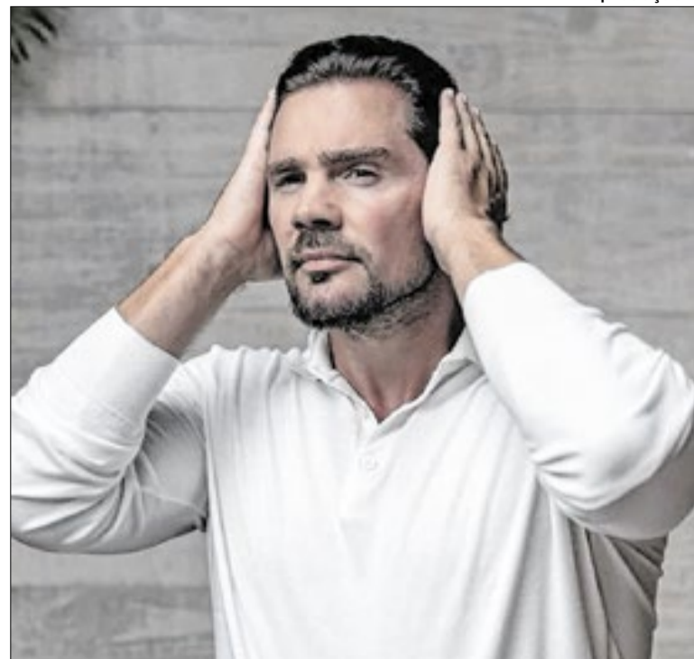
Vorcaro agora detalha relações com autoridades

Essa busca por alternativas é bem anterior ao tarifaço de Trump. Mas intensificou-se em ações do vice-presidente Geraldo Alckmin quando era ministro da Indústria e Comércio e de Jorge Viana na presidência da Agência Brasileira de Promoção de Exportações e Investimentos (Apex-Brasi). O que não elimina a negociação com os EUA. E Alckmin volta a esse jogo.