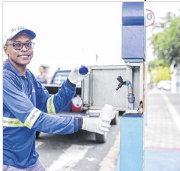
O resultado coloca a cidade dentro do padrão de excelência

A Carreta da Mulher Pernambucana ultrapassou 106 mil atendimentos e se consolidou como uma ponte entre o Sistema Único de Saúde (SUS) e as mulheres que enfrentavam dificuldades para realizar exames e acessar serviços especializados. A estrutura itinerante percorre as diferentes regiões do Estado.