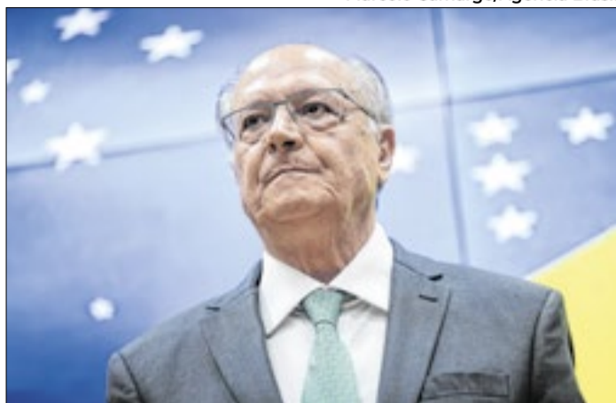
Alckmin volta a ter papel de destaque na negociação