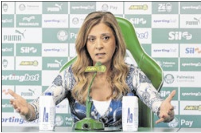
Leila Pereira é a atual presidente do Palmeiras