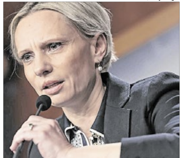
Deputada Victoria Spartz direcionou acusações ao Brasil

O Brasil foi citado diversas vezes ao longo da discussão como um dos principais concorrentes do agronegócio americano. Parlamentares favoráveis à emenda defenderam que as exigências ambientais impostas aos produtores dos EUA aumentam custos de produção e reduzem a competitividade do setor frente a países com regulamentações consideradas menos rigorosas.