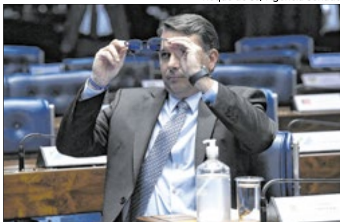
Senador tenta se desvincular de punições dos EUA