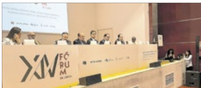
“Chegamos ao fim da décima quarta edição do Fórum de Lisboa com a certeza de que estivemos à altura do desafio que nos trouxe aqui”, afirmou o anfitrião, ministro Gilmar Mendes