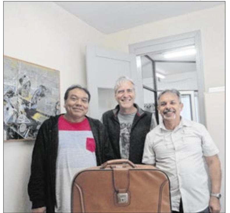
Pesquisadores preservam mais de duas décadas de registros

A Universidade Federal de Santa Catarina (UFSC) seleciona voluntários para uma pesquisa que avalia os efeitos da prática de yoga em pessoas com hipertensão arterial. O estudo é voltado a adultos com 40 anos de idade ou mais, de ambos os sexos, que utilizem até três medicamentos para controle da condição.