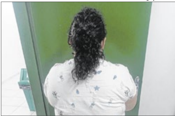
Suspeita fingiu ser adolescente e foi adotada por família