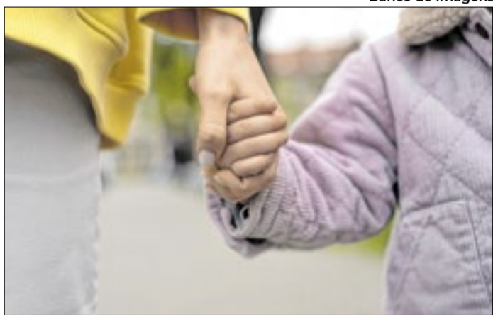
Inscrições abertas para o Serviço de Família Acolhedora