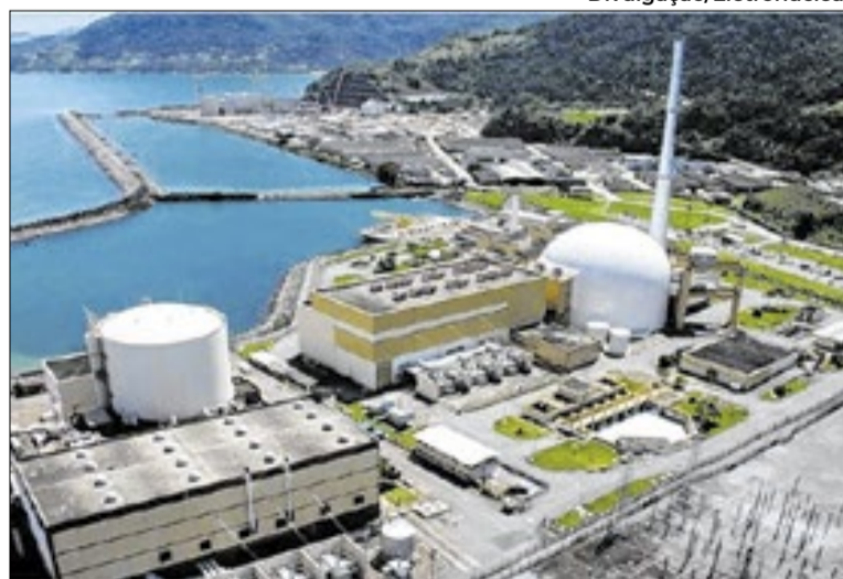
Planos visam dar continuidade às operações das usinas

A Diretoria de Instalações Radiativas e Controle (DIRC) da ANSN conduzirá a avaliação das medidas propostas à luz do arcabouço regulatório vigente. A Autoridade ressalta, contudo, que a eventual implementação