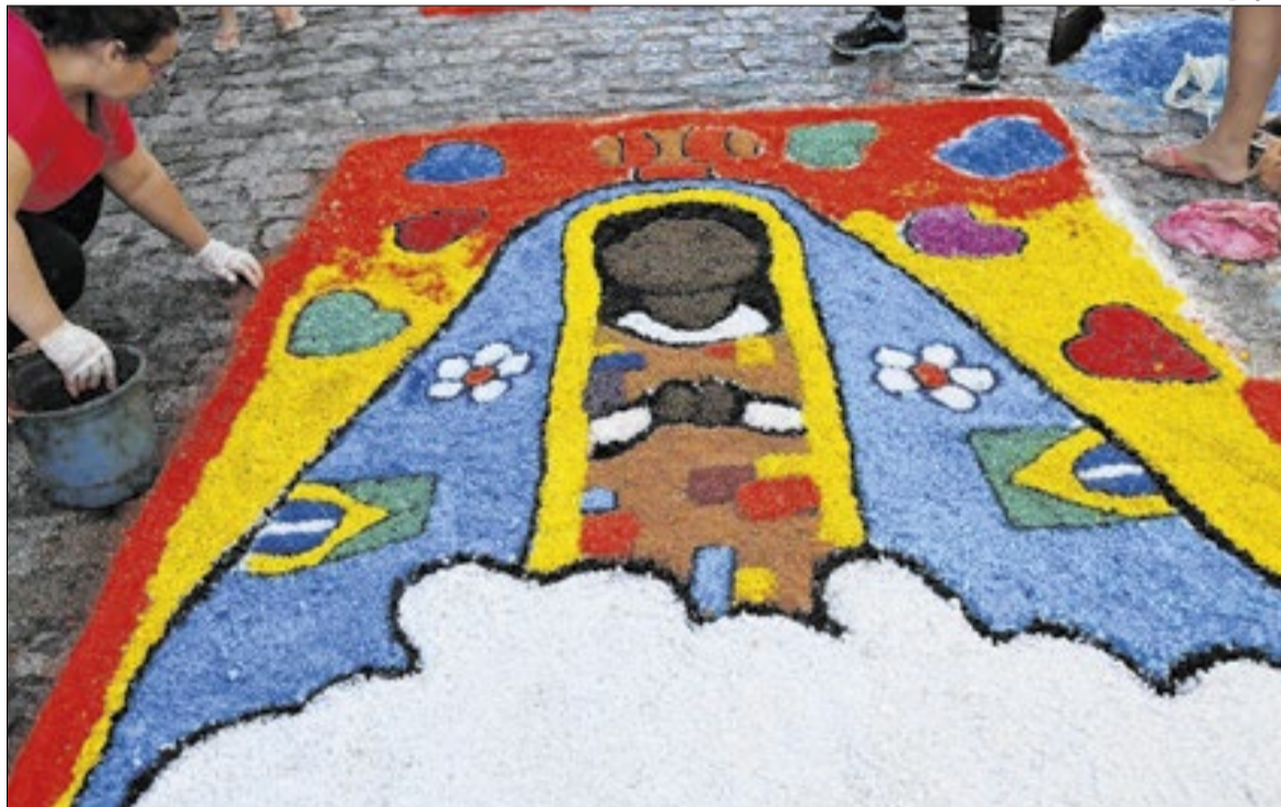
Tapetes ficam expostos nas ruas durante toda festividade

Além das atividades religiosas, os organizadores também promovem arrecadação de alimentos não perecíveis para famílias em situação de vulnerabilidade social. Mais informações podem ser obtidas junto