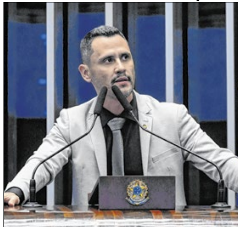
Cleitininho para Alcolumbre: “Paute essa PEC logo”

Outro senador do PL, Izalci Lucas (DF) apresentou emenda ao projeto que estende o benefício da isenção de imposto de renda aos policiais civis do Distrito Federal. O Senado abriu, em sua página, uma consulta pública sobre o projeto de Klan: ontem, 82,9% eram favoráveis à concessão do privilégio.