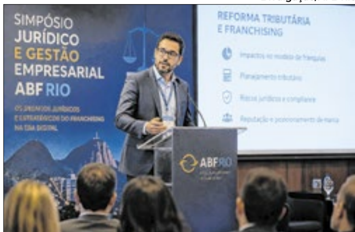
Simpósio Jurídico e Gestão Empresarial discute desafios