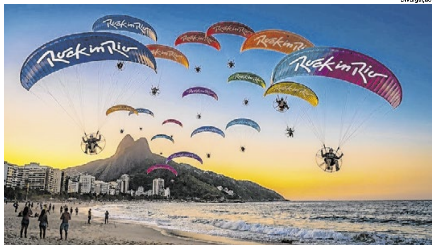
Ação será uma grande festa no céu do Rio de Janeiro

viço. Já os ingressos para o Comfort Zone terão valor de R$ 1.950 (inteira), R$ 975 (meia-entrada) e R$ 1.657,50 para clientes Itau Unibanco, com 15% de desconto.