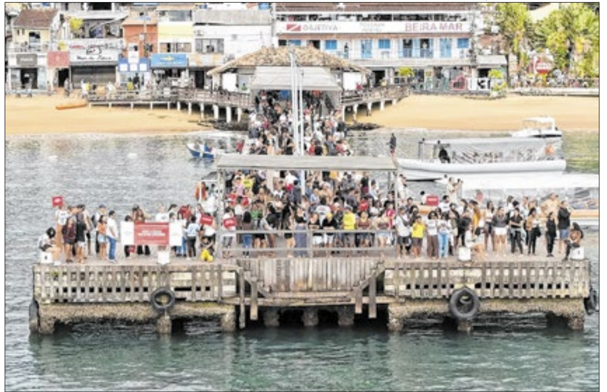
Manifestações são realizadas em Angra dos Reis desde o início da semana por causa de taxa

A decisão judicial produziu efeitos logo pela manhã, na Vila do Abraão, quando agentes da Polícia Civil foram