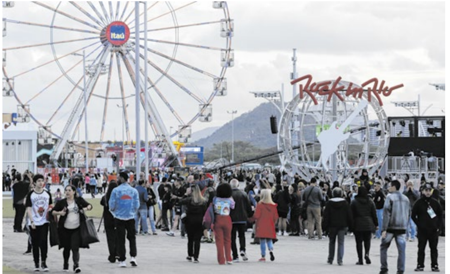
Projeção da Fundação Getúlio Vargas é de que o festival impactará em R$ 3,36 bilhões a economia

Os ingressos serão vendidos exclusivamente online, por meio da plataforma Ticketmaster Brasil. O ingresso de gramado custa R$ 870 a inteira, R$ 435 a meia-entrada e R$ 739,50 para clientes Itau Unibanco, e não há cobrança de taxa de ser-