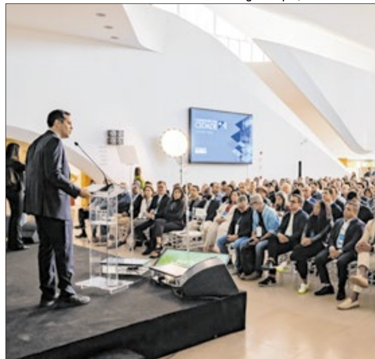
Investimentos de R$ 22 bi são divulgados ao conselho