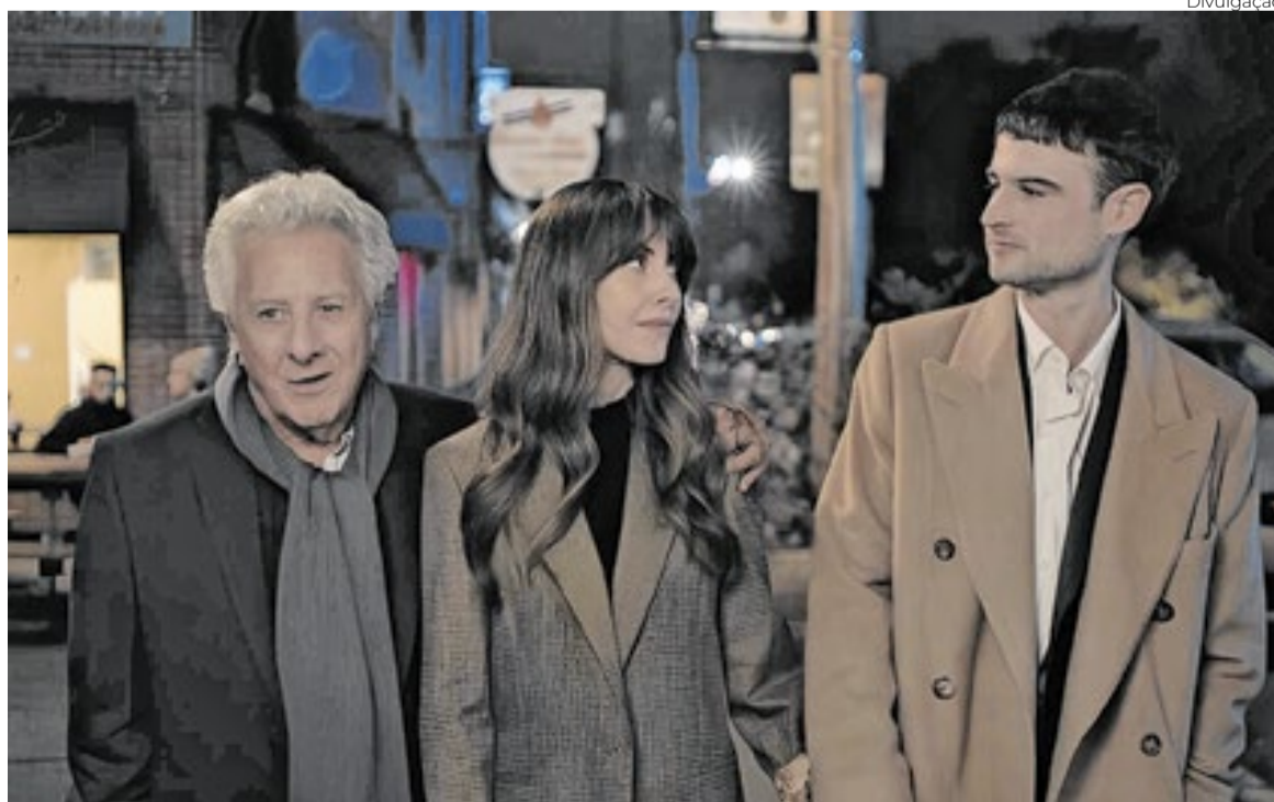
‘The Revisionist’ põe o gigante Dustin Hoffman entre Alison Brie e Tom Sturridge

Astros de peso como Dustin Hoffman, Emilia Clarke, Katie Holmes e Zach Braff buscam novos desafios para suas carreiras na seara indie dos EUA, que tem na maratona de NY uma vitrine