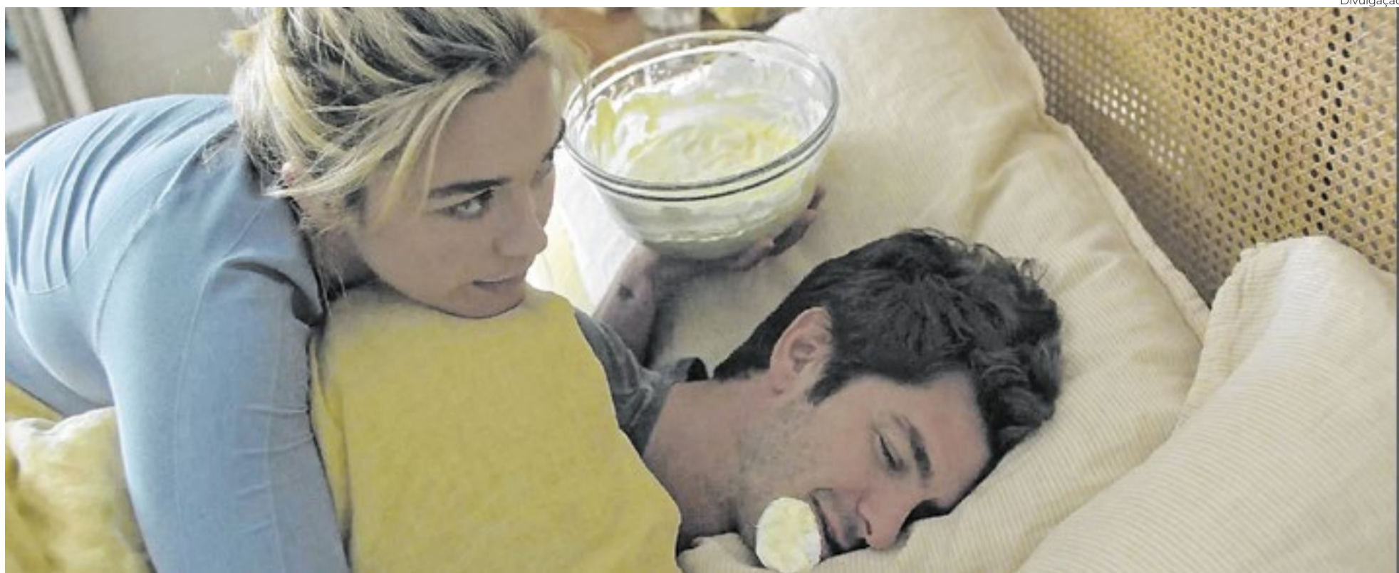
Almut (Florence Pugh e Tobias (Andrew Garfield) vivem uma paixão daquelas de dar nó no peito da gente