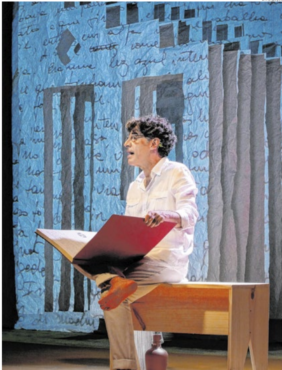
‘Autobiografia Autorizada’ reúne textos que Paulo Betti escreveu durante a adolescência e artigos publicados em jornal de sua cidade natal

Nascido em contexto rural, Betti é filho de uma camponesa analfabeta que se tornou empregada na cidade. Seu avó, imigrante italiano, trabalhava como meeiro para um fazendeiro negro — uma situação que o próprio ator destaca como inusitada. “Meu avó, por exemplo, era um imigrante italiano que trabalhava a meia para um fazendeiro negro. Veja, não é uma situação muito comum... eu ia para a roça e via a Casa Grande do ponto de vista da senzala”, relata Betti. Ele foi o décimo quinto filho, nascido dez