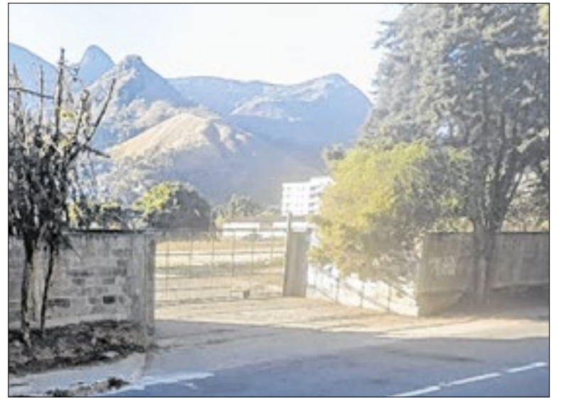
Órgão levou em consideração o histórico de desastres