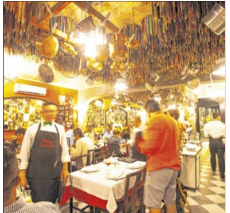
Turismo alcança maior nível de empregos da história

A CIBRA prepara a Casa Brasil para a Copa do Mundo de 2026, em Orlando. O espaço integrará o Soccer Celebration, promovido pelo Orlando City SC, e reunirá ações de negócios, relacionamento e promoção da cultura brasileira. A proposta é aproveitar o torneio como vitrine para marcas e destinos nacionais.