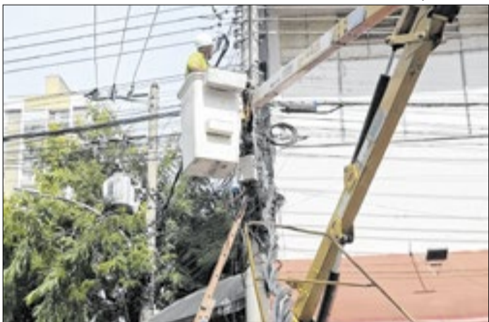
Foram substituídos e instalados 122 refletores