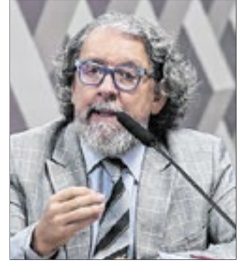
Advogado rebateu declarações do ministro Dario Durigan