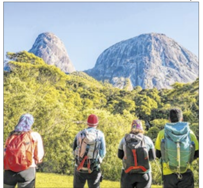
Estado é exemplo em qualificação e organização turística

A Prefeitura de Cabo Frio realizou uma operação de recuperação ambiental no Canal do Itajuru nesta terça (2). A ação integrada da Comsercaf, Secretaria de Meio Ambiente e Guarda Marítima retirou estruturas submersas, barcos abandonados e resíduos. O foco foi melhorar as condições ambientais e a segurança do local.