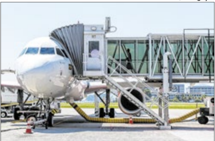
Queda no combustível reduz pressão sobre aéreas