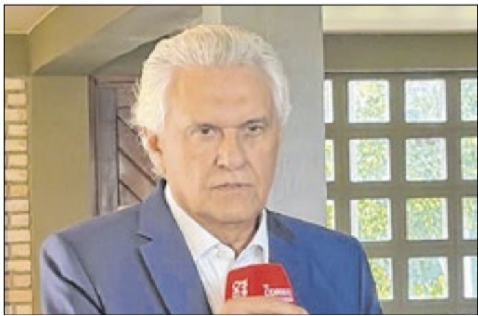
Ascensão de Caiado viraria novo desafio para Lula