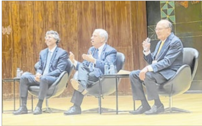
Gilmar Mendes durante painel que contou com Thomas Friedman, colunista do The New York Times; e André Esteves, Co-Fundador da Intel, Chairman do BTG Pactual, mediando o debate