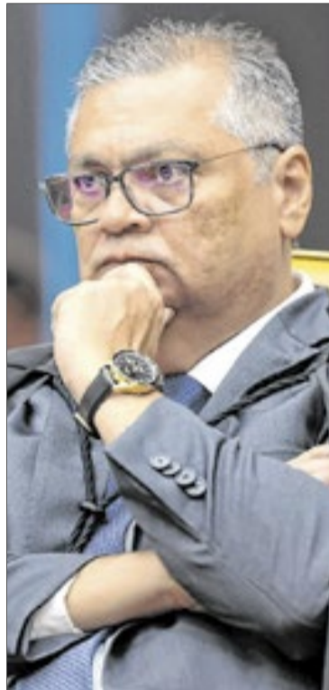
Decisão de Flávio Dino alerta Lula sobre a situação da CVM