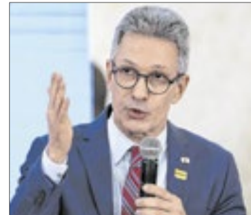
Romeu Zema é pré-candidato ao Planalto pelo partido Novo