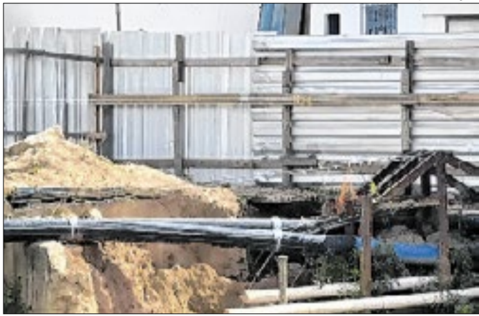
Paralisação das obras de implantação da nova ponte