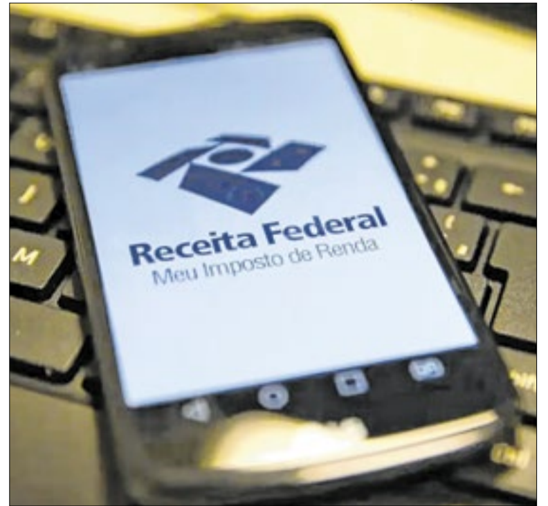
Contribuinte deve enviar declaração retificadora para corrigir os dados

O vice-presidente Geraldo Alckmin criticou a proposta dos Estados Unidos de impor tarifa de 25% sobre produtos brasileiros e classificou a medida como injusta. Segundo ele, o Pix é um "patrimônio nacional" e não será negociado. O governo brasileiro pretende buscar diálogo para evitar a taxação.