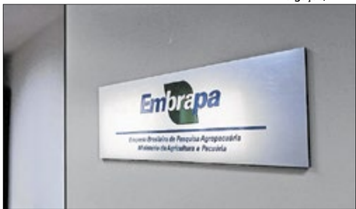
Estatel e Carrefour querem capacitar produtores rurais