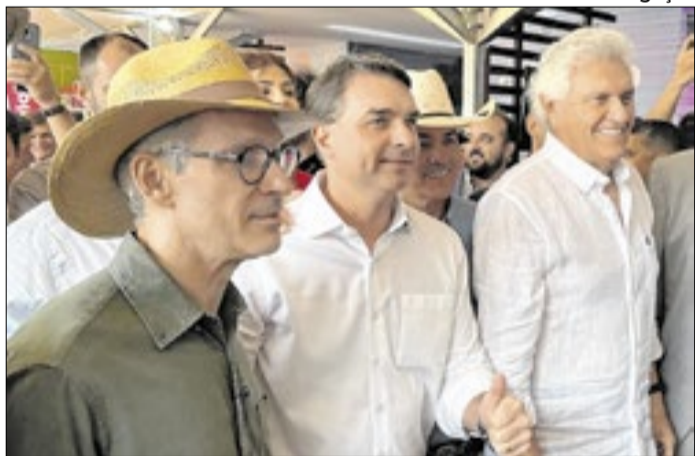
Zema, Flávio e Caiado em Belo Horizonte (MG)