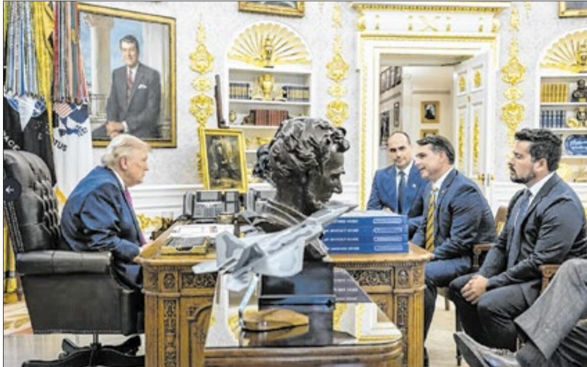
Truth Social-Donald Trump

A avaliação ajuda a explicar por que o encontro passou a ser tratado