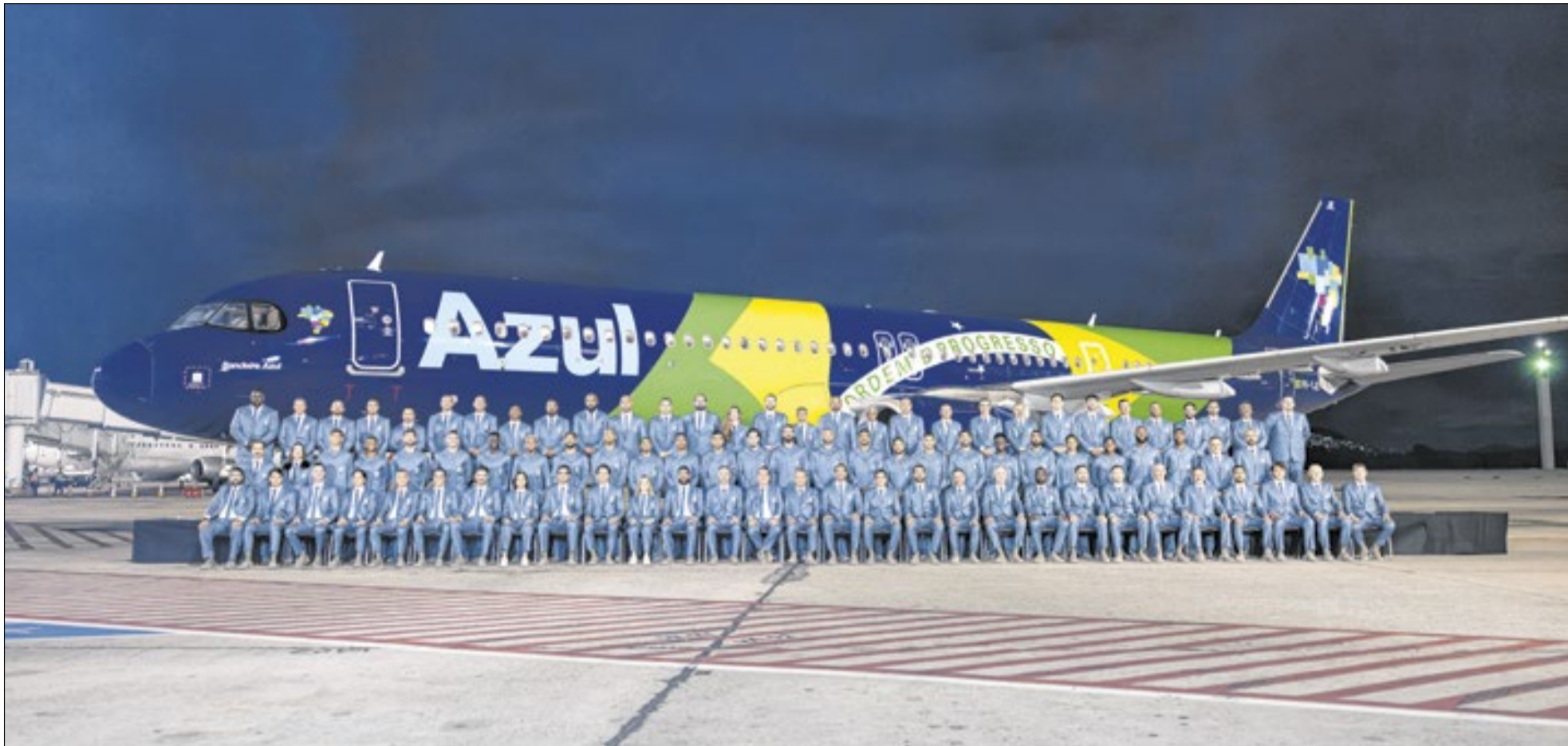
Seleção Brasileira tirou foto com o avião da patrocinadora, que sobrevoou a orla carioca no último fim de semana, rendendo imagens que correram o mundo