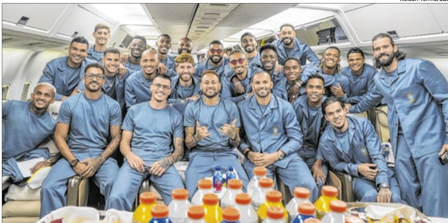
Transfermarkt coloca o Brasil na 6ª posição do ranking. Na foto, jogadores dentro de avião antes do embarque para os EUA

Levantamento da plataforma Transfermarkt também coloca o Brasil na 6ª posição entre as mais valiosas do mundo; Vini Júnior aparece no top 5 de jogadores