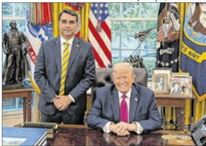
Flávio Bolsonaro com Donald Trump no Salão Oval