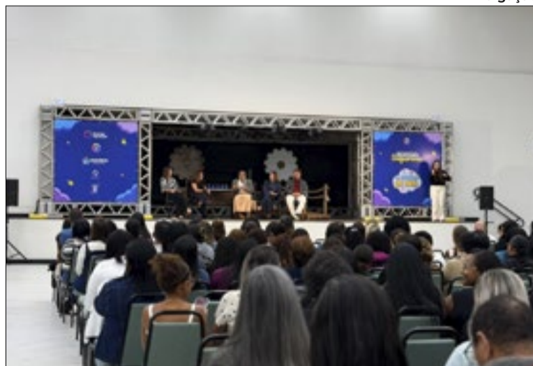
Ação integrou as atividades da formação da Metodologia CDRA

A programação contou com uma roda de conversa sobre o autismo, mediada por especialistas, proporcionando um momento de reflexão, diálogo e troca de experiências sobre inclusão, acolhimento e práticas pedagógicas direcionadas aos estudantes neurodivergentes. O encontro buscou ampliar o olhar dos profissionais sobre a importância de uma educação cada vez mais acessível, empática e inclusiva.