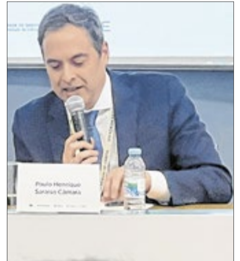
Economista e ex-governador de Pernambuco, Paulo Henrique Saraiva Câmara