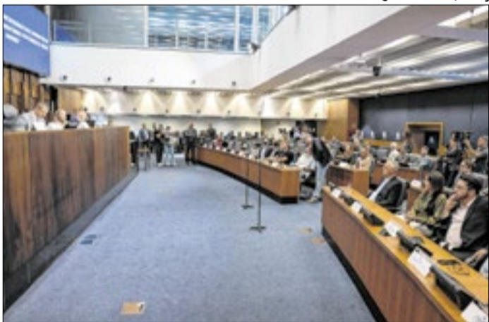
Proposta promove a distribuição equilibrada de recursos