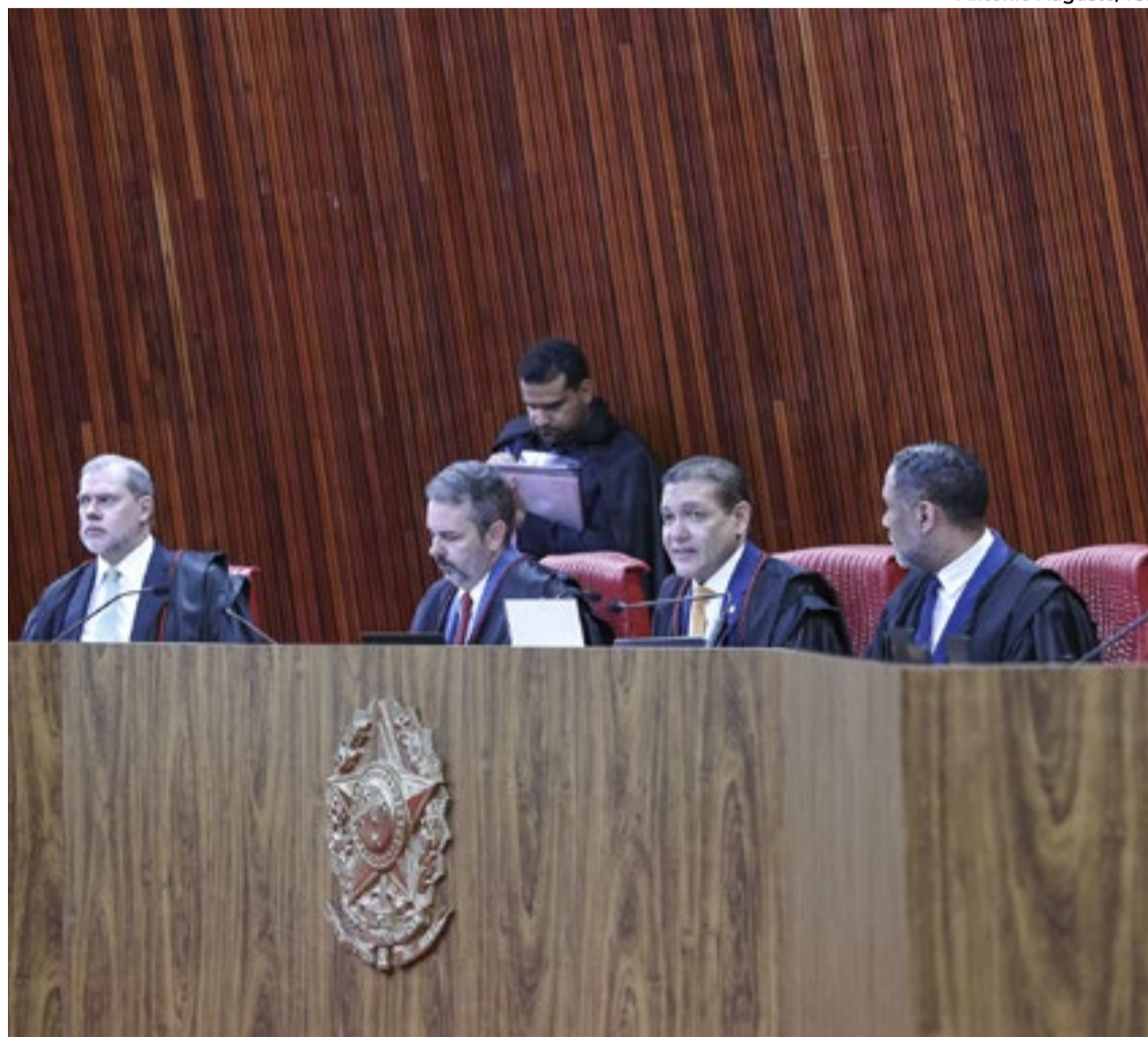
Ministros do TSE consideraram que renúncia de Castro o impediu de ter a cassação do diploma

Com a decisão desta terça-feira (2), o Supremo Tribunal Federal (STF), deve retomar o julgamento sobre como se derá a eleição do mandato-tampão