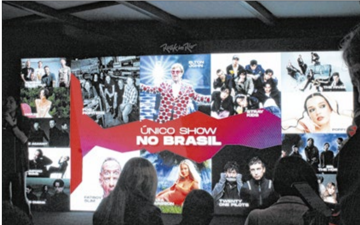
Rock in Rio 2026 terá várias apresentações únicas de artistas internacionais no Brasil

Na sequência, o dia 12 de setembro com Maroon 5, Demi Lovato, J Balvin e Pedro Sampaio no Palco Mundo; Mumford & Sons, João Gomes com a Orquestra Brasileira, Gilsons convidando Daniela Mercury e Olodum, além do encontro entre Criolo, Amaro Freitas