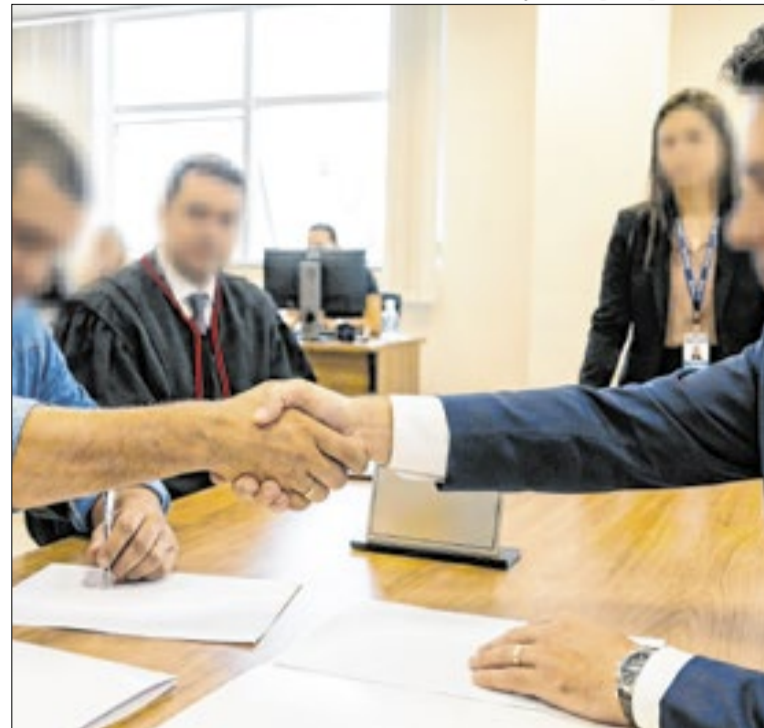
Mais de 100 mil audiências foram realizadas em cinco dias