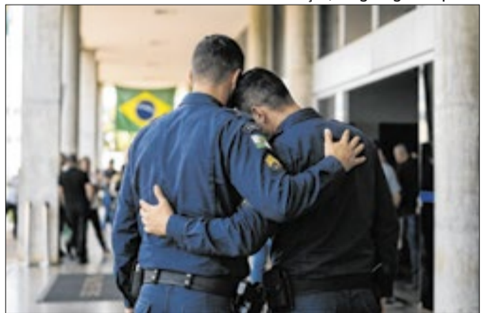
Militar postou foto com o namorado nas redes sociais