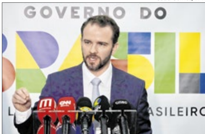
Ministro Dario Durigan fala sobre as medidas