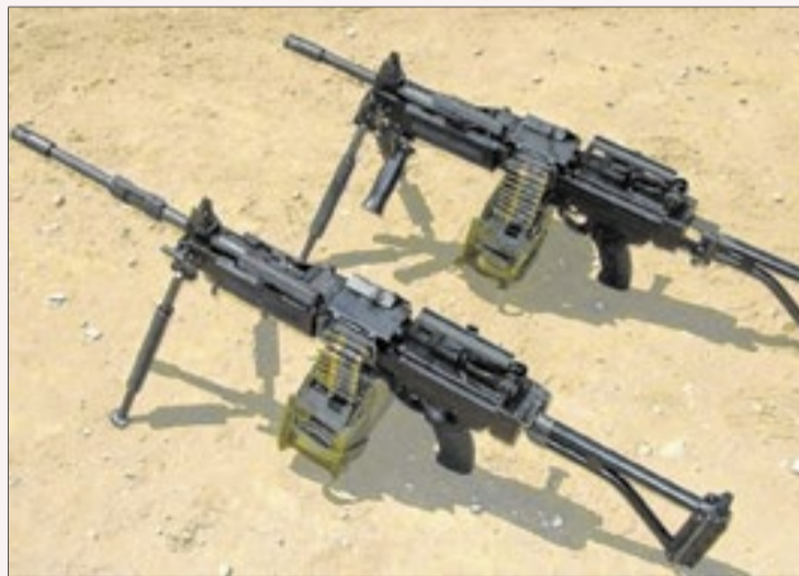
Metralhadora IWI Negev

O armamento é uma metralhadora leve, utilizada em mais de 60 países, incluindo as Forças de Defesa de Israel. Ele pode ser adaptado para uso em veículos de combate, helicópteros e embarcações militares. O investimento na compra das quatro unidades IWI Negev foi de US$ 84 mil.