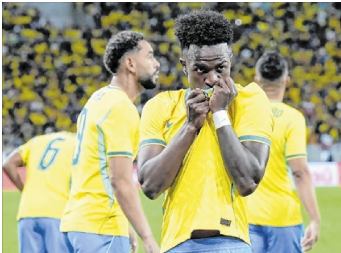
Vini Jr. é o jogador mais caro da atual seleção, avaliado em 150 milhões de euros (R$ 877,5 milhões)

A Copa do Mundo atua como vitrine para o mercado internacional. O desempenho dos jogadores no torneio influencia revisões de valores e negociações em janelas de transferências posteriores. O evento também gera compensações financeiras para clubes que liberam atletas por meio de mecanismos da Fifa.