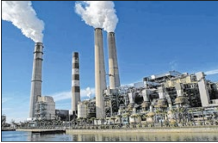
Entidade crítica a contratação de termelétricas