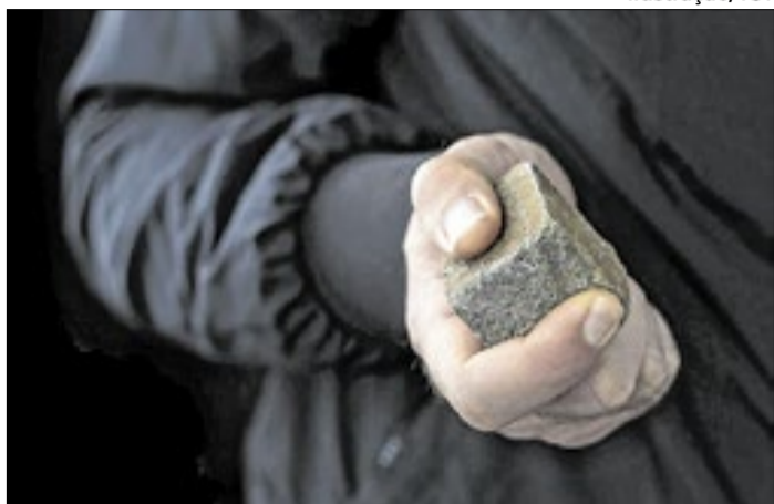
Empregado lançou pedra contra técnico em empresa