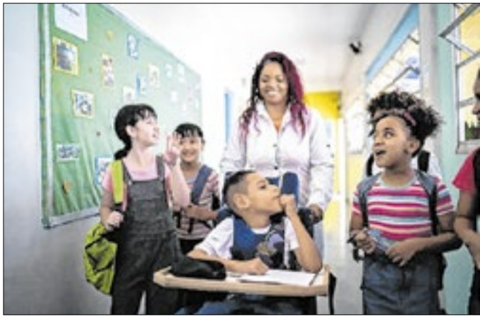
Norma protege contra obstáculos no processo de matrícula