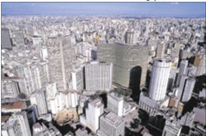
Relatório de autoria foi enviado à Câmara na segunda(1º)