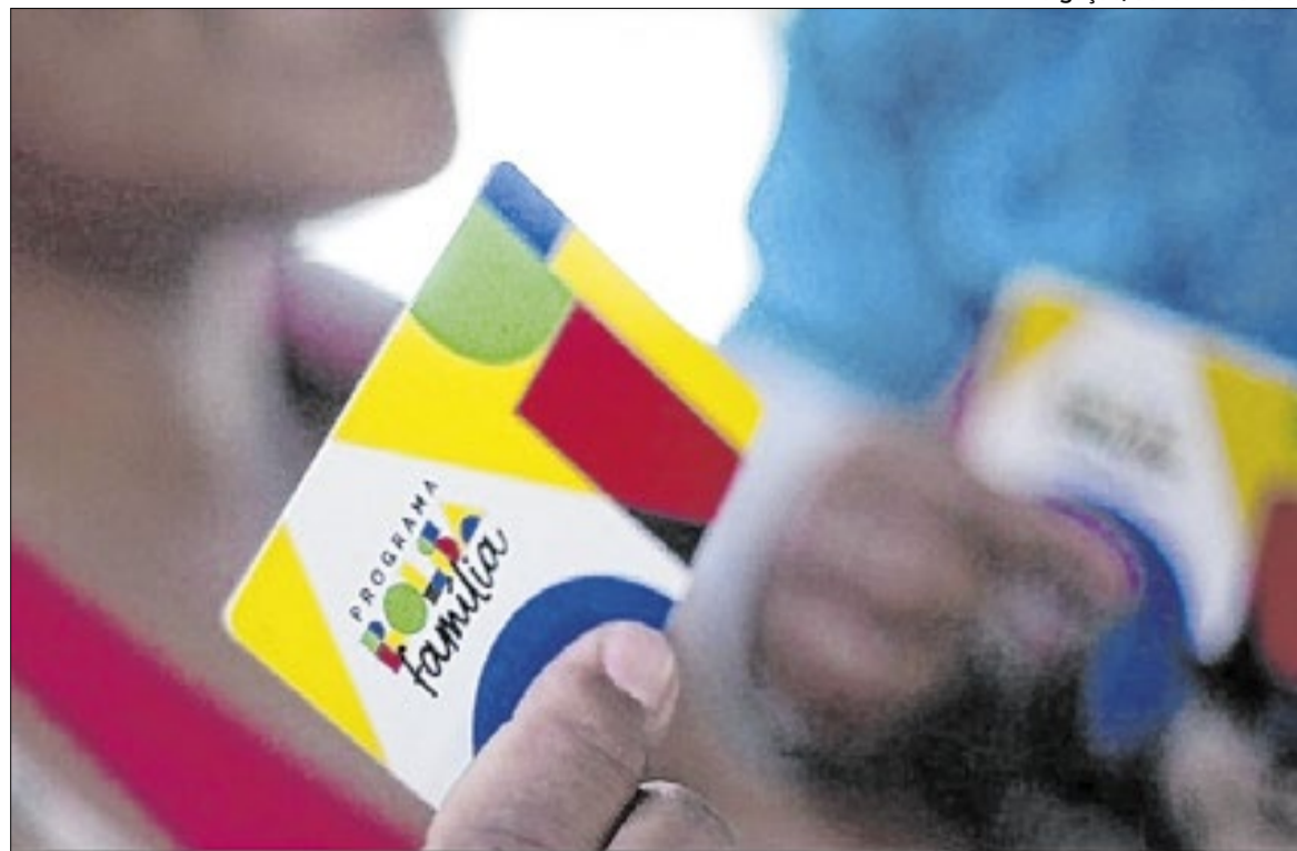
Bolsa Família atende 19 milhões de famílias e 49,5 milhões de pessoas em todo o país

A metodologia adotada comparou famílias situadas próximas ao limite que definia o acesso ao benefício complementar. Ao observar