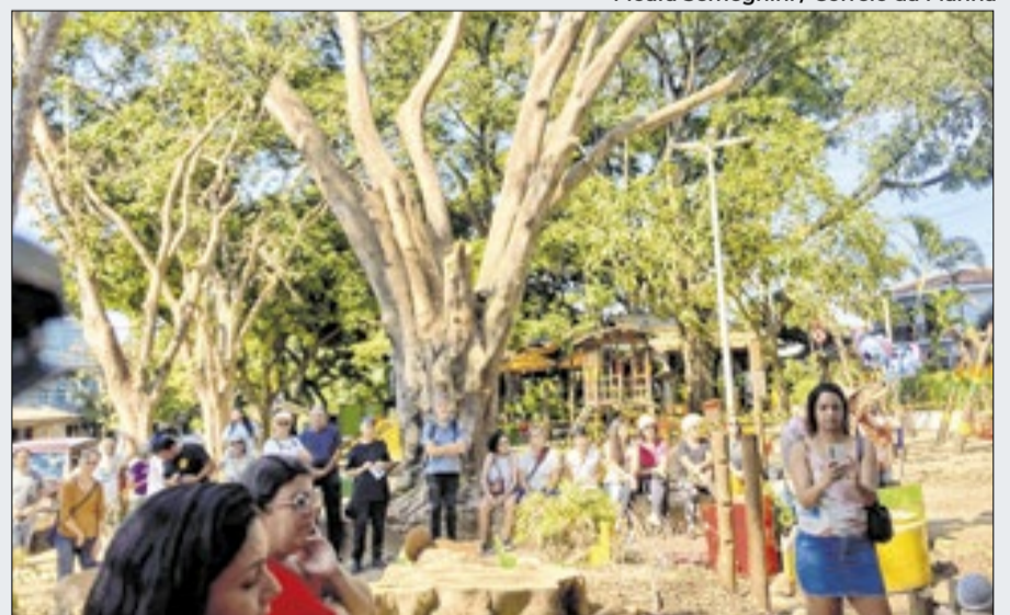
Promotoria suspendeu extração de árvore da Praça do Coco