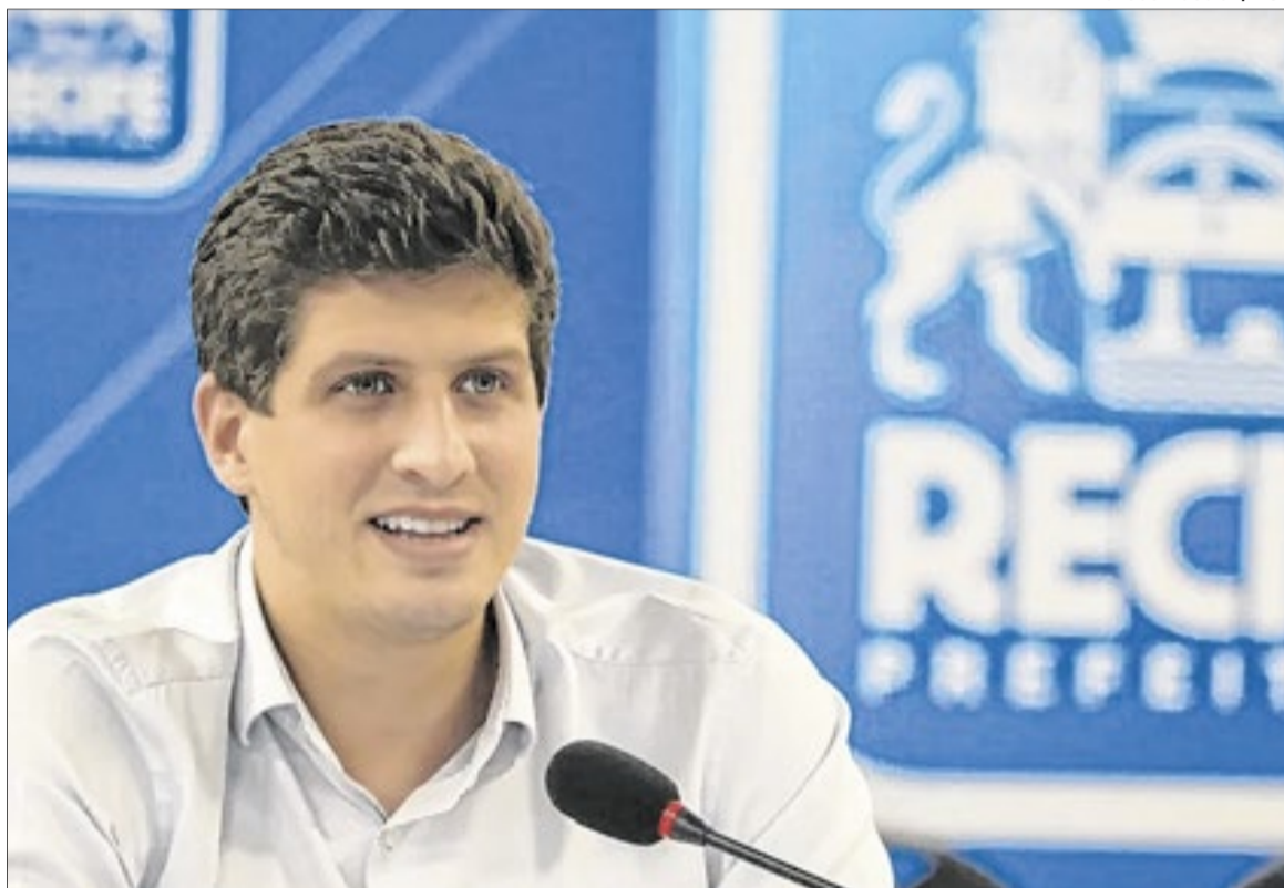
TCU envia documentos ao TCE-PE sobre denúncia que envolve a gestão de João Campos

De acordo com a denúncia apresentada ao TCU, há risco de que recursos federais destinados aos professores e à educação pública municipal, estimados preliminarmente em cerca de R$