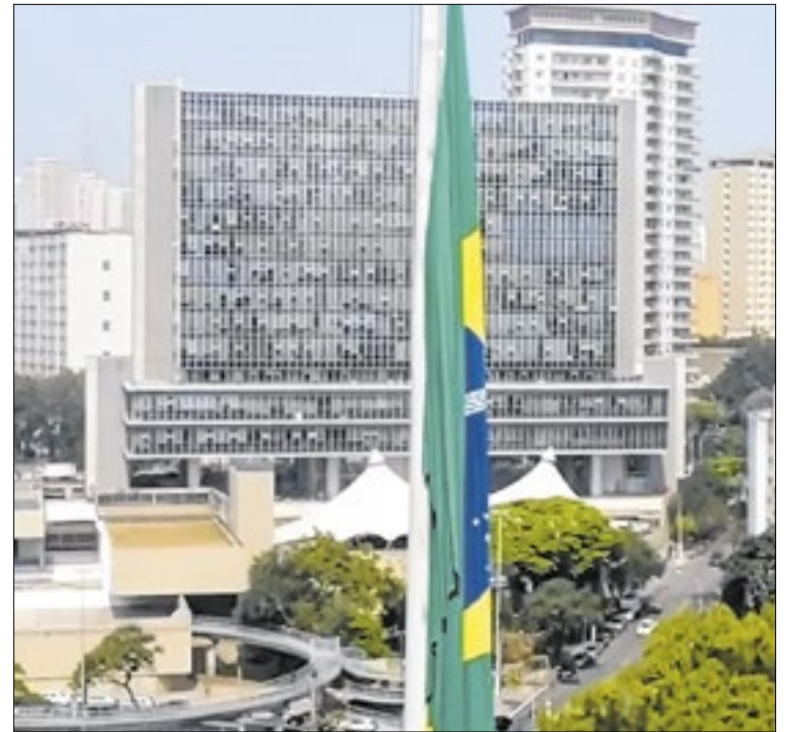
Debate será conduzido pela CCJ do legislativo paulistano

A influenciadora e artista americana Jerry Gogosian, de 40 anos, foi encontrada morta em um quarto do hotel Rosewood São Paulo, na capital paulista. O caso ocorreu no domingo (31) e foi confirmado pelo hotel, que afirmou colaborar com as autoridades. As causas da morte da influenciadora serão investigadas.