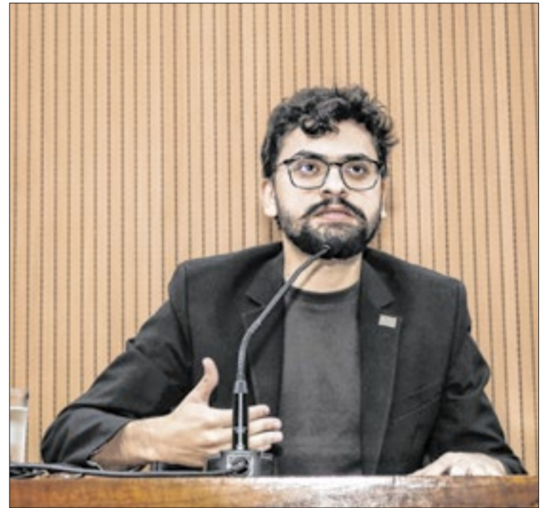
Vereador terá que responder à Comissão Processante

Por fim, declarou: “temos que garantir que vamos honrar e respeitar a confiança que o cidadão deposita em cada um de nós”, referindo-se aos representantes populares, nas esferas municipais, estaduais e federais, para além dos Poderes Legislativo, Executivo e Judiciário.