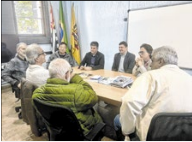
Reunião foi realizada em Mogi Mirim