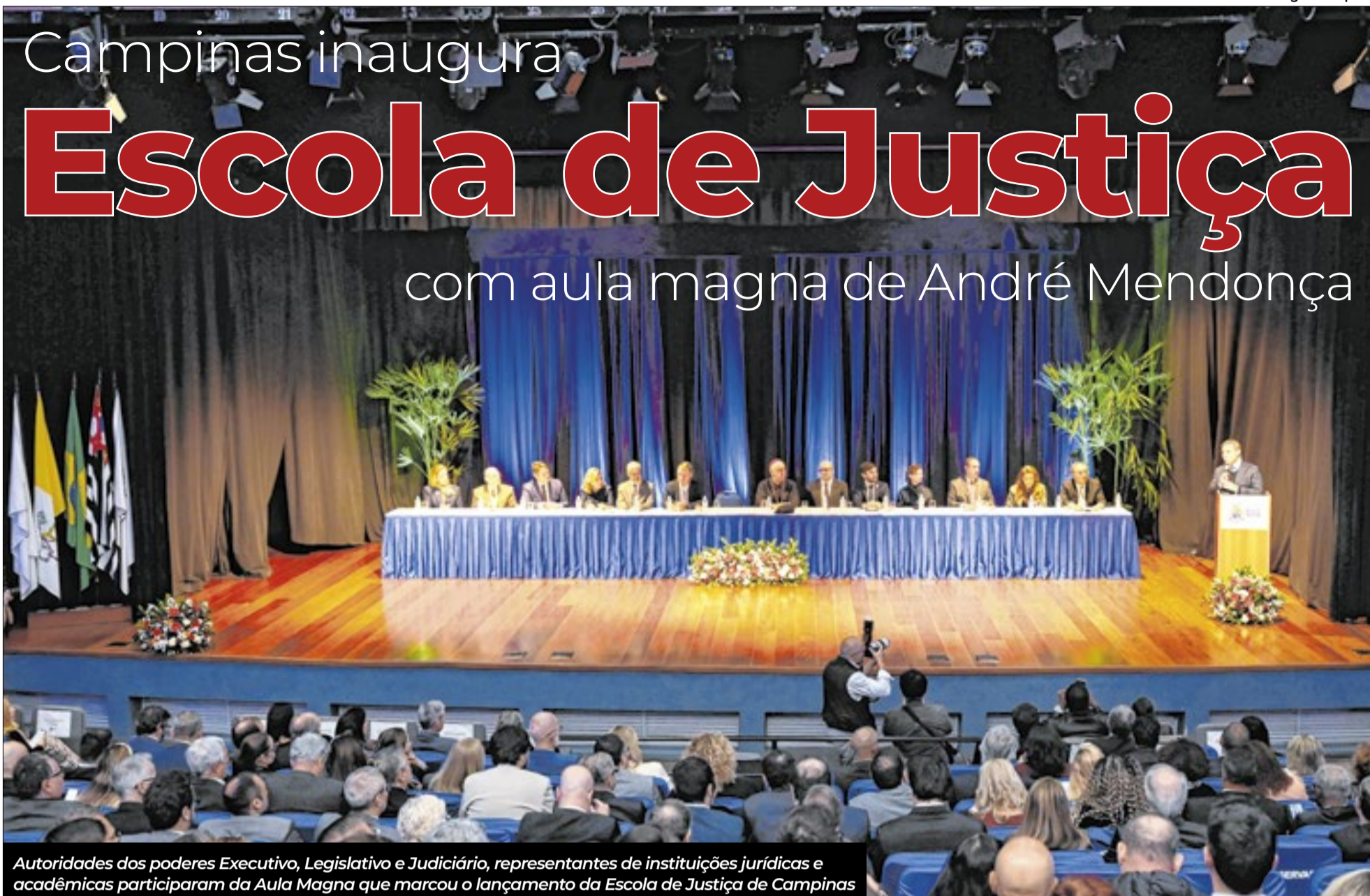
Autoridades dos poderes Executivo, Legislativo e Judiciário, representantes de instituições jurídicas e acadêmicas participaram da Aula Magna que marcou o lançamento da Escola de Justiça de Campinas