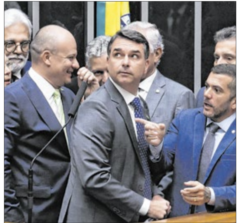
Pesquisa mostra movimento à direita contra Flávio