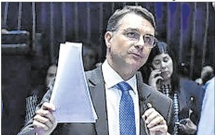
Flávio Bolsonaro: explicações sobre o Master