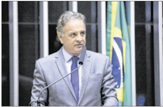
Aécio é principal plano presidencial do PSDB