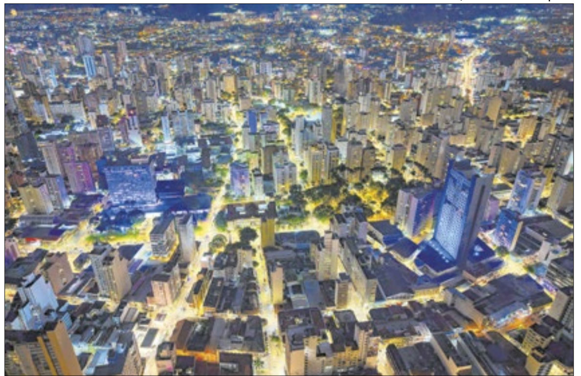
Campinas apresentou desempenho robusto nos primeiros quatro meses de 2026

Essa estimativa foi reforçada após o Produto Interno Bruto (PIB) brasileiro registrar um crescimento de 1,1% no primeiro trimestre deste ano, impulsiona-