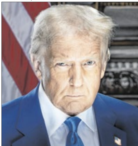
Tempo das PECs do governo está nas mãos de Davi Alcolumbre