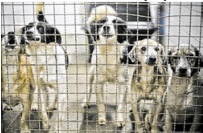
Multas podem variar entre R$ 1.032 e R$ 10.321