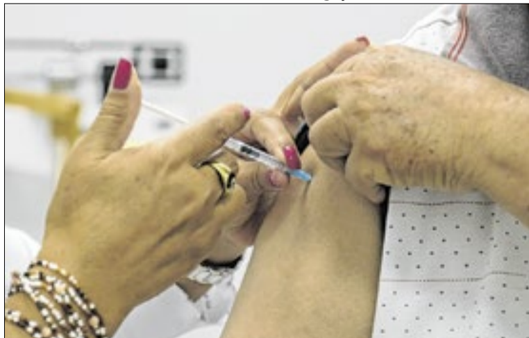
Sete UBSs manterão suas salas abertas em horário estendido

Como estratégia para elevar a proteção entre os grupos priori-