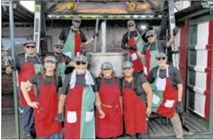
Festa homenagem costumes trazidos pelos imigrantes