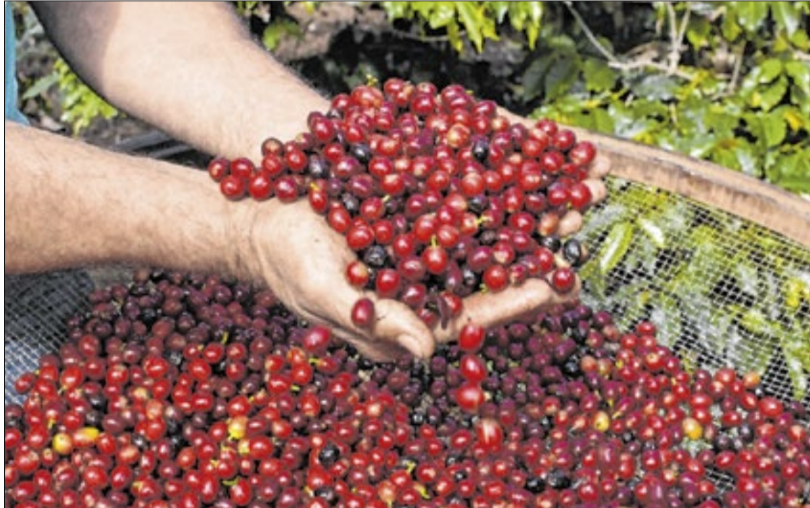
Indicação Geográfica funciona como uma ferramenta para o desenvolvimento sustentável

Essa certificação abrange tanto o café em grão cru quanto o produto industrializado, seja na condição de torra em grão ou torrado e moído.