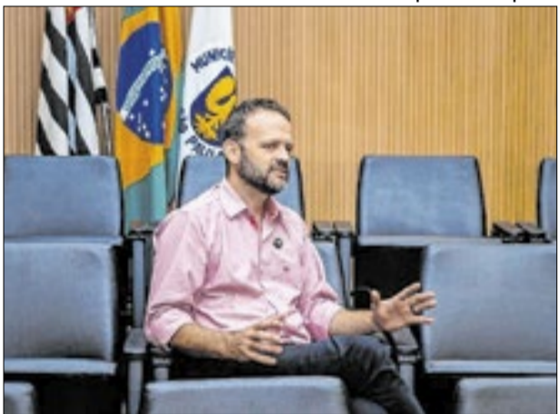
Encontro foi proposto por Romão (PT-SP)