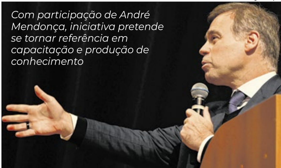
O ministro do STF, André Mendonça, durante a Aula Magna inaugural da instituição

Com participação de André Mendonça, iniciativa pretende se tornar referência em capacitação e produção de conhecimento