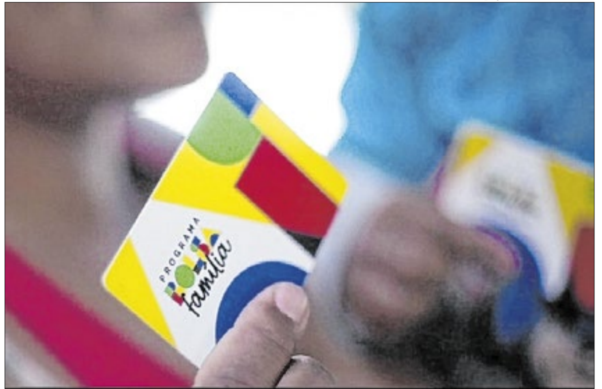
Bolsa Família atende 19 milhões de famílias e 49,5 milhões de pessoas em todo o país

A metodologia adotada comparou famílias situadas próximas ao limite que definia o acesso ao benefício complementar. Ao observar