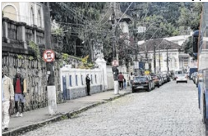
Ação conjunta da Guarda Municipal e da AGP