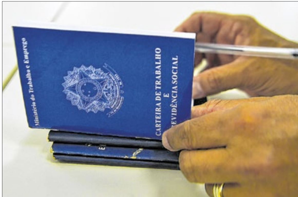
Vagas nas regiões Metropolitana, Serrana, Médio Paraíba e Lagos

Na região do Médio Paraíba, estão disponíveis oportunidades com salários que variam de R$ 1.621 a R$ 3.242 para diversas funções em Valença e Volta Redonda. Entre as vagas ofertadas estão agente funerário, alinhador veicular, atendente balconista de farmácia, auxiliar de estoque, auxiliar de expedição, auxiliar de linha de produção, cozinheiro geral, electricista de instalação automotiva, motorista de transporte leve, operador de máquinas fixas, operador de desbobinadeiras de tiras quentes, operador de caixa e técnico em eletromecânica.