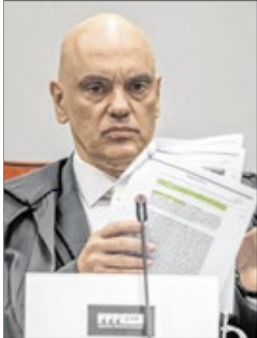
Moraes é relator de processo que envolve a Abin

O pedido havia sido apresentado pela União Nacional dos Profissionais de Inteligência da Abin (Intelis), entidade que alegou que diversos servidores tiveram equipamentos e outros bens apreendidos ao longo da investigação e que parte desse