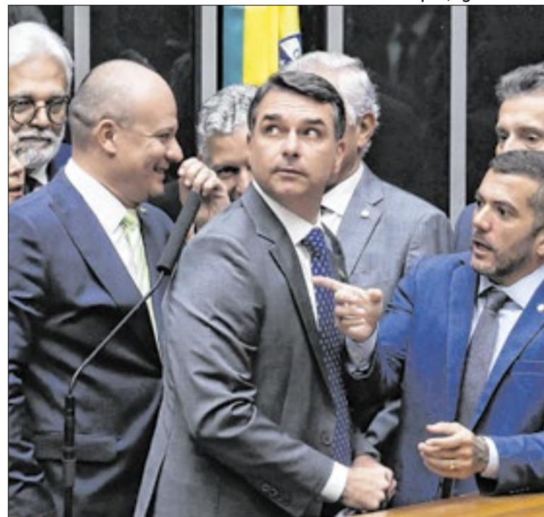
Pesquisa mostra movimento à direita contra Flávio