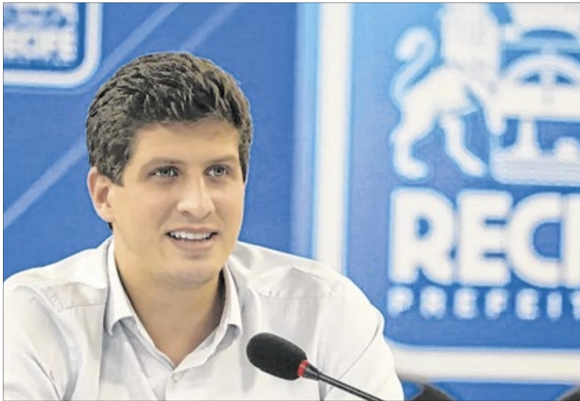
TCU envia documentos ao TCE-PE sobre denúncia que envolve a gestão de João Campos

De acordo com a denúncia apresentada ao TCU, há risco de que recursos federais destinados aos professores e à educação pública municipal, estimados preliminarmente em cerca de R$