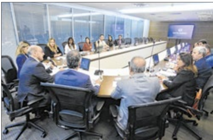
Encontro contou com representantes de 11 cidades