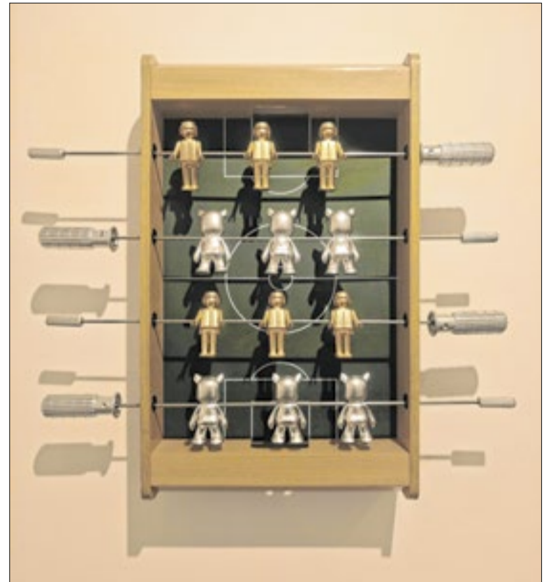
Uma das obras transforma o clássico Totô em peça de arte

Os jogadores e a comissão técnica da Seleção Brasileira visitaram a sede da CBF na noite da segunda (1º) a fim de se despedir dos funcionários da casa, antes da viagem para a disputa da Copa do Mundo. Foi uma recepção festiva e calorosa. Eles aproveitaram para conhecer o museu e jantaram com o presidente da CBF, Samir Xaud.