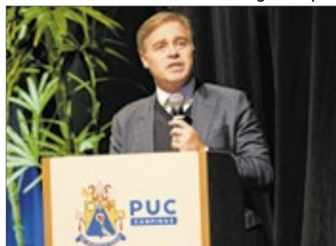
Ministro André Mendonça durante a Aula Magna inauguração da Escola de Justiça de Campinas, no auditório do Campus I da PUC-Campinas

Evento reuniu representantes dos três poderes, instituições jurídicas e acadêmicas, além de alunos de cursos de Direito nesta segunda-feira, 1º