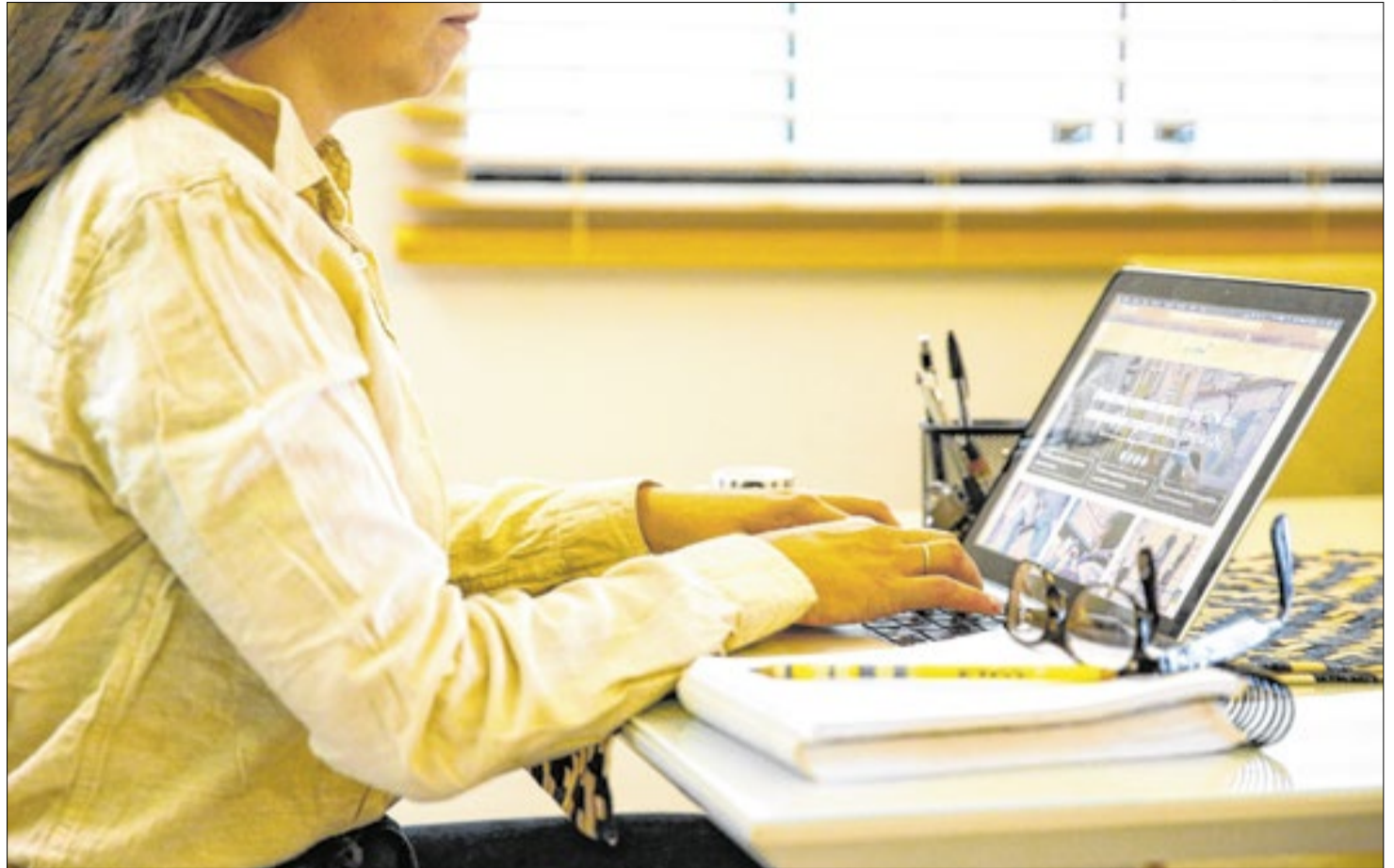
Parte de jovens trocam emprego, seja por dificuldade de adaptação ao ambiente corporativo ou saúde mental

Some-se a isso o cenário econômico: salários que não acompanham o custo de vida, pressão, tributação pesada, e uma inflação que corrói qualquer ganho. Para muitos, o auxílio governamental torna-se uma âncora psicológica: um piso emocional a partir do qual se avalia o esforço.