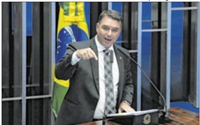
Flávio Bolsonaro: explicações sobre o Master