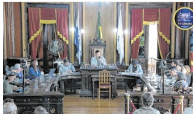
Pasta atribuiu demora à falta de profissionais credenciados

A emissão do boletim faz parte do Plano de Contingência para o Inverno, que prevê também medidas para o enfrentamento para os dias de estiagem e ações para a prevenção a incêndios florestais. O Plano está será divulgado no dia 22 de junho. No boletim, as cores variam de acordo com a probabilidade da ocorrência.