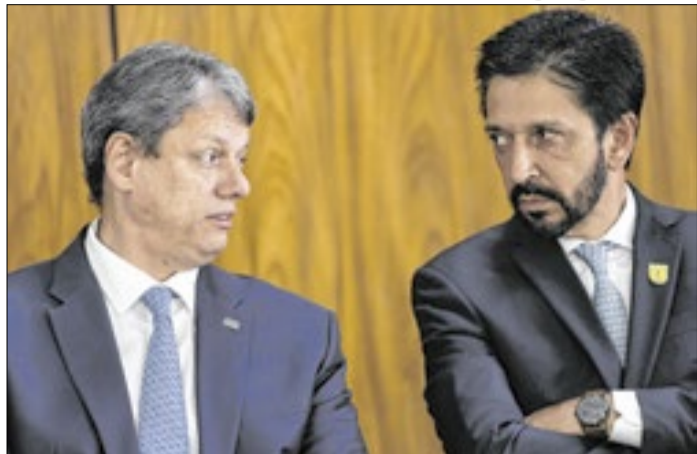
Tarcísio com Nunes: contrato suspeito da prefeitura