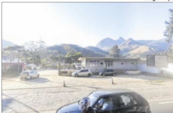
Políticos criticaram decreto da Prefeitura