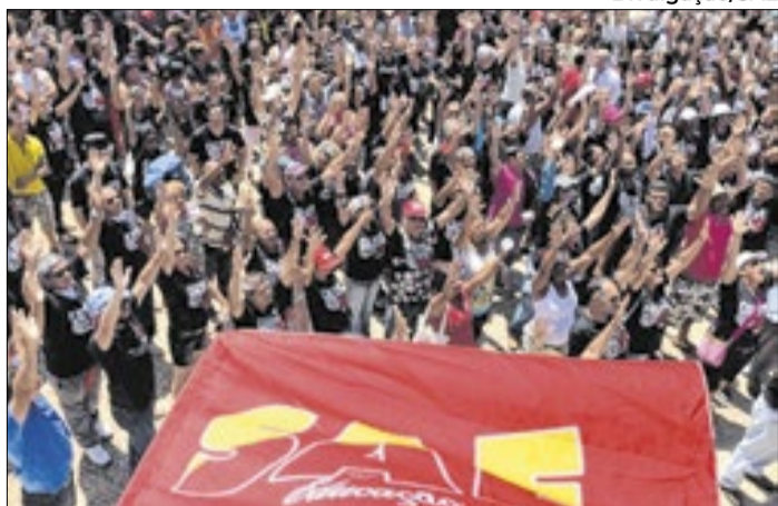
SAE representa interesses dos servidores públicos do DF