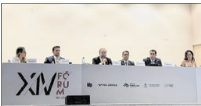
Painel sobre desenvolvimento tecnológico contou com o ministro de Minas e Energia, Alexandre Silveira; o prefeito do Rio, Eduardo Cavaliere; a Chefe de Gabinete de Secom do Planalto, Samara Castro; a professora Priscila Lapa Villas Boas; e Edson Holanda, conselheiro da Anatel

Lisboa voltou a ser o endereço da política brasileira. O primeiro dia do XIV Fórum de Lisboa, nesta segunda-feira, 1º de junho, reuniu ministros de tribunais superiores, parlamentares, governadores, prefeitos, empresários, advogados e acadêmicos em uma intensa agenda de debates sobre democracia, tecnologia, soberania, economia e governança. Com participação de autoridades brasileiras e estrangeiras, o encontro transformou a capital portuguesa em um dos principais centros de discussão sobre os desafios institucionais e geopolíticos da atualidade.