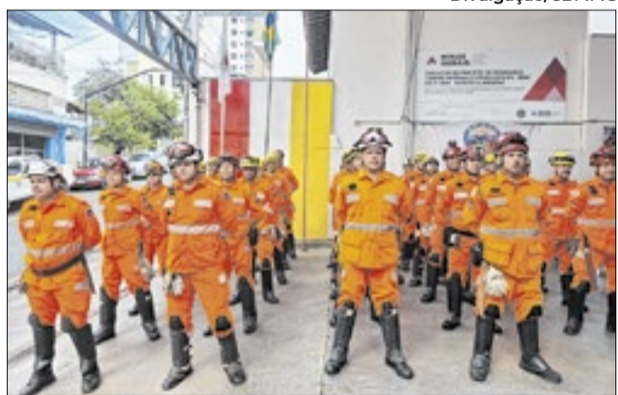
Para soldados, remuneração inicial é de R$ 5.332,60