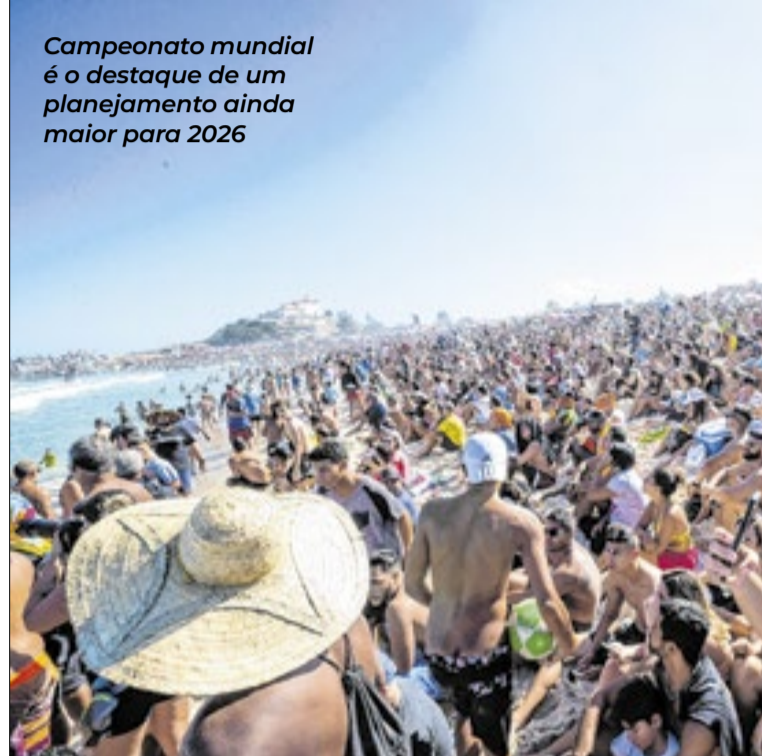
Campeonato mundial é o destaque de um planejamento ainda maior para 2026

O sucesso do evento reflete diretamente no bolso do cidadão saquaremense. Em 2025, a operação do campeonato foi responsável pela geração de 2.665 empregos diretos e pela distribuição de R$ 93 milhões em renda para as famílias da região,