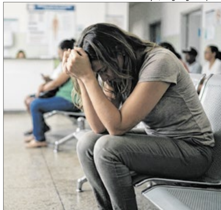
Objetivo é orientar acolhimento em espaços públicos

Pela proposta, trabalhadores que exercerem efetivamente a função de jurado poderão ser dispensados do serviço pelo dobro dos dias de convocação, sem prejuízo do salário ou outros benefícios. O projeto argumenta que a medida valoriza a participação cidadã e equipara o tratamento dado aos mesários eleitorais.