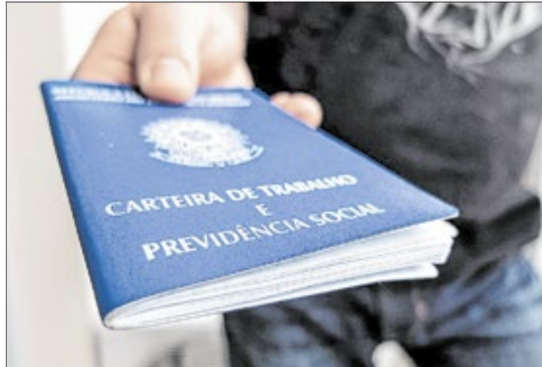
PECs sobre jornada de trabalho tramitam no Senado

Segundo a CNC, o texto tem como principal mérito a valorização da negociação coletiva. Em parecer técnico elaborado por sua Diretoria Jurídica e Sindical, a entidade afirma que a proposta está alinhada ao princípio do negociação sobre o legislado e acompanha o entendimento do Supremo Tribunal Federal (STF) sobre a validade de acordos e convenções coletivas