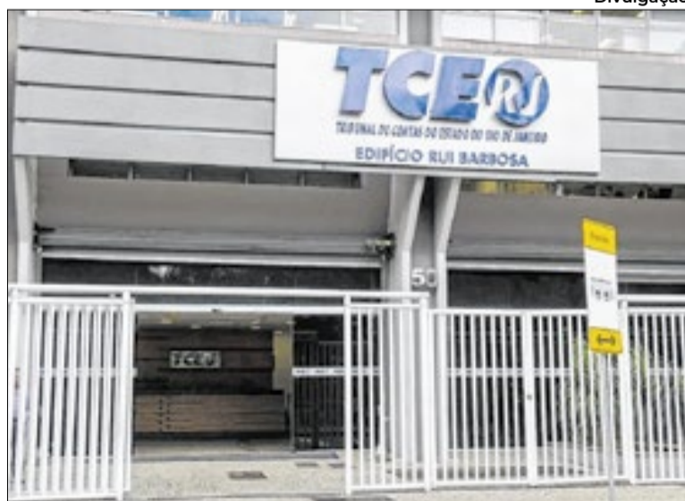
Decisão do TCE-RJ será analisada pelo plenário da Alerj

Auditorias técnicas do TCE-RJ e do Ministério Público de