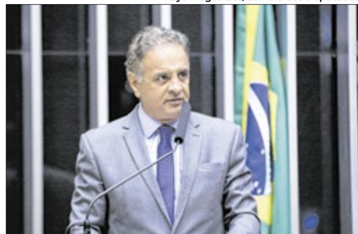
Aécio é principal plano presidencial do PSDB