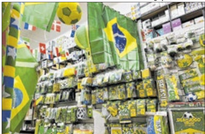
Sondagem diz que 85% dos lojistas estão mais otimistas