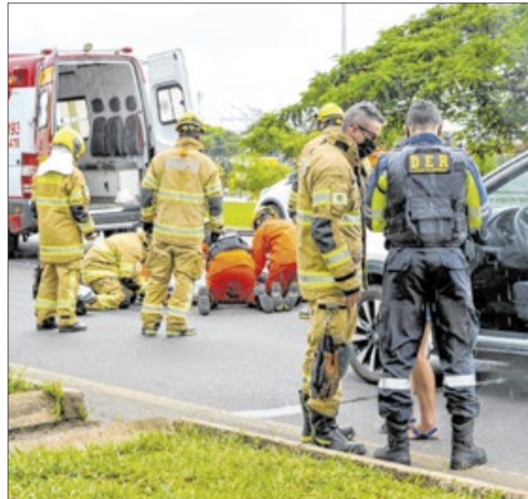
Acidentes com motocicletas lideram taxa de mortalidade

A iniciativa busca fortalecer a escuta ativa, aproximar o poder público dos consumidores e aumentar a eficiência.