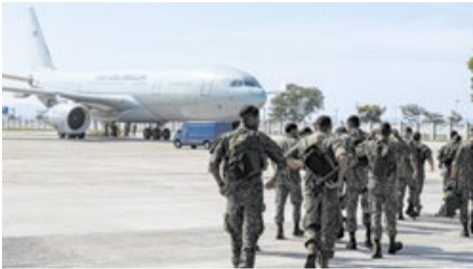
Militares brasileiros embarcam na Base Aérea do Galeão