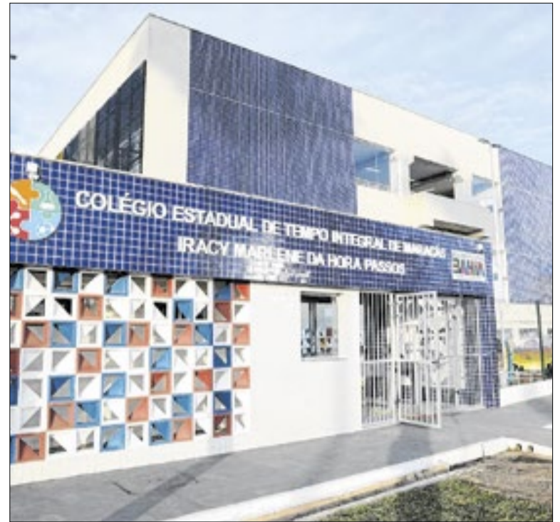
Professores da Bahia: uma das origens do esquema

Bem, há problemas nesse raciocínio. Em diversos lugares, são mulheres do PL que lideram a corrida para o Senado. A própria Michelle no Distrito Federal. Mas acontece também em Santa Catarina, onde a liderança para o Senado é da deputada Caroline de Toni, superando Carlos Bolsonaro. Se votarem “muito mal”, elas votarão em Flávio?