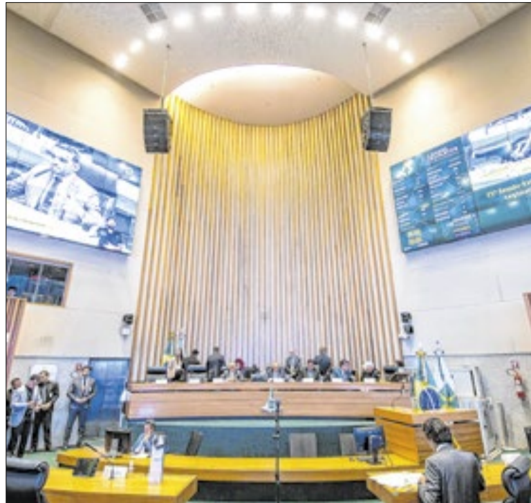
Iniciativa garante que o protesto cartorário seja utilizado como medida excepcional

O Centro Educacional (CED) In-cra 8 de Brazlândia é a primeira escola rural bilíngue de japonês de Brasília. O curso é ofertado como parte da grade extracurricular de estudantes do ensino médio. Brazlândia tem uma importante comunidade japonesa e um público considerável para a medida. Entre 1,2 mil alunos do CED, 75 participam das aulas.