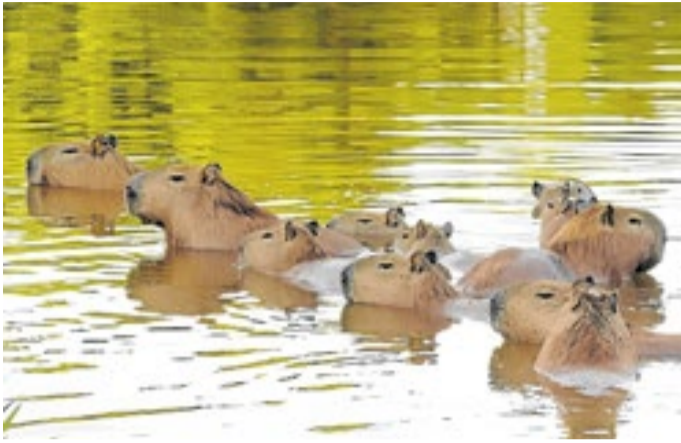
As capivaras do DF não transmitem febre maculosa