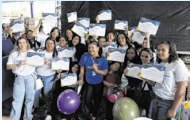
Iniciativa permite formação para empregos