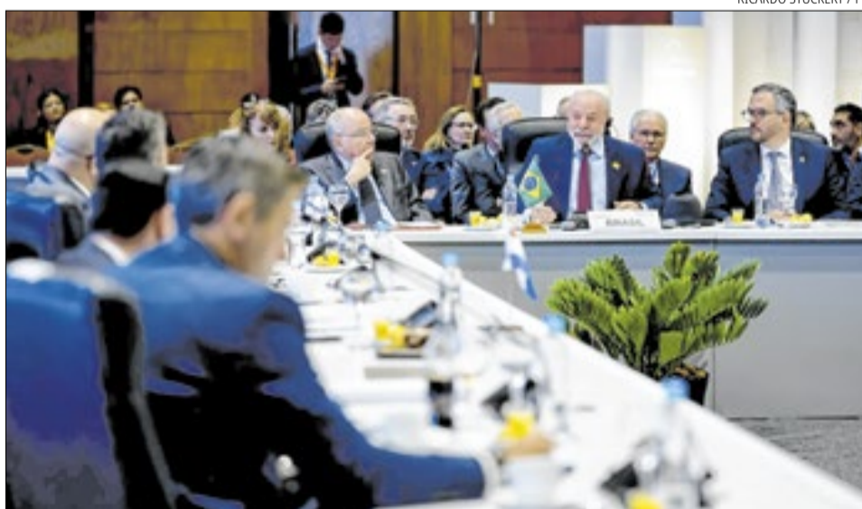
Lula: presidente de esquerda em maioria de direita

Com esse quadro, durante sua participação na 68ª Cúpula de Chefes de Estado do Mercosul realizada nesta terça-feira (30), em Assunção (Paraguai), o presidente Luiz Inácio Lula da Silva (PT) defendeu que, apesar das posições políticas, “o projeto de integração sul-americano deve estar acima de ideologias”.