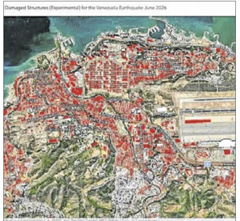
Mapa mostra em vermelho prédios com chances de terem sido danificados

O Secretário-Geral saudou o trabalho do Reino Unido com a França para coordenar os esforços internacionais em prol da navegação no Estreito de Ormuz. Sr. Rutte se encontrou ainda com a Secretária de Estado para Assuntos Externos e da Commonwealth do Reino Unido, Yvette Cooper, e com o Secretário de Estado da Defesa, Dan Jarvis.