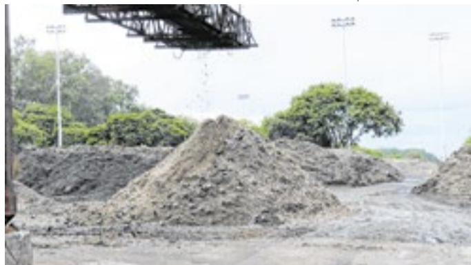
Produto utilizado como adubo por produtores rurais do DF