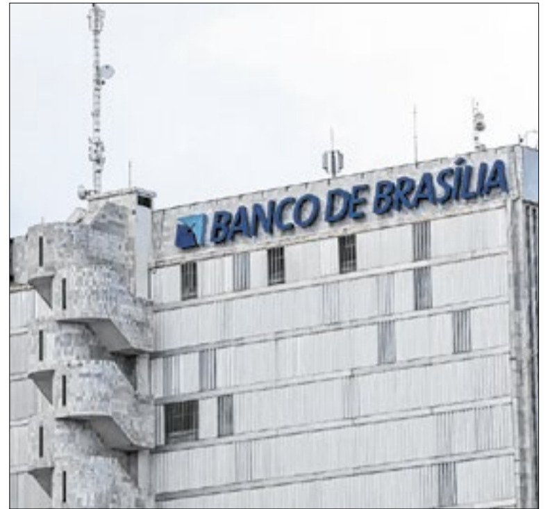
Banco enfrenta uma crise de liquidez após as operações com o banco Master

Em Ponte Alta, a criação da nova RA responde ao avanço urbano e à necessidade de gestão mais próxima das demandas cotidianas. Segundo o Executivo, não haverá impacto financeiro imediato, pois a estrutura inicial será viabilizada pelo banco de cargos da Secretaria de Economia e pelo acervo de administrações existentes.