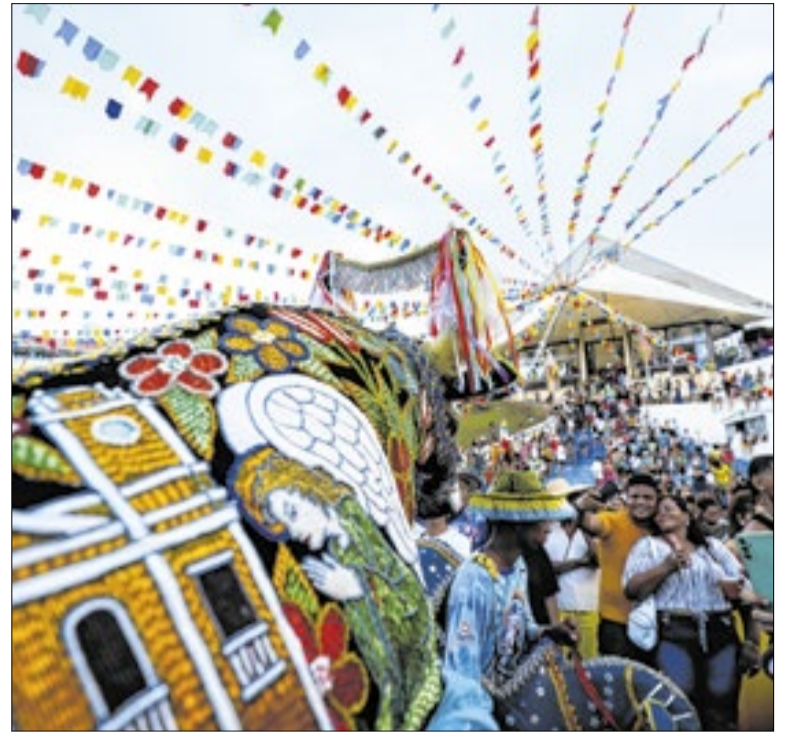
O Bumba Meu Boi reúne tradição, fé e identidade cultural no Maranhão