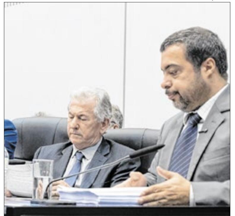
Deputados criticam Governo pela não execução de Emendas a Municípios

Nos bastidores, o PT passou a defender que a sigla fique com a primeira suplência da candidatura de Simone Tebet (PSB) ao Senado por São Paulo. A estratégia busca garantir a vaga caso Tebet seja eleita e volte a integrar um eventual governo Lula como ministra. Os suplentes de Tebet(PSB) e Marina Silva(Rede) ainda não foram definidos.