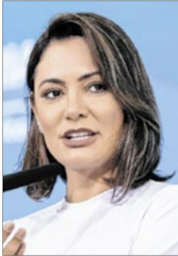
Michelle busca estancar as críticas nas redes sociais

Na avaliação desses dirigentes, Michelle busca estancar as críticas nas redes sociais, mas não abrirá mão de uma eleição muito bem encaminhada ao Senado pelo Distrito Federal. Afinal, o mandato manteria a ex-primeira-dama no holofote da política nacional pelos próximos oito anos.