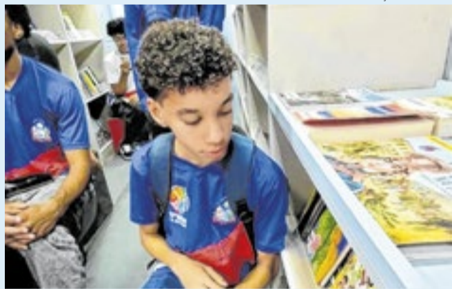
Rota terá realidade virtual, livros e memória