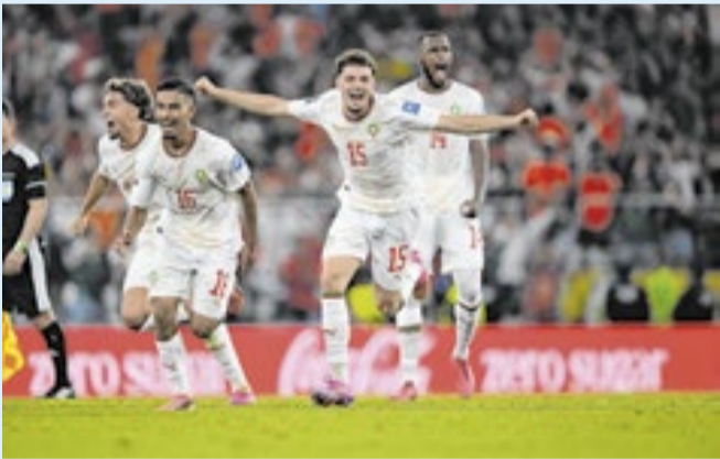
FEDERAÇÃO DE FUTEBOL DO MARROCOS

Jogadores celebram a classificação contra a Holanda