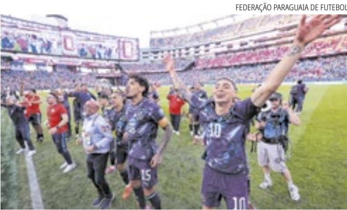
FEDERAÇÃO PARAGUAIA DE FUTEBOL

Delegação paraguaia comemora com a torcida a vaga