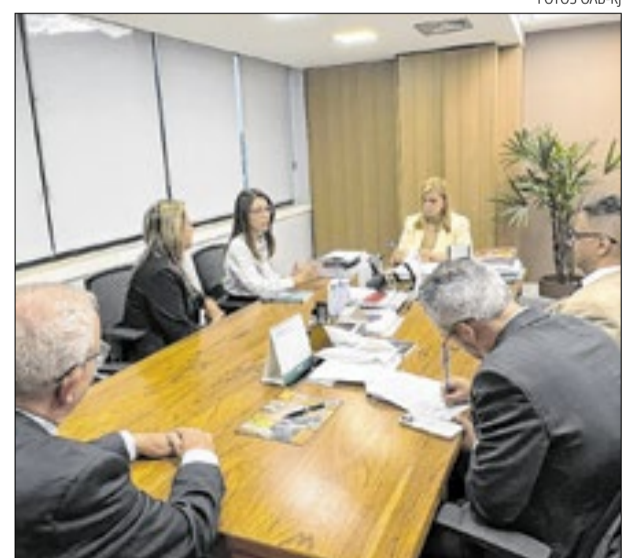
"O convênio representa mais uma forma de incentivar a dedicação dos alunos durante a formação, sem dissociar a teoria da prática", ressaltou a reitoria da UVA