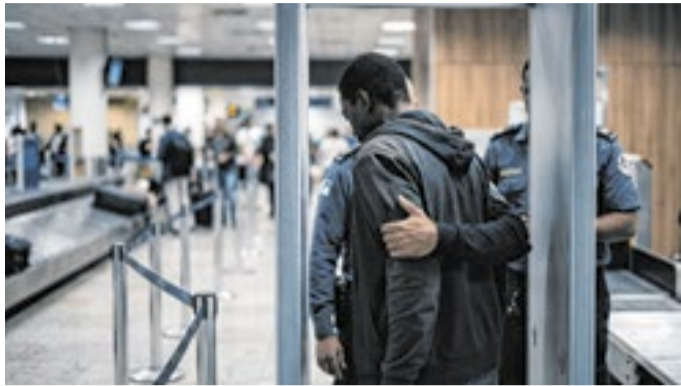
ILUSTRAÇÃO / IMAGEM GERADA POR IA

Passageiro relatou que era a única pessoa negra no local