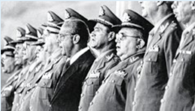
General Figueiredo: o poder militar