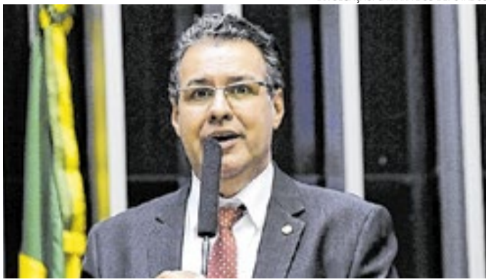
Proposta é do Deputado Federal por SP, Capitão Augusto(PL)