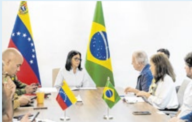
José Múcio Monteiro e a presidenta Delcy Rodríguez