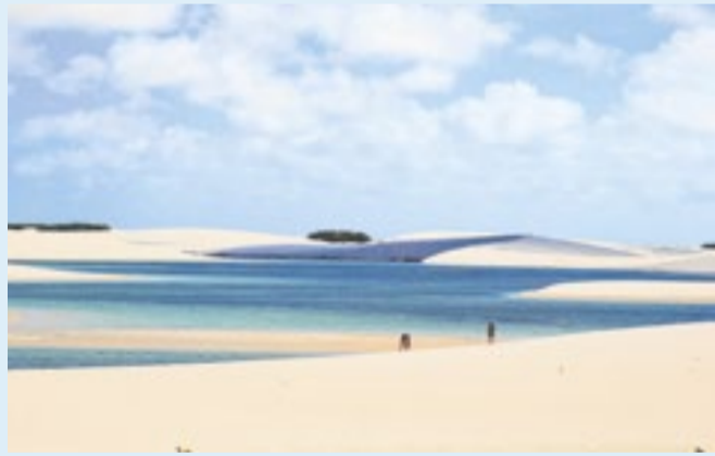
Lagoas e dunas desenhadas nos Lençóis Maranhenses

Os Lençóis permanecem como a principal porta de entrada do turismo maranhense. A aposta do governo é ampliar essa percepção ao associar o destino à força cultural do São João do Maranhão, do Bumba meu boi e de outras manifestações populares que integram a identidade do estado. A proposta é incentivar o visitante a permanecer mais tempo e descobrir os diversos atrativos além do cartão-postal que projetou o Maranhão internacionalmente.