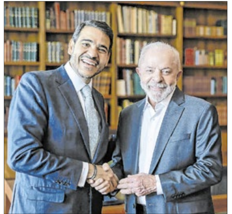
Lula peita Senado e indicará Messias outra vez