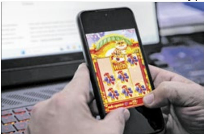
10,9 milhões já estão com potencial de vício