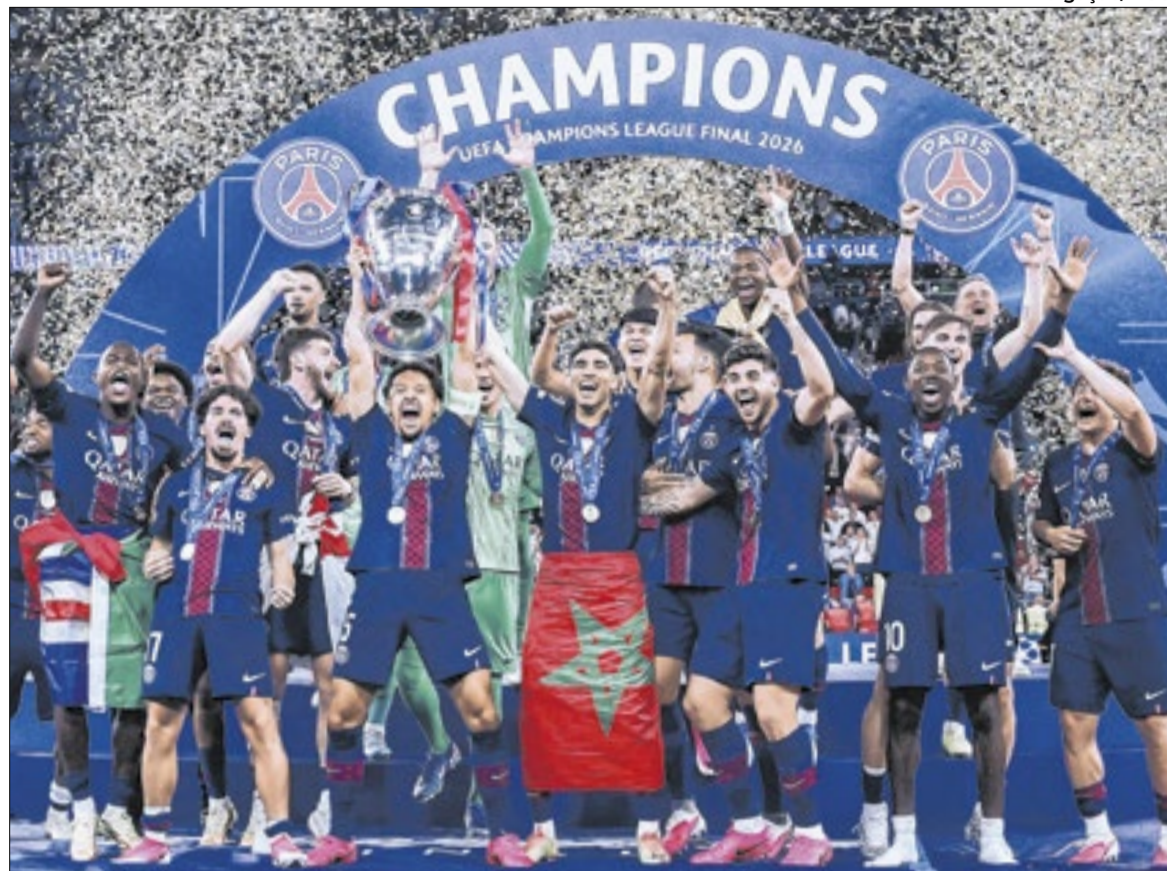
PSG bateu o Arsenal na final e conquistou o bicampeonato consecutivo da Champions

O time londrino abriu o marcador em um lance que misturou azar do brasileiro Marquinhos e oportu-