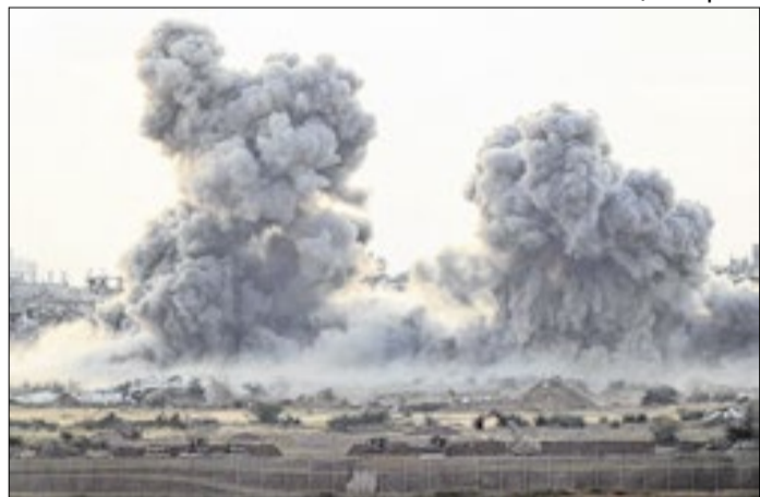
Danon repudiou ação e fez referência ao New York Times