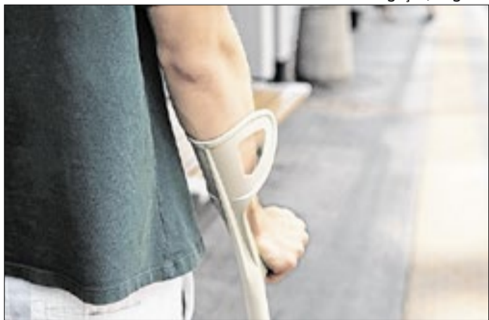
Acordo encerrou ação relacionada a acidente de trabalho