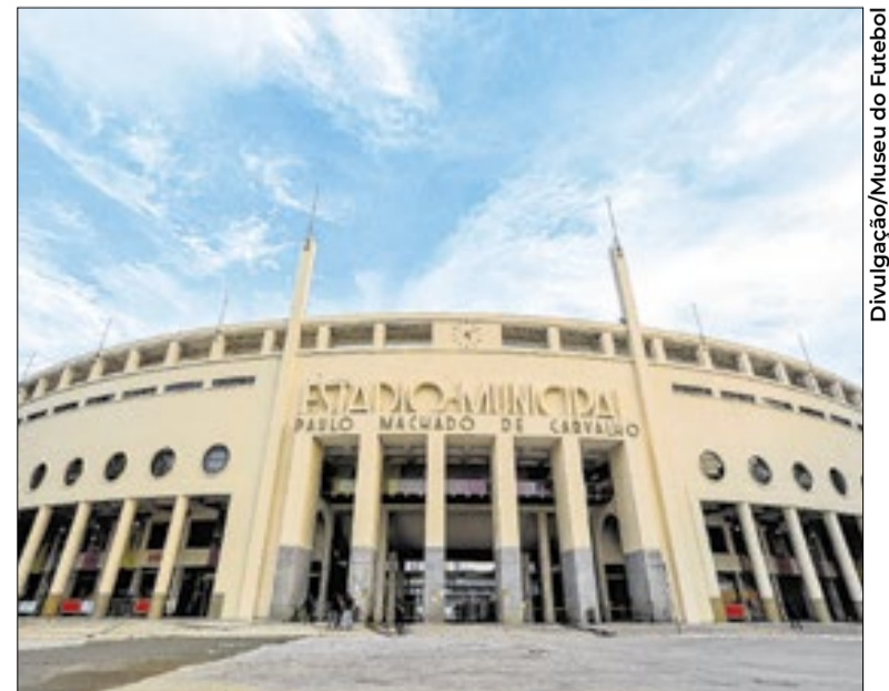
Fachada do estádio do Pacaembu, sede do Museu do Futebol