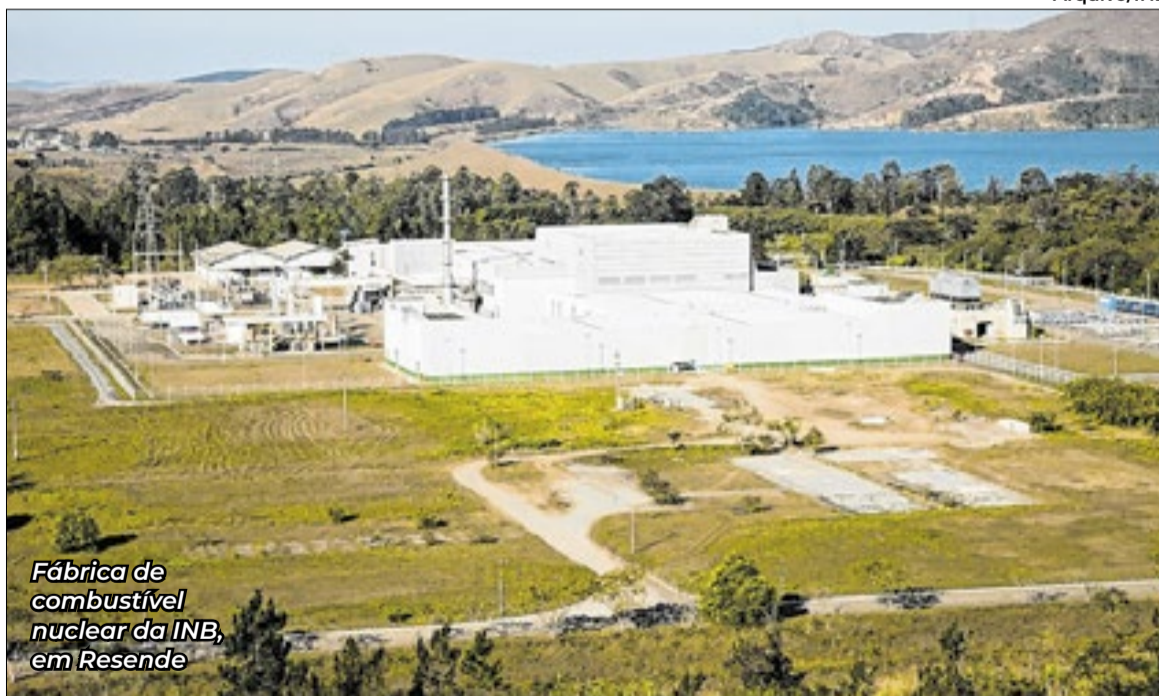
Fábrica de combustível nuclear da INB, em Resende

SIEN destaca desafios e oportunidades para o setor nuclear brasileiro