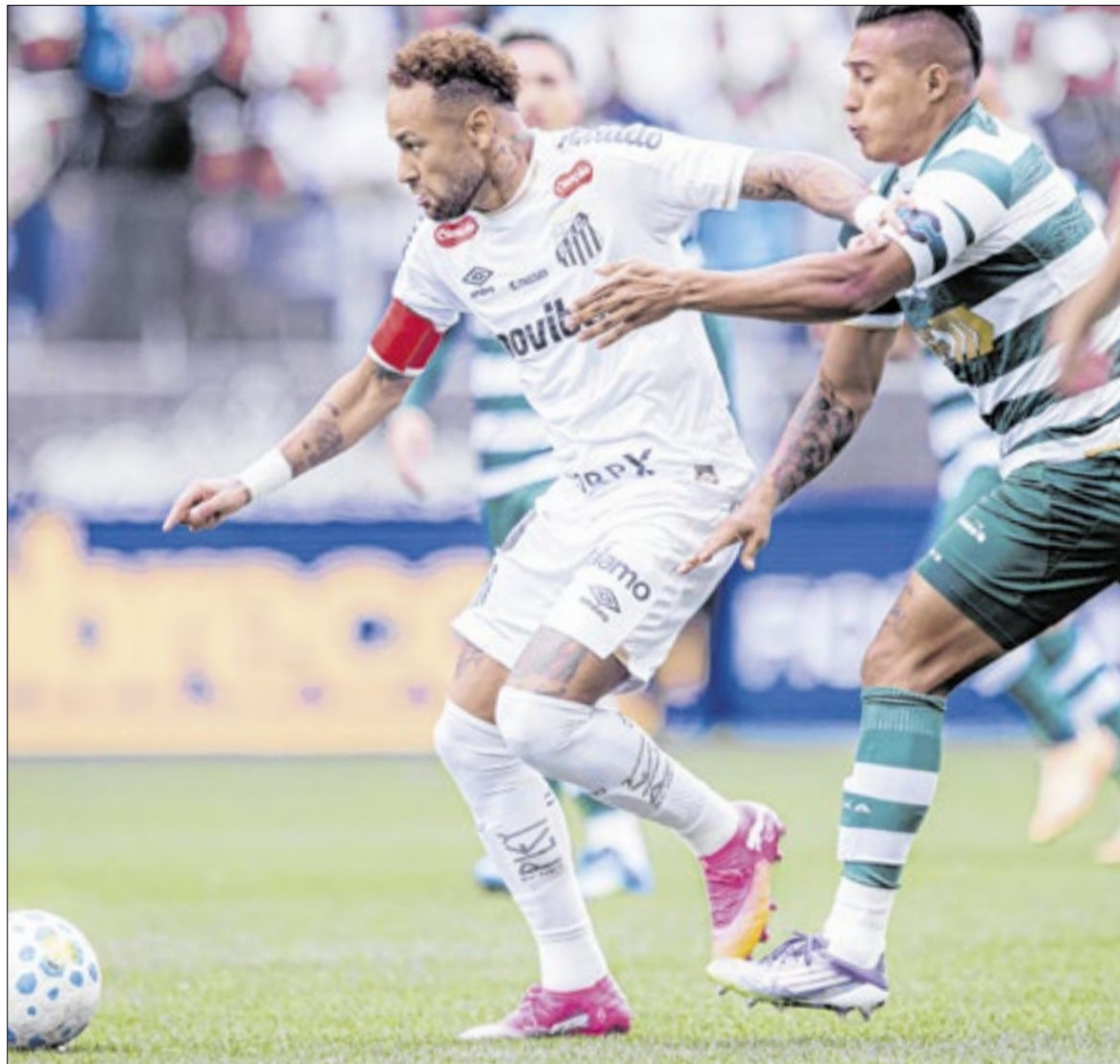
Neymar sofreu uma lesão de grau 2 contra o Coritiba e pode ficar de fora da Copa do Mundo

Conforme Leite, as lesões musculares são graduadas de acor-