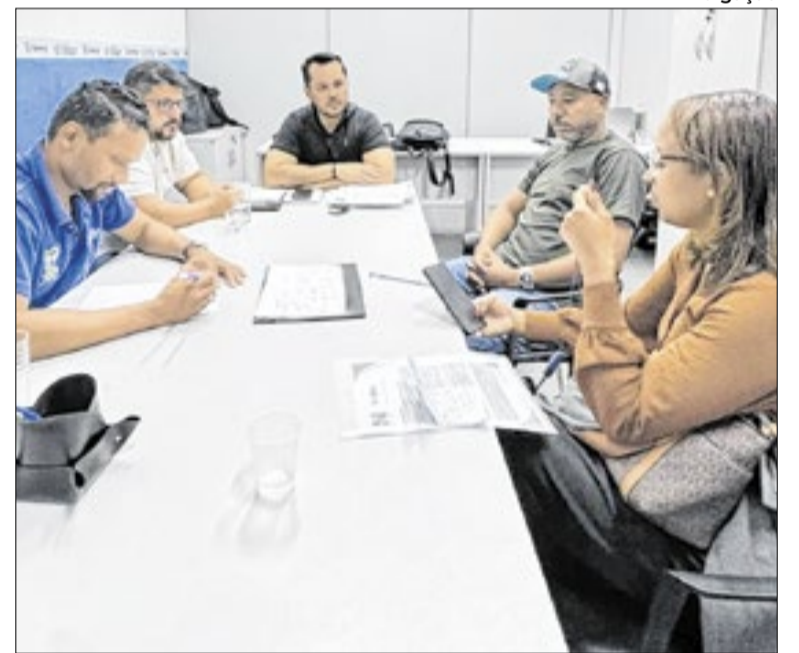
Compromisso para criar caminhos para emprego e renda