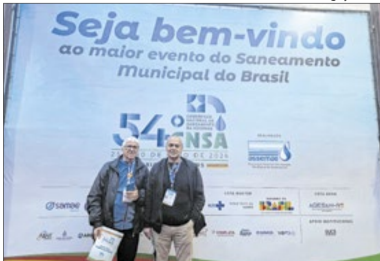
Unidade fornecerá cursos profissionalizantes à população

“Além dos trabalhos apresentados, viemos pleitear um compromisso de patrocínio técnico para a criação da primeira escola de saneamento no estado do Rio. Tivemos a reunião do conselho, o projeto foi aprovado e agora é partir para executarmos em Volta Redonda. Já temos o local e essa escola vai atender, em sua maioria, trabalhadores de ‘chão de fábrica’, além de pessoas carentes, para que possam ter acesso a cursos profissionalizantes - explicou PC, que estava acompanhado do diretor-adjunto do Saae-VR, Sil-