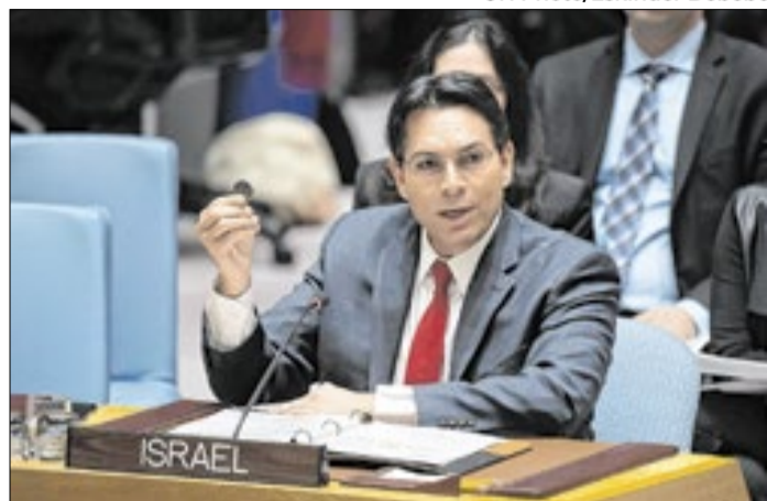
Embaixador israelense condena inclusão do país na lista