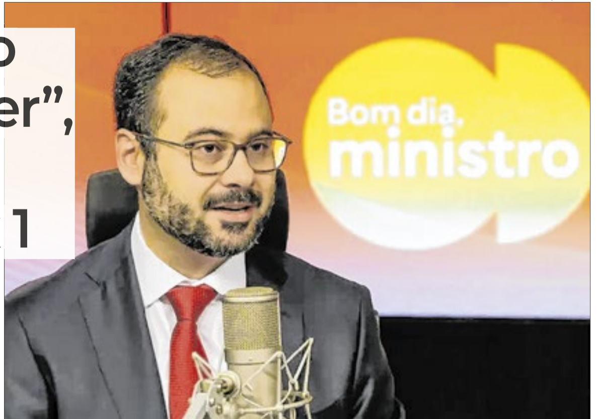
Paulo Pereira assumiu o Ministério do Empreendedorismo em 22 de abril

Para micro e pequenas empresas, o governo está estudando regulamentações específicas e mecanismos de transição para garantir que esses negócios consigam se adaptar sem prejuízos financeiros. “É uma regra geral, vale para todo mundo, mas a gente ainda não desceu nas especificidades de cada uma das atividades”, explicou. Segundo avaliação do Ministério do Empreendedorismo, cerca de 51% dos micro e pequenos empresários não veem impacto negativo na mudança, enquanto a percepção contrária caiu para cerca de 27% em 2026, conforme pesquisas do Sebrae citadas pelo governo. O ministro afirmou que a mudança será acompanhada de mecanismos de compensação e apoio a setores mais impactados, incluindo acesso a crédito e políticas de transição.