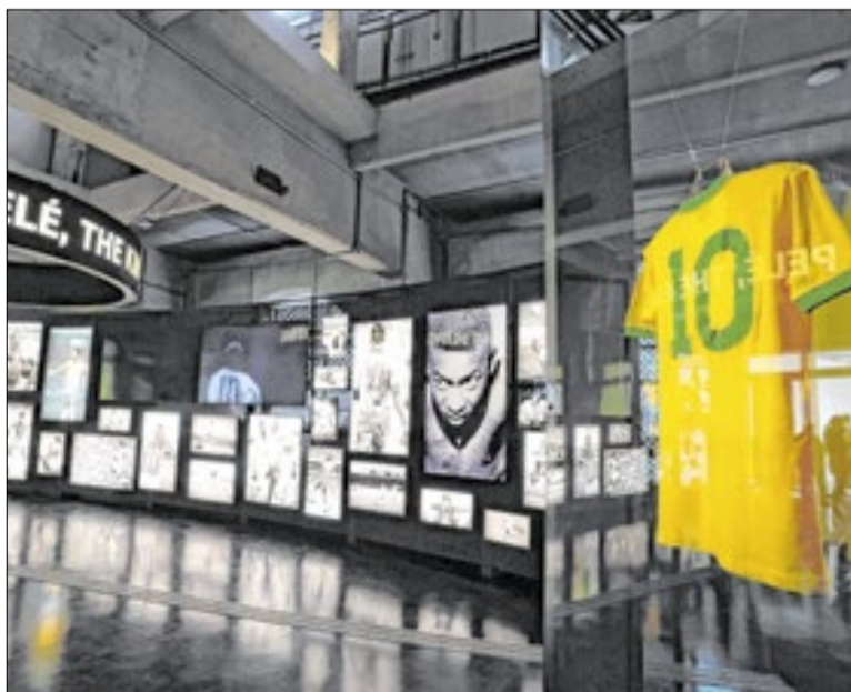
Objetos históricos de Pelé integram acervo do museu

Terça-feira a domingo, das 9h às 18h (entrada até 17h) | Toda primeira terça-feira do mês, até 21h (entrada até 20h) | Ingressos: R$ 24,00 (inteira) e R$ 12,00 (meia-entrada) | Grátis às terças-feiras (ingresso pela internet) | Crianças até 7 anos não pagam