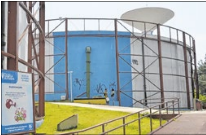
Caso envolve equivalência salarial entre beneficiários