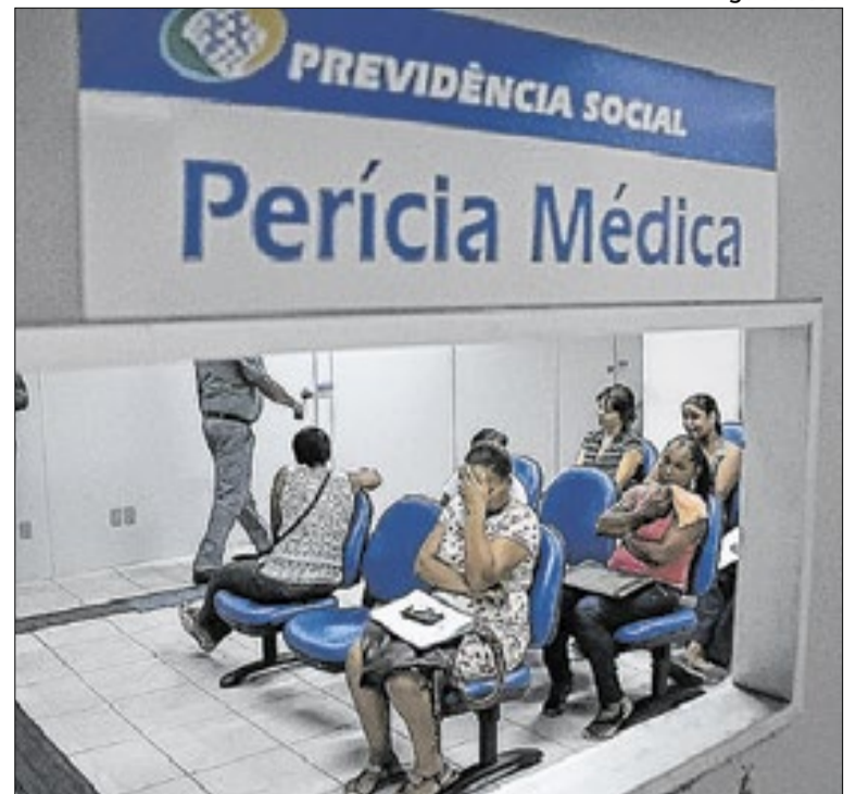
Órgão reconhece que ainda há um volume elevado de pedidos

O INSS leva cerca de 45 dias para pagar o salário-maternidade. Após a concessão automática, o órgão pode revisar o benefício e mantê-lo, suspender ou encerrar. O benefício é destinado a seguradas como domésticas, rurais, MEIs, avulsas e desempregadas, com duração de até 120 dias em casos de parto ou adoção.