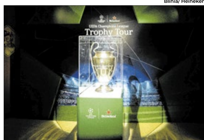
Final da Champions League será disputada neste sábado (30)

participantes em diferentes cidades do país. Durante a dinâmica, promotoras convidam consumidores que estiverem consumindo Heineken a participarem de desafios em tablets interativos, nos quais precisam acertar, em três etapas, a sequência de lances históricos da UEFA Champions League — desde decisões dos jogadores até a direção final da bola. Ao final da experiência, os participantes descobrem o desfecho real da jogada e podem ganhar brindes exclusivos da marca. A iniciativa acontece em São Paulo Capital, Rio de Janeiro, Belo Horizonte, Porto Alegre, Curitiba, Goiânia, Brasília, Fortaleza, Recife e Salvador, e também chega aos espaços Living HNK