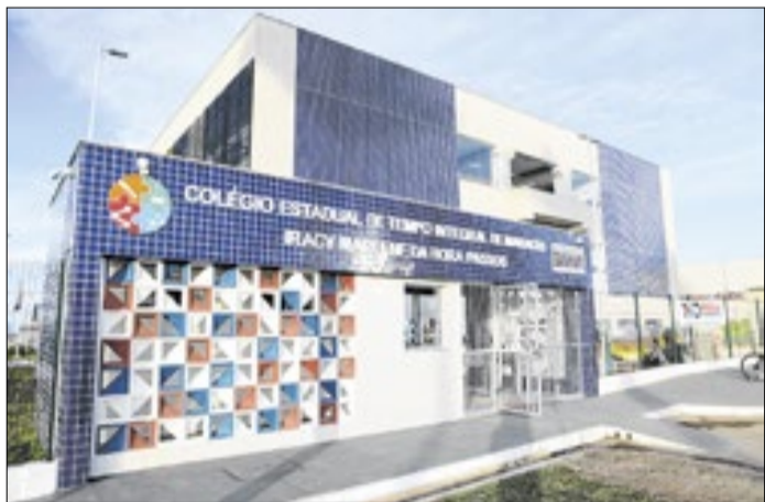
Professores da Bahia na origem dos créditos falsos