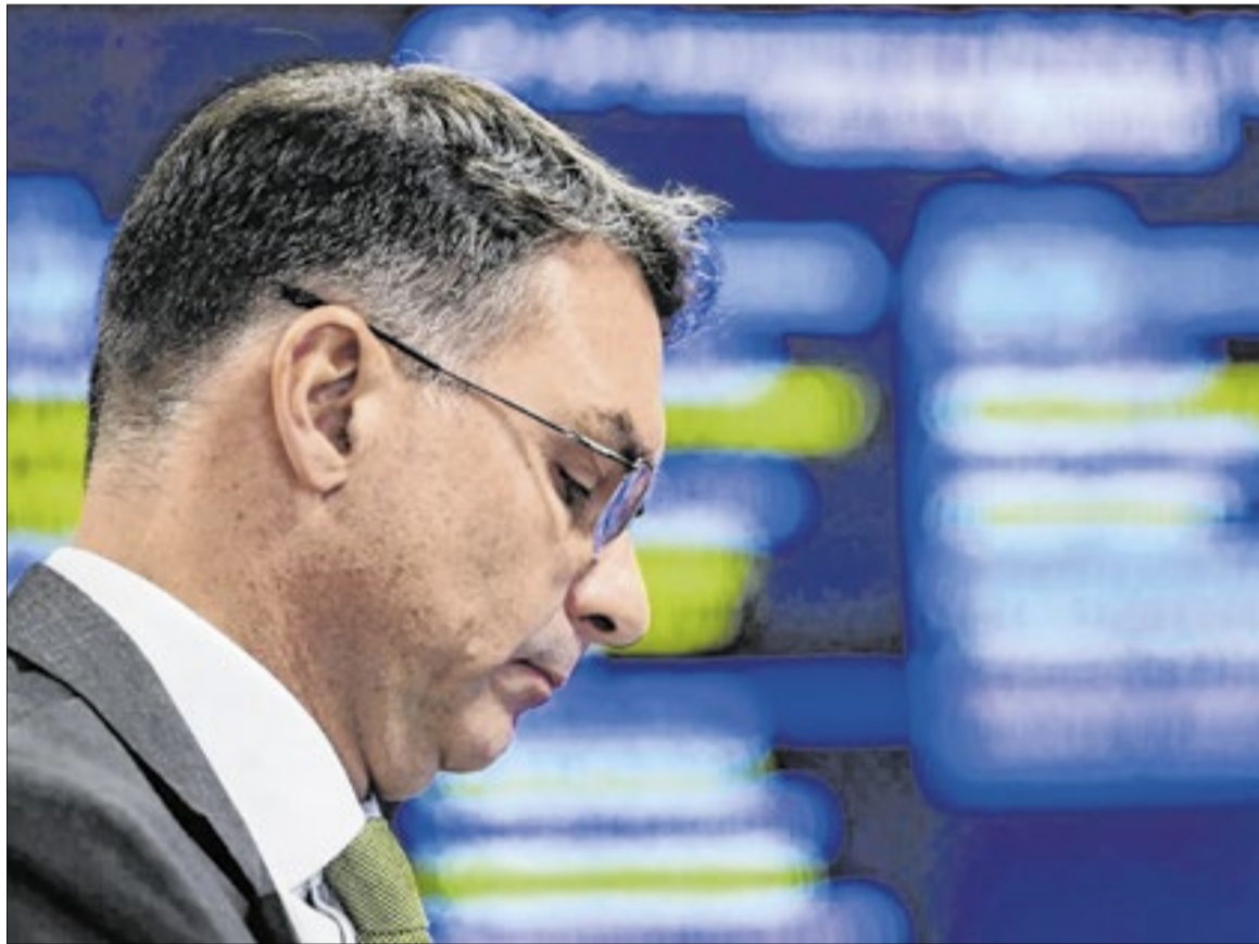
Senado reembolsou despesas de viagem de Flávio Bolsonaro a São Paulo no fim de 2025

A apuração foi autuada como representação na unidade técnica do TCU. Segundo documento obtido pela coluna, o objeto do procedimento é a "utilização de recursos da Cota para o Exercício da