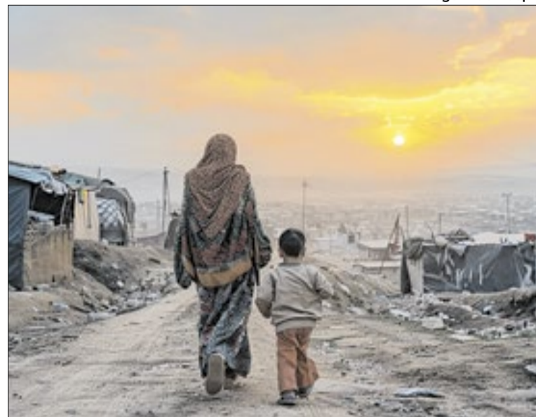
Teerã nega ter concordado com a extensão do cessar-fogo