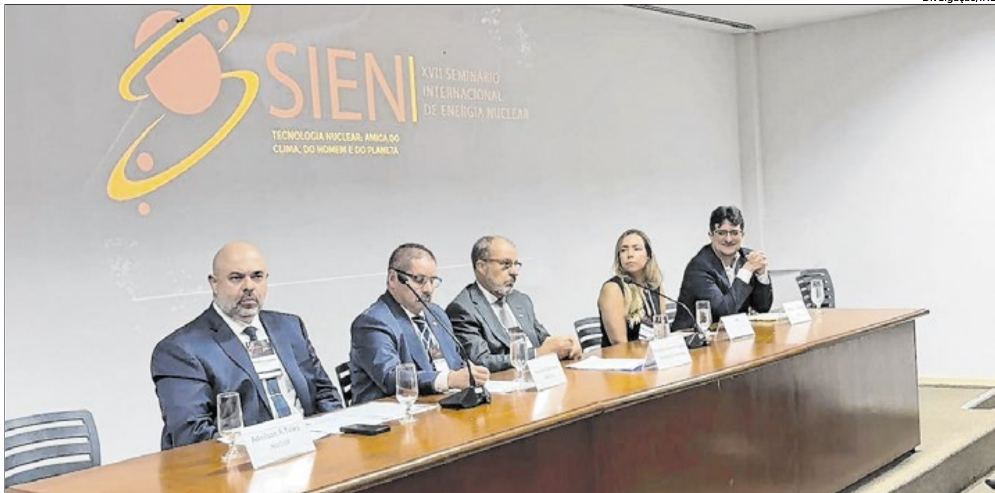
O evento segue até o dia 29 de maio e reúne representantes do setor nuclear para discutir os caminhos da energia nuclear no Brasil

A Indústrias Nucleares do Brasil (INB) participou da abertura do 17º Seminário de Energia Nuclear (SIEN 2026), realizado no Rio de Janeiro. O evento, que termina na sexta-feira, dia 29, reúne representantes do setor nuclear, autoridades, especialistas e empresas para discutir os caminhos da energia nuclear no Brasil. A participação da INB foi na quarta-feira, dia 27, quando aconteceu a abertura do seminário.