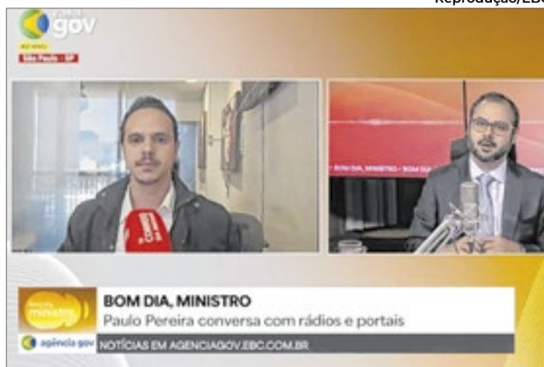
A pejotização “é uma distorção”, disse o ministro

Ao responder sobre o tema, o ministro explicou que a finalidade original da criação do MEI era permitir que o empreendedor informal tivesse acesso a todo o sistema de seguridade. “O sistema foi pensado para aquele empreendedor, para aquela empreendedora que era informal. [...] a manicure que trabalha