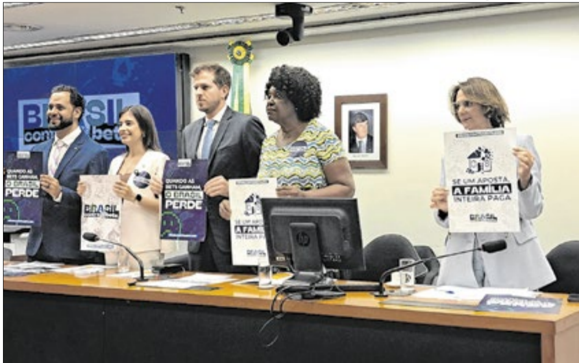
Esquerda e direita uniram-se contra o avanço das bets

O movimento foi apresentado pela Frente Parlamentar Mista para a Promoção da Saúde Mental e ganhou o nome de “Brasil Contra as Bets”. Na Câmara, a proposta tramita como PL 2478/2026. No Senado, como PL 2470/2026. A estratégia foi desenhada para evitar demora no processo legislativo: a Casa que aprovar primeiro envia o texto para revisão da outra.