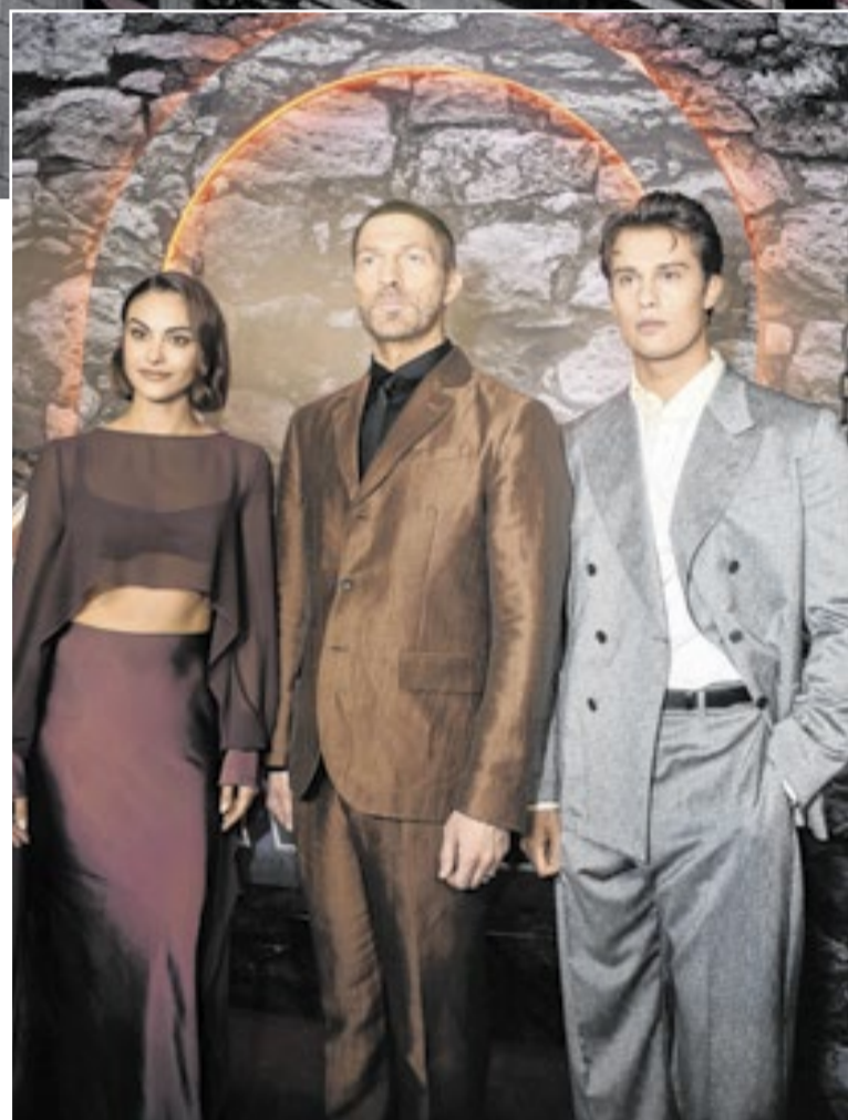
Elenco participou de trio elétrico e da pré-estreia em São Paulo

'Mestres do Universo', live action da animação 'He-Man', promove campanha de tom nostálgico para conquistar público brasileiro