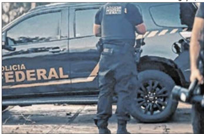
Armamento encontrado em encomenda vinda dos EUA