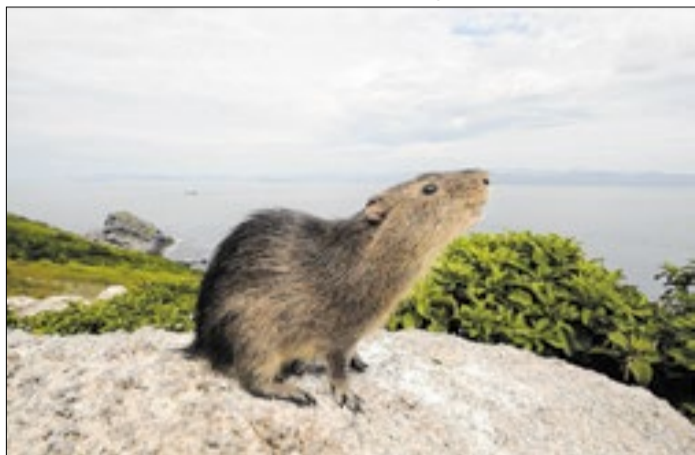
Preá-de-moleques-do-sul: a menor distribuição do planeta