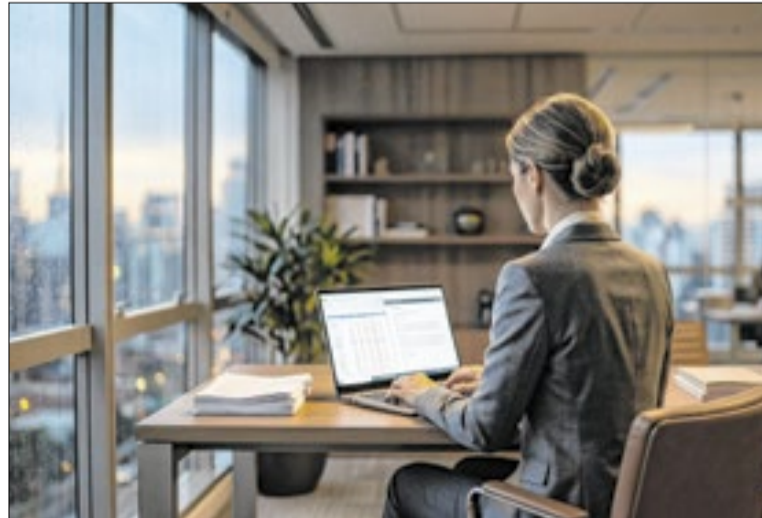
Mulheres líderes passaram de 7,6% em 2010 para 13,2% em 2020

Os dados também mostram avanço gradual da participação feminina ao longo da década. Nos conselhos de administração, as mulheres ocupavam 7,6% das cadeiras em 2010. Em 2020, o percentual