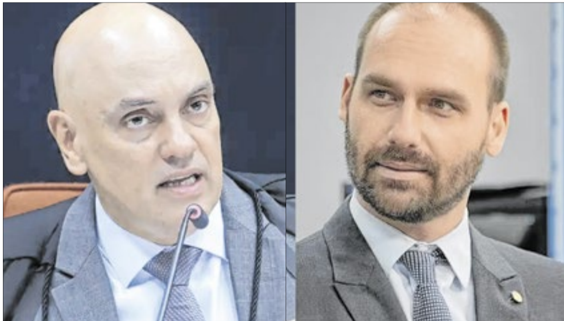
Ministro Alexandre de Moraes julga o ex-deputado Eduardo Bolsonaro em processo no STF

“Dado de singular relevância, consistente no fato de que o acórdão de recebimento da denúncia foi proferido pelo próprio Ministro Relator, que votou pela rejeição da preliminar de impedimento arguida em seu próprio desfavor. Ou seja, o Ministro Alexandre de Moraes decidiu sobre sua própria imparcialidade para julgar o processo em que figura como vítima”.