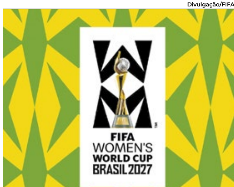
Governo estima investimento bilionário na Copa do Mundo

O Ministério do Esporte afirmou para a equipe econômica, em abril, que a planilha tinha objetivo de “sinalizar a necessidade adicional de suplementação” de diversos órgãos. Também apontou que a própria pasta do Esporte precisa de R$ 620 milhões até o próximo ano.