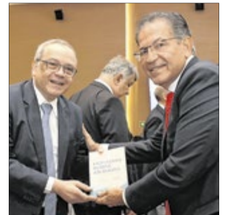
Durante o lançamento do livro, o desembargador do TRF2 Luiz Paulo Araújo com o ministro Mauro Campbell