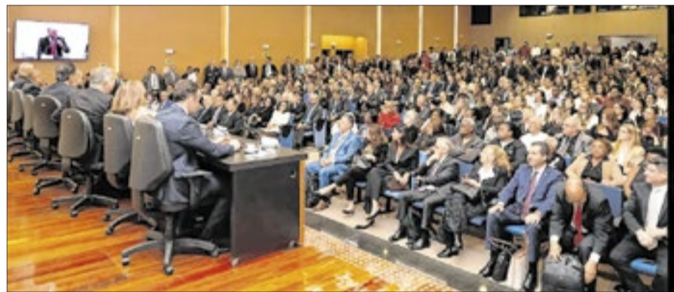
Abertura de inspeção do CNJ no plenário do TJRJ