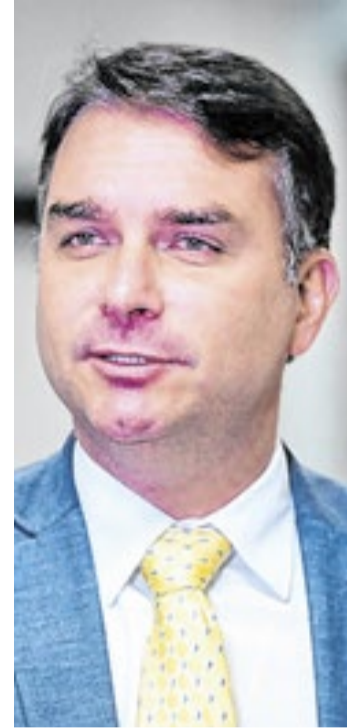
Flávio Bolsonaro aparece atrás de Lula em pesquisas