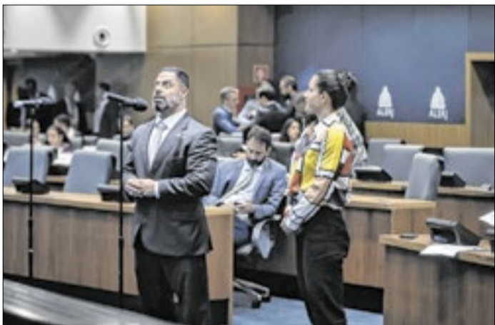
Rio sanciona lei de incentivo às mulheres no esporte