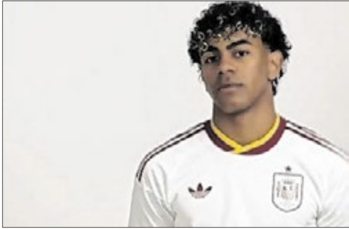
Lamine Yamal encabeça a lista de convocados da Espanha