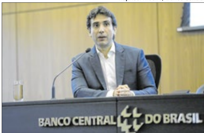
Presidente do BC, Gabriel Galípolo, no anúncio do REF