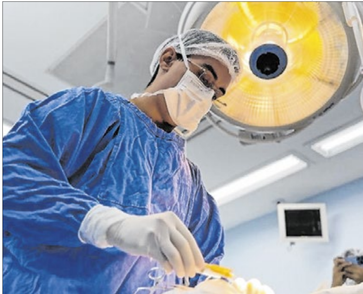
A iniciativa tem como objetivo complementar o custeio de atendimentos hospitalares

Segundo o governo estadual, os recursos serão destinados ao custeio de procedimentos hospitalares de média e alta complexidade, além dos serviços de terapia renal substitutiva realizados diretamente pelos municípios. O objetivo é ampliar a capacidade de atendimento, fortalecer a rede regional de assistência e garantir maior previsibilidade orçamentária às administrações municipais. Durante anúncio da medida, o governador Tarcísio de Freitas afirmou que o programa permitirá aumentar a realização de procedimentos e cirurgias nos hospitais municipais. Segundo ele, o reforço financeiro também deve contribuir para melhorar a estrutura de atendimento à população em diferentes regiões do estado.