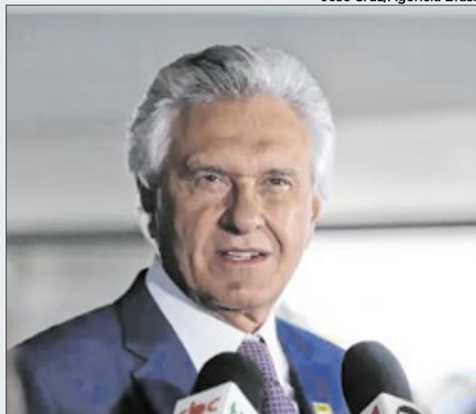
Ex-governador participou de evento na Amcham

Em SP, Caiado disse que o avanço do crime organizado exige uma resposta mais ampla do Estado brasileiro