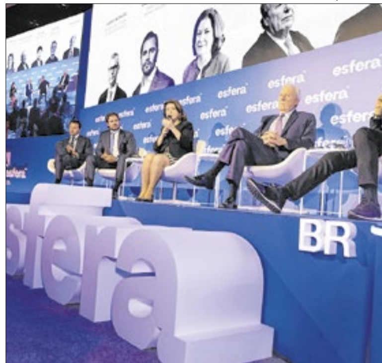
Empresários discutiram alternativa diante da queda de Flávio

Agualusa afirmou que muitos portugueses que demonstram preconceito em relação ao jeito brasileiro de falar não se dão conta de um dado fundamental: 80% dos falantes do português são brasileiros. "Se o Congresso mudar o nome do idioma para brasileiro, será o sexto mais falado no mundo", completou.