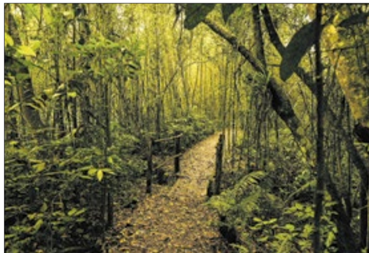
Trilha Interparques é uma lei aprovada no fim de 2025

A diretriz de mobilidade ativa aparece como um dos eixos centrais do projeto. Nesse modelo, o deslocamento deixa de ser apenas um meio para chegar ao destino e passa a integrar a experiência