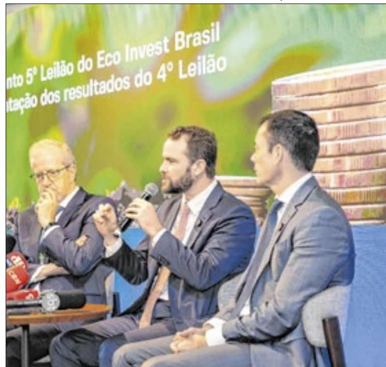
Ministro da Fazenda, Dario Durigan, explica Eco Invest, em SP

A Taesa, transmissora de energia elétrica, também terá proventos pagos aos acionistas no dia 27 de maio envolvendo diferentes classes de ações. Para a TAEE11, os dividendos somam R$ 0,15 e R$ 0,76; para a TAEE3, há R$ 0,05 e R$ 0,25; e para a TAEE4, R$ 0,25 por ação. Todas as distribuições têm data de corte em 29/04/2026.