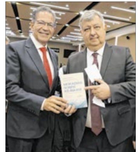
O ministro STJ Mauro Campbell com o corregedor do Rio, desembargador Cláudio Brandão, ao lançar o livro que foi publicado sob a sua coordenação

Na ocasião, também foi lançado o livro "Moradias sobre as águas: Regularização fundiária das palafitas no Brasil", publicado sob a coordenação do ministro STJ, Mauro Campbell.