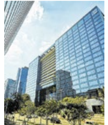
Banqueiros da Faria Lima dizem ter sido enganados