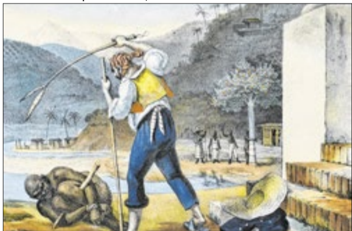
Papa reconheceu que a Igreja não condenou a escravidão

Jean-Baptiste Debret, Domínio Público via Wikimedia Commons