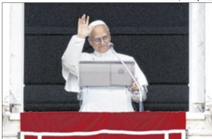
Papa Leão 14 abordou a Inteligência Artificial no texto