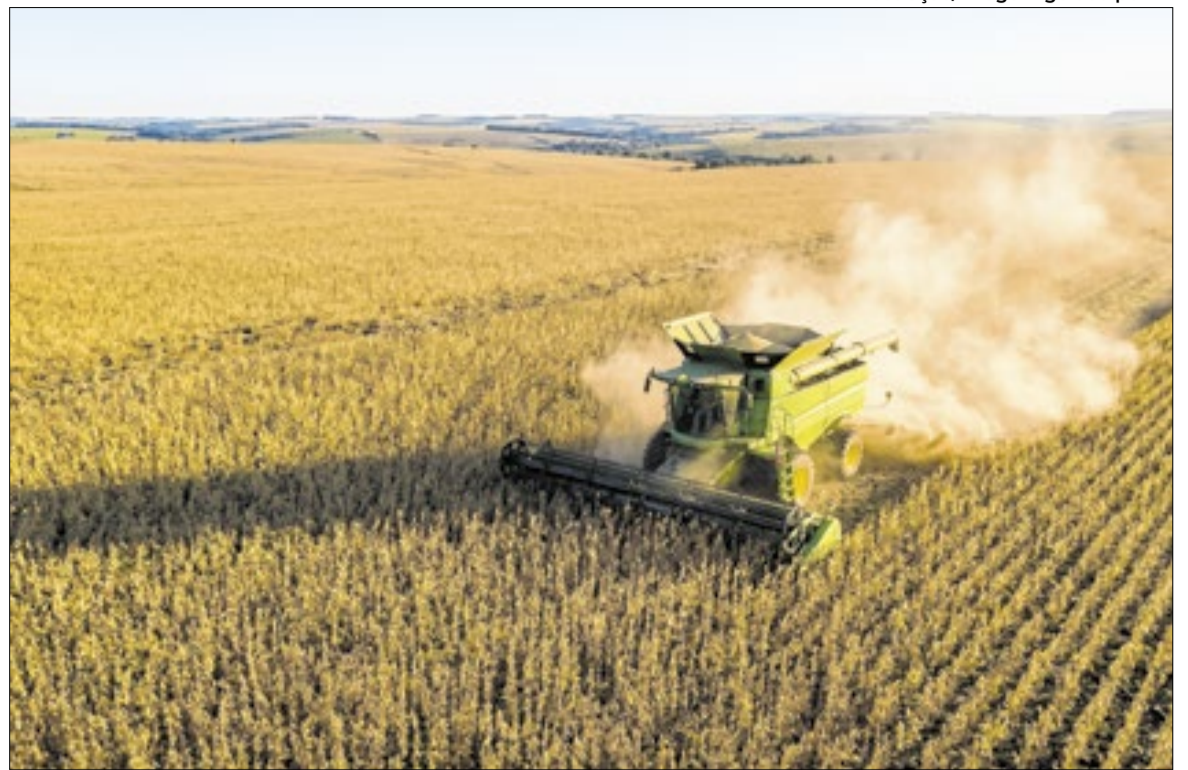
Soja alcançou 166,1 milhões de toneladas exportadas em 2025, sendo levantamento anual do IBGE

A inflação encerrou 2025 em 4,26%, abaixo dos 4,83% de 2024. O grupo habitação teve a maior alta, de 6,79%, seguido por educação, com 6,22%, despesas pessoais, com 5,87%, e saúde e cuidados pessoais, com 5,59%. A energia elétrica residencial subiu 12,31% no ano. Entre os alimentos, o café moído acumulou alta de 35,65%, enquanto o chocolate em barra avançou 27,12%. Em sentido oposto, o arroz caiu 26,56% e o leite longa vida recuou 12,87%.