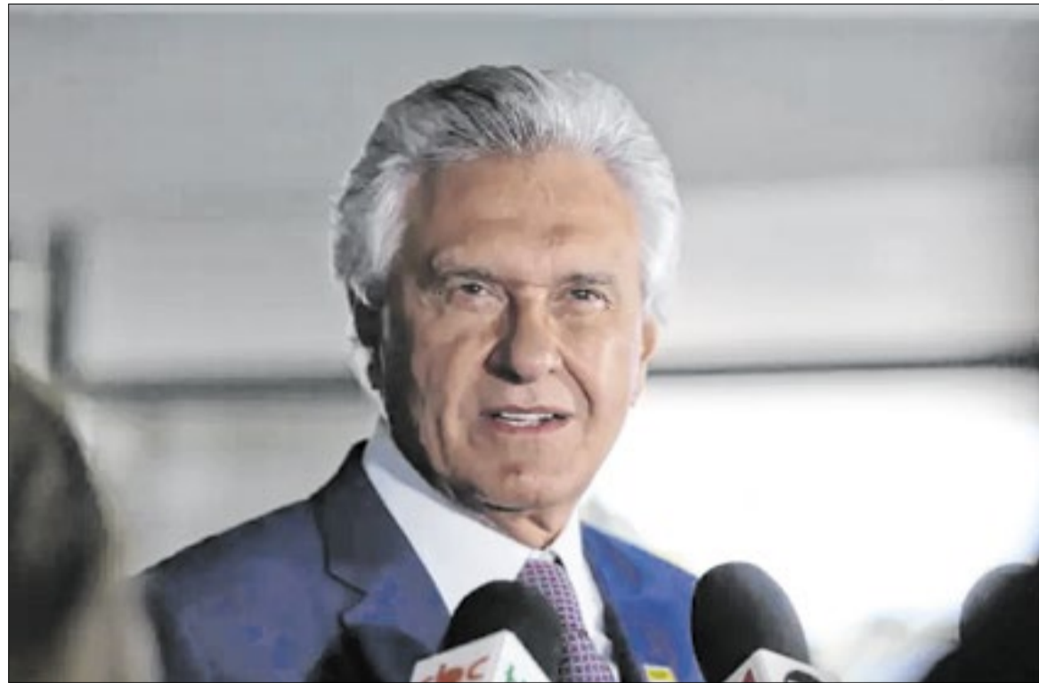
A declaração foi feita na Câmara Americana de Comércio para o Brasil em São Paulo

Ronaldo Caiado também declarou que, em um eventual mandato à frente do governo federal, defenderia o emprego articulado das Forças Armadas, das forças policiais e dos órgãos de inteligência em ações voltadas ao enfrentamento dessas organizações. O ex-governador citou ainda a necessidade de ampliar mecanismos de cooperação internacional e fortalecer ações de monitoramento de todas as fronteiras brasileiras.