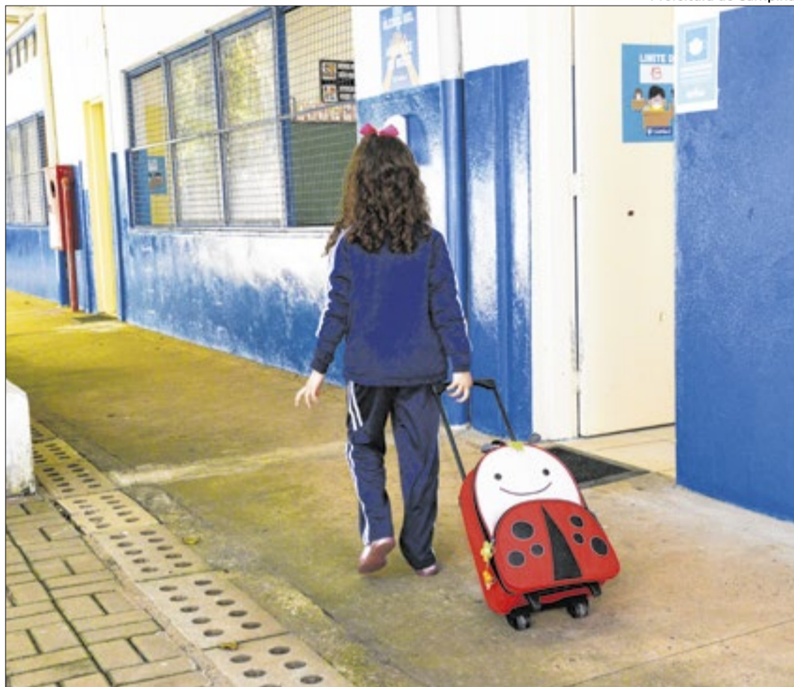
Críticas apontam ampliação da terceirização no segmento da educação especial, entre outros

A SME informa “que o fortalecimento do ensino municipal e a participação ativa dos profissionais de educação na reformulação das diretrizes curriculares estão entre os compromissos da atual gestão”. Declara que “este processo de atualização das normas que orientam o planejamento, a organização e avaliação das propostas pedagógicas começou em 2025 e garante amplo espaço para contribuições dos servidores