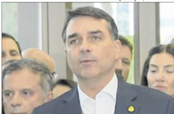
Jair Bolsonaro não admite saída do filho Flávio