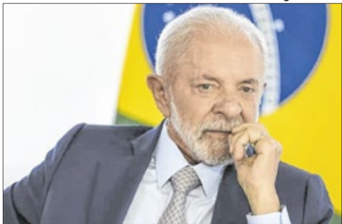
Mesmo se vencer, Lula terá que ceder para a direita