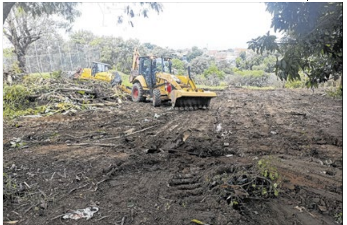
Tratores atuam em Área de Preservação Permanente no Parque Itajaí IV, em Campinas

Questionada pelo Correio da Manhã , a Prefeitura não respondeu ao principal questionamento