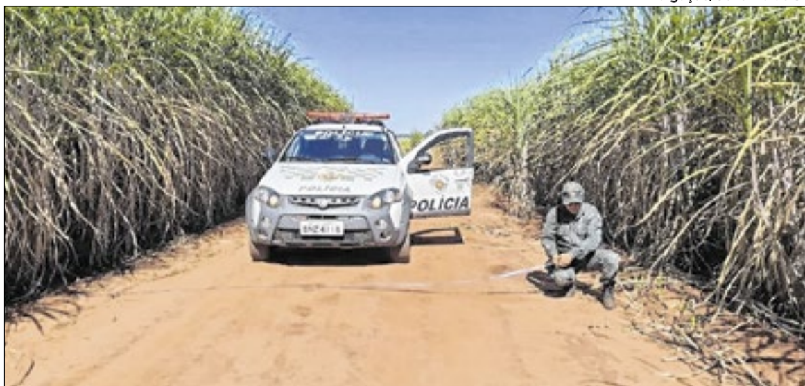
As equipes vão intensificar o monitoramento de aceiros

Durante a operação, os policiais ambientais vão vistoriar as condições dos aceiros — faixas