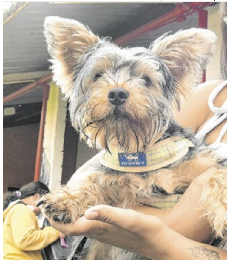
Castração e microchipagem gratuitas ocorrem no Vida Nova

O SinPatinhas (Sistema do Cadastro Nacional de Animais Domésticos) foi desenvolvido pelo Governo Federal para gerenciar e monitorar a política pública de controle populacional de animais.