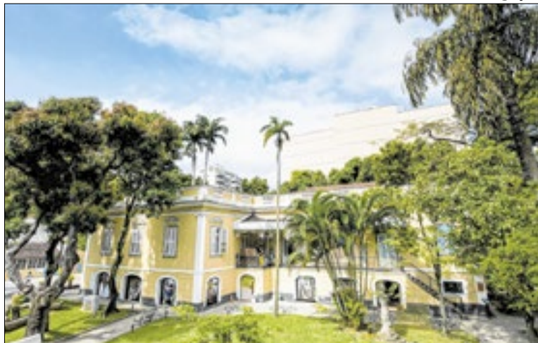
Evento acontece em três museus do Rio de Janeiro

“O Fórum Estadual de Museus é um espaço fundamental para fortalecer o diálogo entre profissionais, instituições e a sociedade. Ao trazer reflexões urgentes sobre memória, inclusão e justiça social, o encontro