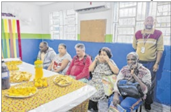
Pacientes atendidos galaram sobre os vínculos criados