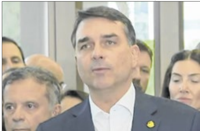
Jair Bolsonaro não admite saída do filho Flávio