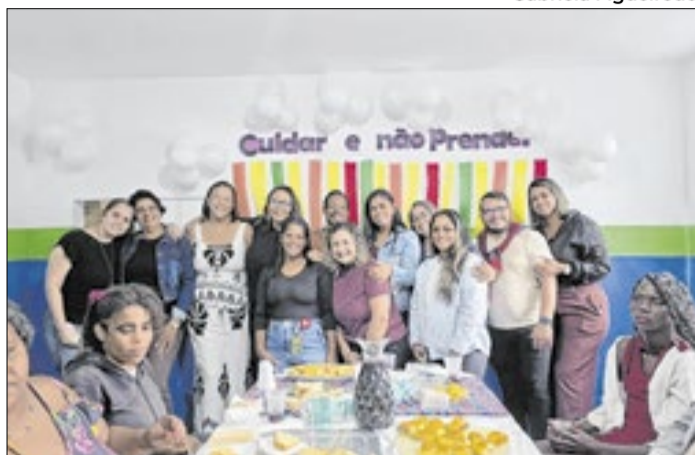
Evento reuniu usuários, familiares e profissionais do CAPS