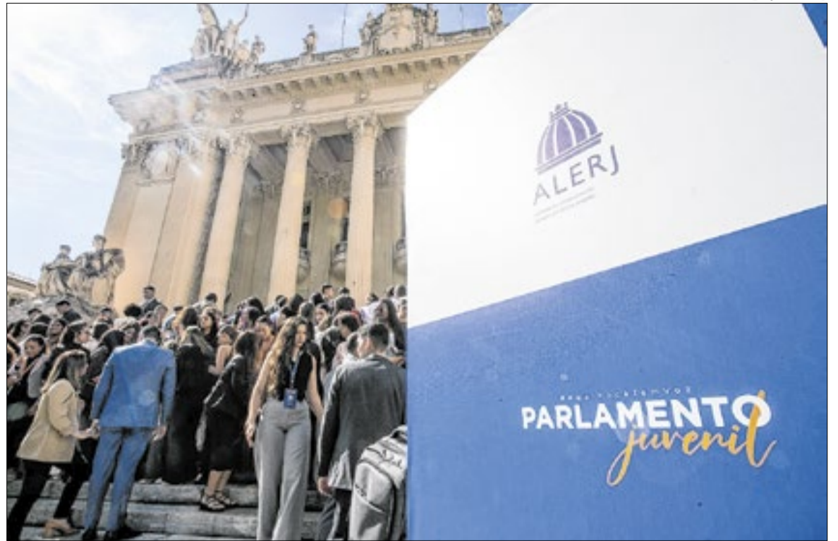
leias apresentadas por jovens parlamentares inspiraram leis válidas para todo o Estado do Rio

Aluno de BM emplacou a criação da Semana de Conscientização e Combate à Gordofobia