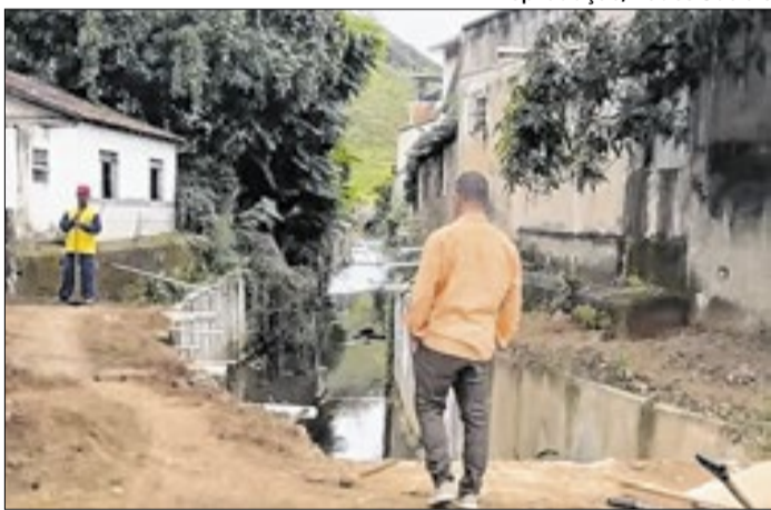
Deputado estadual esteve no Córrego das Laranjeiras