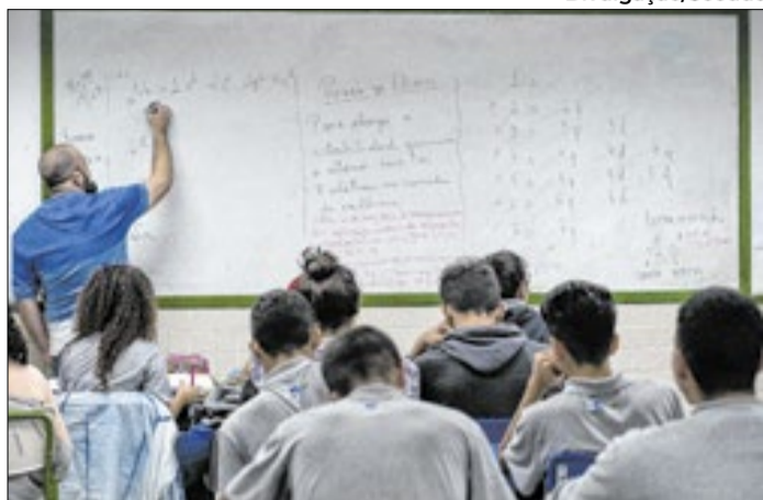
Migração contribui para a permanência dos docentes