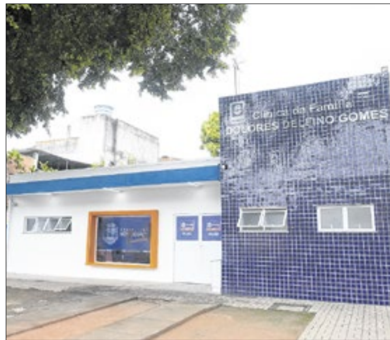
Super Clínica tem horário de funcionamento estendido

A Policlínica Neuza Brizola encerrou a "semana da Enfermagem", que teve como um dos objetivos mostrar a importância da categoria no sistema de saúde de uma forma geral. Durante o dia, a Policlínica fez uma série de atividades, como por exemplo, aferição de pressão. Os profissionais comemoraram a data com um café da manhã.