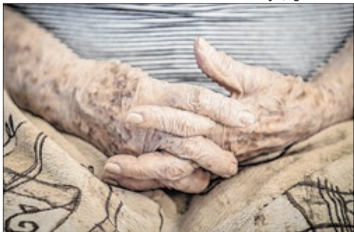
Ausência de atendimento preferencial é ato discriminatório