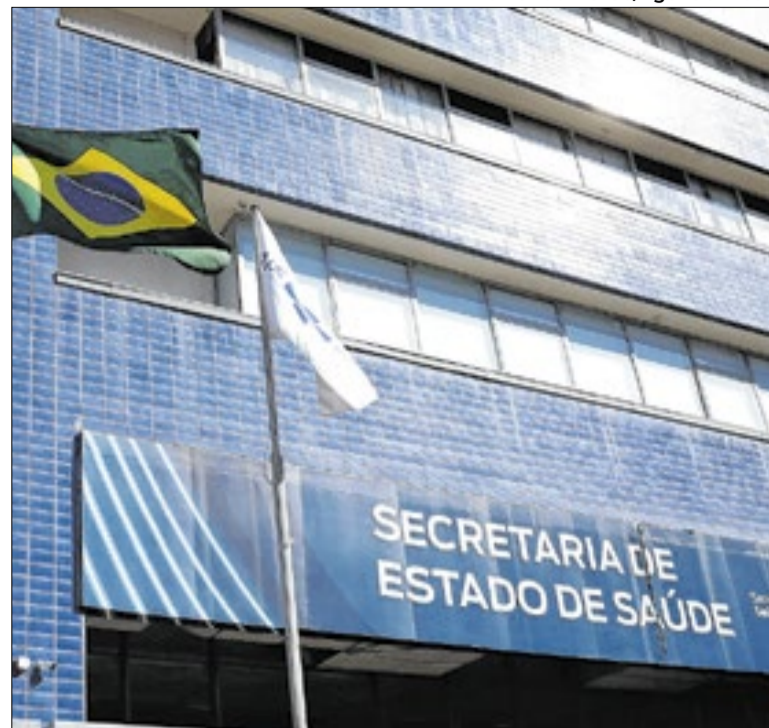
Mudança busca evitar interferência política nos repasses

A Orquestra Filarmônica Metropolitana fará um concerto sacro no dia 1º de junho, na Igreja Matriz de São Gonçalo. A apresentação gratuita marca a abertura da semana de Corpus Christi, período em que a cidade confecciona o maior tapete de sal da América Latina. O ingresso deve ser retirado na plataforma Sympla.