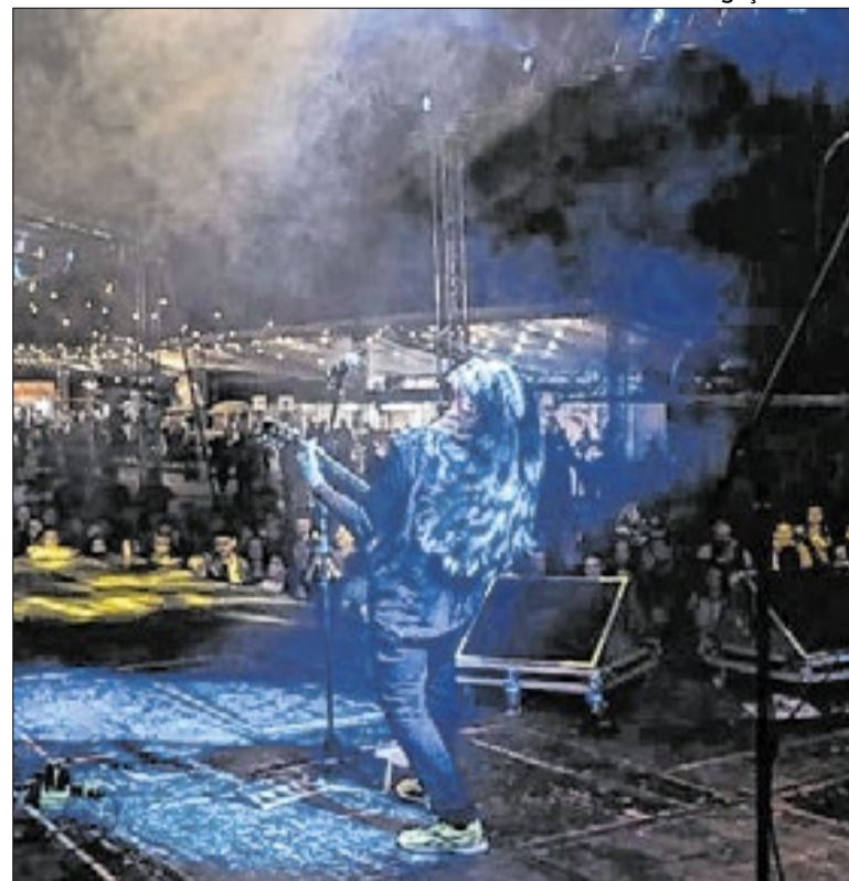
Festival "Rock In Cover" é um dos eventos realizados em Ipiabas