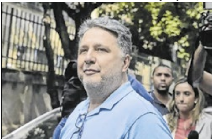
Ex-governador do Rio de Janeiro, Anthony Garotinho