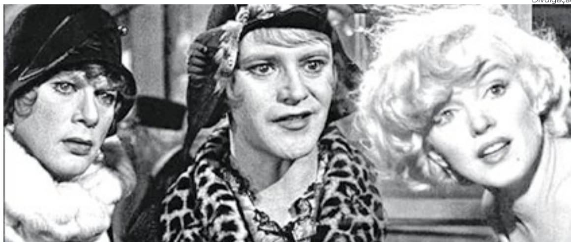
Quanto Mais Quente Melhor (1959)

No centenário da diva, o Grupo Estação faz do Net Gávea uma máquina do tempo para uma Hollywood que glamourizou, mas objetificou a estrela - hoje um signo da força feminina