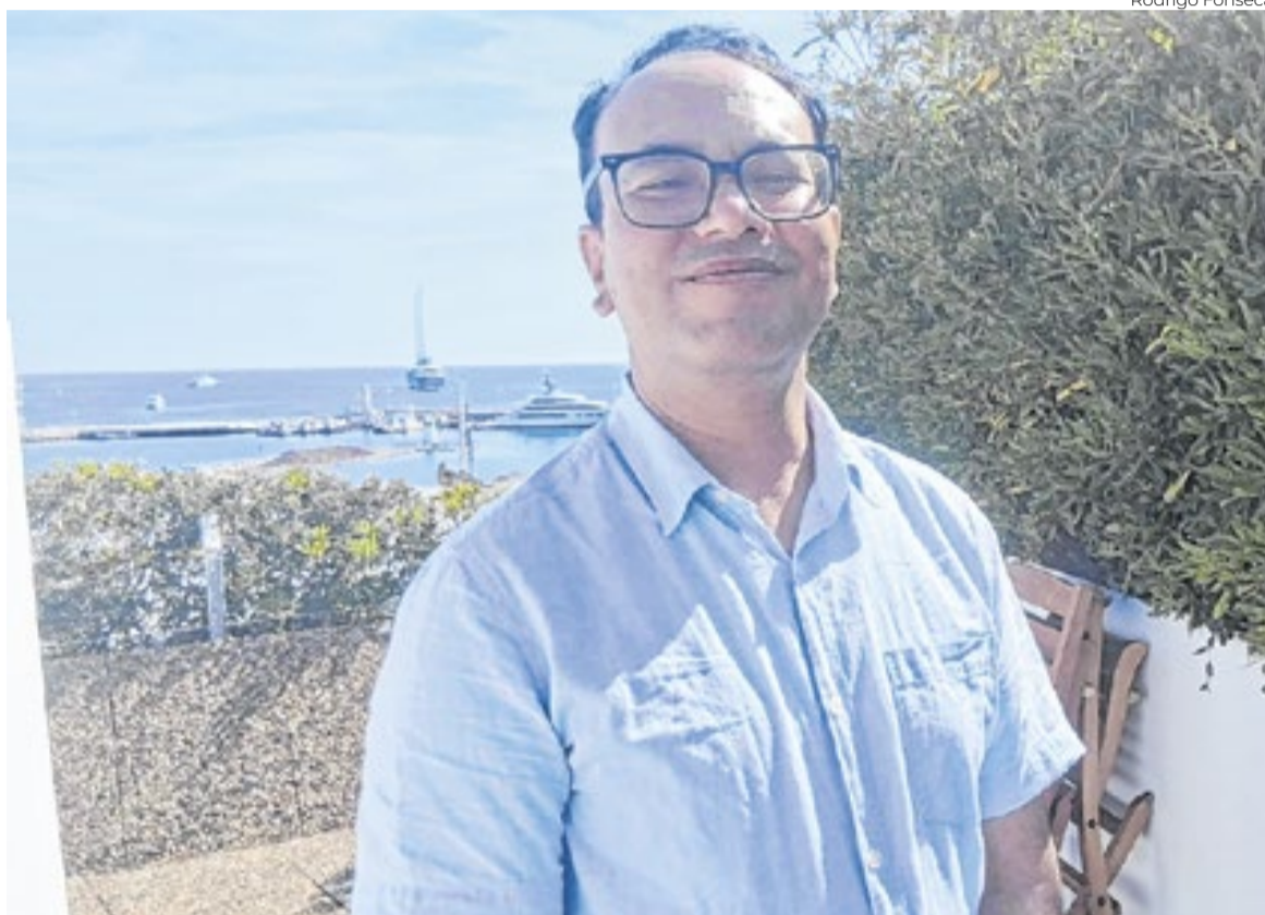
Abinash Bikram Shah, cineasta nepalês premiado no Festival de Cannes

Abinash Bikram Shah - Eu me senti como se estivesse orando de alguma forma. E não existe