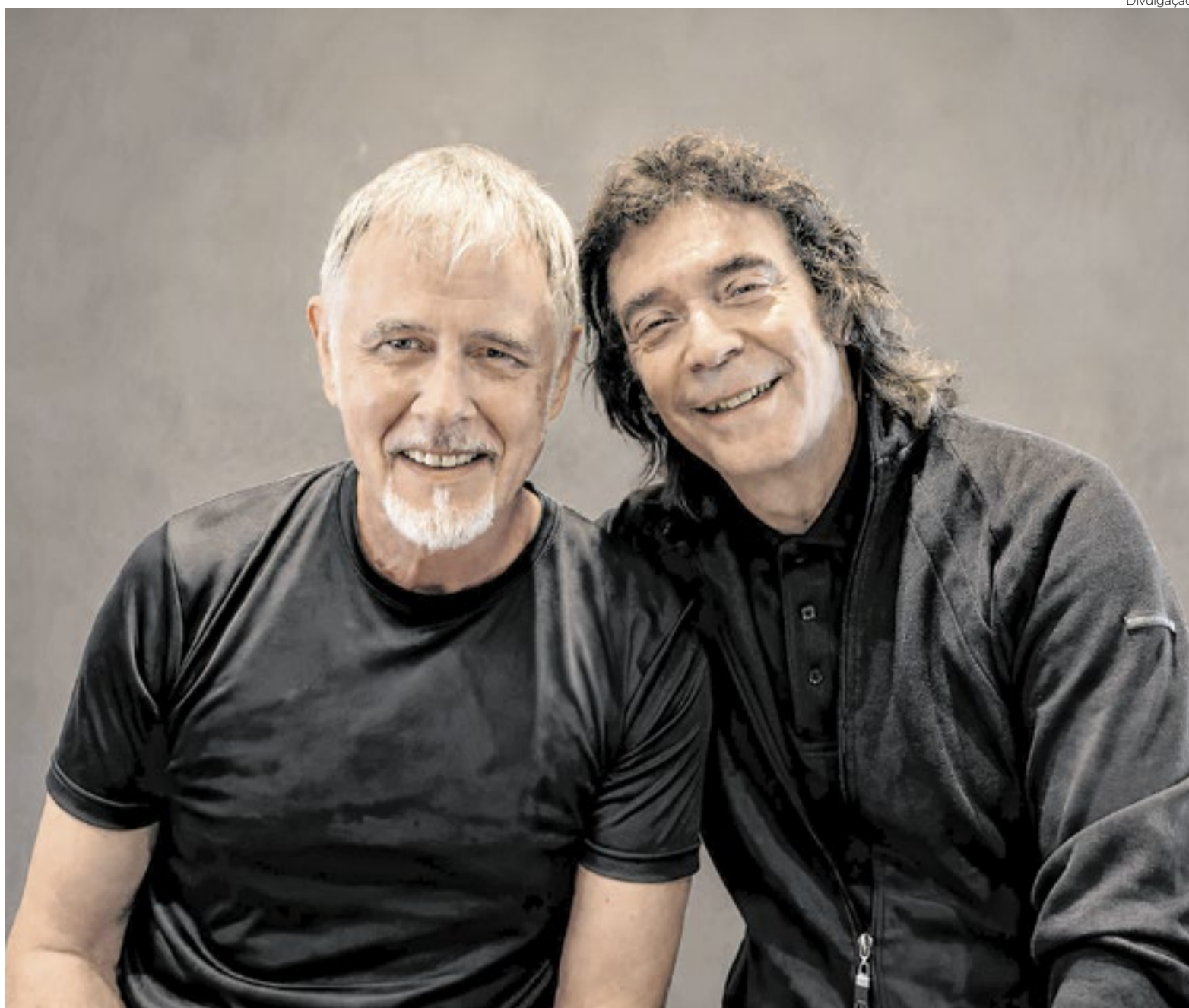
Ritchie e Steve Hackett: amizade que nasceu em 1980