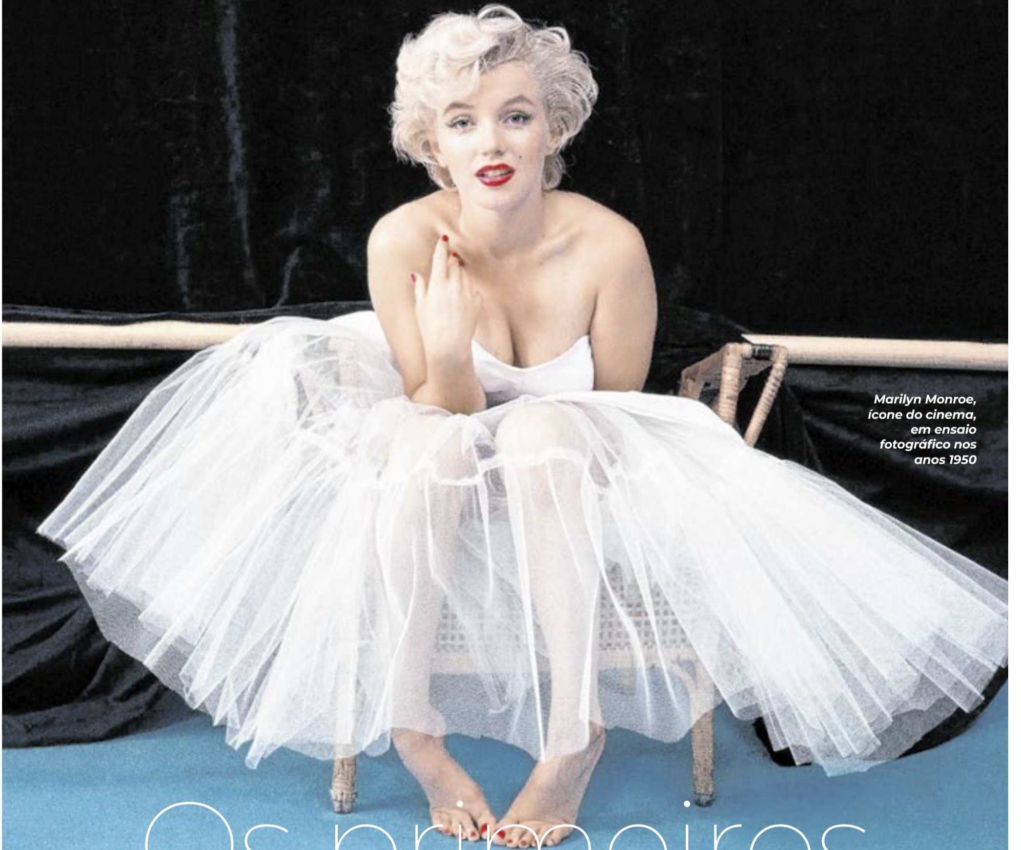
Marilyn Monroe, ícone do cinema, em ensaio fotográfico nos anos 1950