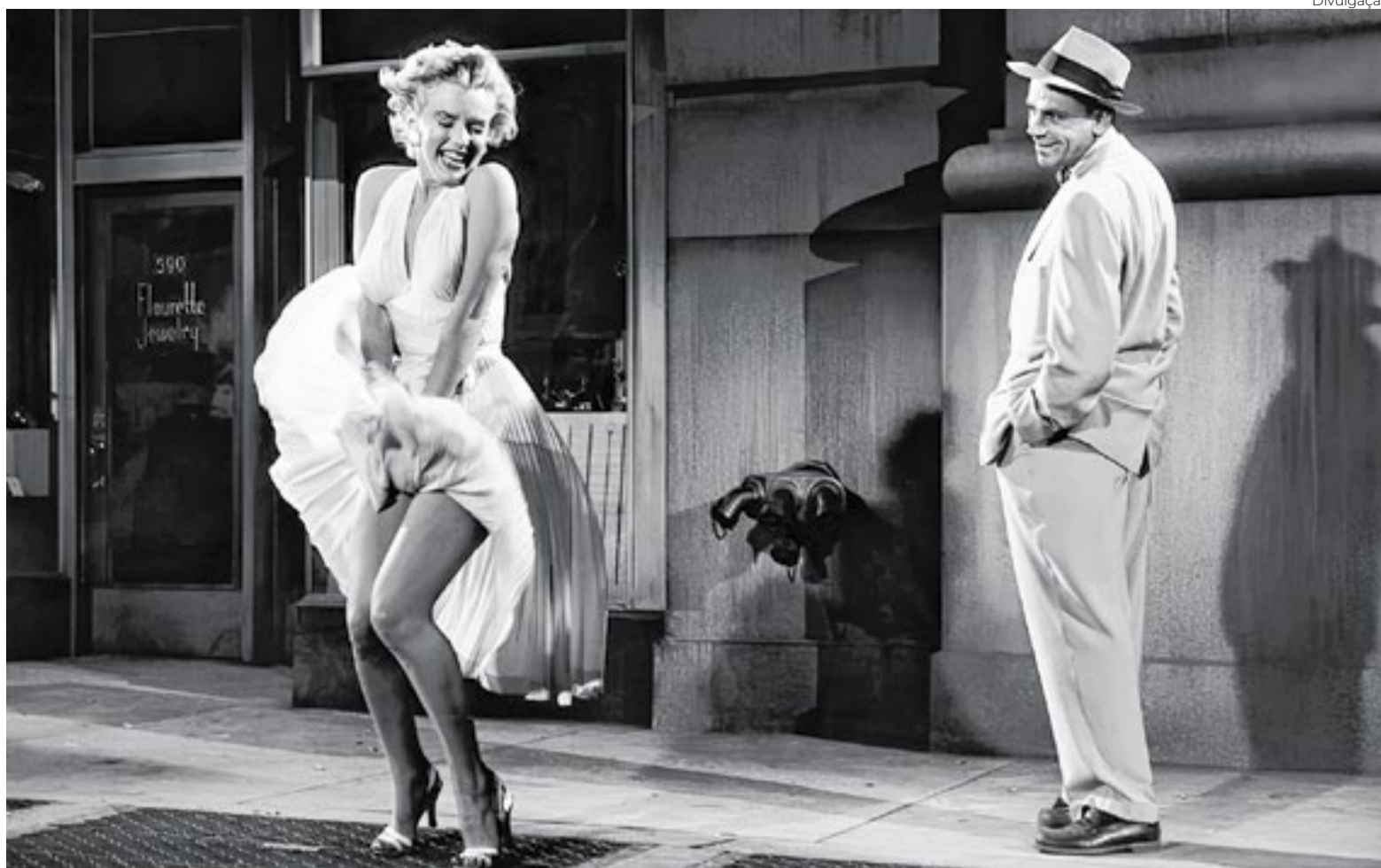
O Pecado Mora ao Lado (1955)

A entrada de Marilyn Monroe no cinema aconteceu depois de sua experiência como modelo fotográfica. Durante a Segunda Guerra Mundial, ela trabalhava numa fábrica de equipamentos militares quando foi descoberta por fotógrafos interessados em campanhas de propaganda patriótica. O sucesso das imagens abriu caminho para contratos como pin-up, como modelo publicitária. Em 1946, assinou seu primeiro acordo com a 20th Century Fox e adotou o nome artístico Marilyn Monroe, usando “Marilyn” em homenagem à atriz Marilyn Miller e “Monroe” como sobrenome herdado da mãe. Sua estreia oficial no cinema ocorreu