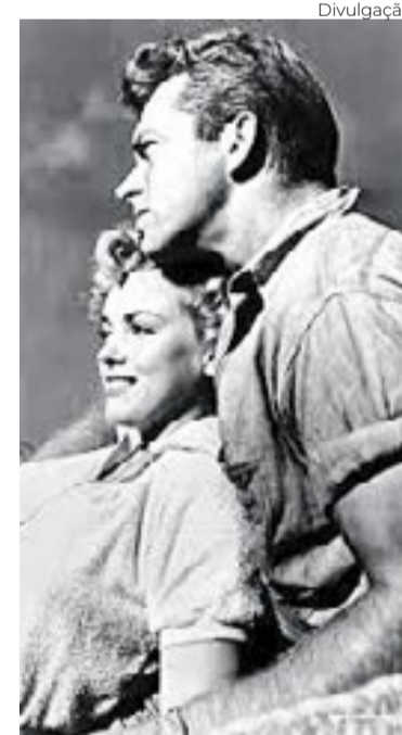
Só a Mulher Peca (1952)

em 1947, no filme “Dangerous Years”, em participação pequena, seguida por “Scudda Hoo! Scudda Hay!”. Pouco depois, perderia o contrato inicial, mas insistiu na carreira, passando a frequentar testes e produções menores até conquistar atenção em Hollywood.