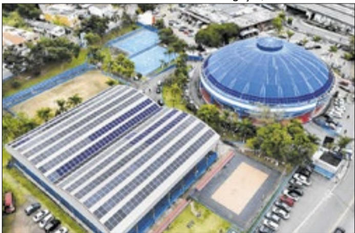
As Usinas foram instaladas no Ginásio de Esportes