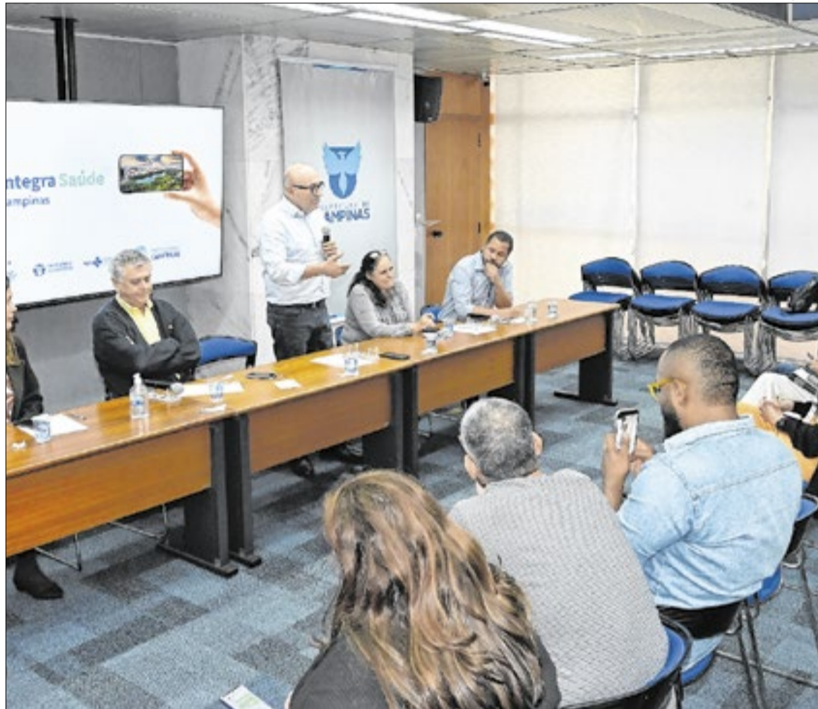
Plataforma Integra Saúde foi lançada oficialmente pelo prefeito na Sala Azul do Paço Municipal

“É um avanço que vai permitir mais agilidade no atendimento porque o médico vai ter acesso aos exames, aos medicamentos que o paciente está tomando, ao tratamento que está sendo feito, à cirurgia que ele eventualmente já fez. Vai permitir que o médico não solicite exames que já foram feitos recentemente. Isso traz uma economia para o sistema de saúde e agilidade para o tratamento do paciente. Vai permitir que o médico tome a decisão com mais rapidez”, afirma o prefeito