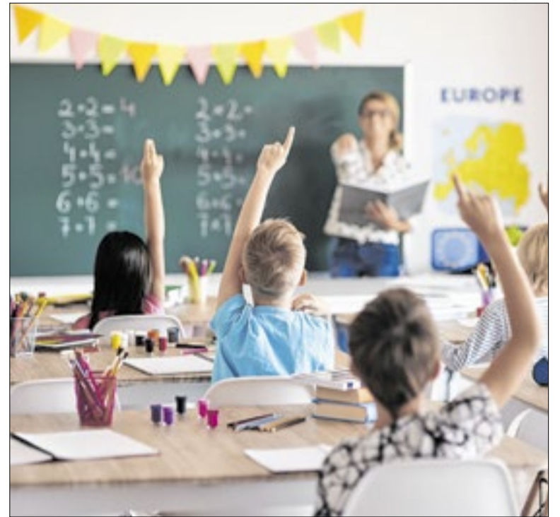
Nova unidade é a décima a operar em período integral

A Prefeitura de Jaguariúna inaugura nesta segunda (25), às 19h, a revitalização da Praça Santa Cruz. O evento gratuito terá show da Banda Made In Roça. A obra ocorreu via Parceria Público-Privada com a empresa Quiosque Villa Maria Ltda, incluindo reformas de infraestrutura, paisagismo e a reabertura do quiosque.