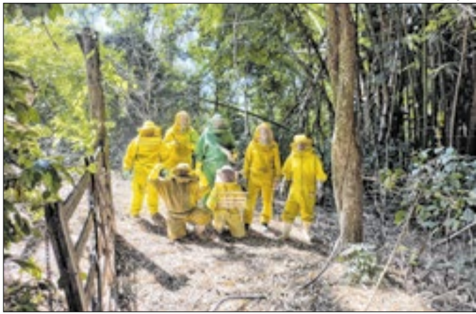
Produtores levam abelhas em diferentes fazendas