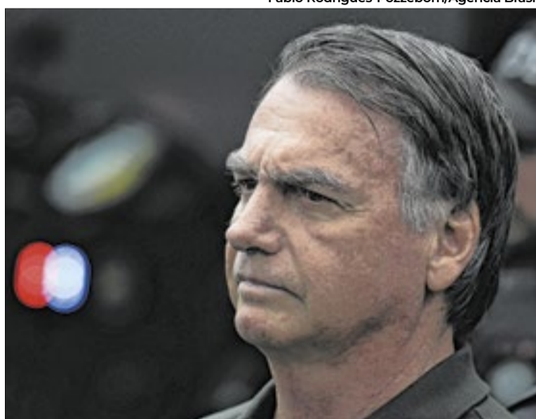
Documentos enviados ao STF detalham rotina de Bolsonaro