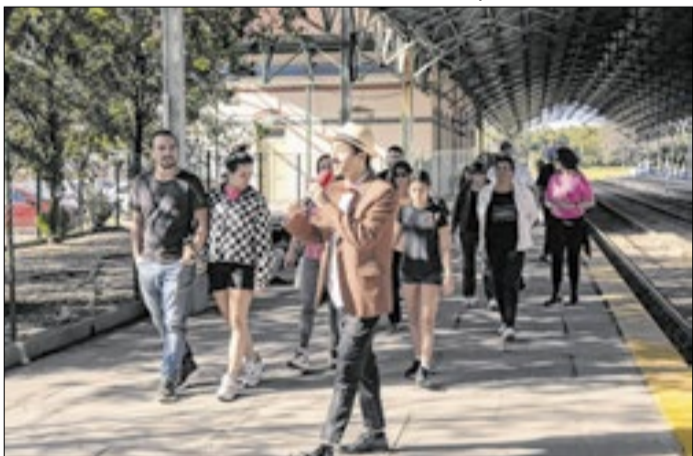
Ação busca resgatar história do município