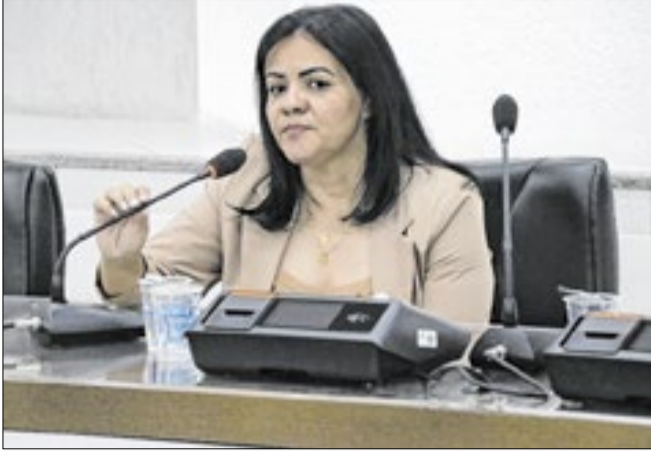
Palestra trata da relevância das Escolas do Legislativo

Associação Brasileira das Escolas do Legislativo e de Contas (Abel)