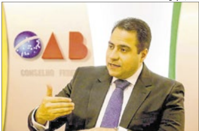
Beto Simonetti comanda a OAB Nacional até 2028