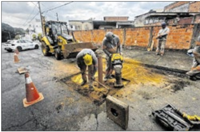
DAE faz obras para aprimorar o controle do fluxo de água