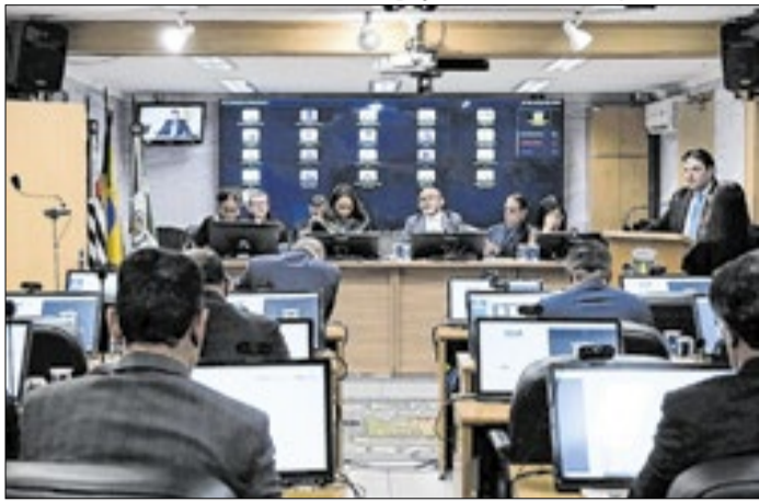
Saúde Mental e Segurança Pública foram debatidos