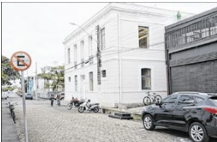
Anúncios contemplam os 14 municípios da região