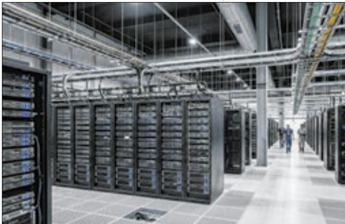
Data Center armazena dados e serviços na internet