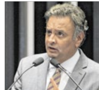
Aécio Neves (PSDB-MG)

Segundo Luciano Vieira, Aécio Neves mantém influência dentro da legenda e possui cre-