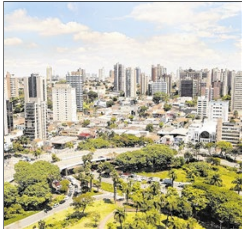
O Plano traz novidades na área Urbana e na Gestão

Segundo o vereador, a ação não gera custos adicionais para a cidade, pois ela utilizará a estrutura e o quadro de servidores existentes. A matéria recebeu parecer favorável das comissões permanentes da Câmara e foi aprovada em plenário. O PL segue para sanção do Executivo municipal antes de entrar em vigor.