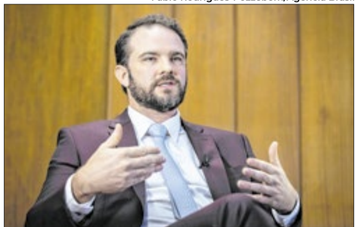
O ministro da Fazenda, Dario Durigan