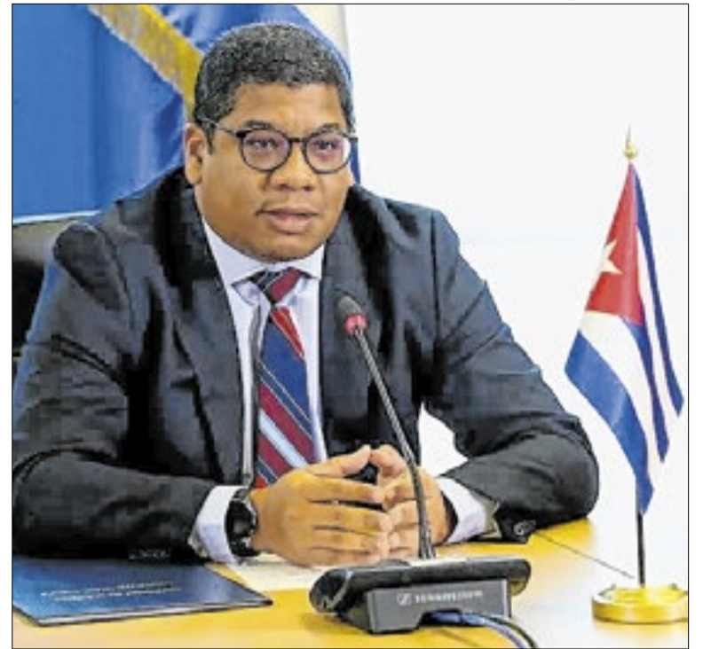
Embassador de Cuba no Brasil, Victor Manuel Cairo Palomo

Mas, daí, cogitar-se homenagens a condenados hediondos só revela que a bola de neve moveu-se ladeira abaixo. É preciso que as reverências continuem sendo dadas, mas a quem as merece, como a Academia Campinense de Letras, recém agraciada.