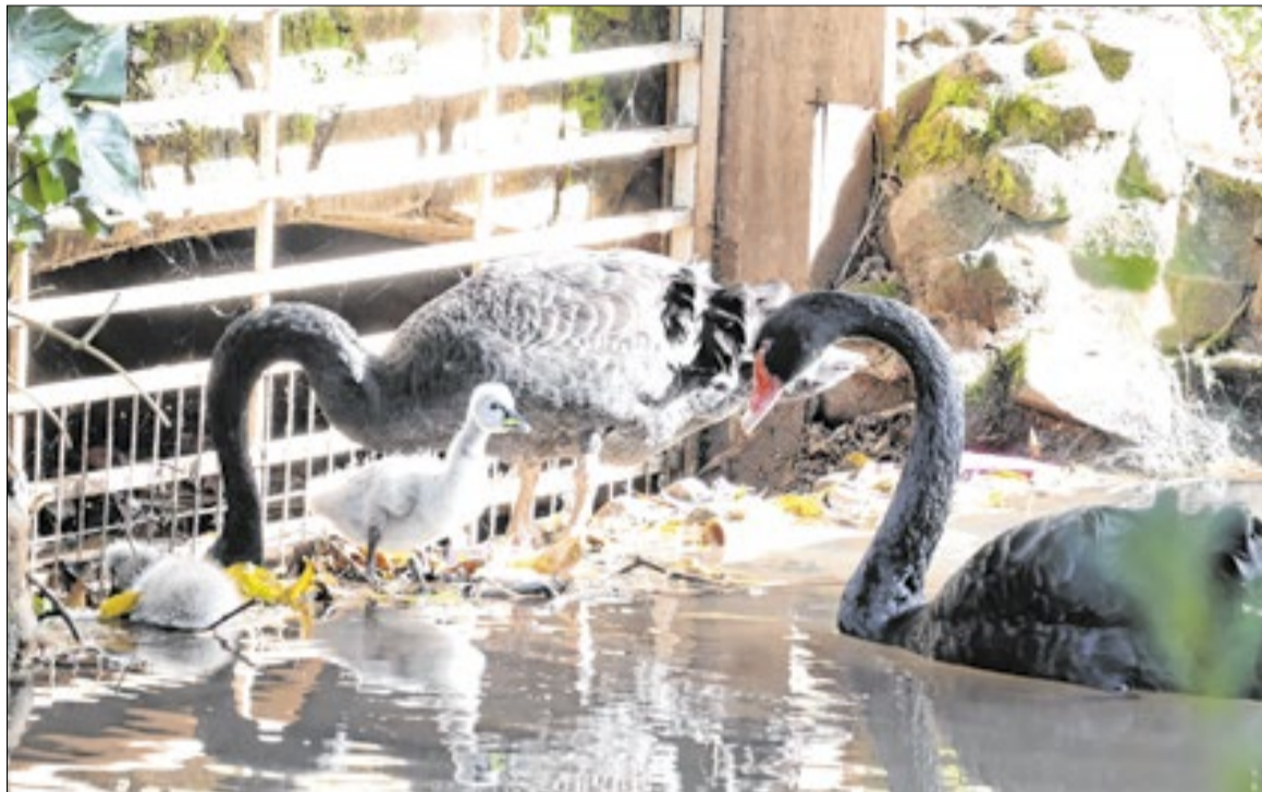
Segundo profissionais, nascimentos de filhotes indicam bem-estar animal no zoológico

O íbis-sagrado é uma espécie originária do continente africano e possui registro histórico de relevância cultural no Egito