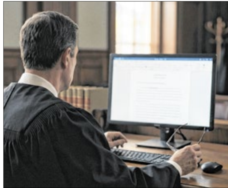
Peça continha citações inexistentes de decisões judiciais

A denúncia cita exercícios realizados de joelhos, deslocamentos exaustivos com equipamentos e punições fora dos regulamentos. Um dos recrutas teve quadro de exaustão extrema durante os treinamentos veio a falecer. Os militares respondem por maus-tratos previstos no Código Penal Militar.