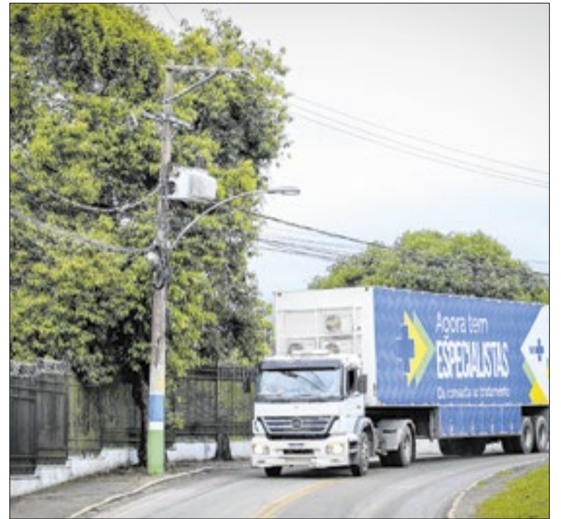
Dispositivo no Shopping Piracicaba atende até 19/06

Ribeirão Preto abre hoje as inscrições para 342 vagas em 18 cursos gratuitos de capacitação profissional no Centro de Qualificação Social, na Av. Dom Pedro I, 45. As inscrições vão até sexta (29), pelo site ribeiraodigital.com.br. Entre as novidades, destaque para o curso inédito de bolos, salgadinhos e doces.