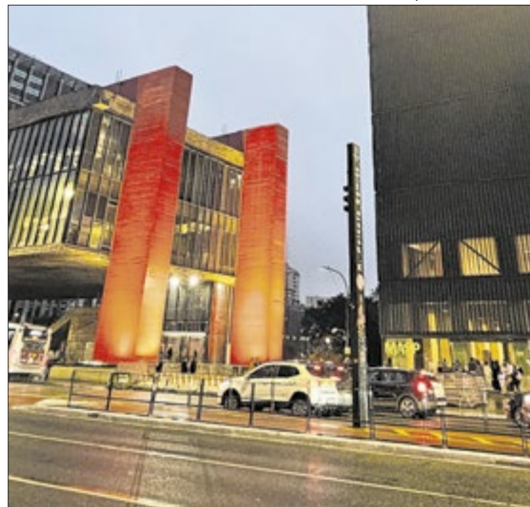
Visita ao MASP nos fins de semana custa até R$ 75, a inteira.

O ministro do Trabalho, Luiz Marinho, anunciou R$ 30 milhões para qualificação profissional em 14 estados e 17 municípios ligados ao Sine. Os recursos do Fundo de Amparo ao Trabalhador (FAT) serão usados em cursos de capacitação, inclusão produtiva e ações voltadas à geração de emprego e renda.