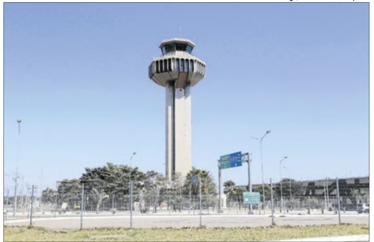
O governo federal quer aproveitar a renegociação da concessão de Viracopos

Viracopos opera atualmente com apenas uma pista de pouso e decolagem e registra cerca de 124,6 mil operações anuais. Pelo contrato original da concessão, firmado em 2012, a construção de uma segunda pista só seria obrigatória quando o aeroporto atingisse a marca de 178 mil pousos e decolagens por ano.