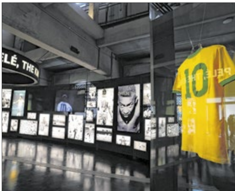
Objetos históricos de Pelé integram acervo do museu

Terça-feira a domingo, das 9h às 18h (entrada até 17h) | Toda primeira terça-feira do mês, até 21h (entrada até 20h) | Ingressos: R$ 24,00 (inteira) e R$ 12,00 (meia-entrada) | Grátis às terças-feiras (ingresso pela internet) | Crianças até 7 anos não pagam