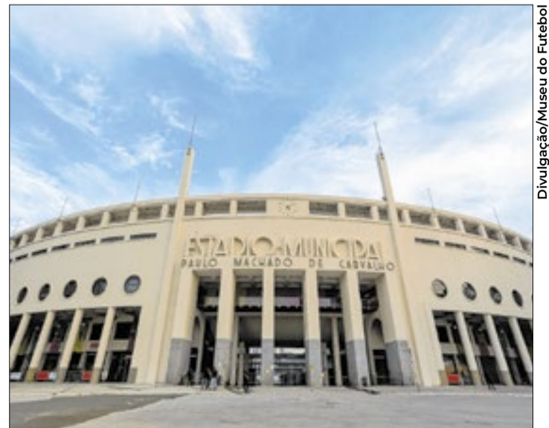
Fachada do estádio do Pacaembu, sede do Museu do Futebol