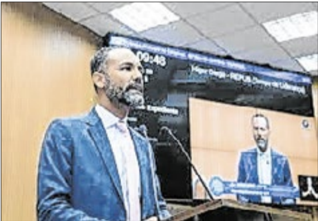
Evento priorizará beneficiados de programas sociais