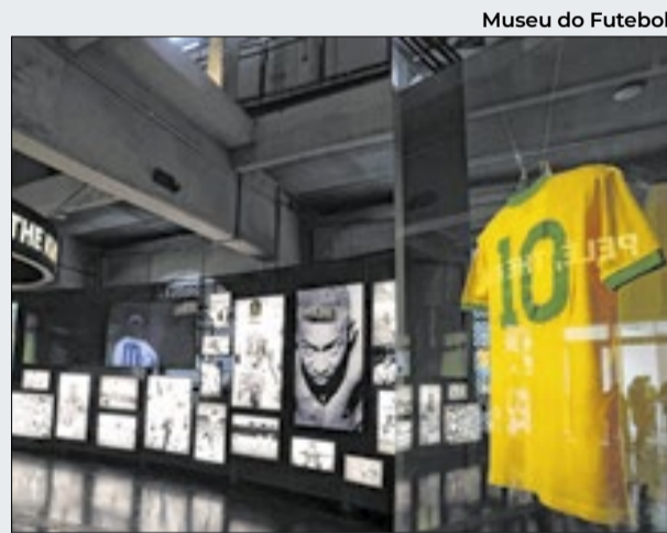
Visitantes podem desfrutar de forma interativa

O espaço conta com o programa "Futebol é Mais", que simula uma transmissão de rádio