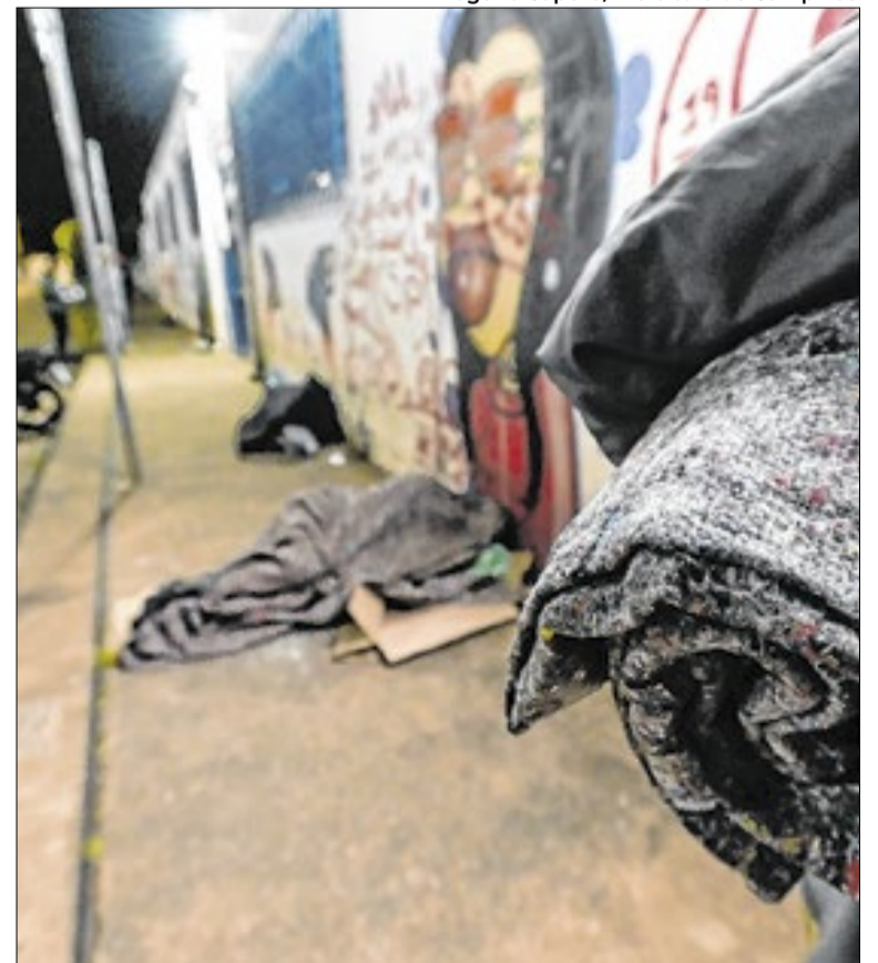
População pode acionar o serviço de Abordagem Social pelo 156

A Operação Inverno é realizada anualmente pela Prefeitura, por meio da Secretaria de Desenvolvimento e Assistência Social, de 1º de maio a 30 de setembro.