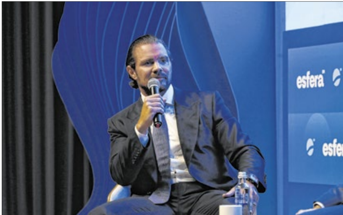
Ex-banqueiro poupou ministros do STF

Interlocutores de Vorcaro afirmam que o banqueiro entrou em “pânico” diante da possibilidade de voltar ao sistema pe-