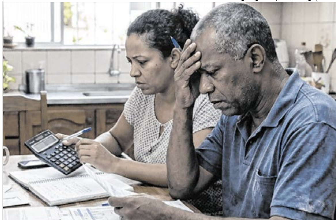
Índice de Desconforto de Crédito (IDC) atingiu o maior nível da série histórica

Na série histórica, o menor nível do IDC aparece durante a pandemia. O indicador chega a 0,02, que é o menor valor registrado no período analisado. Nesse momento, houve queda ao mesmo tempo