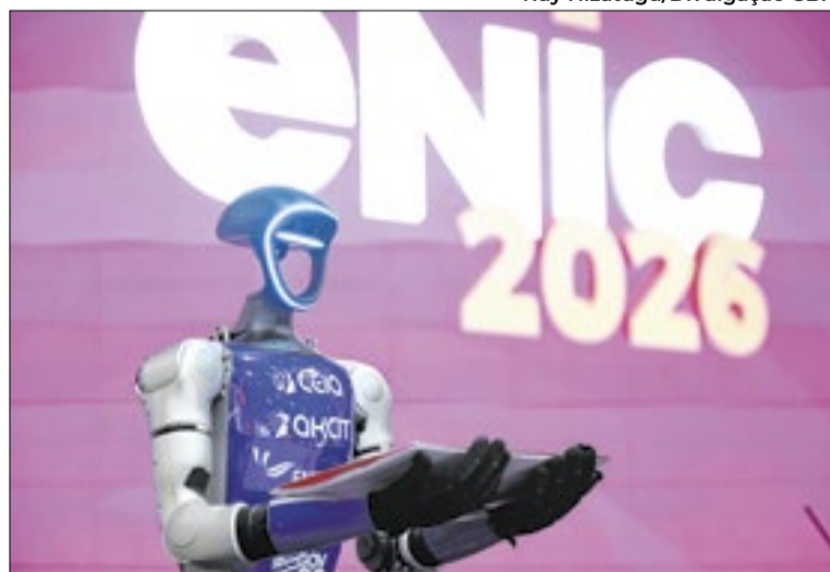
Evento da indústria da Construção aconteceu de 19 a 21 de maio

Segundo a empresa, parte dos produtos ainda exige adequação a normas e certificações dos Estados Unidos. A WKM desenvolve no Brasil um projeto residencial em Valinhos (SP), usado como referência para adaptação de fornecedores ao padrão americano.