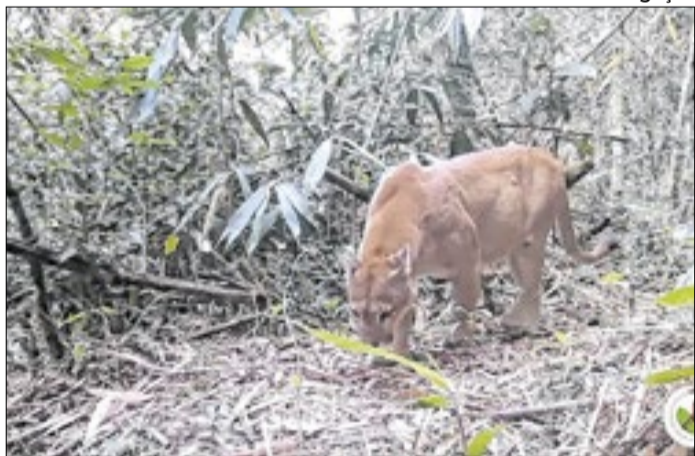
Entre os grandes mamíferos registrados está a Onça-parda