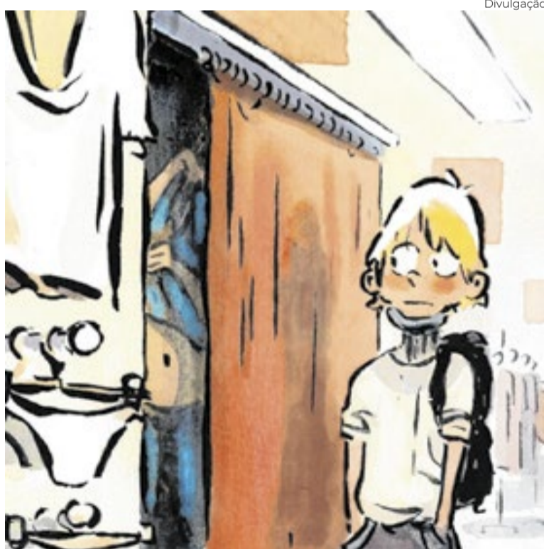
A animação ‘Le Corset’ sai da Croisette com apetite de milhões