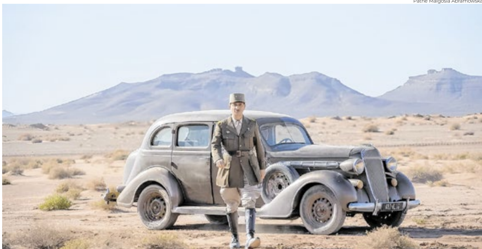
‘La bataille de Gaulle L’âge de Fer’ é uma das maiores apostas da França para 2026

Quem trabalha feito formiguinha para elevar a receita daquela nação - que foi o berço do cinema,