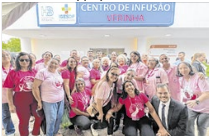
Projeto trata da nomeação de ala no Hospital de Base