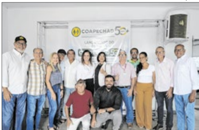
O ato aconteceu durante o evento "COAPECHAD 50+"