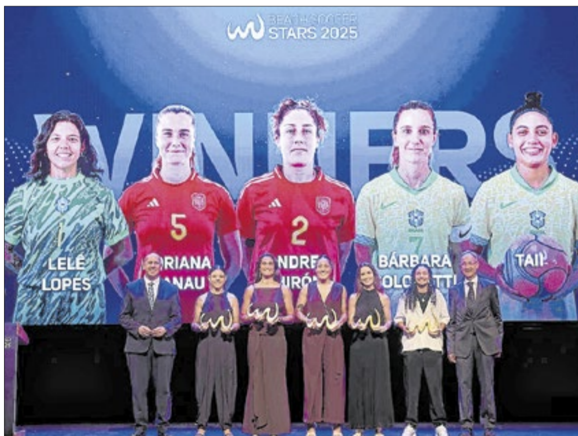
Brasil também emplacou três jogadoras na categoria feminina da premiação

time quando eu pensei em parar de jogar. Agradeço ao apoio da CBF também, que vem tratando do beach soccer feminino com muito carinho e igualdade em relação ao masculino. Aproveito o momento para reforçar que já passou da hora de termos a primeira Copa do Mundo feminina. Temos seleções, atletas de ponta e muita vontade de fazer isso acontecer”, disse a capixaba, que este-