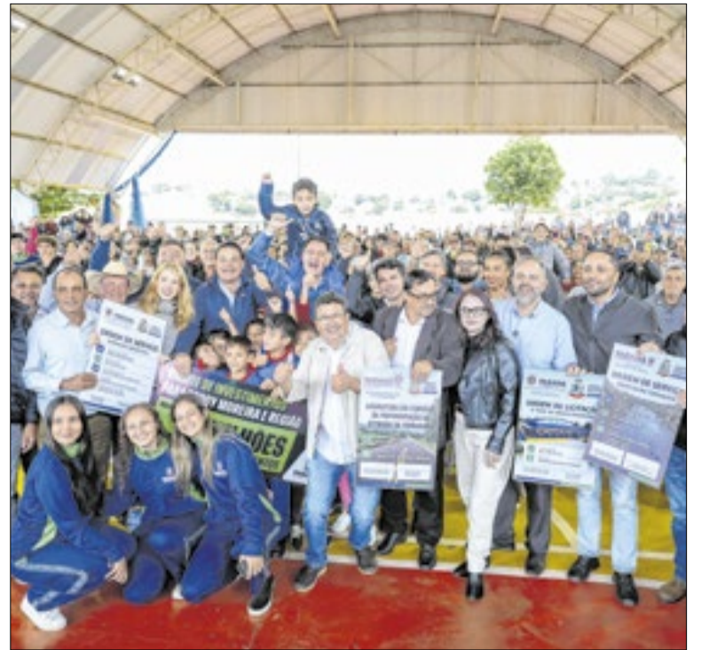
A licitação está em fase final para início da execução

A ministra das Mulheres, Márcia Lopes, participará de palestra amanhã (26) na Universidade Federal do Paraná (UFPR), em Matinhos (PR). As atividades ocorrerão na unidade Litoral, nos períodos da tarde e noite. O encontro discutirá políticas públicas, direitos e fortalecimento de organizações femininas.