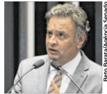
Aécio Neves (PSDB-MG)

Segundo Luciano Vieira, Aécio Neves mantém influência dentro da legenda e possui cre-