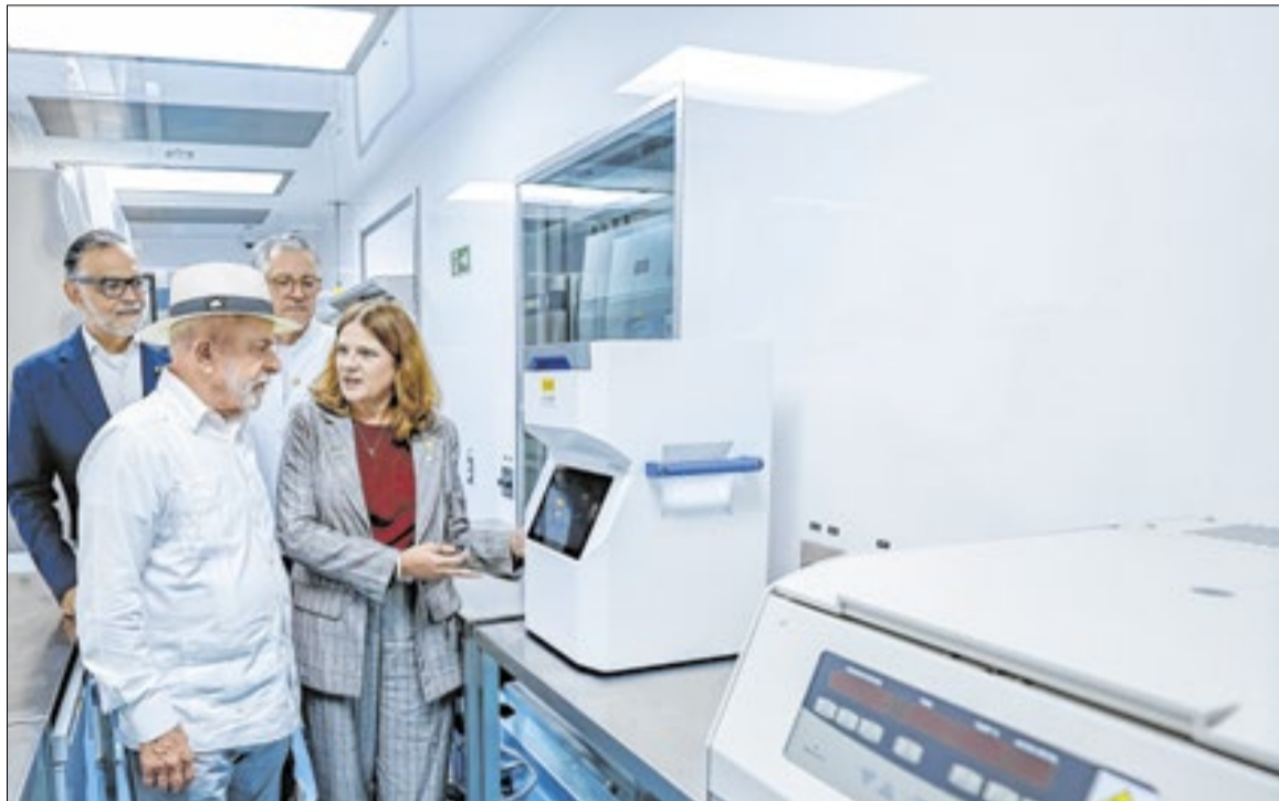
Lula e o ministro Alexandre Padilha em visita ao Centro

“O SUS, como o Mais Especialistas, está dando uma lição neste país. Melhorar a qualidade da saúde precisa de dinheiro. Se não tem dinheiro, a gente vai atrás. A gente vai arrumar e fazer com que o povo mais humilde desse país tenha direito ao mesmo tratamento que tem o gover-