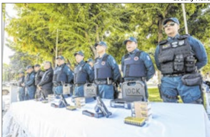
Dados são da Secretaria de Segurança Pública