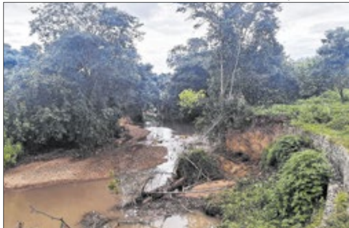
O rio Melchior recebe muitos efluentes e rejeitos urbanos