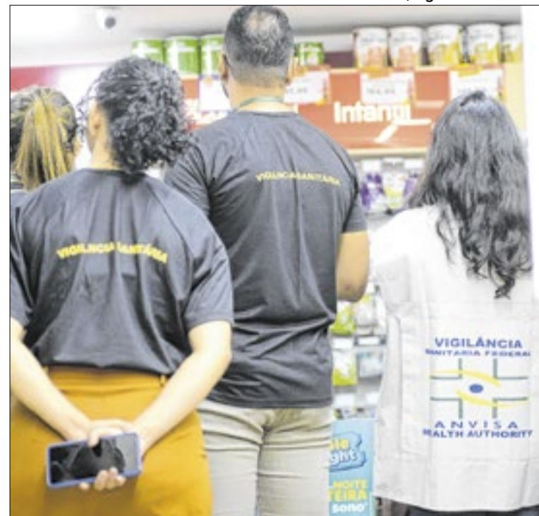
Operação contou com a participação de servidores da Anvisa

O programa trabalha com cerca de 30 espécies nativas e de interesse econômico, como braúna, aroeira, peroba, ipês e buriti, usadas na recomposição vegetal e na preservação da biodiversidade. Entre 2022 e 2025, foram produzidas mais de 184 mil mudas, destinadas a projetos de recuperação ambiental. Em 2025, o programa registrou 27.196 mudas, e em 2026 já soma 5.200 unidades. A iniciativa conta com projetos elaborados pela Emater-DF e apoio do Brasília Ambiental.