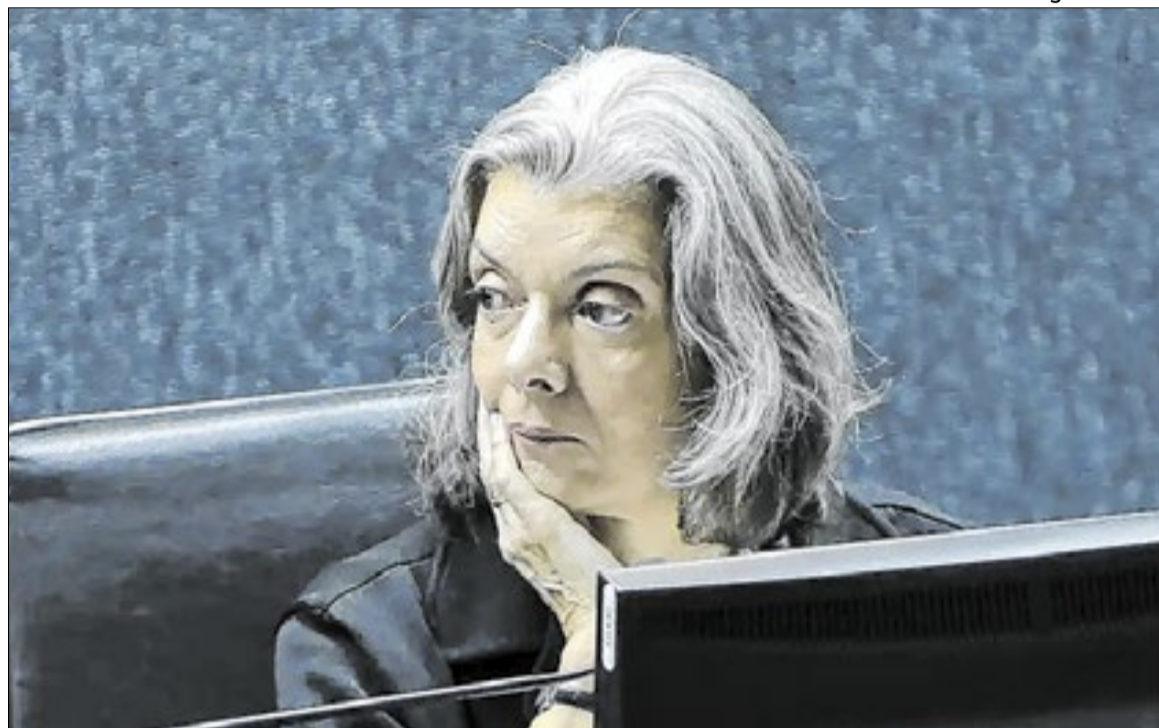
Ministra Cármen Lúcia é relatora da ADI e foi a primeira a se manifestar pela derrubada

Arruda conta com esse novo entendimento para poder concorrer às eleições deste ano. Ele foi condenado por improbidade