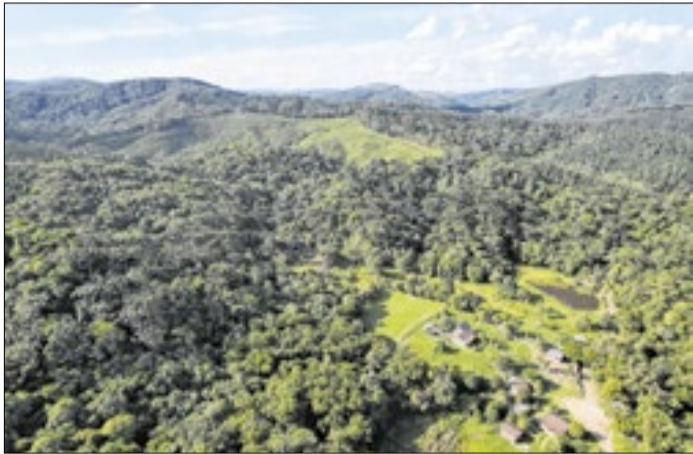
Estado planeja criar novas unidades de conservação