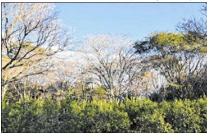
Machadinho receberá também o Fórum da Erva-Mate