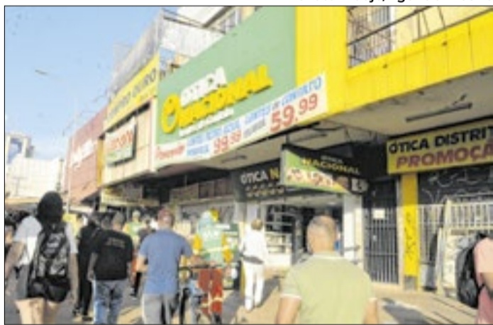
Descontos ao consumidor podem ultrapassar os 30%