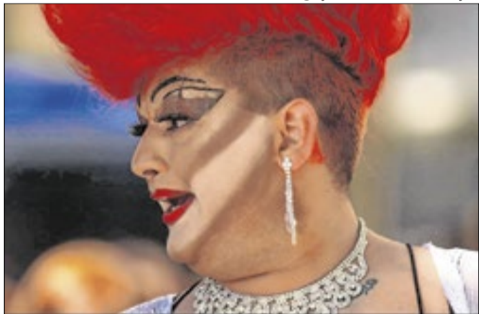
A seleção aceita diferentes linguagens e estéticas