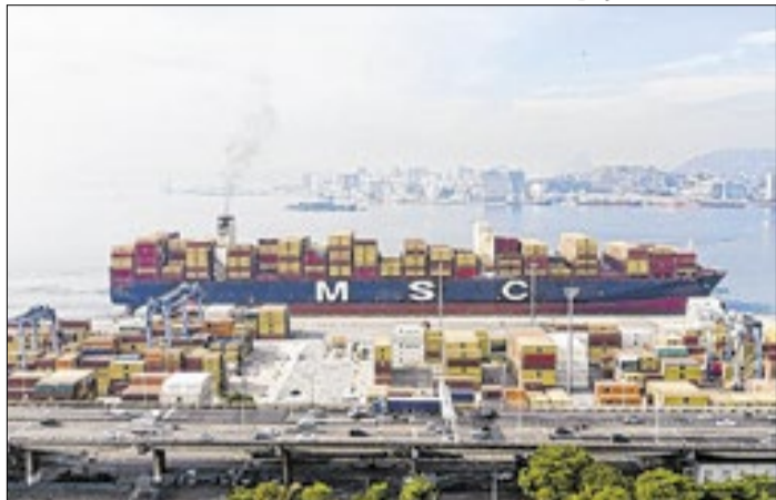
MSC Katrina atracou no Porto do Rio em 14/maio/2026