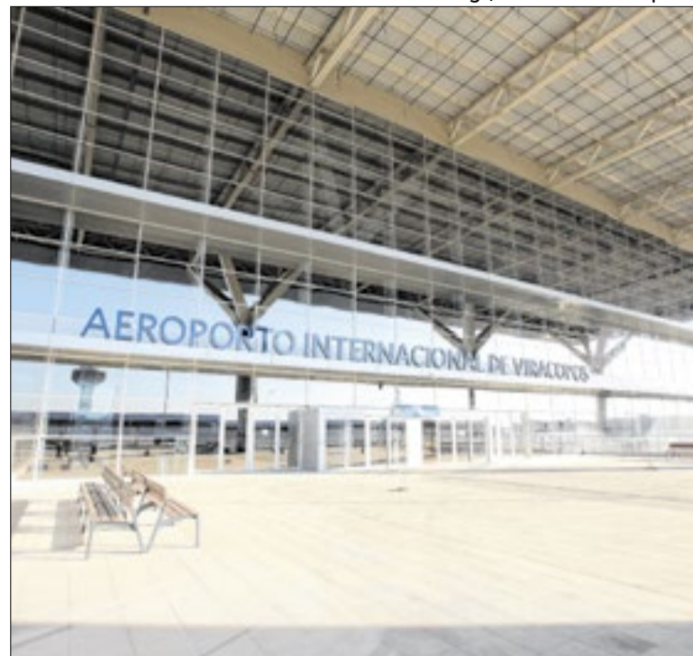
O governo federal quer aproveitar a renegociação da concessão

Ribeirão Preto abre hoje as inscrições para 342 vagas em 18 cursos gratuitos de capacitação profissional no Centro de Qualificação Social, na Av. Dom Pedro I, 45. As inscrições vão até sexta (29), pelo site ribeiraodigital.com.br. Entre as novidades, destaque para o curso inédito de bolos, salgadinhos e doces.