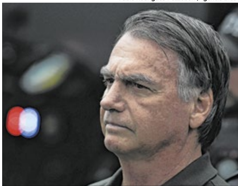
Documentos enviados ao STF detalham rotina de Bolsonaro