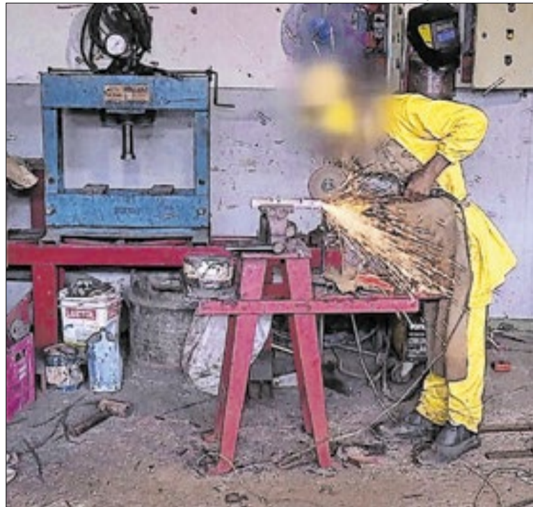
Apenados atuam em serviços dentro e fora de presídios

Mato Grosso do Sul alcançou a 7ª posição no Índice de Progresso Social 2026 (IPS Brasil), que avalia condições sociais e ambientais em 5.570 cidades. O estado registrou 64,14 pontos, acima da média nacional de 63,40. O ranking é liderado por Distrito Federal, São Paulo, Santa Catarina, Paraná, Minas Gerais e Goiás.