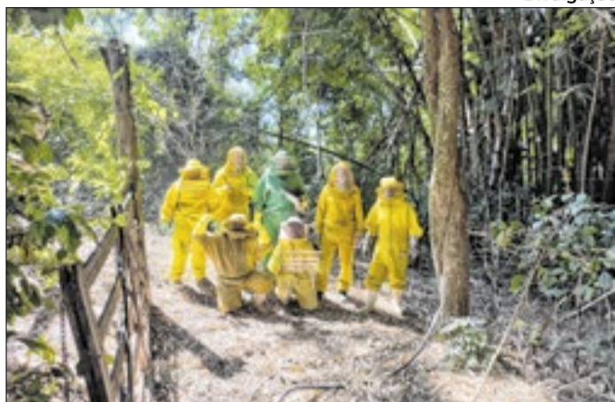
Produtores levam abelhas em diferentes fazendas