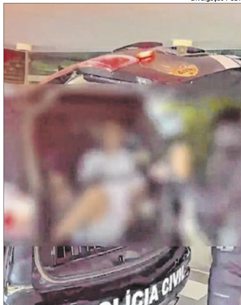
Enfermeiros são acusados de provocar a morte de pacientes

A instituição afirmou que encaminhou elementos da apuração às autoridades responsáveis e solicitou abertura de inquérito policial e adoção de medidas cautelares contra os envolvidos, que já haviam sido desligados do hospital antes do cumprimento das prisões em janeiro de 2026.