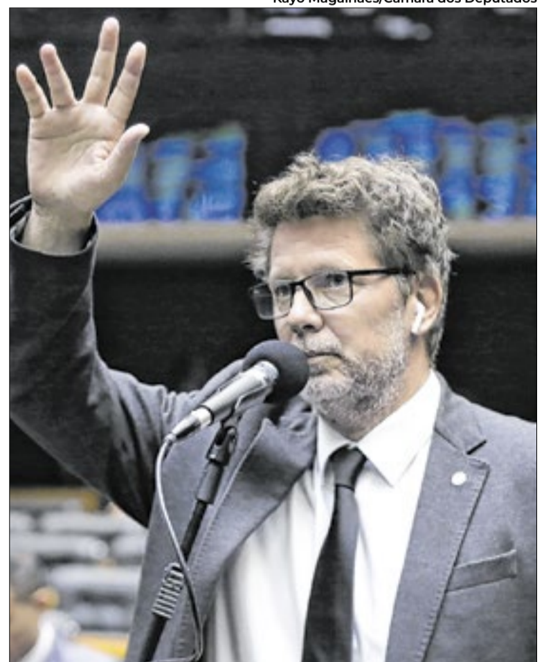
Flávio Dino procura explicações de Mário Frias

O Correio da Manhã procurou Mario Frias, a assessoria do deputado e a ex-funcionária citada na reportagem, mas não obteve retorno até a publicação desta matéria.