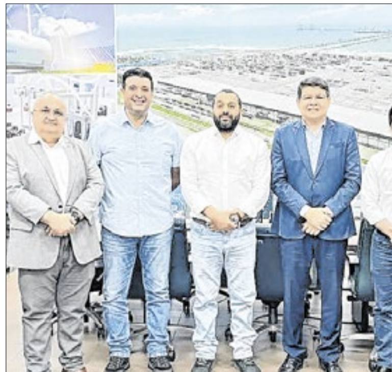
SDE articula parceria com multinacional

O Centro Especializado em Reabilitação da Universidade Estadual de Ciências da Saúde de Alagoas concluiu, na última semana, a primeira turma do curso de orientação e mobilidade. A capacitação integra a transição do CER III para CER IV, com atendimento a pessoas com deficiência visual.