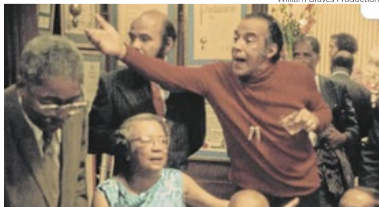
William Graves Productions