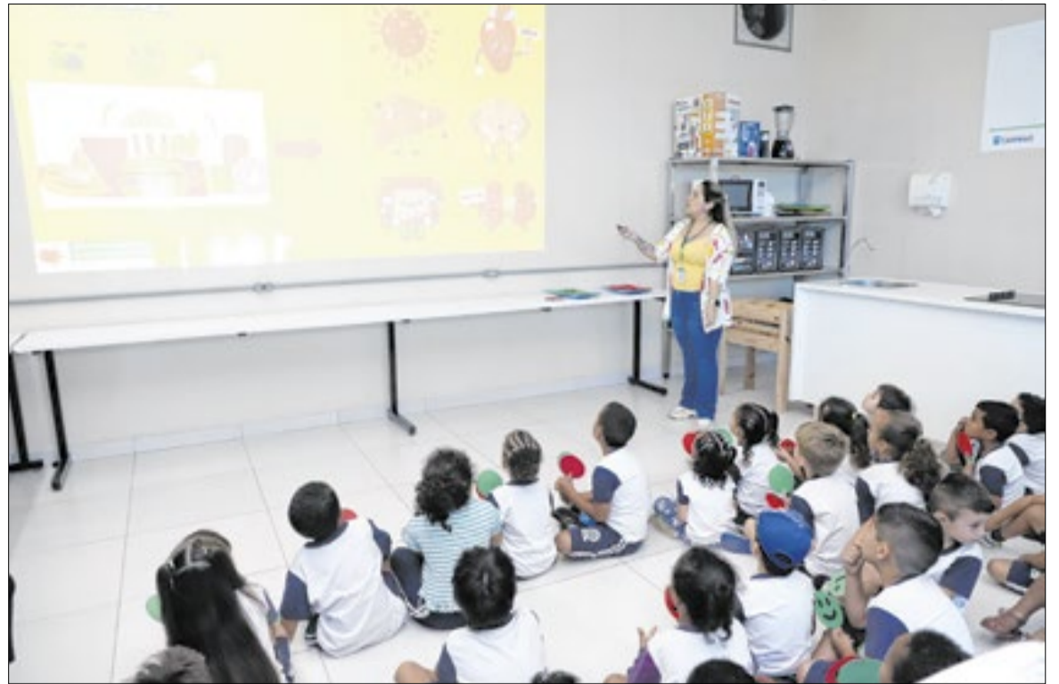
MP instaurou um procedimento para fiscalizar de educação digital nas escolas públicas

O órgão também quer saber como Estado e município vêm incorporando as diretrizes da Política Nacional de Educação Digital aos projetos pedagógicos e currículos escolares. A legislação federal prevê a implementação gradual do ensino crítico das mídias digitais nas escolas, com foco em inclusão, acessibi-