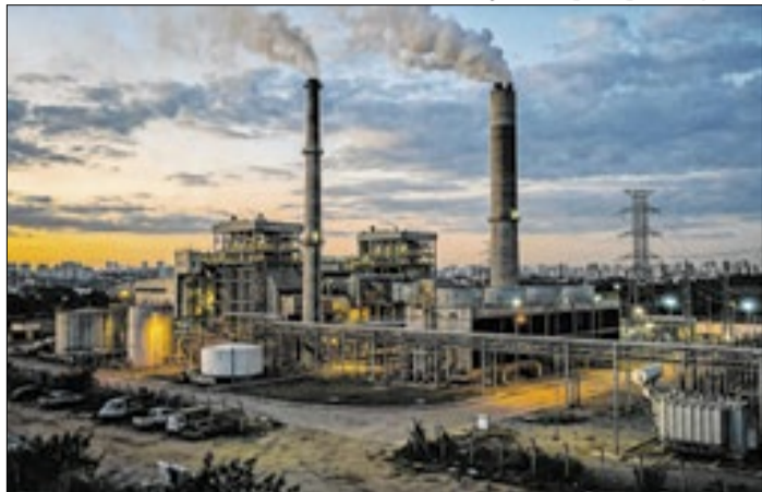
MPF: Leilão favoreceu usinas térmicas caras e poluentes