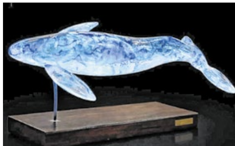
A arte vidreira aterrissa em Gramado