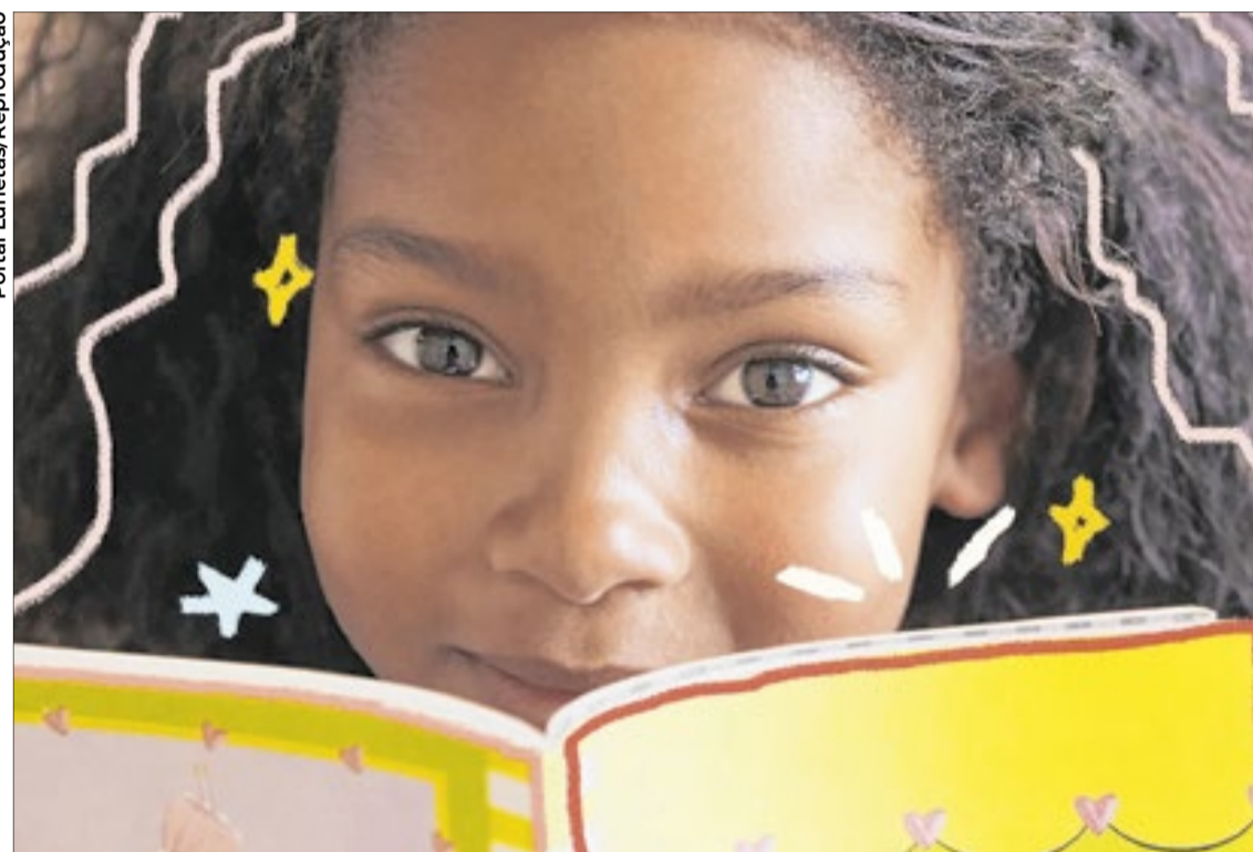
Contação de histórias é uma ferramenta mágica