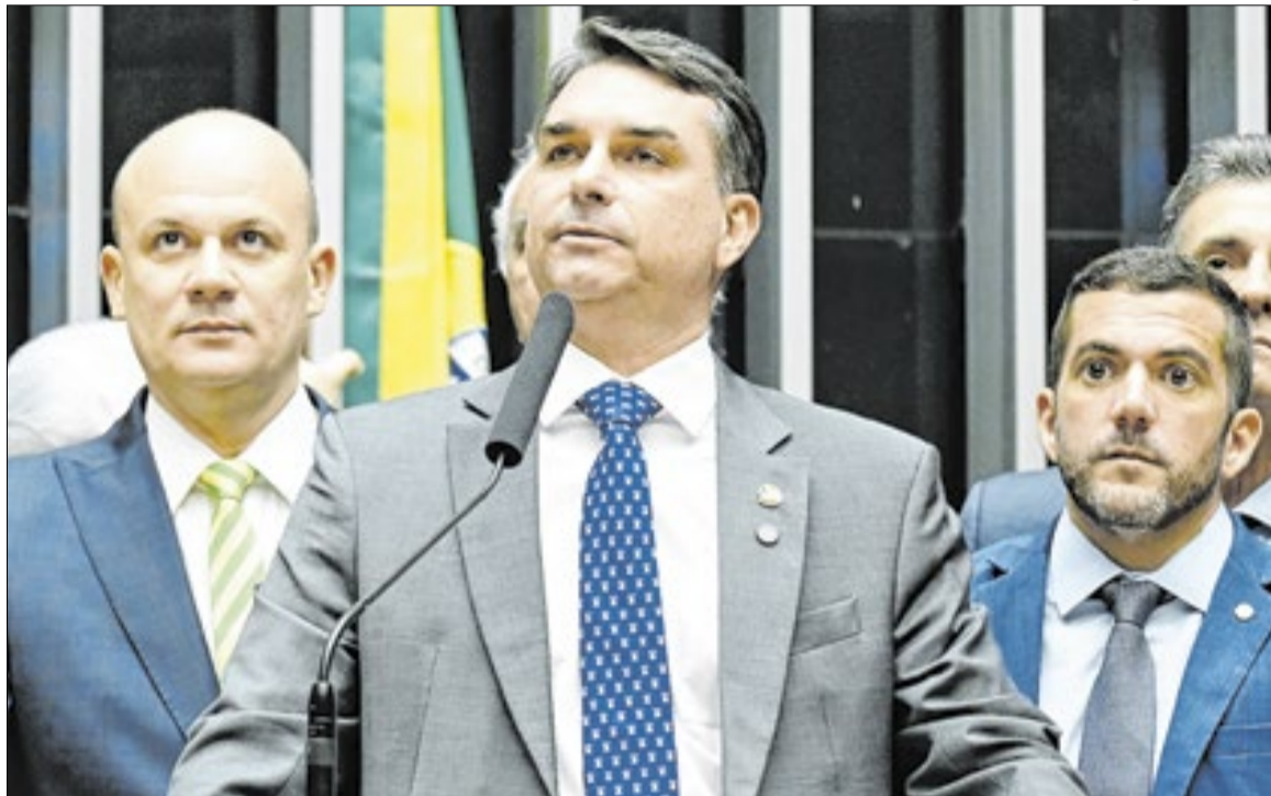
Cercado por aliados, Flávio cobra CPMI: “Não tenho nada a temer”

Cercado por parlamentares aliados, o senador afirmou que não tem “nada a esconder” e desafiou a esquerda a apoiar a criação da CPMI.