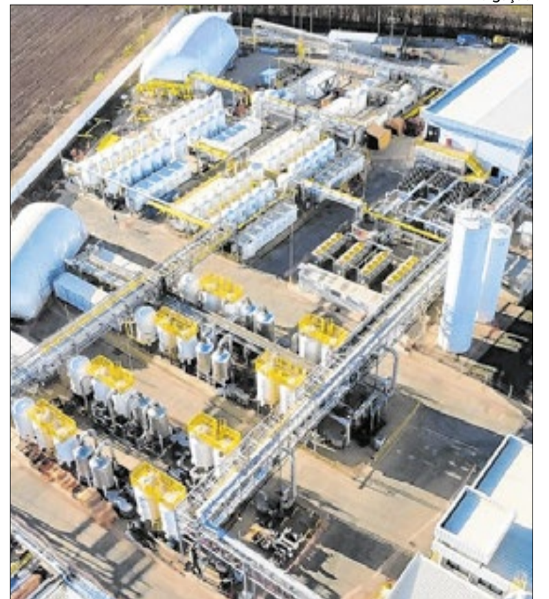
Usina de biometano na cidade de Paulínia

Durante o encontro, empresas e instituições apresentaram experiências de utilização do combustível renovável. A Natura informou que utiliza biometano em parte dos processos industriais e em toda a frota logística entre Cajamar e a Grande São Paulo. Já a Geo Bio Gas e Carbon destacou estudos para produção de combustível sustentável de aviação a partir de resíduos do setor sucroenergético.