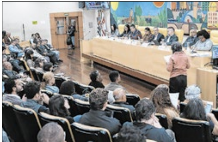
Prestação de contas atende à Lei de Responsabilidade