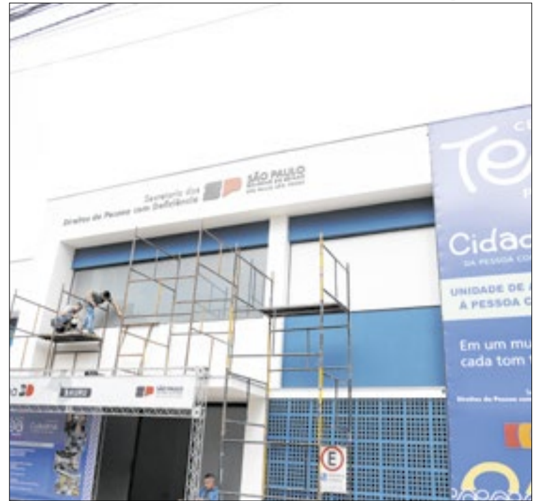
Espaço contou com investimento de R$ 12 milhões

A Embraer abriu 200 vagas de estágio para universitários em Sorocaba e outras cidades do país. As inscrições seguem até 5 de junho pelo site da empresa. Há oportunidades nas áreas administrativa, engenharia, operações e tecnologia. O programa começa em setembro de 2026 e oferece bolsa, benefícios e chance de efetivação.