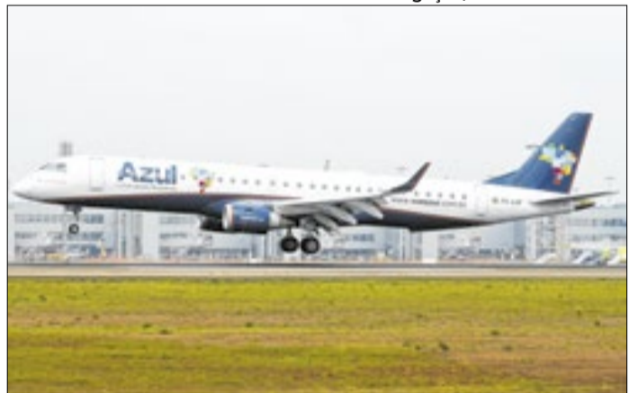
Medida visa reduzir impactos da alta do querosene