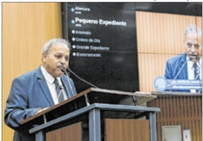
Moção solicita também reunião entre os envolvidos