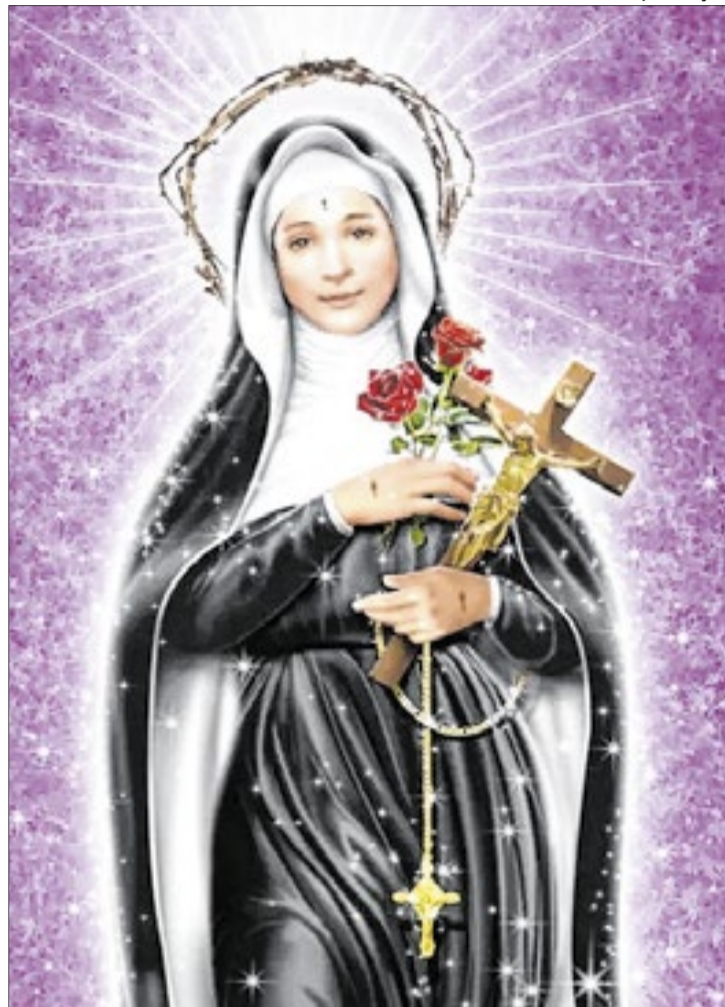
A novena preparatória também integra a programação e antecede a grande celebração