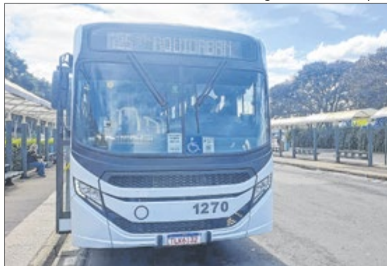
Administração encaminhou documentação ao TCE-SP

Caso a Comissão reconsidere a decisão, será publicado novo resultado da fase de habilitação. Mantida a decisão, os recursos serão encaminhados ao secretário municipal de Transportes, que terá prazo de até 10 dias úteis para decidir sobre o acolhimento ou rejeição dos recursos apresentados. Os prazos seguem o disposto no artigo 165 da Lei Federal nº