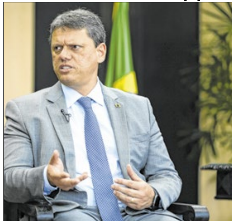
Governador sustenta que segurança pública é prioridade

A atuação da Academia denota a densidade educacional da cidade cuja história se mantém viva quando suas principais referências acadêmicas e artísticas são devidamente valorizadas - atualmente em meio a superficialidades de todas as montas.