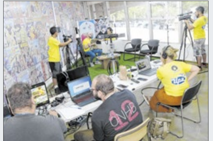
Equipe da TV Unicamp durante transmissão ao vivo