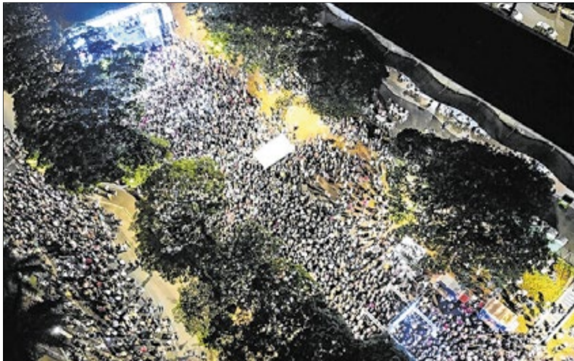
Tráfego de veículos na Avenida Brasil terá bloqueio no período das 16 às 23 horas

A segunda edição do festival gospel Celebra Americana começa hoje trazendo atrações musicais, opções gastronômicas, feira de artesanato e espaço infantil. O evento está programado para ocorrer de sexta-feira (22), das 18h às 22h, a sábado (23), das 15h às 22h. O local escolhido para as atividades é o Centro de Cultura e Lazer (CCL) do município de Americana.