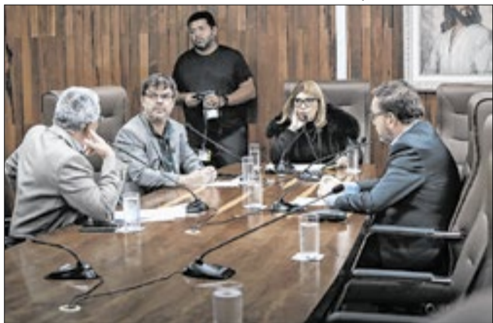
Reunião desta semana incluiu 12 projetos na pauta