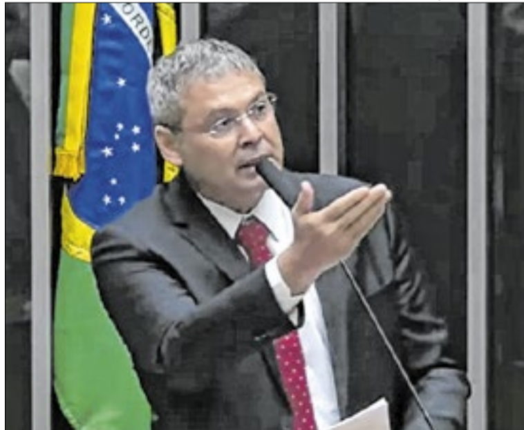
Lindbergh rebateu Flávio: “Explique os R$ 61 milhões”

legenda, cresceu entre integrantes do partido o temor de que novos fatos envolvendo Flávio Bolsonaro possam surgir nos próximos meses.