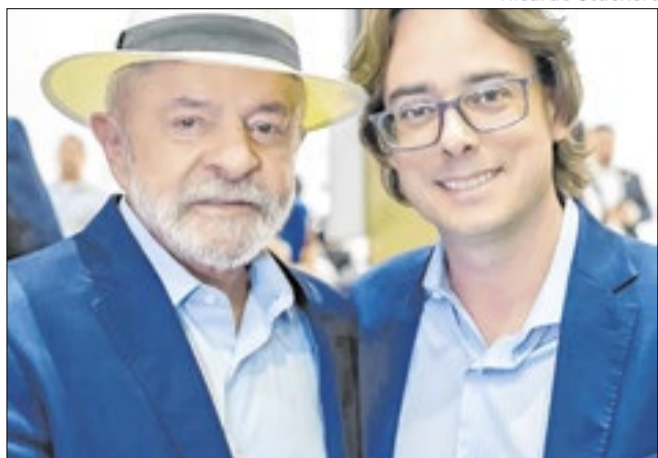
Lula e Tourinho em vista do presidente a Campinas