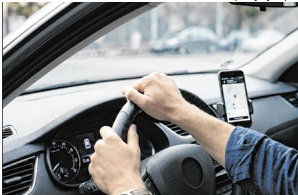
Linha de crédito é voltada a motoristas de aplicativos, taxistas e cooperativas de táxi.

podará financiar seguros vinculados à operação, como seguro do bem e seguro prestamista, desde que contratados em conjunto com o automóvel. A resolução também autoriza a inclusão de itens de segurança voltados para mulheres motoristas de transporte de passageiros, com limite de até 10% do valor total financiado. O texto não detalha quais equipamentos poderão ser incluídos, mas a previsão foi incorporada à regulamentação como parte das medidas de segurança para profissionais mulheres.