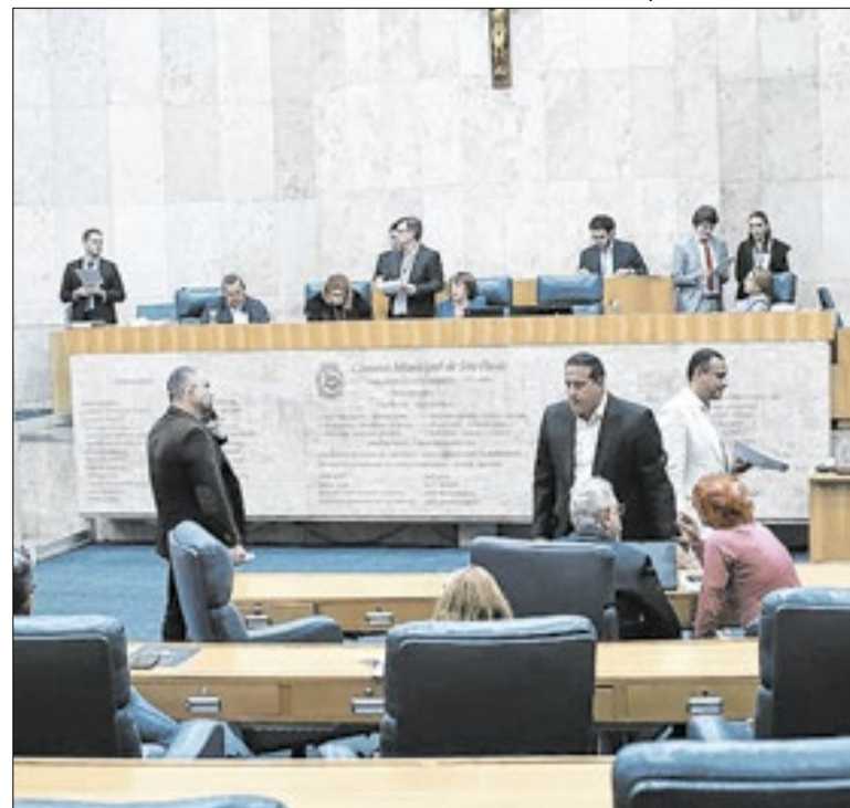
Projeto precisa passar por segunda votação na Câmara

A Virada Cultural terá uma Central de Reciclagem instalada no Largo Paissandu, na região central da capital paulista. A iniciativa irá reforçar a coleta seletiva e a destinação correta de resíduos gerados durante o evento, que será realizado neste fim de semana, além de promover geração de renda e inclusão.