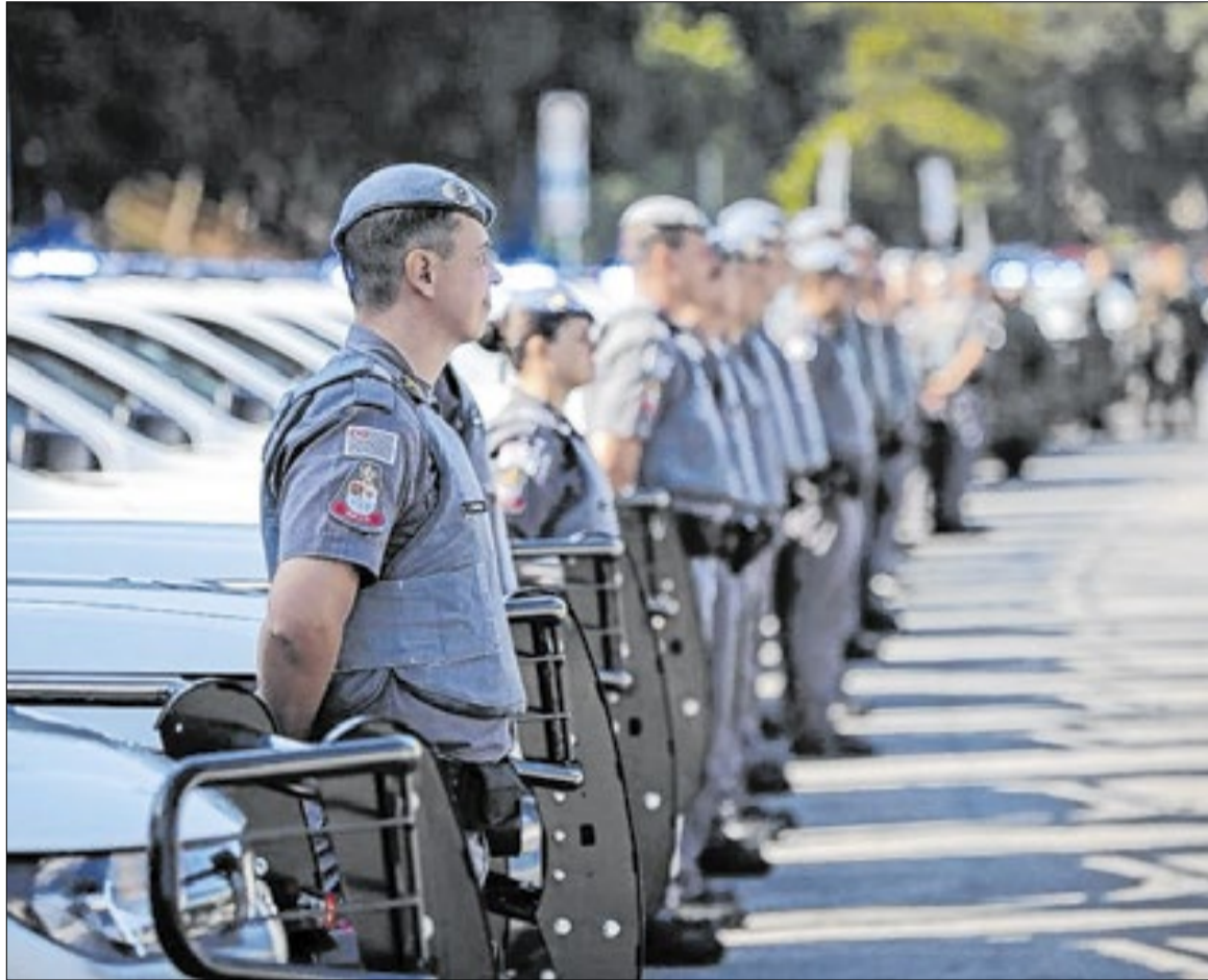
Efetivo ficará distribuído em áreas de maior circulação de público, acessos aos palcos e corredores

O esquema operacional também envolverá equipes dos batalhões territoriais subordinados ao Comando de Policiamento da Capital, além do apoio do Comando de Policiamento de Choque, Comando de Trânsito, Corpo de Bombeiros, Comando de Aviação da Polícia Militar e do Centro de Operações da Polícia Militar (Copom). A atuação da Polícia Militar será concentrada nos arredores dos palcos e locais de apresentação, com patrulhamento a pé e motorizado. A estratégia prevê ainda o uso de câmeras fixas e móveis, drones operados pelos comandos regionais e torres de observação instaladas em pontos considerados