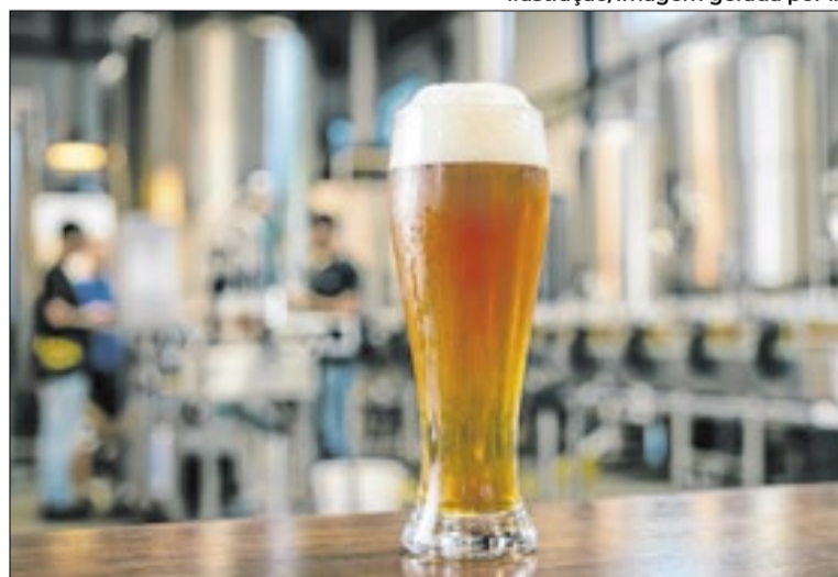
Cervejas brasileiras chegaram a 77 países em 2025

Segundo o levantamento, o setor cervejeiro responde por mais de 2% do Produto Interno Bruto (PIB) nacional e gera