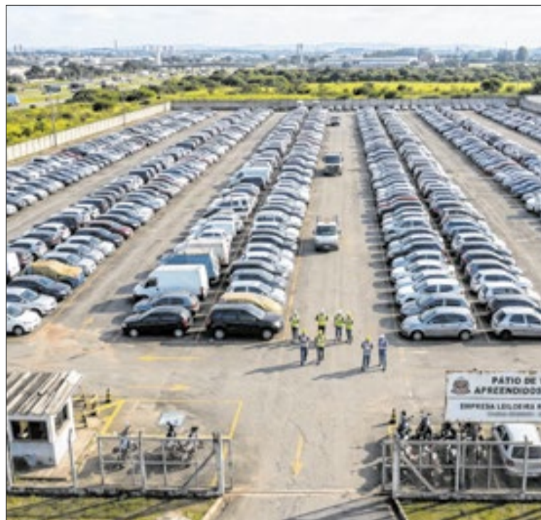
Veículos são leiloados sem garantia de funcionamento

O ministro da Fazenda, Dario Durigan, informou que o Desenrola Famílias já renegociou R$ 10 bilhões em dívidas e ultrapassou a marca de 1 milhão de CPFs atendidos, em poucos dias de operação. Segundo ele, o programa avança com forte adesão dos bancos e das famílias, ampliando o acesso à renegociação com descontos.