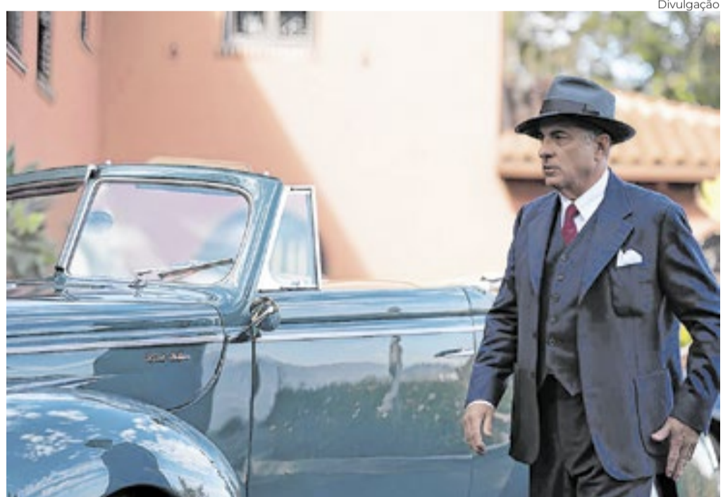
Andy Garcia atua em 'Diamond', longa que também dirige

"Eu pegava ônibus em Miami e cruzava aquela cidade, logo que saí de Cuba para os EUA, em busca de um cinema na Lincoln Road, onde se via um programa duplo por sessão. Às vezes, com um ingresso, ri via dois 007s de uma vez. O noir me chegou ali. 'Casablanca' veio ali. Esses filmes estão em mim", disse Garcia ao Correio da Manhã.