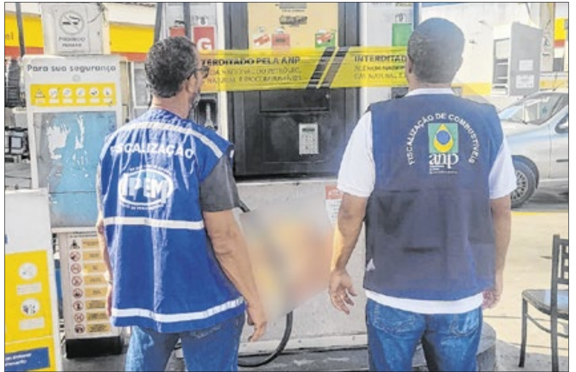
Fiscais da ANP interditaram postos e apreenderam combustíveis e botijões de GLP em 17 estados.

fração e sete autos de interdição. As ações resultaram ainda na apreensão de 8.503 litros de combustíveis e 20 botijões de GLP em estabelecimentos que operavam sem autorização. No Rio de Janeiro, a fiscalização alcançou 24 postos nas cidades do Rio, Duque de Caxias, Nilópolis, Maricá, São João de Meriti e Nova Iguaçu. Parte das ações teve foco em possíveis práticas abusivas de preços. A operação resultou em cinco autos de infração, três interdições, coleta de 23 amostras e apreensão de 14.360 litros de combustíveis. Minas Gerais teve fiscalização em 19 postos, 16 revendas de GLP, duas distribuidoras e uma refinaria em Itaúna, Uberaba, Matozinhos e São João del Rei. O resultado incluiu nove autos de infração, coleta de amostras e apreensão de 190 botijões de GLP. No Espírito Santo, fiscais estiveram em 12 postos de combustíveis em Vitória, Vila Velha, Serra, Cariacica, Piúma e Itapemirim. Foram coletadas 12 amostras e registrados cinco autos