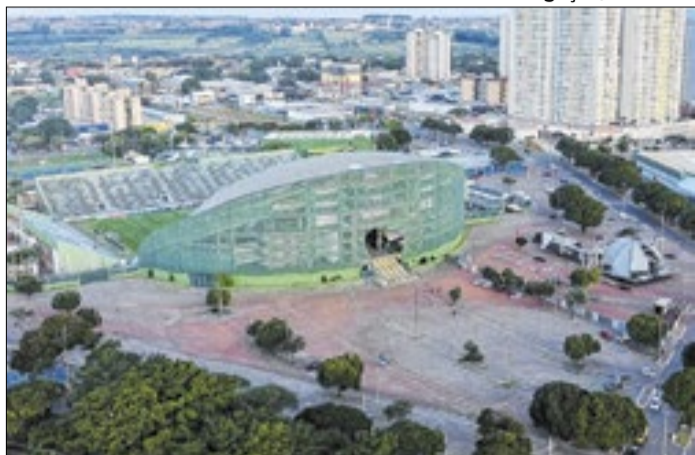
ExpoCamp aborda negócios e economia criativa