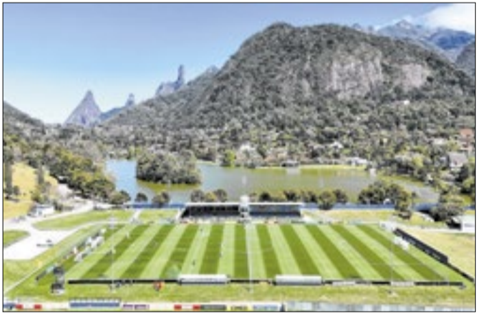
Granja Comary recebe Seleção Brasileira a partir do dia 27