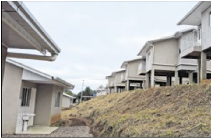
Em ação urgente, realocação aconteceu antes do El Niño