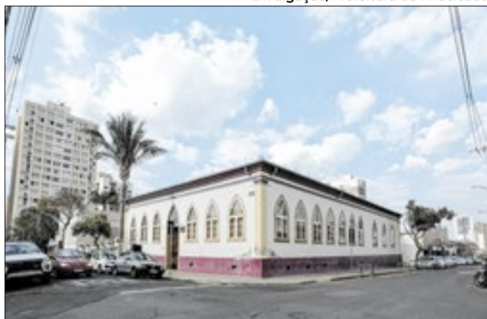
Acervo reúne peças da trajetória política do Brasil