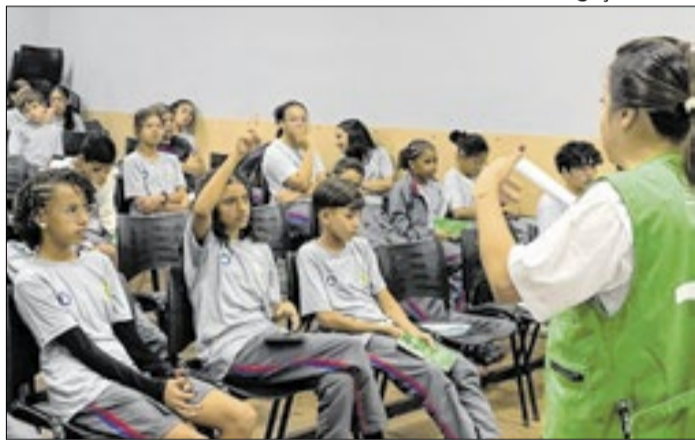
Ação chega ao Centro de Ensino Especial 01 de Samambaia