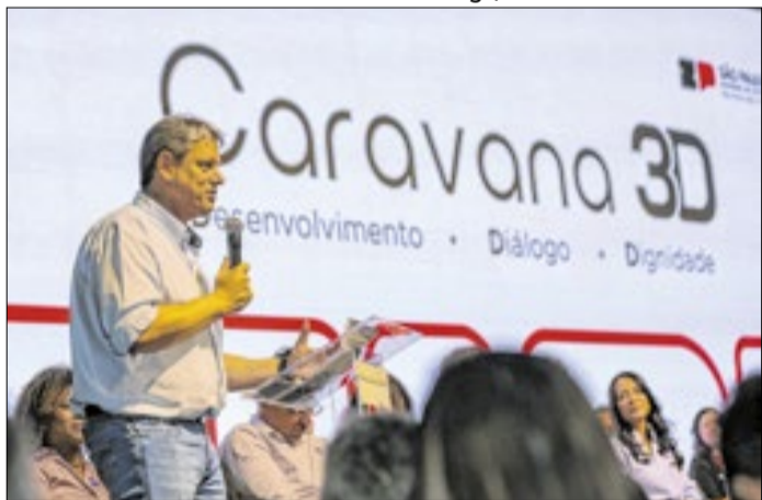
Governador inaugura obras e serviços na região de Bauru

Marcelo S. Camargo/Governo do Estado de SP