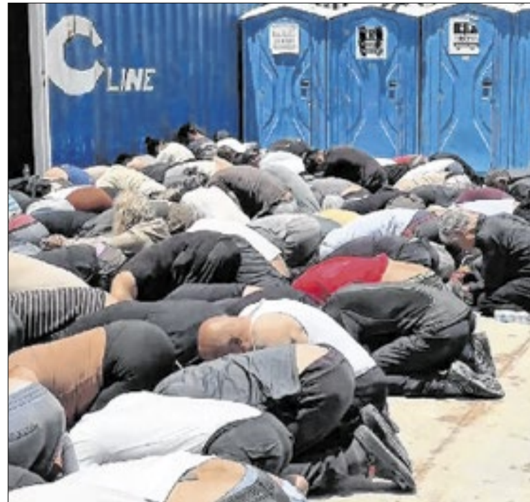
Itamar Ben-Gvir divulgou vídeo de manifestantes amarrados

Também na quarta, o secretário de Estado dos EUA, Marco Rubio, ofereceu à população de Cuba um “novo caminho” em um pronunciamento em espanhol. Filho de cubanos, ele prometeu US$ 100 milhões (cerca de R$ 503 milhões) em alimentos e medicamentos e defendeu uma nova relação entre os países.