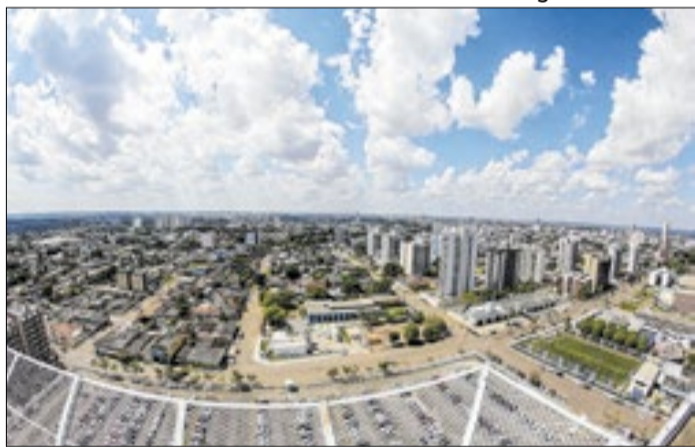
Crescimento reflete o fortalecimento da economia local