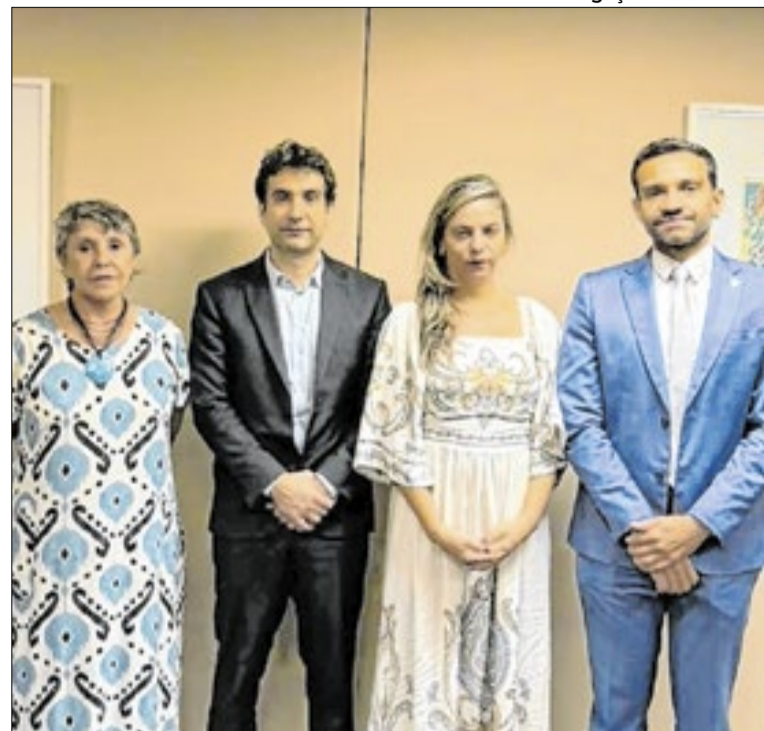
Reunião aconteceu nesta quarta-feira (20)

A troca da logomarca do governo (Ipê roxo em vez do Ipê amarelo), a revisão do programa Vai de Graça e o tom das campanhas institucionais reforçaram a percepção de que Celina buscava imprimir identidade própria à administração. No campo jurídico, a governadora enfrenta o avanço da Operação Drácon, na qual responde por improbidade administrativa e pode ter direitos políticos afetados em caso de condenação. Esse conjunto de fatores formou o pano de fundo que antecedeu a declaração pública de afastamento.