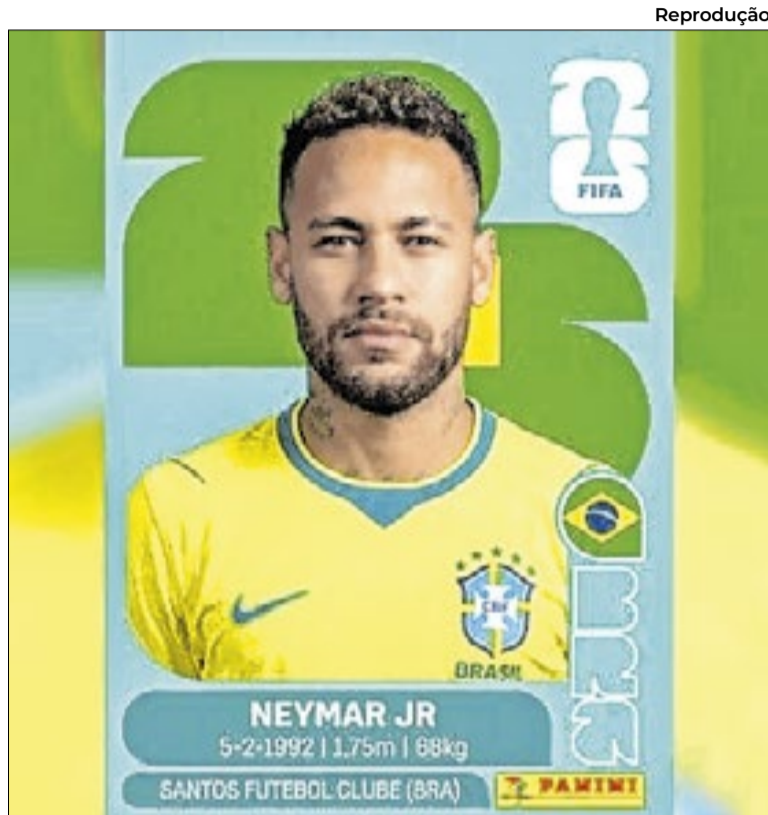
Panini comentou sobre a possibilidade de lançar um pacote de atualização para a Copa do Mundo