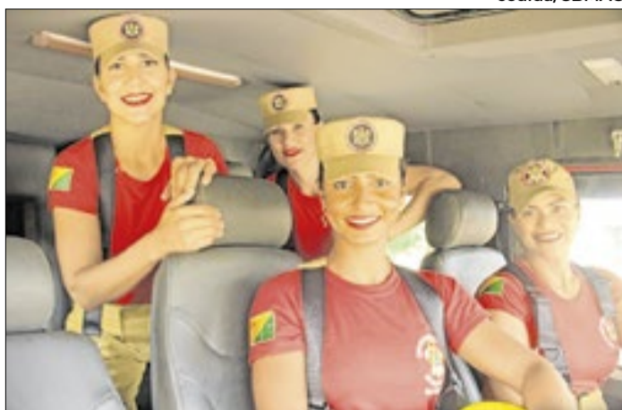
Cabos de Cruzeiro do Sul integram o 4º Bepcif