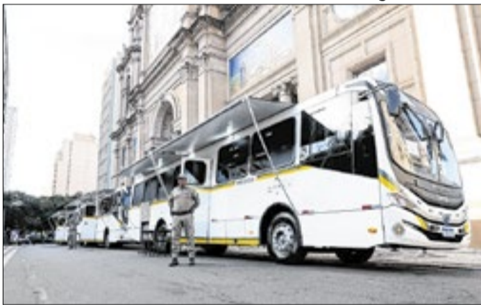
Motorhomes de apoio também foram entregues