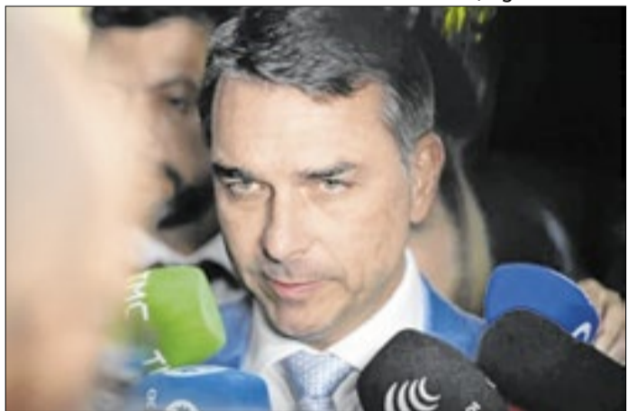
Flávio: aliados temem queda acentuada