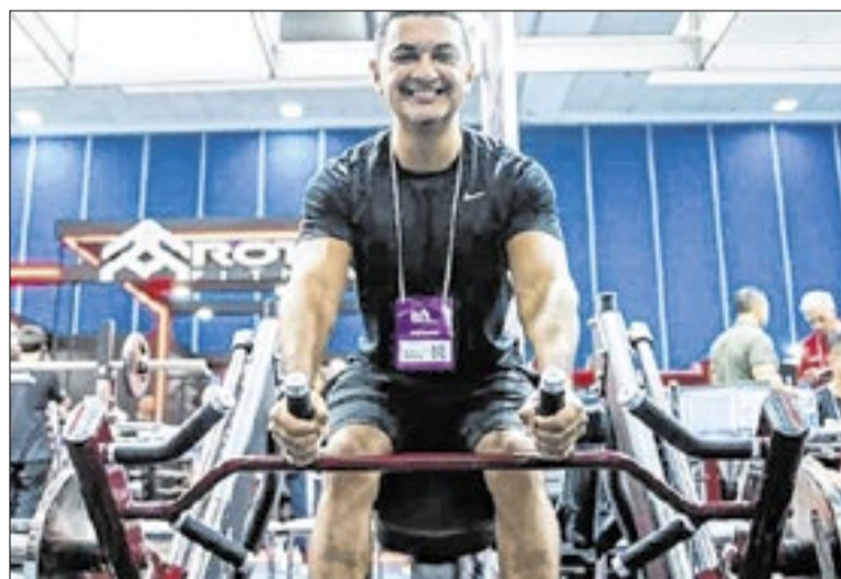
RJ alcançou 6 mil academias em 2025, crescimento de 11%

A expectativa da organização da Rio Sport Show é receber mais de cinco mil proprietários de academias durante os três dias de programação. O público-alvo inclui ainda