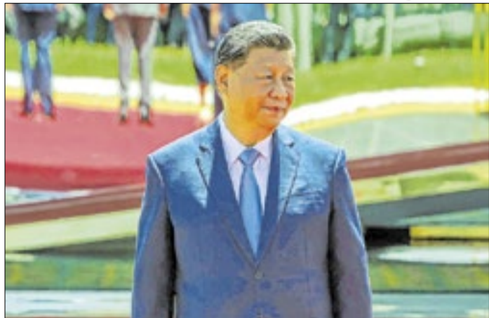
Xi Jinping, líder chinês, teve reunião com Vladimir Putin