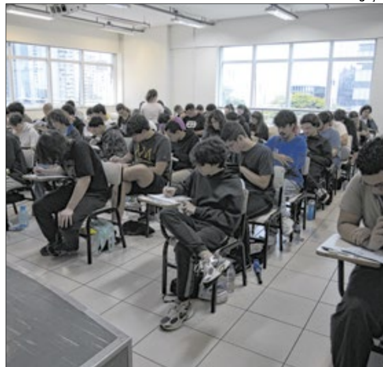
Provas da primeira fase serão aplicadas em 24 de maio

As investigações apontaram que o parlamentar exigia a devolução de parte dos salários de assessores como condição para mantê-los nos cargos, prática conhecida como rachadinha. Depoimentos de ex-servidores e movimentações bancárias embasaram o processo. A defesa negou irregularidades.