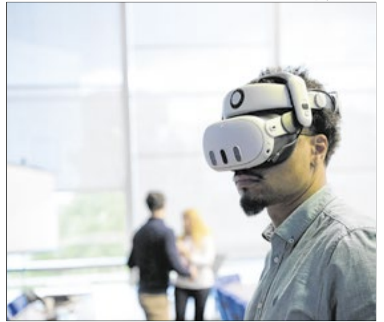
Iniciativa usa a tecnologia para preservar saberes indígenas

Para a FAPDF, a proposta se diferencia por tratar a tecnologia não como substituta da tradição, mas como ferramenta de registro.