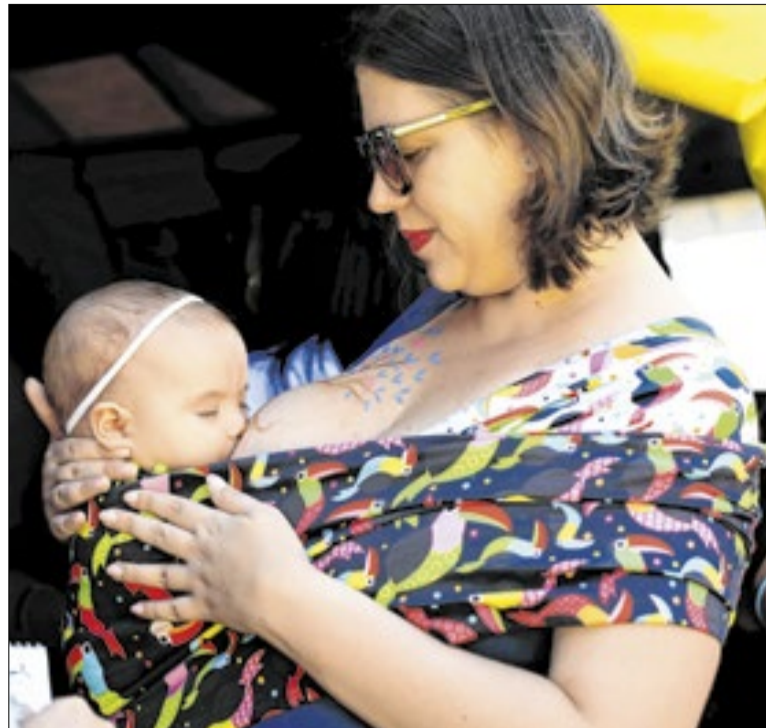
Adesão ao aleitamento no DF supera a média nacional

O Procon de Três Lagoas (MS) alertou sobre golpes utilizando sites falsos que simulam órgãos oficiais para oferecer renegociação de dívidas. Os criminosos pedem pagamentos via PIX e dados pessoais. O órgão informou que o Novo Desenrola Brasil não cobra taxas e orienta a evitar cobranças antecipadas.