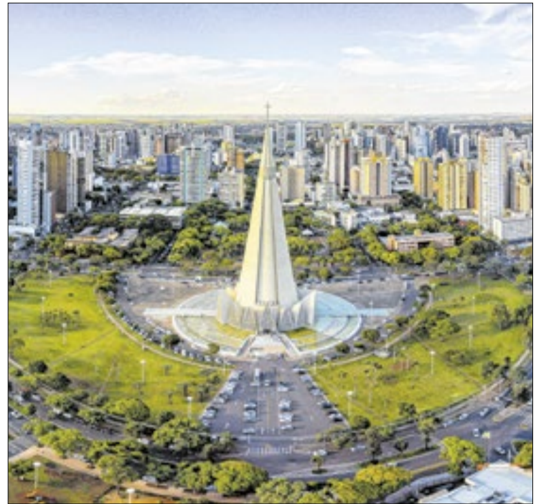
Curitiba é a capital com melhor qualidade de vida do país

O Fala Curitiba 2026, projeto que coleta demandas cidadãs, inicia na próxima segunda-feira (25) a fase presencial de priorização das propostas da consulta pública da prefeitura, com reuniões até 10 de junho nas regionais. As sugestões passam por análise para definir as ações que seguirão para votação final.