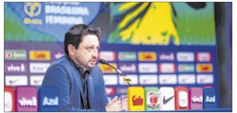
Seleção Feminina vai enfrentar os Estados Unidos

O público poderá conferir ainda uma exposição de camisas da seleção brasileira, reunindo modelos icônicos que atravessaram gerações e permanecem na memória do torcedor. A programação também inclui a presença de nomes importantes do futebol carioca, aproximando o público de ídolos.