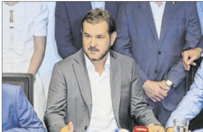
Presidente do União alertou deputados