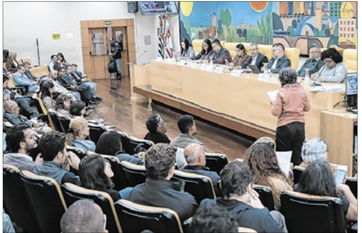
A matéria abordada prevê uma receita de R$ 138,6 bilhões para o ano que vem.

Também entrou em pauta a regionalização dos gastos, modelo que busca identificar quan-