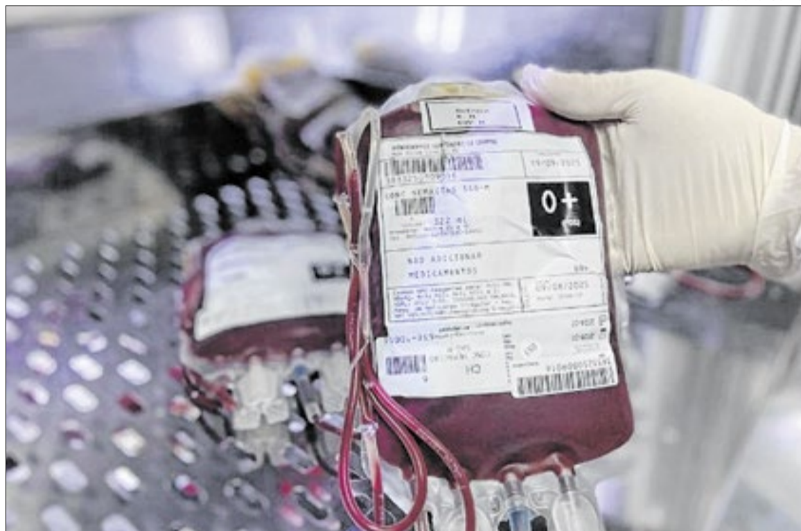
Doar sangue não requer muitos cuidados especiais e ajuda a salvar vidas