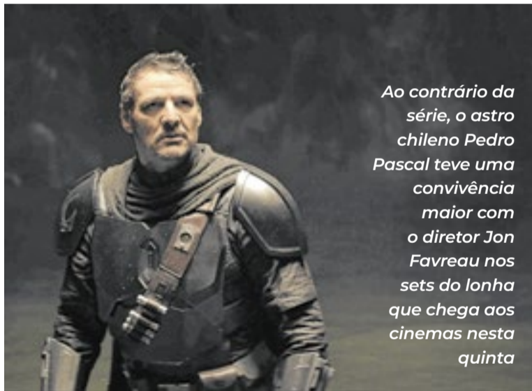
Ao contrário da série, o astro chileno Pedro Pascal teve uma convivência maior com o diretor Jon Favreau nos sets do longa que chega aos cinemas nesta quinta

Martin Scorsese, o mítico diretor, está no longa 'Mandaloriano e Grogu' emprestando sua voz ao macaco Hugo Durant