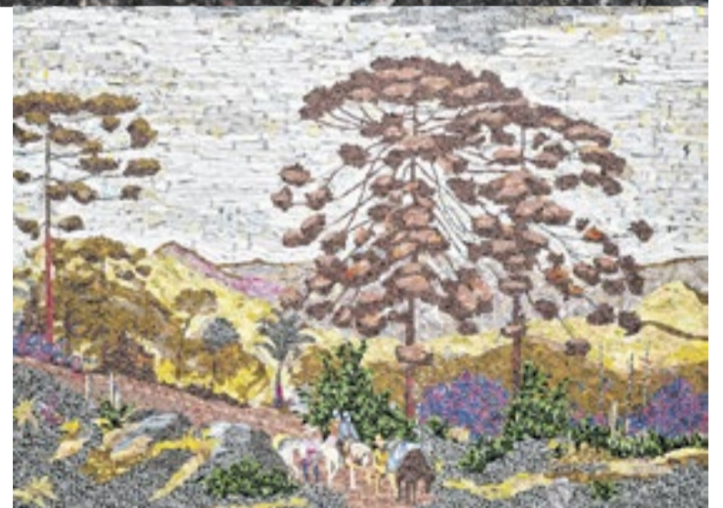
Serra Ouro Branco, a partir de Johann Moritz Rugendas

A versão carioca traz aproximadamente 20 trabalhos novos em relação às etapas anteriores, dos quais cinco foram criados pelo artista