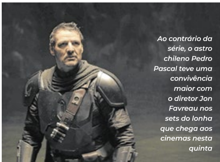
Ao contrário da série, o astro chileno Pedro Pascal teve uma convivência maior com o diretor Jon Favreau nos sets do longa que chega aos cinemas nesta quinta

Martin Scorsese, o mítico diretor, está no longa 'Mandaloriano e Grogu' emprestando sua voz ao macaco Hugo Durant