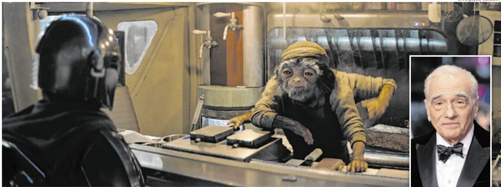
Scorsese (detalhe) entra para o universo 'Star Wars' como um macaco cozinheiro desconfiado