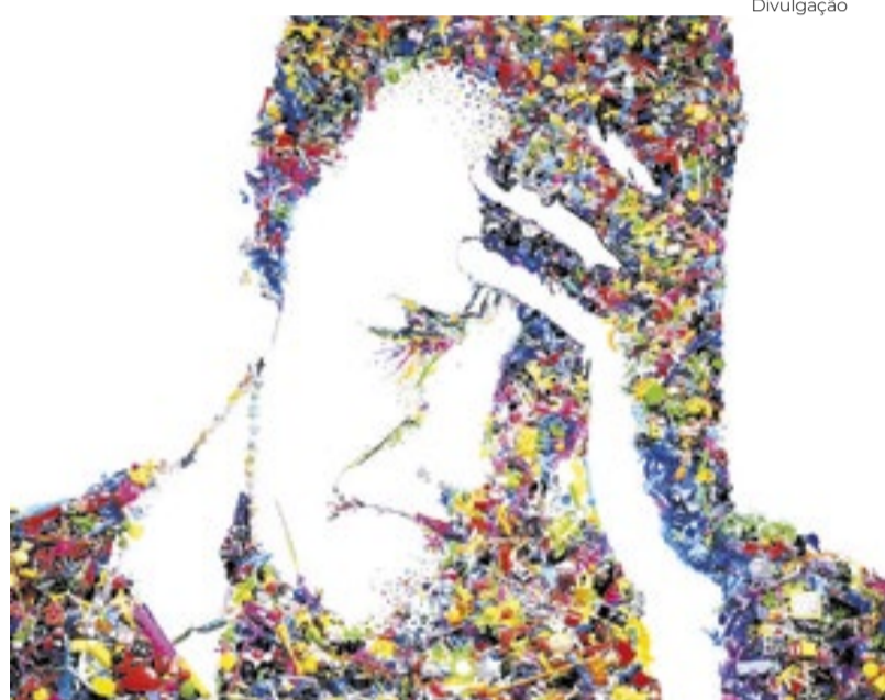
Self-Portrait (I am too sad to tell you), after Bas Jan Ader

Além da ampla retrospectiva de sua obra, Vik Muniz criou 20 novos trabalhos especialmente para esta exposição no CCBB RJ