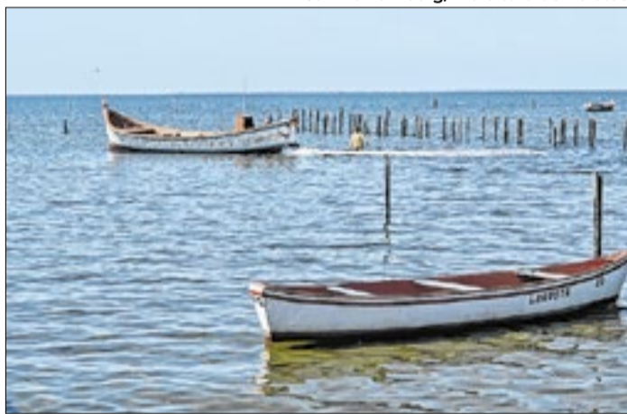
Colônia em Pelotas integra programa de reforma agrária