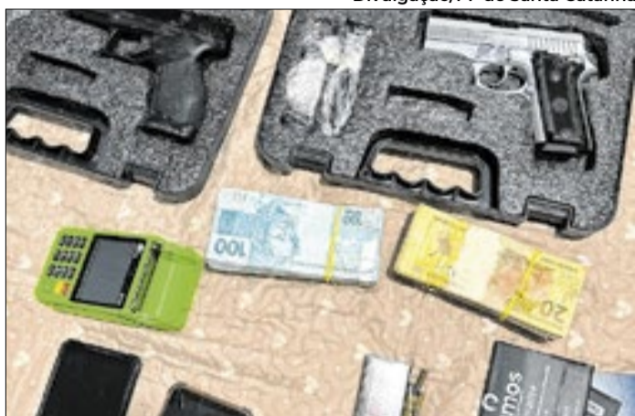
Apreendidas altas quantias em dinheiro, armas e munição