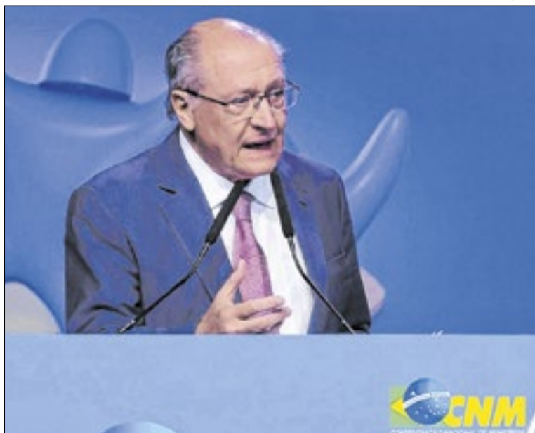
Alckmin também enfrentou aplausos e vaias

sonarista porque Flávio inicialmente negou qualquer pedido de dinheiro ao banqueiro. Depois, mudou a versão e passou a admitir a existência de um contrato de confidencialidade envolvendo o investimento.