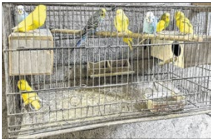
Ocorrências foram registradas em várias cidades