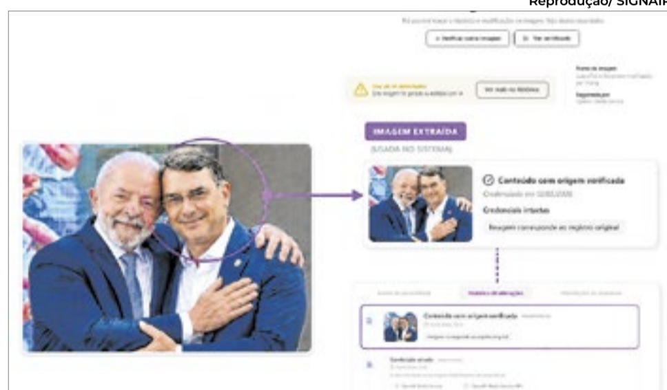
Ilustração criada por IA mostra Lula e Flávio abraçados. Tecnologia registra autoria, horário de criação, integridade e histórico de alterações de uma imagem.