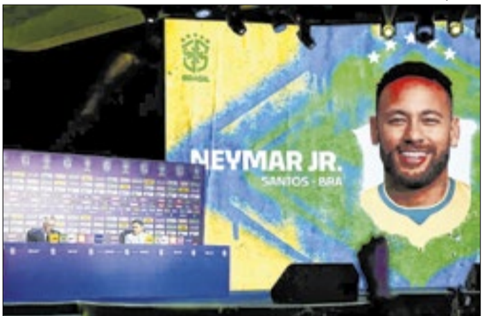
Neymar terá um papel de liderança para a molecada