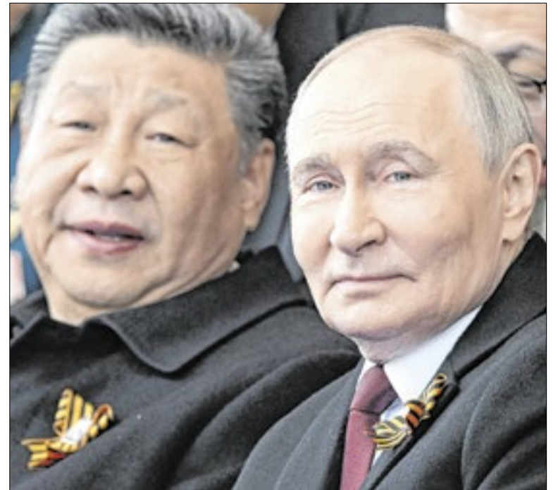
Pequim quer se posicionar como ator diplomático relevante

Pessoas próximas dizem que o documento deverá condenar o uso da IA em guerras e discutir como a tecnologia desafia direitos trabalhistas e transforma as relações de trabalho. Em comunicado divulgado na segunda (18), o Vaticano afirmou que a encíclica tratará da “proteção da pessoa humana na era da inteligência artificial”.