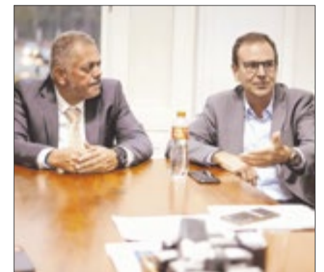
Agenda em Petrópolis contou também com reunião para propostas voltadas à Região Serrana do Rio