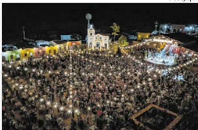
O Derradeiro contou com mais de 20 atrações