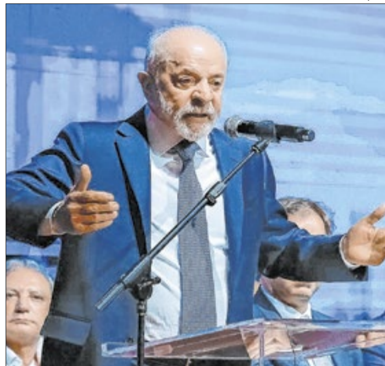
Lula abriu sete pontos sobre Flávio no 2º turno, segundo a Atlas

No limite, a situação é ótima para partidos que não são de centro, de esquerda ou de direita. Os problemas de Flávio e busca de alianças por parte de Lula aumentam o cacife de quem pode ir para um lado ou para o outro. Ou ficar onde está — e integrar o futuro governo, qualquer que seja o presidente.