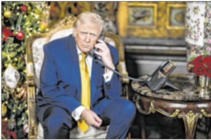
Trump mantém ameaças em meio a negociações