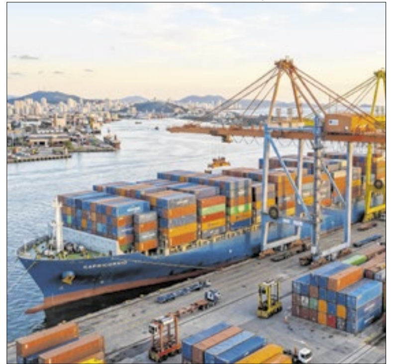
China, EUA e Argentina lideram relações comerciais com Brasil

A atividade econômica brasileira caiu 0,7% em março, segundo o IBC-Br divulgado pelo Banco Central. O recuo ocorreu no primeiro mês da guerra no Irã e atingiu todos os setores avaliados, como indústria, serviços, agropecuária e arrecadação de impostos. Apesar da queda mensal, o índice acumulou a alta de 1,8% em 12 meses.