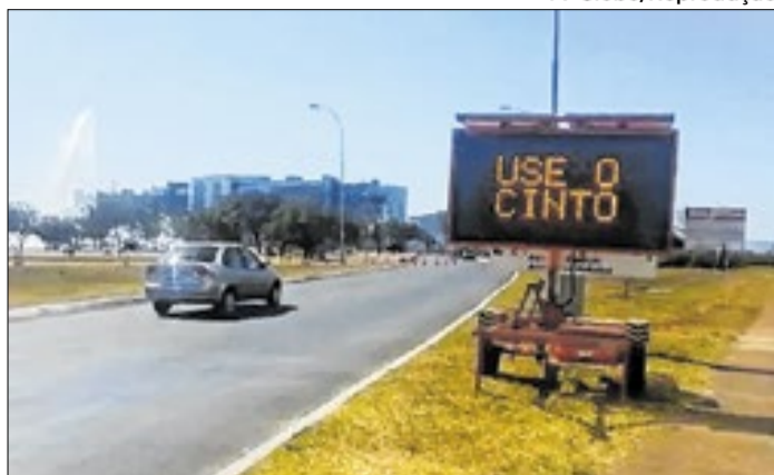
Painéis (como o da foto) são semelhantes aos que o Detran-DF pretendia licitar