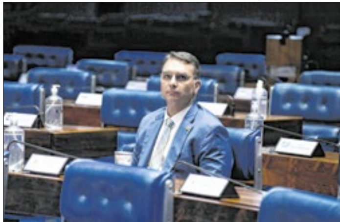
Senador viu pontos migrarem para adversários