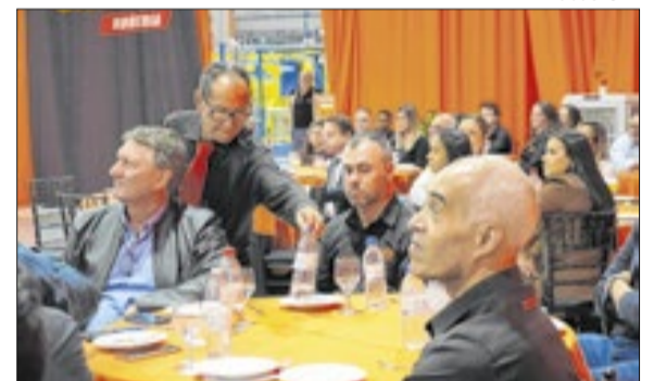
Muitos clientes marcaram presença na festa de inauguração da empresa