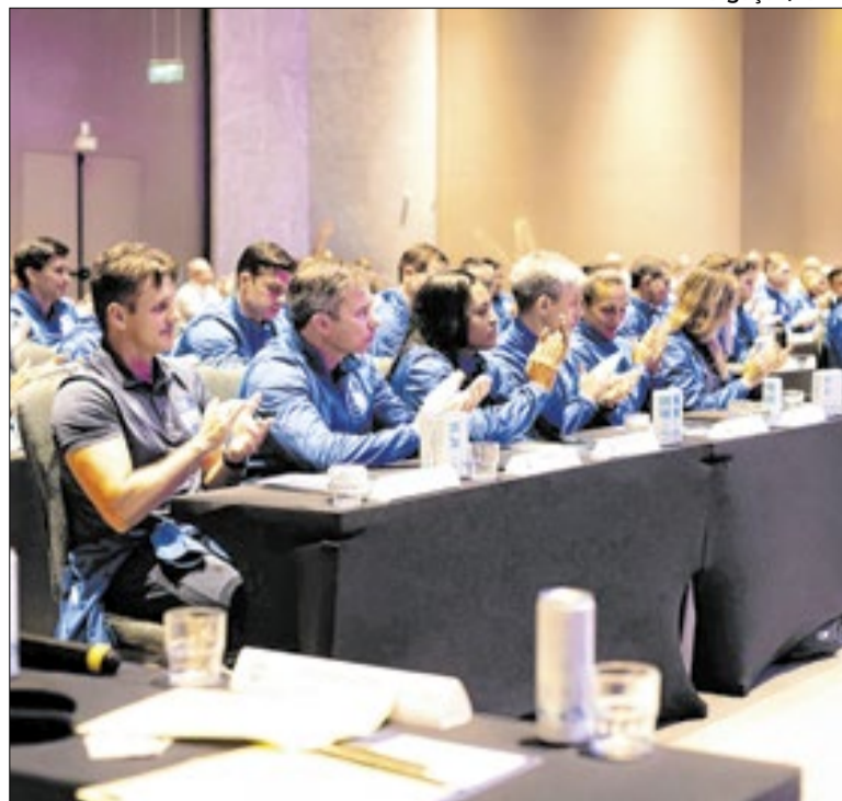
Instrutores da FIFA acompanharão as atividades do curso