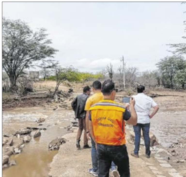
Com a medida, municípios estão aptos a solicitar recursos

Militares do Batalhão Rotam apreenderam armas artesanais, munições de arma de fogo no município do Pilar, na Região de Maceió. As guarnições receberam informações por meio do Disque-Denúncia 181, indicando a existência de um estabelecimento que estava adulterando e comercializando armas de fogo.