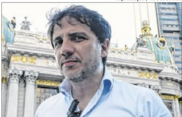
Santos herdou intenções de votos dos mais jovens