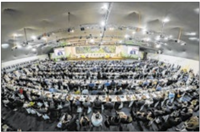
País avança para o 13º lugar ranking global da ICCA