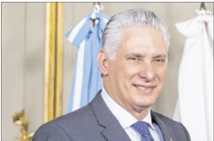
Miguel Díaz-Canel chamou sanção de “criminosa”