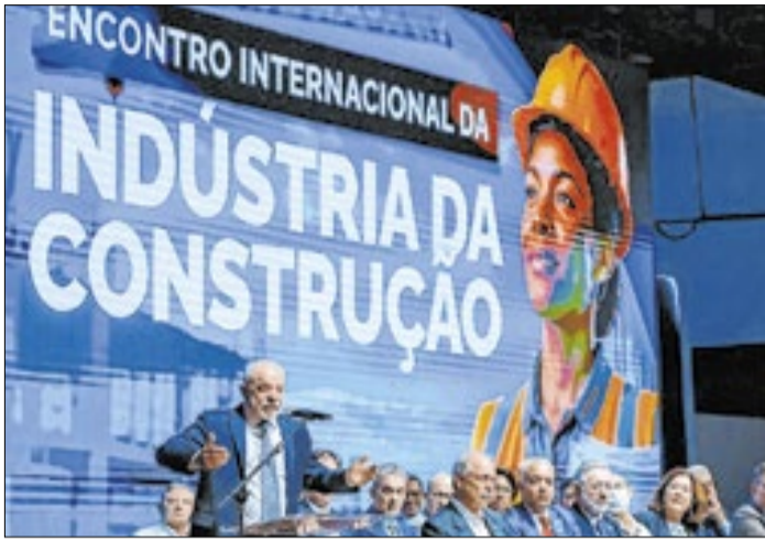
Presidente participou de evento da Indústria da Construção