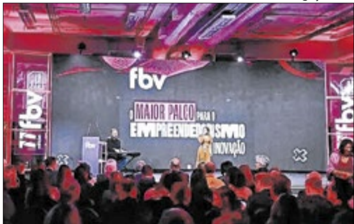
Em 2025, feira movimentou R$ 54 milhões em negócios.