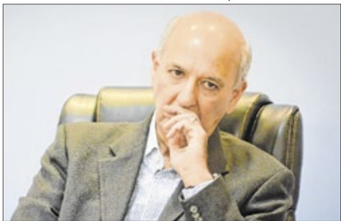
O ex-governador José Roberto Arruda