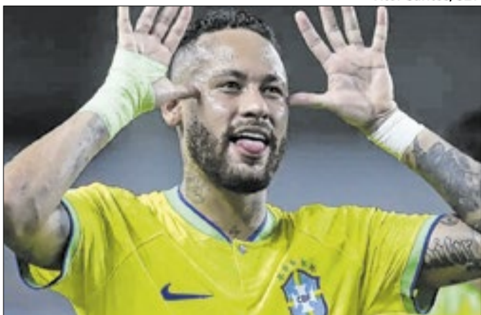
Retorno de Neymar Jr. tem papel de transição geracional