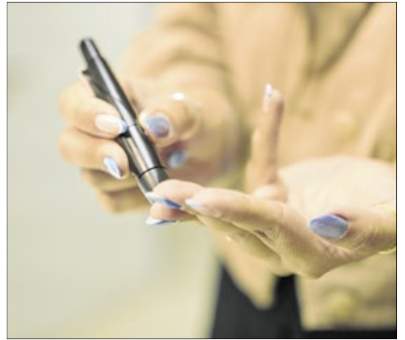
Análise indica que só metade dos diabéticos está cadastrada

Segundo a análise, 6% da população do DF está cadastrada como diabética, mas a estimativa pode chegar a 12%. Há ainda dificuldades na aplicação de protocolos clínicos, baixa oferta de consultas programadas e limitações nos sistemas de prontuário e regulação. O TCU recomendou ao Ministério da Saúde a inclusão de indicadores clínicos nos sistemas nacionais e determinou acompanhamento das ações da SES-DF para correção das falhas identificadas.