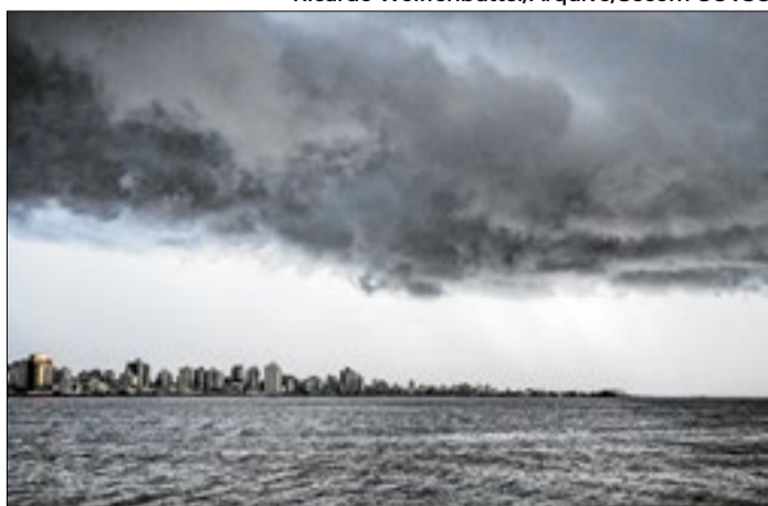
Massa de ar seco pode provocar ventos e temporais