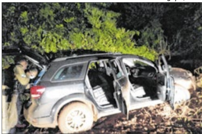
Veículos de turismo eram alvo de quadrilha nas rodovias