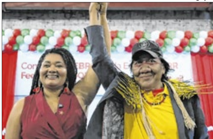
A convenção partidária ocorreu em Boa Vista