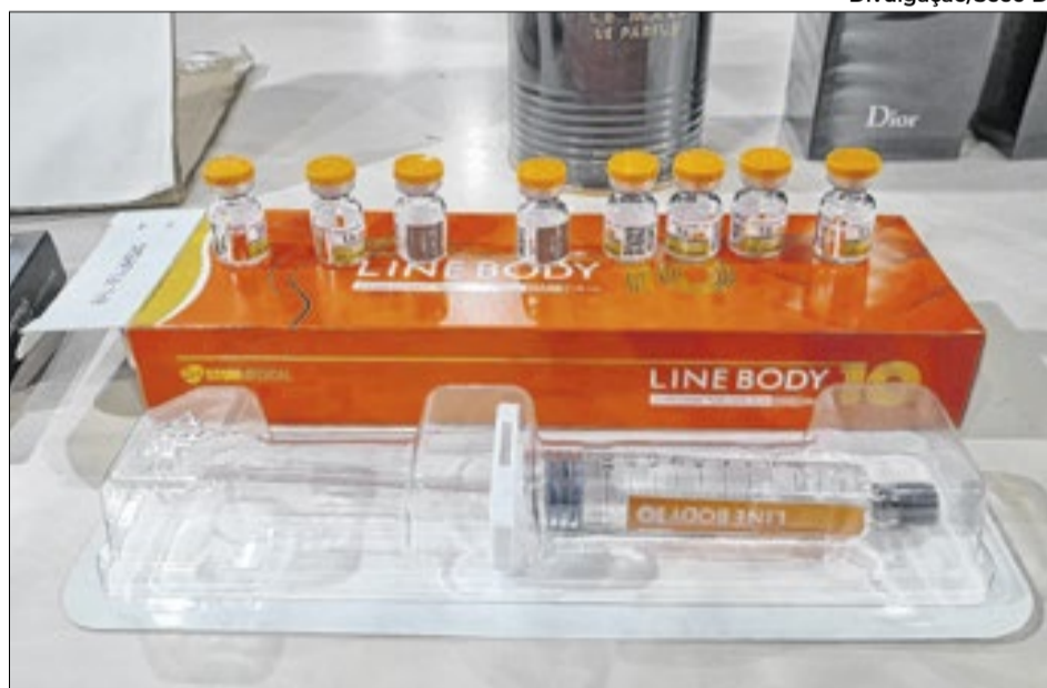
Carga com canetas emagrecedoras foi apreendida na BR-020

Entre os materiais retidos estavam perfumes, bebidas, lousas digitais touch LED, peças de vestuário, embalagens metálicas e