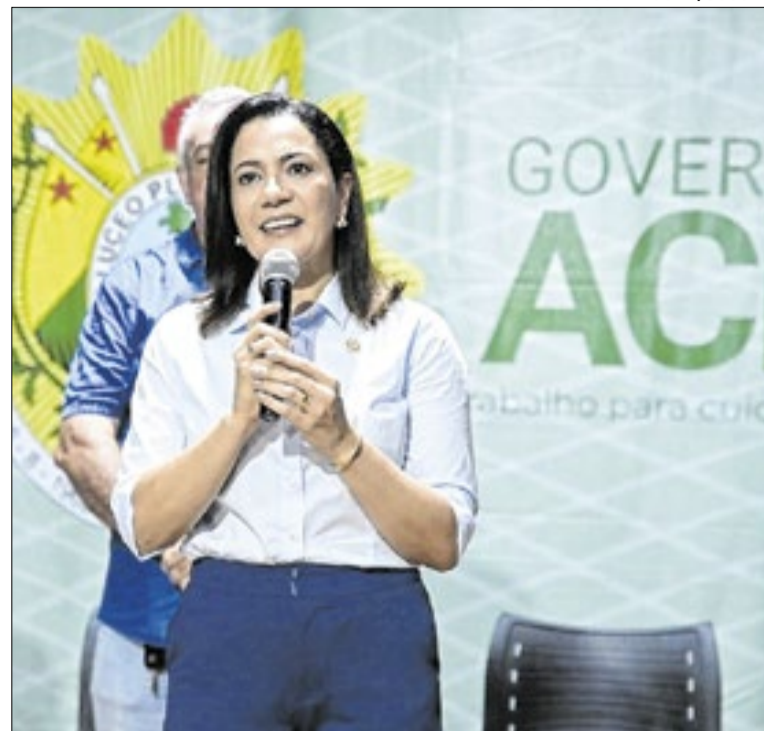
A proposta reconhece a importância dos servidores públicos

O governo do Acre, por meio da Direção-Geral da Polícia Civil do Estado (PCAC), realizou a entrega de mais de cem pistolas Glock destinadas aos oficiais investigadores da Delegacia Especializada de Atendimento à Mulher (Deam) e da Divisão Especializada de Investigação Criminal (Deic).