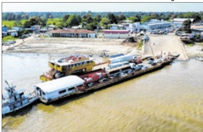
Suspensão dos prazos é divulgado