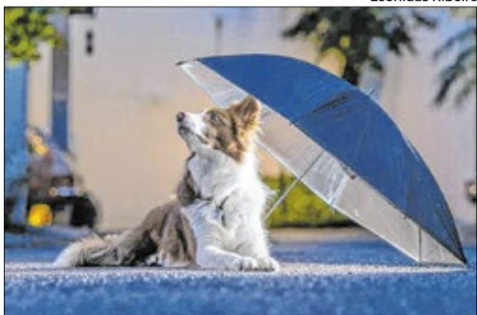
Fotografia Medalhista em 2024