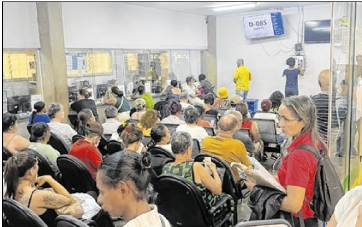
Usuários reclamam de longas filas na Farmácia de Alto Custo e demora nos atendimentos