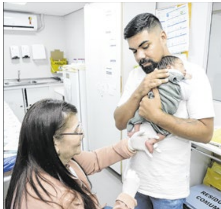
A cada ano são feitos aproximadamente 40 mil testes