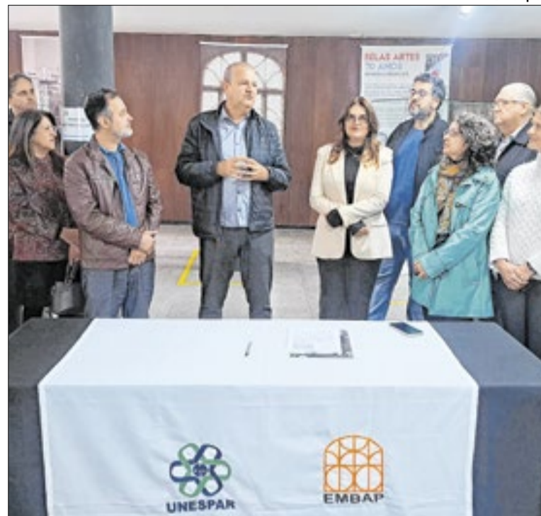
Os recursos utilizados são provenientes do Fundo Paraná

O governador do Paraná, Ratinho Junior (PSD), confirmou ontem (18), no Palácio do Iguazu, em Curitiba (PR), o envio de R$ 385,3 milhões para 11 municípios. Os recursos serão utilizados na construção de creches, espaços de lazer, pavimentação de vias e também na aquisição de terrenos destinados a novas moradias.