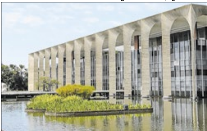
Itamaraty emitiu nota conjunta repudiando ataques