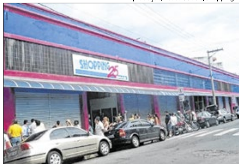
Shoppings 25 Brás e Stunt deverão permanecer fechados

De acordo com o órgão federal, os lojistas que apresentarem documentação fiscal regular te-