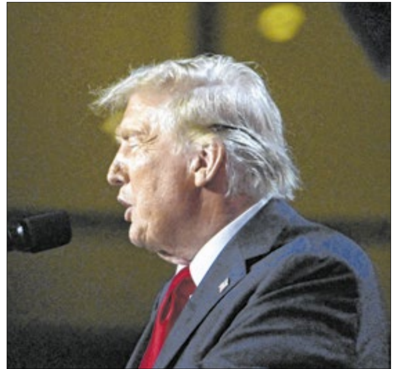
Falas de Donald Trump ligaram alerta nos diplomatas do Irã