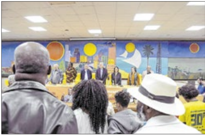
Evento foi organizado pelo Congresso Afro-Brasileiro