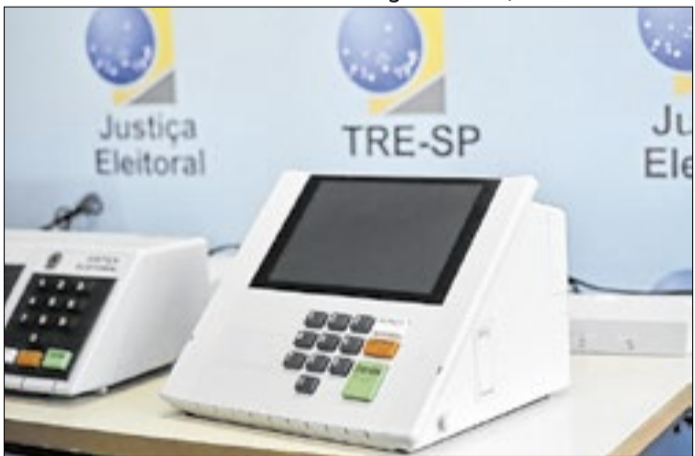
Equipamento foi usado pela primeira vez em 1996