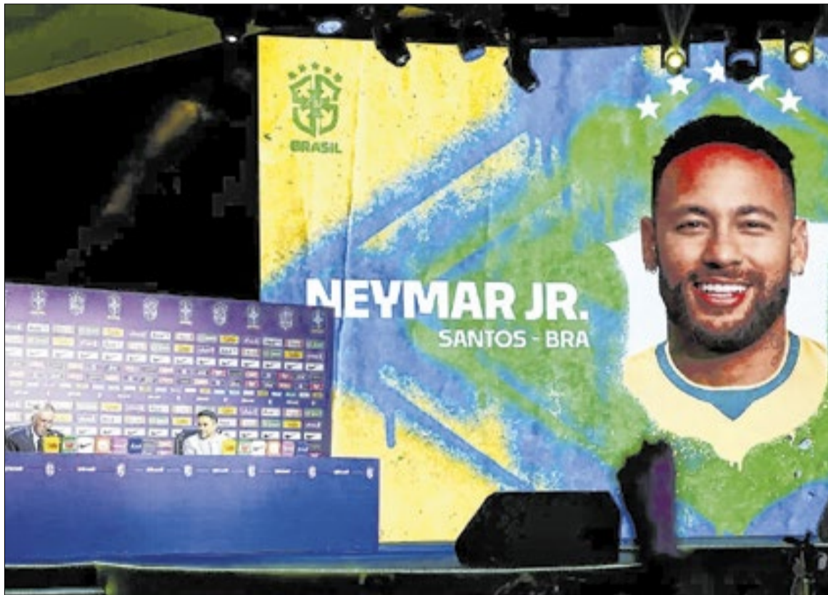
Todos os olhos se voltaram para Neymar na convocação para a Copa do Mundo 2026

Se o ataque é promissor, o meio de campo também inspira confiança. Danilo está com um futebol brilhante no Botafogo; Bruno Guimarães e Casemiro são donos do meio de campo no Newcastle e Manchester United, respectivamente. Fabinho, do Al-Ittihad, e Lucas Paquetá, do Flamengo, servem como boas opções para o segundo tempo.