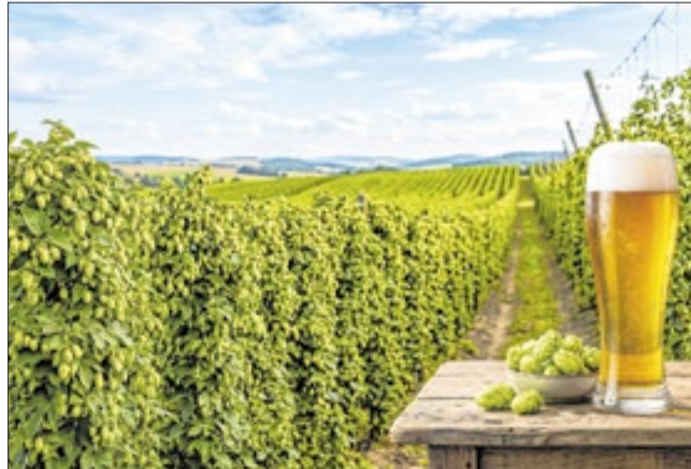
Objetivo é reduzir a dependência brasileira das importações

Uma das apostas da iniciativa é o uso de suplementação luminosa para compensar as diferenças de fotoperíodo em relação aos