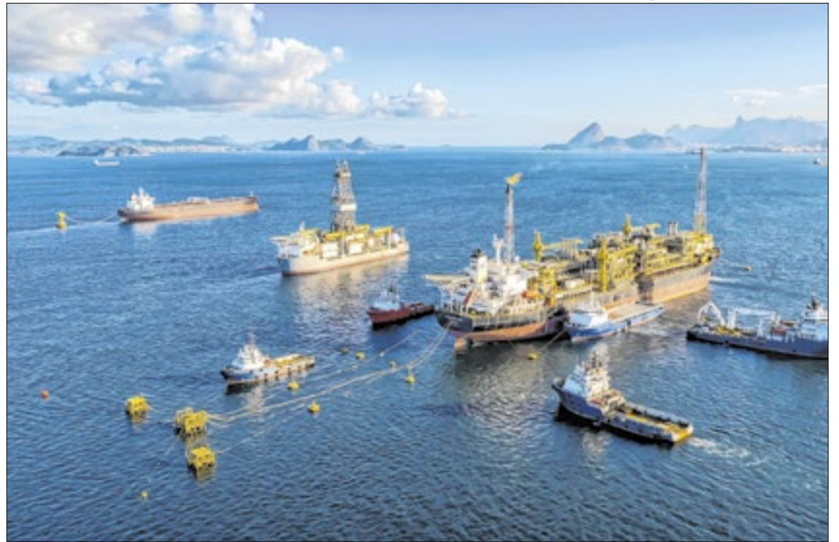
Cidades fluminenses são as que mais sofrem os impactos da exploração de Petróleo

Nos municípios, Maricá (RJ) liderou os repasses nacionais, com R$ 397,8 milhões. Niterói (RJ) recebeu R$ 336,2 milhões e o município do Rio de Janeiro ficou com R$ 62,3 milhões. Outras cidades fluminenses também receberam parcelas da arrecadação foram Campos dos Goytacazes (R$ 8,5 milhões), Cabo Frio (R$ 4 milhões), Rio das Ostras (R$ 3,9 milhões), Paraty (R$ 2,7 milhões), Macaé (R$ 2 milhões), Armação dos Búzios (R$ 975 mil), Casimiro de Abreu (R$ 871 mil), Arraial do Cabo (R$ 445 mil), Quissamã