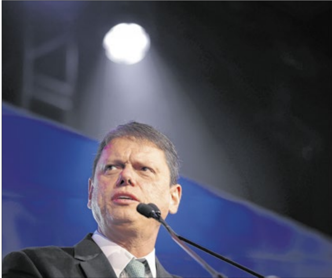
Declaração do governante foi feita durante a abertura da 40ª edição da APAS Show

que há consenso sobre a importância de melhores condições de trabalho, mas alertou que mudanças mal planejadas podem ter efeitos contrários aos desejados. Segundo ele, parte dos trabalhadores pode buscar atividades informais para complementar a renda, caso haja perda de poder de compra.