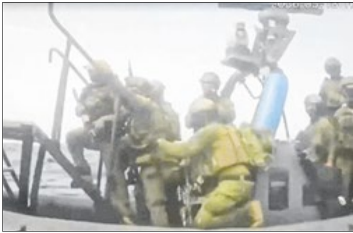
Três brasileiras foram presas no ataque israelense