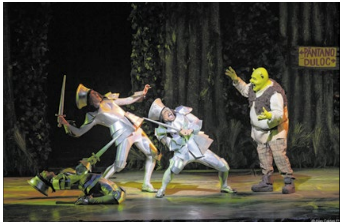
'Shrek - O Musical' é o mais recente sucesso em cartaz na capital paulista

Além dos grandes museus e centros culturais de São Paulo, a cidade também possui uma extensa rede de equipamentos públicos voltados à cultura de bairro, como bibliotecas, casas de cultura, teatros municipais e centros culturais espalhados pelas periferias. Eventos gratuitos, festivais independentes, saraus, batalhas de rima e manifestações artísticas de rua ajudam a compor parte da produção cultural paulistana fora dos circuitos tradicionais e têm ampliado a visibilidade de artistas locais nos últimos anos, na capital paulista.