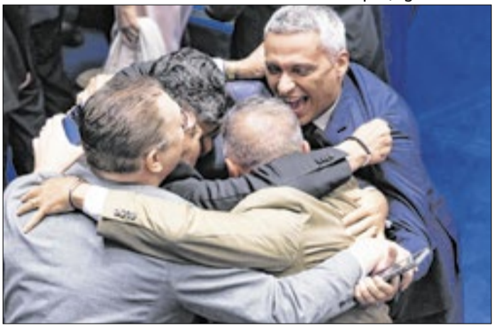
Alguma coisa mudou no cenário da derrota?