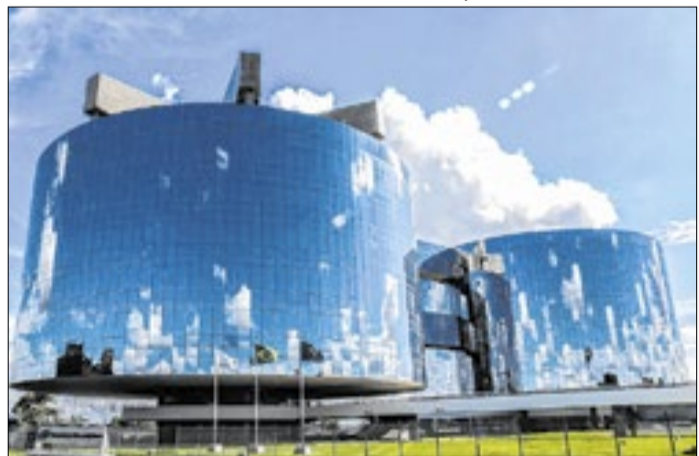
Sede do Ministério Público da União, em Brasília