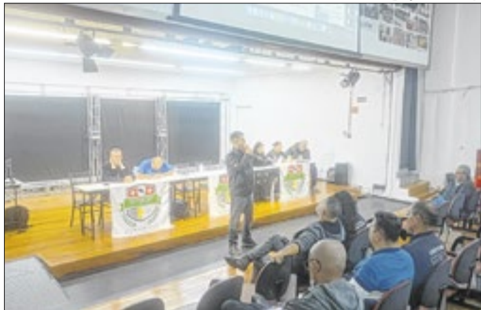
Assembleia Extraordinária foi realizada em 16 de maio