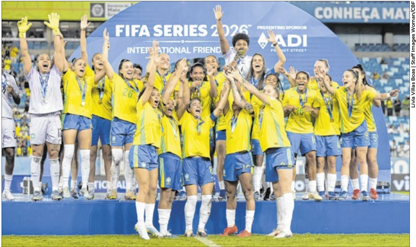
Comissão da CBF valorizou ciclo de preparação para a Copa do Mundo Feminina, que será disputada no Brasil em 2027

Gambaré concordou e afirmou que há muito trabalho sen-