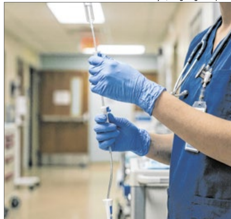
Mudanças podem impactar 3 milhões de profissionais no país

Pela proposta, o reajuste anual do piso do magistério passa a levar em conta o Índice Nacional de Preços ao Consumidor (INPC) e a variação das receitas do Fundeb. Caso a Medida Provisória 1334/2026 não for aprovada pela Câmara e pelo Senado dentro do prazo, o texto perde a validade.