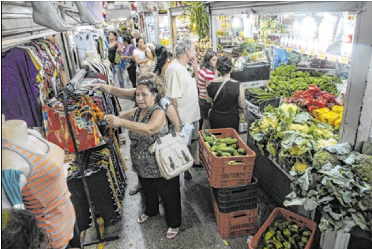
Classes D e E compreendem rendimentos de até R$ 1.177 por mês, aponta índice do IPC Maps

De acordo com o levantamento, a classe B foi a maior afetada pelo aumento do custo de vida e pela inflação. Já a C, foi a que mais ascendeu, passando a ser o maior mercado consumidor da cidade. Ainda de acordo com o estudo, o avanço é resultado do aumento do emprego CLT, que impacta mais significativamente as classes D e E. A pesquisa aponta ainda que, apesar da ascensão das classes mais baixas, a classe média segue