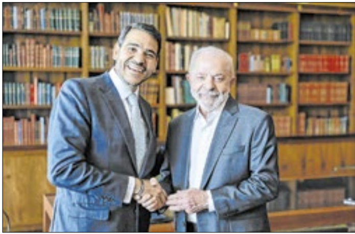
Se dependesse do desejo de Lula, ele repetiria Messias