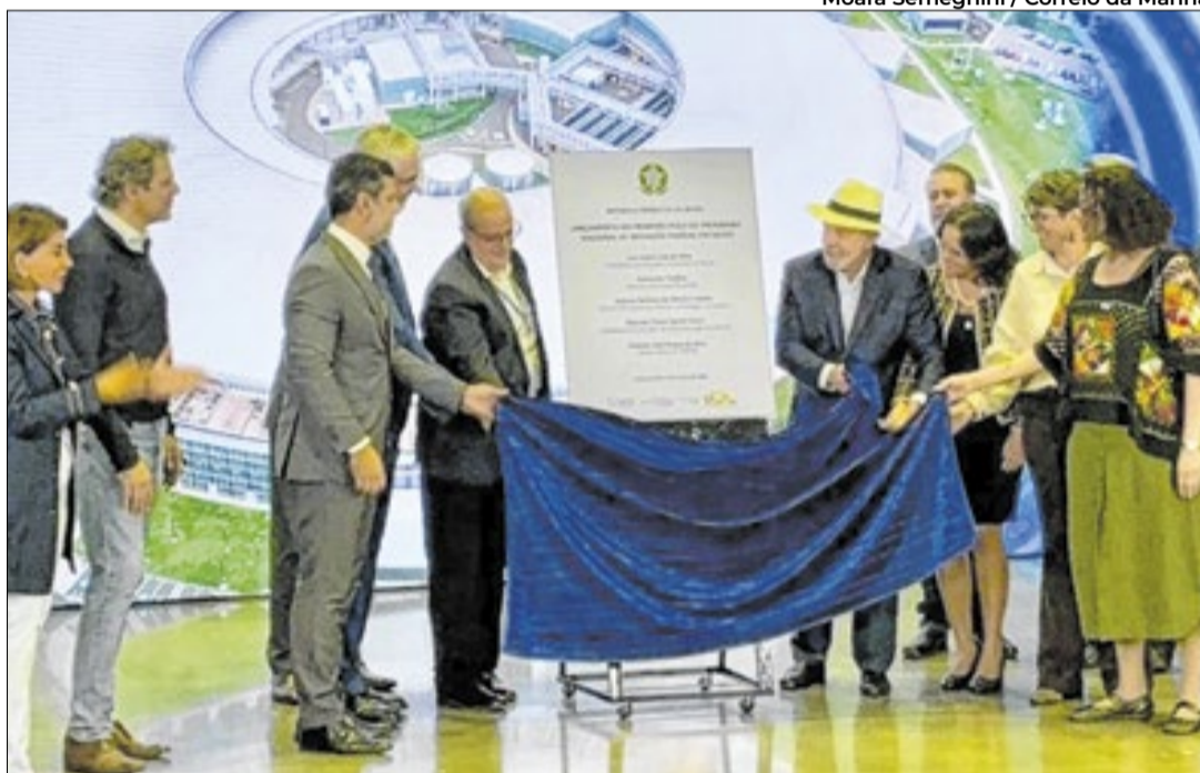
Moara Semeghini / Correio da Manhã