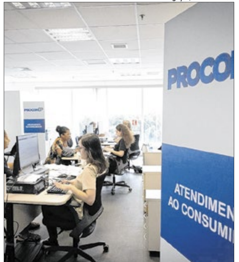
A fundação criou o NTS para dar suporte à quitação de dívidas

21,1%. Entre as principais causas do superendividamento aparecem o descontrole financeiro, apontado em 40,8% das situações, o desemprego, com 18,1%, e a redução de renda, responsável por 16,7% dos registros. O Programa de Apoio ao Superendividado (PAS), desenvolvido pelo NTS, atua na mediação entre consumidores e credores com foco na preservação do chamado mínimo existencial. O atendimento é destinado a pessoas físicas, microempreendedores individuais e empresários individuais que enfrentam dificuldades para manter pagamentos sem comprometer despesas básicas. Além da capital paulista, o programa também funciona em 23 Procons municipais do interior e do litoral do Estado, além de contar com apoio do Centro Judiciário de Solução de Conflitos e Cidadania do Tribunal de Justiça de São Paulo. O núcleo ainda promove ações de educação financeira.