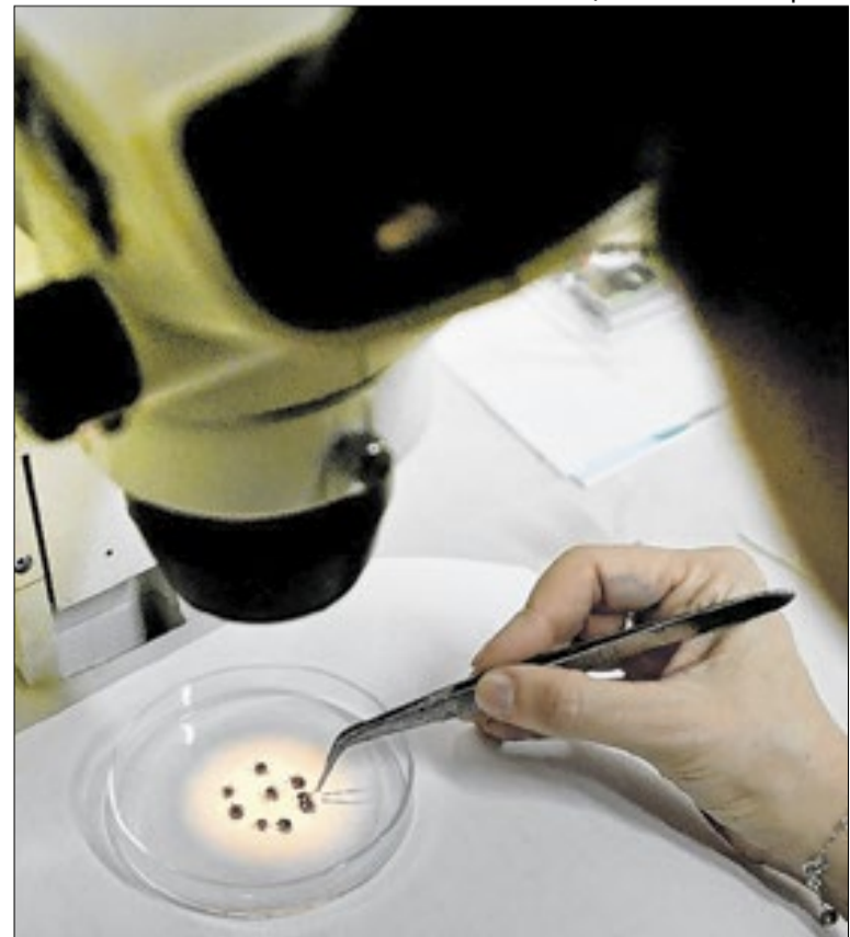
Doença é transmitida por bactéria presente no carrapato-estrela

Ao buscar atendimento, se possível, o paciente deve levar o carrapato que o picou para auxiliar na atuação da equipe de saúde. Quem visita, trabalha ou mora em área de risco (matas, rios, parques com áreas verdes) deve ter mais cuidado.